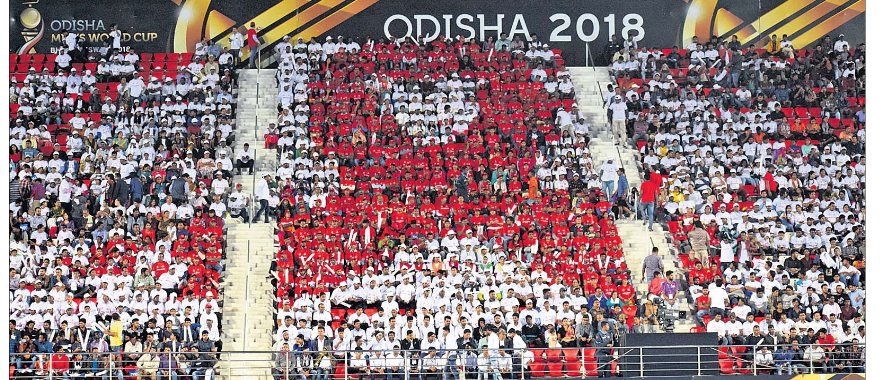
ଦିଏ ଏବେ ଦିବସ ଉପଲକ୍ଷେ କଳିଙ୍ଗ ଷ୍ଟାଡିୟମରେ ପ୍ରଶଂସକଙ୍କ ଦ୍ଵାରା ସୃଷ୍ଟି କରାଯାଇଥିବା ସ୍ମାମାନ ରେଡ୍ ରିବର୍ ପ୍ରତିଷ୍ଠିତ।