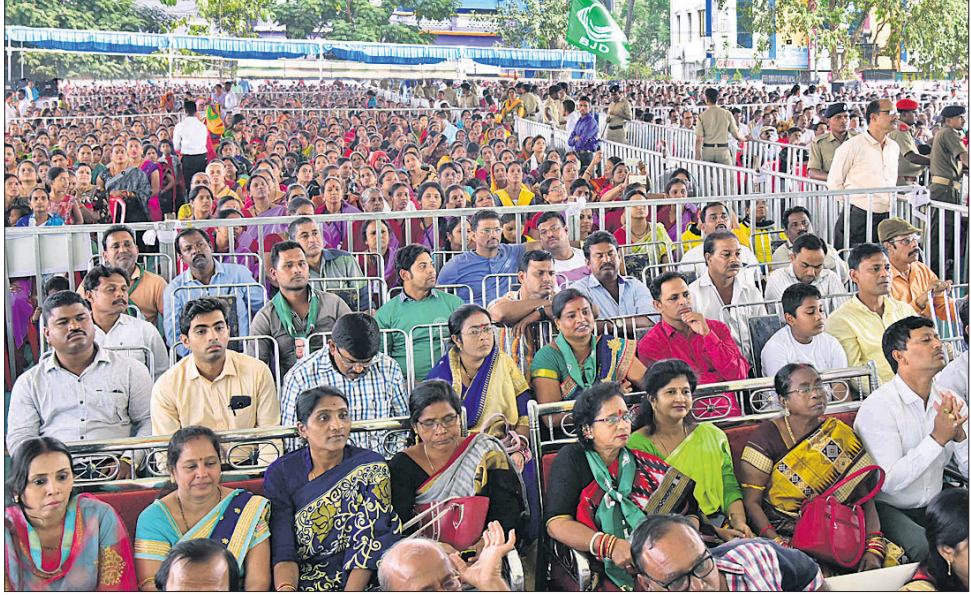
ଖଲିକୋଟ ବିଶ୍ୱବିଦ୍ୟାଳୟ ସ୍ଥଳରେ ଉପସ୍ଥିତ ବର୍ଗ ।

ନୂଆ କୋଠା, ମହିଳା ଥାନା ନବନିର୍ମିତ ବିଲଡିଂ ଓ ପର୍ଯ୍ୟଟନ ବିଭାଗର ଜିଲା କାର୍ଯ୍ୟାଳୟ ପୁରୀରୁ ଗୋଟିଏ ସ୍ଥାନରେ ଉଦ୍‌ଘୋଷଣା କରାଯାଇଛି ।