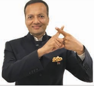
Naveen Jindal Industrialist