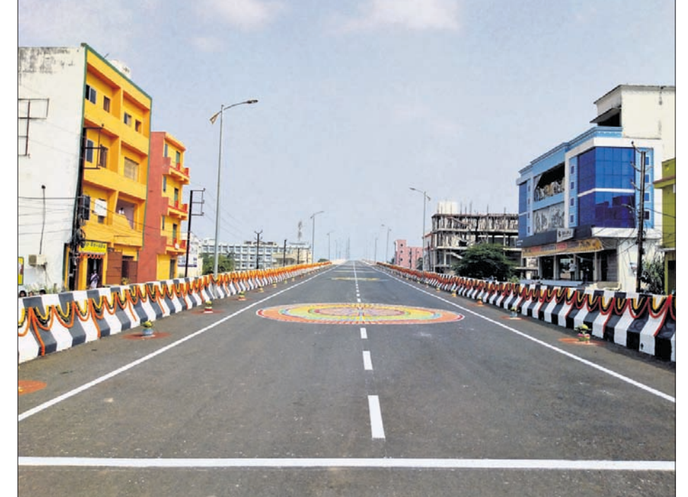
ଗୋପାଳପୁର ଜଳସମ ରେଲୱେ ଓଭର ବ୍ରିଜ୍ ।