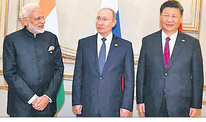
ପ୍ରଧାନମନ୍ତ୍ରୀ ନରେନ୍ଦ୍ର ମୋଦିଙ୍କ ସହ ଭାଟିନିର ପୁଟିନ୍ ଓ ଡି ଜିନପିଙ୍ଗ

ସହଯୋଗ ସଂଗଠନ (ସିଏସ୓) ଏବଂ ପୂର୍ବ ଏସିଆ ସମିତି (ଇଏଏସି) ବ୍ୟବସ୍ଥା