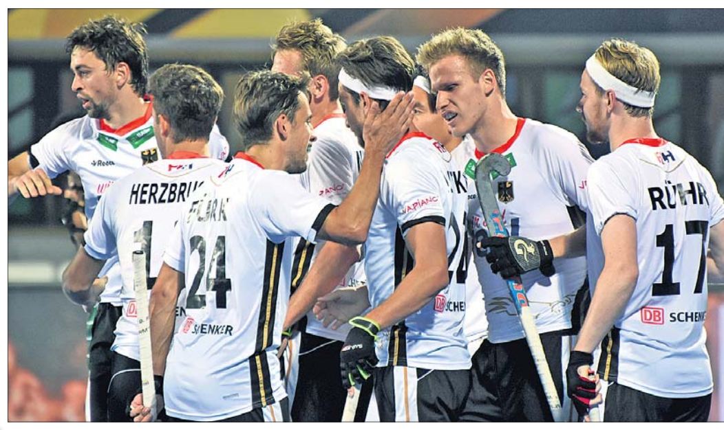
ଗୋଲସ୍କୋର ପରେ ଜର୍ମାନୀ ଖେଳାଳି ଖୁସି ମନାଉଛନ୍ତି।

ମଧ୍ୟରେ ପୁଲ୍‌ବିଲା ହେବ। ଜର୍ମାନୀ-ପାକିସ୍ତାନ ମ୍ୟାଚ ଆରମ୍ଭରୁ ରୋମାଞ୍ଚକ ରହିଥିଲା। ଉଭୟ ଦଳ ସତର୍କତା ଅବଲମ୍ବନ କରୁଥିବା ଥିଲା। ଅଧିକ ସେନାଲ୍ଲି ହକି ବିଶ୍ଵକପର ଶନିବାର ଅନୁଷ୍ଠିତ ନେଦରଲାଣ୍ଡ-ମାଲେସିଆ ପ୍ରଥମ ମ୍ୟାଚ ସମୟରେ ନର୍ଥ ଓ ସାଇଡ୍ ସ୍କୋର ଅନେକ ସ୍ତ୍ରୀଙ୍କୁ ରହିଥିଲା। ମାତ୍ର ପାକିସ୍ତାନ-ଜର୍ମାନୀ ମ୍ୟାଚ ବେଳକୁ