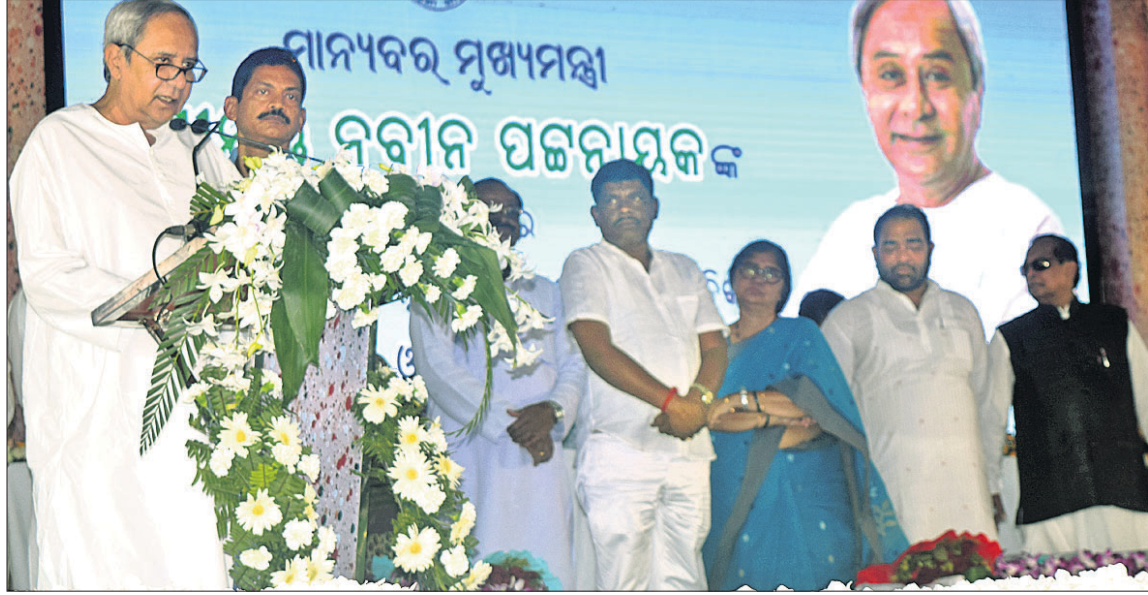
ବ୍ରହ୍ମପୁର ସମାବେଶରେ ମୁଖ୍ୟମନ୍ତ୍ରୀଙ୍କ ଉଦ୍‌ଘୋଷଣା ଓ ଅନ୍ୟ ମନ୍ତ୍ରୀ, ବିଧାୟକ, ଏମପି ଉପସ୍ଥିତ ।