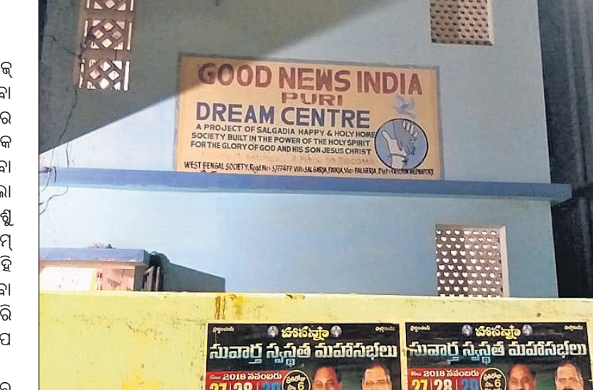
ପୁରୀ ପେଶକଟା ଅଞ୍ଚଳରେ ଥିବା ଗୁଡ଼ ଟ୍ୟୁବ୍ ଇଣ୍ଡିଆ ଟ୍ରିମ୍ ସେଣ୍ଟର ଶାଖା ।

ଡେକାନାଲ ଜିଲା ବେଲଟିକିରି ସ୍ଥିତ ଗୁଡ଼ ଟ୍ୟୁବ୍ ଇଣ୍ଡିଆ ଟ୍ରିମ୍ ସେଣ୍ଟର (ଶିଶୁ ଗୃହ)ରେ ରହୁଥିବା ନାବାଳିକାଙ୍କୁ ଯୌନଶୋଷଣ ଘଟଣା ରାଜ୍ୟରେ ଆଲୋଚନା ପୃଷ୍ଠା କରିଛି ।