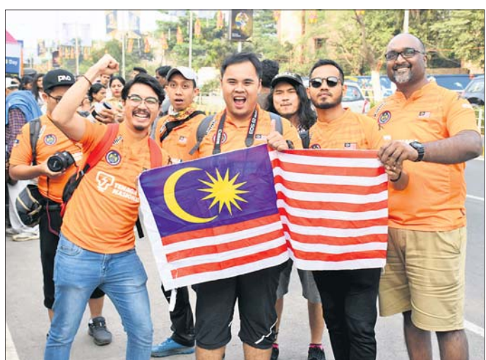
ଷ୍ଟାଡିୟମ ବାହାରେ କିଛି ବିଦେଶୀ ପ୍ରଶଂସକ।

ଷ୍ଟାଡିୟମ ଭରପୂର ହୋଇ ଯାଇଥିଲା। ଓଡ଼ିଶା ଦର୍ଶକମାନେ ପାକିସ୍ତାନ ଦଳକୁ ସମର୍ଥନ କରି କୋହାହକ କରୁଥିବା ପରିଲକ୍ଷିତ ହୋଇଥିଲା। ଜର୍ମାନୀ ଗୋଲ ଦେବାପରେ ମଧ୍ୟ ଦର୍ଶକମାନେ ଏହି ଦଳର ଖେଳାଳିଙ୍କୁ ବେଶ୍ ଉତ୍ସାହରେ କରୁଥିଲେ।