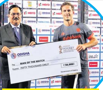
କେନ୍ଦ୍ରୀୟ ହକିବର୍ଗର (ଡାହାଣ) ମ୍ୟାଚ ଅର୍ଦ୍ଧ ମ୍ୟାଚ ପୁରସ୍କାର ଗ୍ରହଣ କରୁଛନ୍ତି।

ହୋଇଥିବା ମ୍ୟାଚର ହିରୋ ସାଜିଥିଲେ ନେଦରଲାଣ୍ଡର କେନ୍ଦ୍ରୀୟ ହକିବର୍ଗର। ସେ ତୃନିତୀୟ ପ୍ରଥମ ହ୍ୟାଟ୍ରିକ୍ ଅର୍ଜନ କରିବା ସହ ମ୍ୟାଚ ଅର୍ଦ୍ଧ ମ୍ୟାଚ ବିବେଚିତ ହୋଇଥିଲେ। ହକିବର୍ଗରଙ୍କ ଫିଟ୍ ମ୍ୟାଚରେ ଚିଲି ଗୋଲରେ ପରାସ୍ତ ହୋଇଥିଲା। ପ୍ରଥମ ମ୍ୟାଚରେ ଚିଲି ୧-୦ ଗୋଲରେ ପରାସ୍ତ ହୋଇଥିଲା। ଦ୍ଵିତୀୟ ମ୍ୟାଚରେ ଚିଲି ୧-୦ ଗୋଲରେ ପରାସ୍ତ ହୋଇଥିଲା। ହକିବର୍ଗରଙ୍କ ଫିଟ୍ ମ୍ୟାଚରେ ଚିଲି ଗୋଲରେ ପରାସ୍ତ ହୋଇଥିଲା।