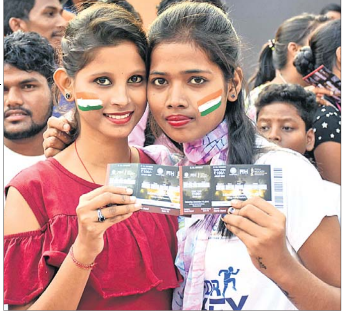
ଭୁଲ ପ୍ରଶଂସିକା ଚିକେଟ ପ୍ରଦର୍ଶନ କରୁଛନ୍ତି।