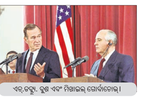
ଏଚ୍.ଡବ୍ଲ୍ୟୁ. ବୁଶ୍ ଏବଂ ମିଖାଲ୍ ଗୋର୍ବାଚୋଭ୍

ମହେ: ଆମେରିକାର ପୂର୍ବତନ ରାଷ୍ଟ୍ରପତି ଜର୍ଜ୍‌ଏଚ୍.ଡବ୍ଲ୍ୟୁ. ବୁଶ୍ ଶୀତଳ ମୁଦର