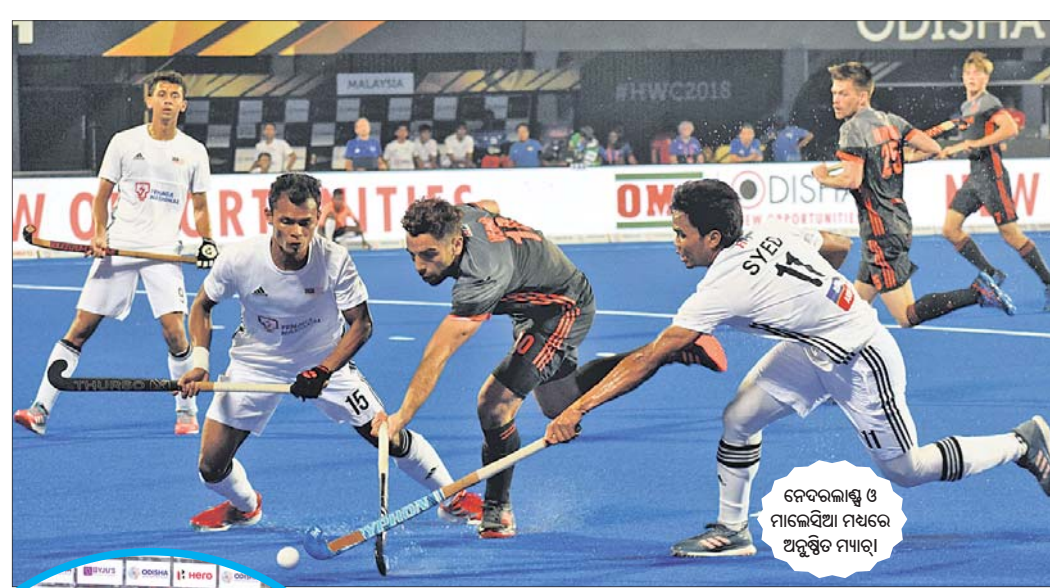
ନେଦରଲାଣ୍ଡ ଓ ଚିଲି ମଧ୍ୟରେ ଅନୁଷ୍ଠିତ ମ୍ୟାଚ

ଭୁବନେଶ୍ଵର, ୧୧୨ (କ୍ରୀଡ଼ା ପ୍ରତିନିଧି): ଗତଥର ରବିବାର ନେଦରଲାଣ୍ଡ ଏଥର ଗୋଲ ବର୍ଷା ସହ ଏହାର ବିଶ୍ଵକପ ଅଭିଯାନ ଆରମ୍ଭ କରିଛି। କଳିଙ୍ଗ ଷ୍ଟାଡିୟମରେ ଶନିବାର ଅନୁଷ୍ଠିତ ହକି ମ୍ୟାଚରେ ଚିଲି ଓ ଗୋଲରେ ପରାସ୍ତ ହୋଇଛି। ଦ୍ଵିତୀୟ ମ୍ୟାଚରେ ଚିଲି ୧-୦ ଗୋଲରେ ପରାସ୍ତ ହୋଇଛି। ସମସ୍ତ ସମାପ୍ତ ହୋଇଛି ଶେଷ