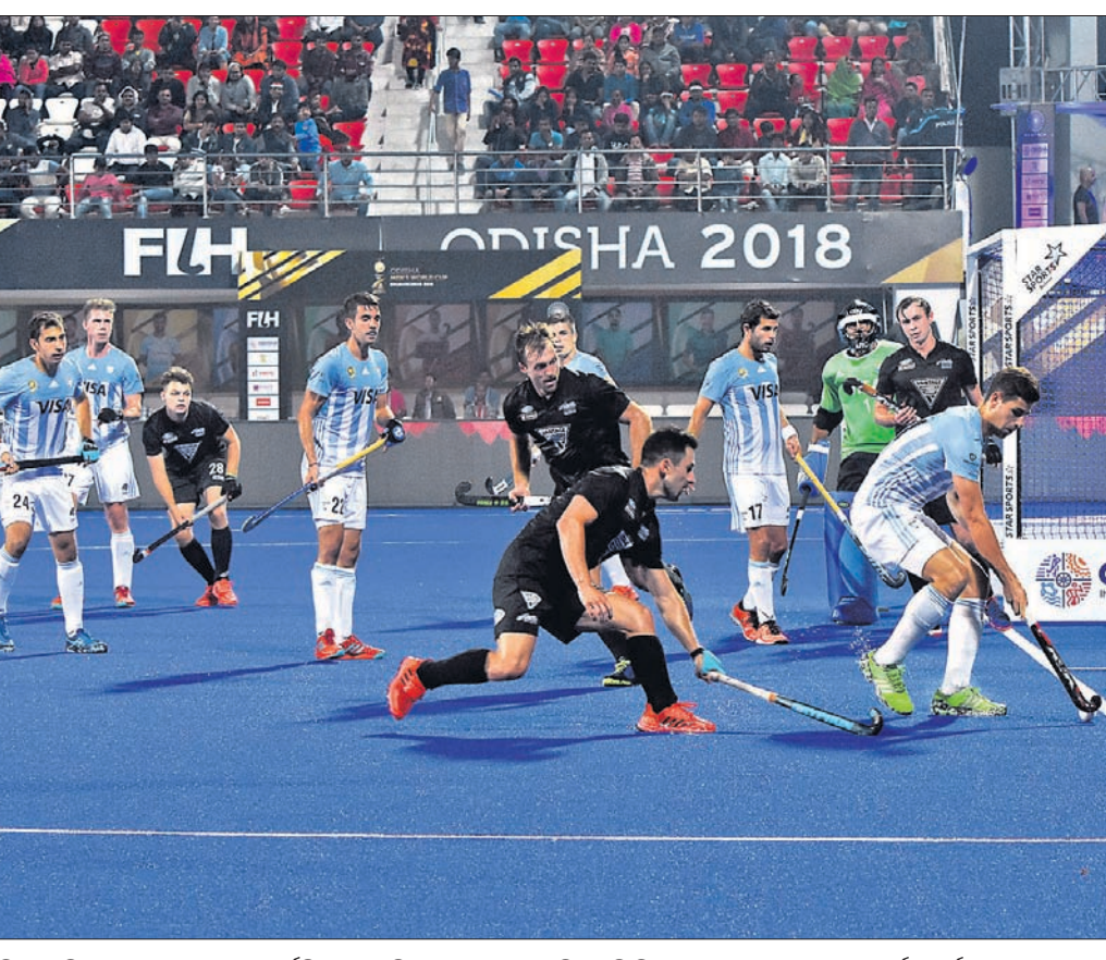
କଳିଙ୍ଗ ଷ୍ଟାଡ଼ିୟମରେ ଯୋଗଦାନ ଆର୍ଜେଣ୍ଟିନା ଓ ୟୁକ୍ରିଆଣ ପକ୍ଷରେ ଅନୁଷ୍ଠିତ ହକି ବିଶ୍ୱକପ ମ୍ୟାଚର ଏକ ଉତ୍ତମପୂର୍ଣ୍ଣ ପୂର୍ଣ୍ଣ।