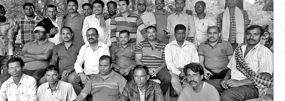
ବସ୍ତୁନିକଟ କାର୍ଯ୍ୟକ୍ରମରେ ଏକାଠି ହୋଇଥିବା ପୁରାତନ ଛାତ୍ରମାନେ ।

ଜଗନ୍ନାଥପ୍ରସାଦପୁର ପବିତ୍ରମୋହନ ଉଚ୍ଚବିଦ୍ୟାଳୟର ପୁରାତନ ଛାତ୍ରମାନଙ୍କ (୧୯୯୩ ବର୍ଷର ମାସ୍ଟ୍ରିକ୍ ବ୍ୟାଚ୍) ଏକ ବସ୍ତୁ ନିକଟ କାର୍ଯ୍ୟକ୍ରମ ପେଣ୍ଡାହାଲ ନିକଟ ଚମ୍ପାନିନଦୀ ନିକଟରେ ଆୟୋଜିତ ହୋଇଯାଇଛି । ଏହି ଅବସରରେ ଆୟୋଜିତ କାର୍ଯ୍ୟକ୍ରମରେ ରାଜ୍ୟର ବିଭିନ୍ନ ସ୍ଥାନରେ ରହୁଥିବା ପୁରାତନ ଛାତ୍ରମାନେ ଯୋଗଦେଇ ମତାମତ ରଖିଥିଲେ । ଦୀର୍ଘବର୍ଷର ବ୍ୟବଧାନ ପରେ ଏକାଠି ହୋଇ ନିଜ ନିଜ ମଧ୍ୟରେ ଭାବର ଆଦାନ ପ୍ରଦାନ କରି ହାଇସ୍କୁଲ ଛାତ୍ରଜୀବନର ସ୍ମୃତି ରୋମଛନ୍ଦ