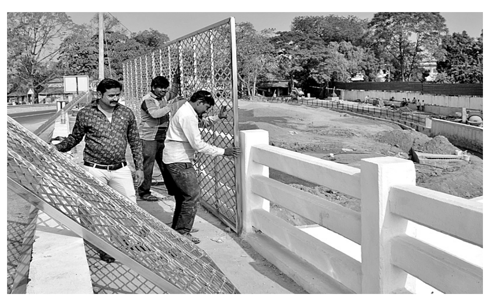
ସ୍ଥଳସାଧନ ପଥରେ ବାଟ: ସମ୍ବଲପୁର କଟକେଟି ଛକ ନିକଟସ୍ଥ ମହାନଦୀ ଦ୍ୱିତୀୟ ସେତୁ ନିର୍ମାଣ ପରେ ବାଲିକା ବାକଳମାନେ ଆତ୍ମହତ୍ୟା କରୁଛନ୍ତି, ତେଣୁ ଜିଲ୍ଲା ପ୍ରଶାସନ ପକ୍ଷରୁ ଏଠାରେ ସୋମବାର ଗ୍ରୀଲ୍ କରାଯାଇଛି (ବାମ) । ବିଶ୍ୱ ଭିନ୍ନକ୍ଷମ ଦିବସରେ ସମ୍ବଲପୁର ତପସ୍ୱିନୀ ପ୍ରେକ୍ଷାଳୟରେ ଛାତ୍ରମାନେ ସର୍ବଧର୍ମ ସମନ୍ୱୟ ଶାସ୍ତ୍ର ନାଟକ ମଞ୍ଚସ୍ଥ ପରିବେଷଣ କରୁଛନ୍ତି (ମଝି) । ବିଶ୍ୱ ଭିନ୍ନକ୍ଷମ ଦିବସରେ ତପସ୍ୱିନୀ ପ୍ରେକ୍ଷାଳୟରେ ଆୟୋଜିତ କାର୍ଯ୍ୟକ୍ରମରେ ଡିନିଚକିଆ ସାଇକେଲ ପାଇଥିବା ବିଦ୍ୟାଳୟ ପିଲାମାନେ ମାଁ ବାପାଙ୍କ ସହିତ ।