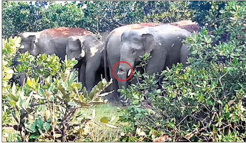
ଆହତ ଦନ୍ତାହାତୀର ଶରୀର ଶୁଖି (ବୃତ୍ତ ଚିହ୍ନିତ ଅଂଶ)।

ସୁନ୍ଦରଗଡ଼ ଜିଲ୍ଲା ବଡ଼ଗାଁ ଓ ରାଜଗାଙ୍ଗପୁର ଫରେଷ୍ଟ ରେଞ୍ଜ ଅଞ୍ଚଳରେ ଏକ ପ୍ରାୟ ବୟସ୍କ ଦନ୍ତାହାତୀ ଆହତ ଅବସ୍ଥାରେ ଘୂରି ବୁଲୁଛି। ହାତୀର ଶୁଖିଲା ଯକ ଯୋଗୁଁ ସେହିଭାଗ ପରିଯାଇଥିବାରୁ ଶୁଖିଲା ଖାଦ୍ୟ ଖାଦ୍ୟ ଆଖି ଧୋଇ ଦନ୍ତାହାତୀ ହାତୀ ପାଦରେ ମଧ୍ୟ ଯତ୍ନ ହୋଇଥିବା କେତେକଟା ପ୍ରତ୍ୟକ୍ଷଦର୍ଶୀ କହିଛନ୍ତି। ପାଦରେ ବିନ୍ଦୁ ବୋତଲ ପଶିଯାଇଥିବା ଲୋକେ କହୁଛନ୍ତି। ତେବେ ଶୁଖିଲା ଯକ ହୋଇଥିବା ଯତ୍ନ ଅଧ୍ୟୟନ ହେଉଥିବା କୁହାଯାଉଅଛି। ବଡ଼ଗାଁ ଓ ରାଜଗାଙ୍ଗପୁର ଫରେଷ୍ଟ ରେଞ୍ଜର ଅଧିକାରୀ ଶିକ୍ଷକମାନଙ୍କ ସହ କିଛି ସମ୍ବନ୍ଧିତ ଶିକ୍ଷାଧିକାରୀ ସହ ସମୀକ୍ଷା କରିବା ପାଇଁ ନୂଆପଡ଼ା ସରକାରଙ୍କୁ କାର୍ଯ୍ୟକ୍ରମ ନିର୍ଦ୍ଧାରଣ କରିଛନ୍ତି।