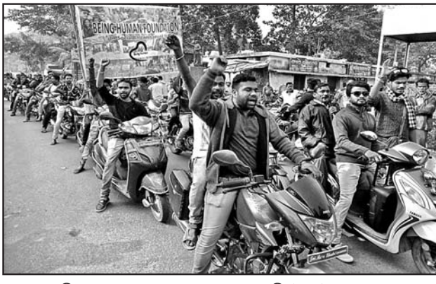
ବଲାଙ୍ଗୀର ବିଜୁ ଟ୍ୟୁମାନ୍ଦ ପାରଖେଶ୍ୱର ବାଇକ ରାଲି (ବାମ) । ପାଟଣାଗଡ଼ଠାରେ ପ୍ରତିବାଦ କରାଯାଉଛି (ମଝି) । ବଲାଙ୍ଗୀର ବଣିକ ସଂଘ ସଦସ୍ୟ ଶୋଭାଯାତ୍ରାରେ ଆହୁରିଛନ୍ତି ।