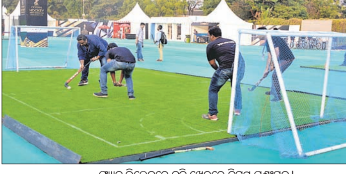
ଫ୍ୟାନ୍ ଭିଲେଜରେ ହକି ଖେଳରେ ନିମଗ୍ନ ପ୍ରଶଂସକ।