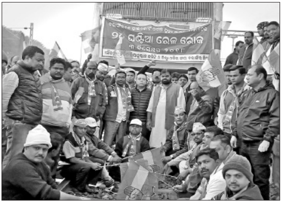
ସୋମବାର ବଲାଙ୍ଗୀରରେ ୨୪ ଘଣ୍ଟିଆ ମହାବନ୍ଦ ଅବସରରେ ବଲାଙ୍ଗୀରଠାରେ ରେଳରୋକ୍ତା କରାଯାଇଛି (ବାମ) । କନ୍ଧାବାଞ୍ଚିଠାରେ ଧାରଣାରେ ସାମିଲ ହୋଇଥିବା ହେମାଳ ସଂଘର ଶତାଧିକ ସଭ୍ୟ (ମଝି) । ଖପ୍ରାଖୋଳଠାରେ ବୋଲାନ ବଜାର ବନ୍ଦ ରହିଛି ।