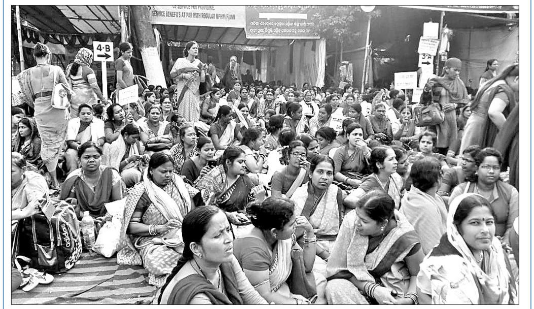
ଓଡ଼ିଶା ଏନ୍‌ଏସ୍‌ଏମ୍ (ଏଏଏସ୍‌ଏମ୍) ସଂଘ ତରଫରୁ ସ୍ଥାୟୀ ନିଯୁକ୍ତି, ସମାନ କାମକୁ ସମାନ ଦରମା ପ୍ରଭୃତି ବିଭିନ୍ନ ଦାବି ନେଇ ସମ୍ବଲପୁରରୁ ଆସିଥିବା କର୍ମକର୍ମୀ ସୋମବାର ଭୁବନେଶ୍ୱର ଲୋକସେବା ସମାଜରେ ଉପସ୍ଥାପନ କରାଯାଇଛି ।