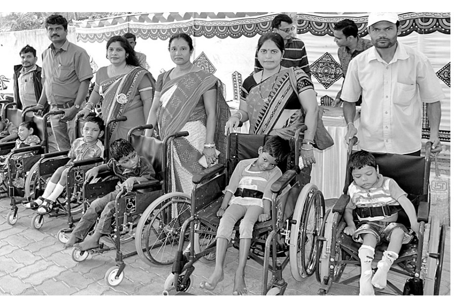
ସର୍ବଧର୍ମ ସମନ୍ୱୟ ଶାସ୍ତ୍ର ନାଟକ ମଞ୍ଚସ୍ଥ ପରିବେଷଣ କରୁଛନ୍ତି (ମଝି) । ବିଶ୍ୱ ଭିନ୍ନକ୍ଷମ ଦିବସରେ ତପସ୍ୱିନୀ ପ୍ରେକ୍ଷାଳୟରେ ଆୟୋଜିତ କାର୍ଯ୍ୟକ୍ରମରେ ଡିନିଚକିଆ ସାଇକେଲ ପାଇଥିବା ବିଦ୍ୟାଳୟ ପିଲାମାନେ ମାଁ ବାପାଙ୍କ ସହିତ ।