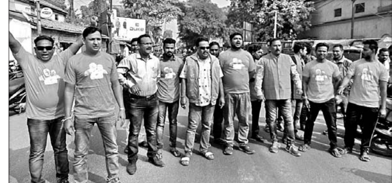
ବଲାଙ୍ଗୀର ବିଜୁ ଟ୍ୟୁମାନ୍ଦ ପାରଖେଶ୍ୱର ବାଇକ ରାଲି (ବାମ) । ପାଟଣାଗଡ଼ଠାରେ ପ୍ରତିବାଦ କରାଯାଉଛି (ମଝି) । ବଲାଙ୍ଗୀର ବଣିକ ସଂଘ ସଦସ୍ୟ ଶୋଭାଯାତ୍ରାରେ ଆହୁରିଛନ୍ତି ।