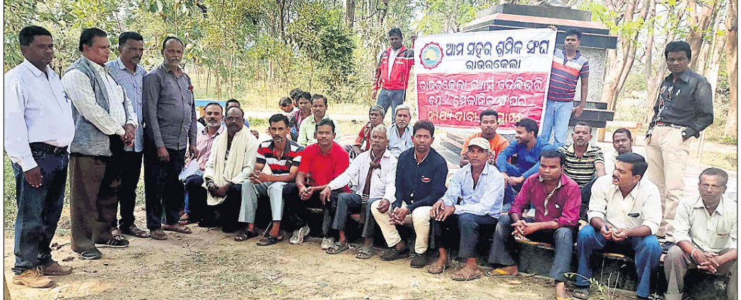
ଗ୍ୟାସ୍ ଏଜେଣ୍ଟ ଗ୍ୟାସ୍ ପସରୁ ଉଦ୍ଧାରରେ ସୁବାସ ପାଇଁ ଅନୁଷ୍ଠିତ ସେଣ୍ଟରରେ ଉପସ୍ଥିତ କର୍ମଚାରୀ ଓ କର୍ମଚାରୀ ।