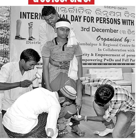
ସର୍ବଧର୍ମ ସମନ୍ୱୟ ଶାସ୍ତ୍ର ନାଟକ ମଞ୍ଚସ୍ଥ ପରିବେଷଣ କରୁଛନ୍ତି (ମଝି) । ବିଶ୍ୱ ଭିନ୍ନକ୍ଷମ ଦିବସରେ ତପସ୍ୱିନୀ ପ୍ରେକ୍ଷାଳୟରେ ଆୟୋଜିତ କାର୍ଯ୍ୟକ୍ରମରେ ଡିନିଚକିଆ ସାଇକେଲ ପାଇଥିବା ବିଦ୍ୟାଳୟ ପିଲାମାନେ ମାଁ ବାପାଙ୍କ ସହିତ ।