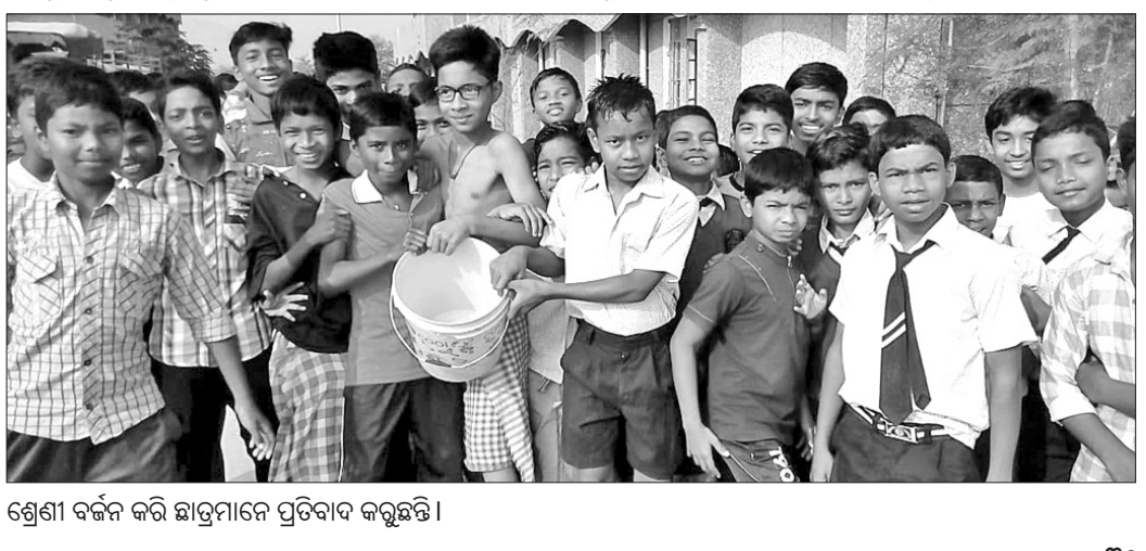
ଶ୍ରେଣୀ ବର୍ଦ୍ଧନ କରି ଛାତ୍ରମାନେ ପ୍ରତିବାଦ କରୁଛନ୍ତି ।

ପଦ୍ମପୁର, ୩।୧୨ (ଡି.ଏନ୍.ଏ.) ବରଗଡ଼ ଜିଲା ପଦ୍ମପୁର ଜୋନ୍‌ରୁ ସରକାରୀ ରସ୍ ଚଳାଉଛନ୍ତି ଶ୍ରମିକରଠାରୁ ବନ୍ଦ ରହିଛି । କର୍ମଚାରୀ ଦରମା ପାଇ ନ ଥିବା ଅଭିଯୋଗ କରି କାର୍ଯ୍ୟରେ ଯୋଗଦେବ ନ ଥିବାରୁ ଏପରି ପରିସ୍ଥିତି ସୃଷ୍ଟି ହୋଇଛି । ବର୍ତ୍ତମାନ ଏଠାକାର କର୍ମଚାରୀ ବିଭିନ୍ନ ଦାବି ନେଇ ବ୍ଲକ୍ ଚଳାଉଛନ୍ତି ବନ୍ଦ କରୁଥିବା ଦେଖାଯାଉଛି । ପୂର୍ବରୁ ମଧ୍ୟ ଏକ ମାସ ଧରି ଏଠାରେ ରସ୍ ଚଳାଉଛନ୍ତି ବନ୍ଦ ରହିଥିଲା । ଫଳରେ ସାମାଜିକ ସେବା ସ୍ଥାନକୁ ଯିବା ଆସିବାରେ ଅସୁବିଧା ହୋଇଥିଲା ।