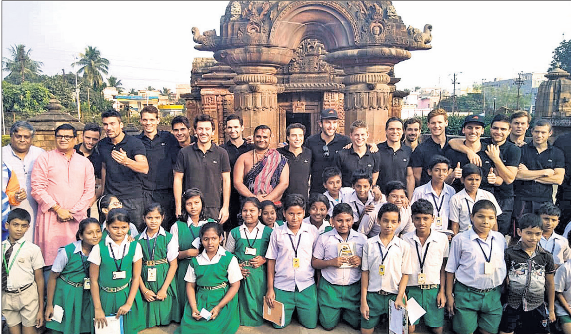
ସୋମବାର ମୁକ୍ତଶ୍ୱର ମନ୍ଦିର ଭ୍ରମଣ ଅବସରରେ ସ୍କୁଲ ଛାତ୍ରଛାତ୍ରୀଙ୍କ ରାହଣରେ ବେଲଜିୟମ୍ ଦଳର ଖେଳାଳିମାନେ।