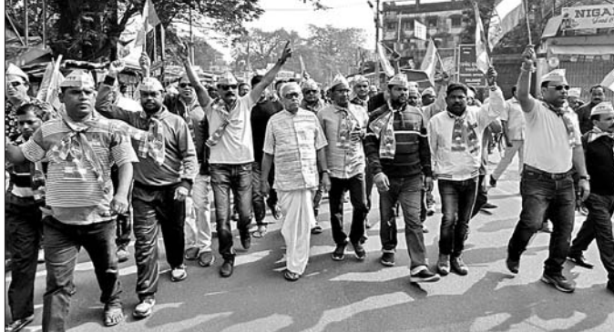
ବଲାଙ୍ଗୀରରେ ହାଇକୋର୍ଟ ବେଷ୍ଟ ପୂନଃ ସ୍ଥାପନ ଆମର ଦାବୀ ବିଜୁ ଜନତା ଦଳ, ବଲାଙ୍ଗୀର