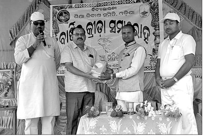
ସୋମବାର ସରସ୍ୱତୀ ଶିଶୁ ବିଦ୍ୟାଳୟର ବାର୍ଷିକ କ୍ରୀଡ଼ା ସମାବେଶରେ ଉପସ୍ଥିତ ଅତିଥି ।