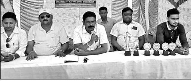
ଦେକୁଳବା ଠାରେ କ୍ରିକେଟ ମ୍ୟାଚ୍‌ରେ ଅତିଥିମଣ୍ଡଳ ।