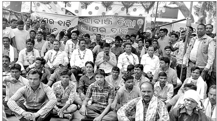
ବିଜେଡିର ଶୋଭାଯାତ୍ରା ।