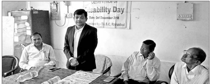
ସୋମବାର ସମ୍ବଲପୁର ତପସ୍ୱିନୀ ପ୍ରେକ୍ଷାଳୟରେ ବିଶ୍ୱ ଭିନ୍ନକ୍ଷମ ଦିବସରେ ଉପସ୍ଥିତ ଅତିଥିମାନେ (ବାମ) । ରେଭାଖୋଳ ଚାଲୁକ ଆଇନସେବା ପ୍ରାଧିକରଣ ସମିତି ପକ୍ଷରୁ ଉପଖଣ୍ଡ ଚିକିତ୍ସାଳୟ ପରିସରରେ ସୋମବାର ଭିନ୍ନକ୍ଷମ ଦିବସ ପାଳନ ଅବସରରେ ମହାସଭା ଅତିଥିମାନେ ।