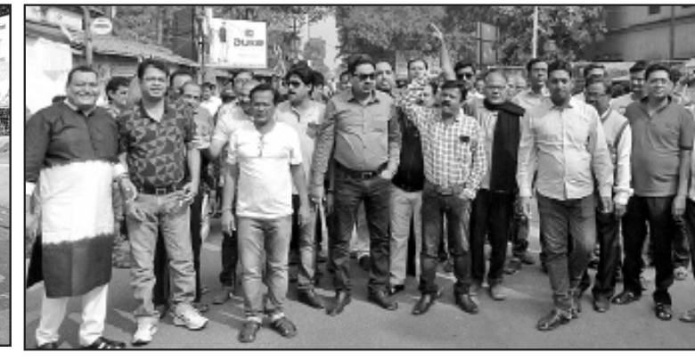
ବଲାଙ୍ଗୀର ବିଜୁ ଟ୍ୟୁମାନ୍ଦ ପାରଖେଶ୍ୱର ବାଇକ ରାଲି (ବାମ) । ପାଟଣାଗଡ଼ଠାରେ ପ୍ରତିବାଦ କରାଯାଉଛି (ମଝି) । ବଲାଙ୍ଗୀର ବଣିକ ସଂଘ ସଦସ୍ୟ ଶୋଭାଯାତ୍ରାରେ ଆହୁରିଛନ୍ତି ।