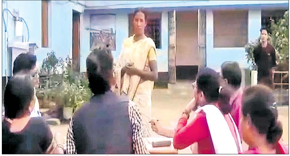
ପ୍ରଶାସନିକ ଯାଞ୍ଚ ଡ୍ରମ୍ ଗୁଡ଼ ନିଉଜ୍ ଇଣ୍ଡିଆ କର୍ମଚାରୀଙ୍କୁ ପରୋଧରୁ କରୁଛନ୍ତି।

ତେଜନାମାଳ ଜିଲ୍ଲା ବେଲଟିକିରିସ୍ଥିତ ଗୁଡ଼ ନିଉଜ୍ ଇଣ୍ଡିଆର ଶେଲଡେର ହୋମରେ ନାବାଳିକା ଛାତ୍ରୀଙ୍କୁ ଯୌନଶୋଷଣ ଅଭିଯୋଗ ପରେ ରାଜ୍ୟ ମହିଳା ଓ ଶିଶୁ କଲ୍ୟାଣ ବିଭାଗ ପକ୍ଷରୁ ଖୋଳତାଡ଼ ଆରମ୍ଭ ହୋଇଛି। ଏହି ପରିପ୍ରେକ୍ଷାରେ ରାଜ୍ୟରେ ଥିବା ଗୁଡ଼ ନିଉଜ୍ ଇଣ୍ଡିଆର ପ୍ରତ୍ୟେକ ଶେଲଡେର ହୋମରେ ଯାଞ୍ଚ କରାଯାଇଛି। ସେଥିପାଇଁ ସୋମବାର ଝାଲପୁର ସହର ଉପକଣ୍ଠ ପଞ୍ଚପଡ଼ାସ୍ଥିତ ଗୁଡ଼ ନିଉଜ୍ ଇଣ୍ଡିଆ ଡ୍ରମ୍ ସେଣ୍ଟରରେ ଜିଲ୍ଲା ପ୍ରଶାସନର ଏକ ପାଞ୍ଚକଣ୍ଠିଆ ଡ୍ରମ୍ ସେଣ୍ଟରରେ ଯାଞ୍ଚବେଳେ ପ୍ରଶାସନିକ ଡ୍ରମ୍ ଗୁଡ଼ ନିଉଜ୍ ଇଣ୍ଡିଆର ବିଭିନ୍ନ କାଗଜପତ୍ର ନିଜ ଅଧୀନକୁ ନେଇଛନ୍ତି। ପ୍ରାଥମିକ ଅନୁସନ୍ଧାନ ଅନୁସାରେ, ଏଠାରେ ଝାଲପୁର, ସୁନ୍ଦରଗଡ଼ ଏବଂ ସମ୍ବଲପୁର ଜିଲ୍ଲାର ମୋଟ ୧୫୬ ବାଳକ, ବାଳିକା ରହୁଛନ୍ତି। ସେଥିରୁ ୨୬ ଜଣ ଛାତ୍ରୀଛାତ୍ର ୧୮ ବର୍ଷରୁ ଅଧିକ ହୋଇଥିବା ବେଳେ ଅବଶିଷ୍ଟ ନାବାଳିକା ଓ ନାବାଳକ ପୂର୍ବରୁ ୨୦୧୩ରୁ ୨୦୧୬ ଯାଏଁ ଏହି କେନ୍ଦ୍ର କିଶୋର ନ୍ୟାୟ ଆଇନ ଅଧୀନରେ ପ୍ରମାଣପତ୍ର ପାଇ ପରିଚାଳିତ ହେଉଥିଲା। କିନ୍ତୁ ପରବର୍ତ୍ତୀ ସମୟରେ ଗୁଡ଼ ନିଉଜ୍ ଇଣ୍ଡିଆରେ ରହି ଅନ୍ୟାନ୍ୟ ଛାତ୍ରୀଛାତ୍ର ଶିକ୍ଷା ଅଧ୍ୟୟନ କରୁଥିବାକୁ ଏହାର ପ୍ରମାଣପତ୍ର ପ୍ରତ୍ୟାହାର କରାଯାଇଥିଲା ଏବଂ ଏହାକୁ