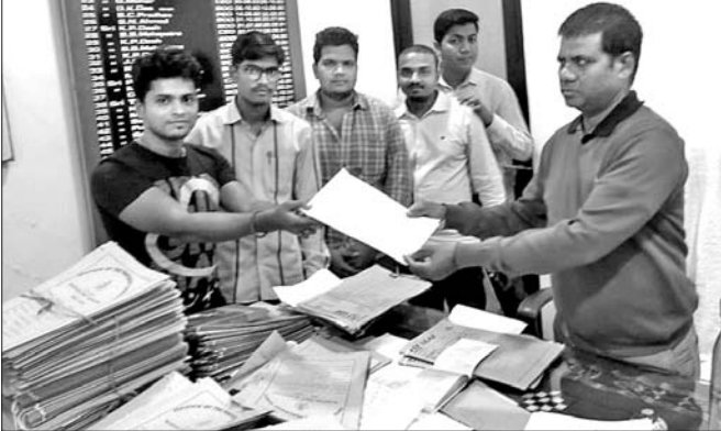
ଯୁଥ କେନ୍ଦ୍ରରେ ସର୍ବଦା ସଦସ୍ୟମାନେ ବିଡିଓଙ୍କୁ ସ୍ଥାନକ ପତର ଦେଉଛନ୍ତି ।