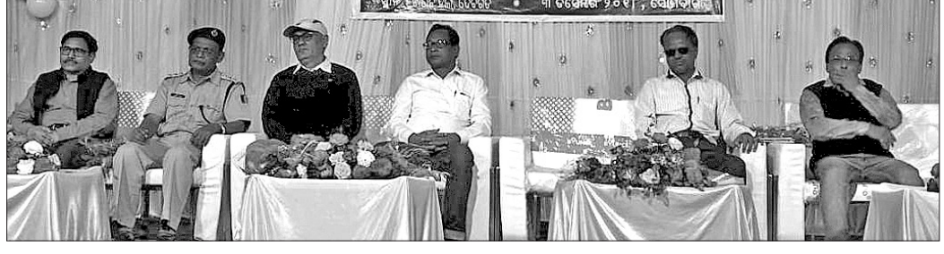
ବେବଗଡ଼ ଜିଲା ପ୍ରଶାସନ ପକ୍ଷରୁ ଆୟୋଜିତ ଅନ୍ତର୍ଜାତୀୟ ଭିନ୍ନକ୍ଷମ ଦିବସ ପାଳନ କାର୍ଯ୍ୟକ୍ରମରେ ମଞ୍ଚାସୀନ ଅତିଥି ।