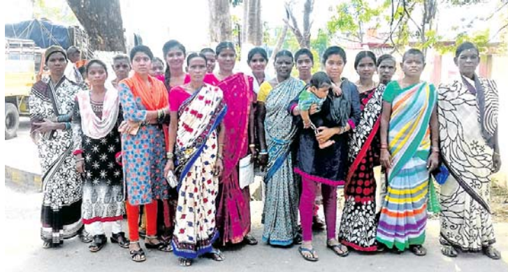
ଜିଲ୍ଲାପାଳଙ୍କୁ ଅଭିଯୋଗ ଜଣାଇବା ପାଇଁ ଆସିଥିବା ଏସ୍‌ଏଚ୍‌ଜି ସଦସ୍ୟାମାନେ ।