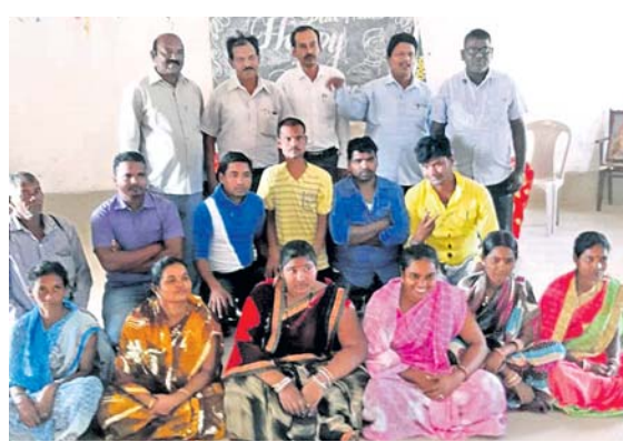
ବୈଠକରେ ଉପସ୍ଥିତ ଶିକ୍ଷକ ଏବଂ ଅଭିଭାବକମାନେ ।