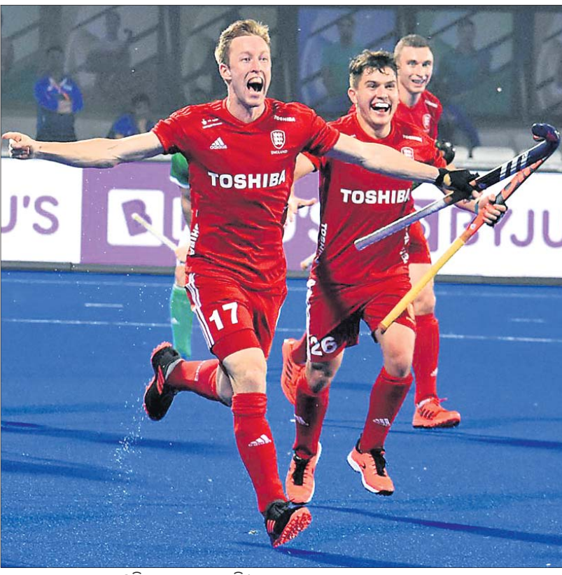
ଗୋଲକ୍ଷେତ୍ର ପରେ ଉଲ୍ଲାସରେ ଇଂଲଣ୍ଡ ଖେଳାଳି