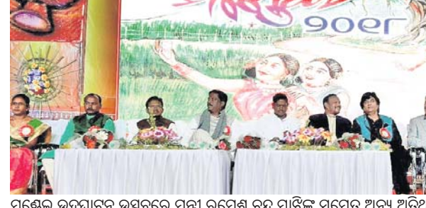
ମତ୍ତେଇ ଉଦ୍‌ଘାଟନ ଉତ୍ସବରେ ମନ୍ତ୍ରୀ ରମେଶ ଚନ୍ଦ୍ର ମାଝିଙ୍କ ସମେତ ଅନ୍ୟ ଅତିଥିମାନେ ମଞ୍ଚାସୀନ।