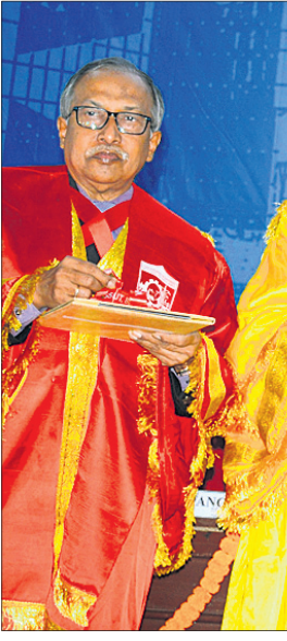
ଭିସ୍ତୁର ୧୦ମ ସମାବର୍ତ୍ତନ ଉତ୍ସବରେ ରାଜ୍ୟପାଳ ଜଣେ ଛାତ୍ରୀଙ୍କୁ ପ୍ରମାଣପତ୍ର ପ୍ରଦାନ କରୁଛନ୍ତି।

ସୁଯୋଗ ଦେବା ଉଚିତ। ତାଙ୍କ ଗତିପଥ ଅବରୋଧ ନ କରି ସହଯୋଗ କରିବା ଉଚିତ। ବାଜପଞ୍ଚୀ ଭଳି ସୁଦୂର