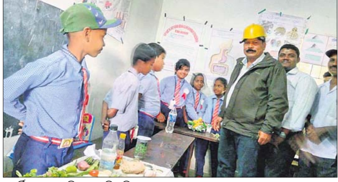
ପ୍ରଦର୍ଶିତ ପ୍ରକଳ୍ପରୁ କିଛି ଦେଖିବାକୁ ଅତିଥି।

ଆନନ୍ଦପୁର ପୌର ପରିଷଦ ଫକୀରପୁର ସମ୍ପ୍ରେସ୍ତର ମଧ୍ୟଭାଗା ବିଦ୍ୟାଳୟ ଓ ବିବେକାନନ୍ଦ ଶିକ୍ଷା କେନ୍ଦ୍ରର ମିଳିତ ଆନୁକୂଲ୍ୟରେ ବିଦ୍ୟାଳୟସ୍ତରୀୟ ବିଜ୍ଞାନ ମେଳା ଅନୁଷ୍ଠିତ ହୋଇଯାଇଛି।