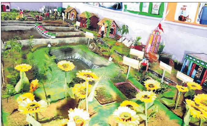
ଭଦ୍ରକ ନେହେରୁ ଷ୍ଟଡିୟମ ପରିସରରେ ପଲିଗ୍ରାମ ମେଳାରେ କୃଷିଭିତ୍ତିକ ଷ୍ଟାଲ ।

ବାଲେଶ୍ୱର-ଭଦ୍ରକ କେନ୍ଦ୍ର ସମବାୟ ବ୍ୟାଙ୍କର ବନ୍ଧୁ ଶାଖା ଅଧୀନ ବସନ୍ତିଆ ସେବା ସମବାୟ ସଂସ୍ଥାରେ ଧାନମଣ୍ଡି ଉଦ୍‌ଘାଟିତ ହୋଇଯାଇଛି ।