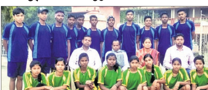
ଖେଳାଳି ଓ ଅଧିନାୟକ ।

ରାଜ୍ୟସ୍ତରୀୟ ୧୨ବର୍ଷରୁ କମ ବାଳକ ଓ ବାଳିକା ବର୍ଗର ଭଲିବଲ ପ୍ରତିଯୋଗିତା କ୍ରମେ ମାସ ୧୪ ଓ ୧୫ ତାରିଖ ରୁଜୁ ଦିନ ଧରି କନ୍ଧମାଳ ଜିଲ୍ଲା ଅନ୍ତର୍ଗତ ଏକେଡ଼ିଓ ଉଚ୍ଚ ବିଦ୍ୟାଳୟରେ ଖେଳପଡ଼ିଆ ପରିସରରେ ହେଲେ ପ୍ରତିଯୋଗିତା ।