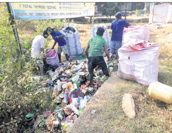
ଆର୍ବିକରୁ ଅବରକାରୀ ବୋତଲ ଗୋଟାଏ ଗୁଡ଼ିକ ସଂଗ୍ରହ କରିବାକୁ ଯାଉଛନ୍ତି ଯୁବକ।

ଖଣି ଖାଦାନ ଭରା କେନ୍ଦୁଝର ଜିଲ୍ଲାରେ ଯୁବକଙ୍କୁ ମିଳୁଛି ରୋଜଗାର ପଛା। ନିୟନ୍ତ୍ରିତ ଅଭାବରୁ ଯୁବକମାନଙ୍କୁ ହରା ହୋଇପାରିନାହିଁ।