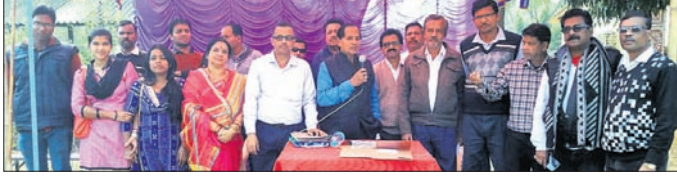
ବାର୍ଷିକ କ୍ରୀଡ଼ାରେ ଶ୍ରୀମନ୍ତ୍ରୀଙ୍କ ସହ ଅଧିକାରୀ ।