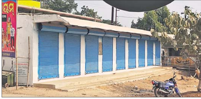
ଖପରାଖାଇ ବ୍ୟସ୍ତାଣ୍ଡରେ ଥିବା ମାର୍କେଟ୍ ଗୃହ।

ହୋଇପାରିନାହିଁ। ୯ଟି ଦୋକାନ ଗୃହ ନିର୍ମାଣ କାର୍ଯ୍ୟ ଶେଷ ହୋଇଥିଲେ ବି ବ୍ୟବସାୟୀଙ୍କୁ ଅଦ୍ୟାବଧି ସେହି ଗୃହ ଗୁଡ଼ିକ ହସ୍ତାନ୍ତର କରାଯାଇନାହିଁ।