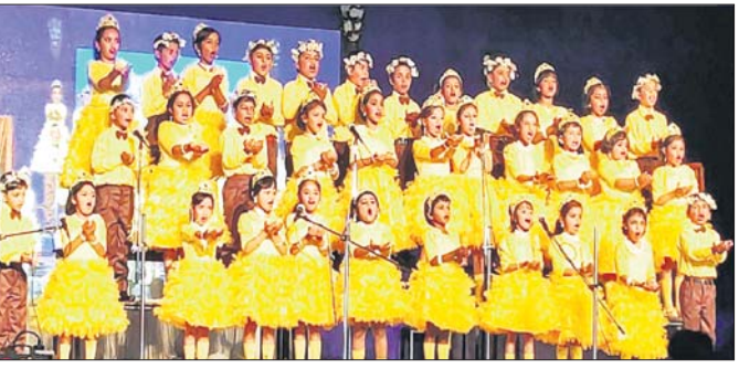
ଉତ୍ସବରେ ଛାତ୍ରୀଛାତ୍ରୀ ସମୂହ ସଂଗୀତ ପରିବେଷଣ କରୁଛନ୍ତି।

ବଡ଼ବିଲ୍ରେ ସେକ୍ସମେନା ସ୍କୁଲର ୫୨ ବର୍ଷ ପୂର୍ଣ୍ଣ ଅବସରରେ ଅନୁଷ୍ଠିତ ନୃତ୍ୟ ଆନ୍ଦୋଳନ (ବାଉଁଶକାନ୍ଦବ)ର ପ୍ରଥମ ଦିନରେ ଛାତ୍ରୀଛାତ୍ରୀଙ୍କ ଦ୍ୱାରା ବିଭିନ୍ନ ଭାଷାରେ ଆଧାରିତ ଆକର୍ଷଣୀୟ ସର୍ବସମ୍ପାଦ ସଂଗୀତ, ନୃତ୍ୟ, କବିତା ଓ ନାଟକ ପରିବେଷିତ ହୋଇଛି।