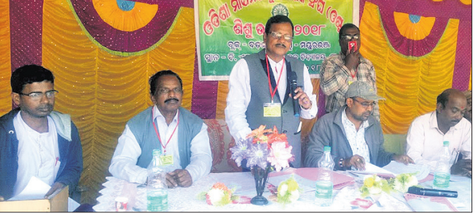
ଭଦ୍ରାପଦା ଉପସଭାରେ ଉପସ୍ଥିତ ଅତିଥି

ଓଡ଼ିଶା ମାଧ୍ୟମିକ ଶିକ୍ଷକ ସଂଘ ଆନୁକୂଲ୍ୟରେ ଭଦ୍ରକ ସ୍ତରୀୟ ଶିଶୁ ମହୋତ୍ସବ ମାଗଣା ବିଏନ ହାଇସ୍କୁଲ ପରିସରରେ ରୁପବାର ଅନୁଷ୍ଠିତ ହୋଇଯାଇଛି ।