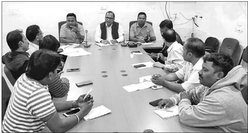
ବୈଠକରେ ଉପସ୍ଥିତ ଉପଜିଲ୍ଲାପାଳ ଏବଂ ଅନ୍ୟମାନେ ।

ଆୟୋଜିତ ହେବ ପୁସ୍ତକ, ପଲିଗ୍ରାଫି, ଖାଦ୍ୟ ମେଳା