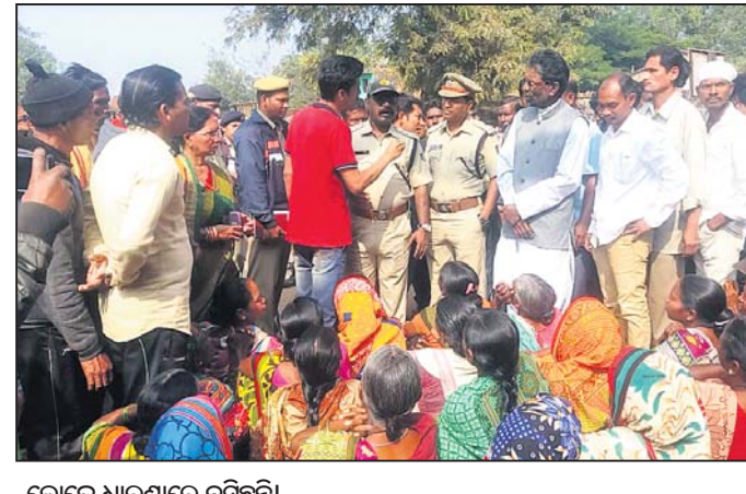
ଲୋକେ ଧାରଣାରେ ବସିଛନ୍ତି।