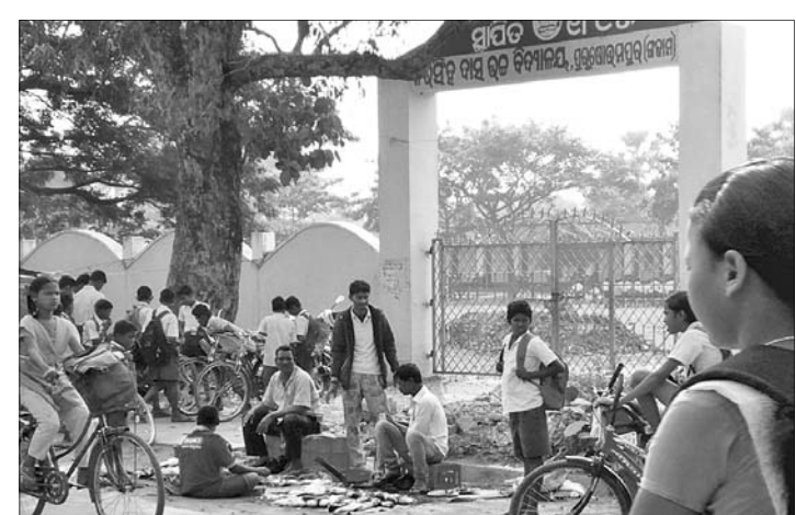
ବିଦ୍ୟାଳୟ ସମ୍ମୁଖରେ ମାଛ ବିକ୍ରି ଚାଲିଛି।

ସରକାର ବିଦ୍ୟାଳୟ ପରିସର ଓ ଏହାର ଆଖପାଖ ସ୍ୱଚ୍ଛ ଓ ସୁନ୍ଦର ରଖିବାକୁ ବିଭିନ୍ନ ପ୍ରୟାସ କରୁଛନ୍ତି। ହେଲେ ଗଞ୍ଜାମ ଜିଲ୍ଲା ପୁରୁଷୋତ୍ତମପୁର ବ୍ଲକରେ ଏହାର ବ୍ୟତିକ୍ରମ ଦେଖିବାକୁ ମିଳିଛି। ଗତ କିଛିଦିନ ହେଲା ନରସିଂହ ଦାସ ହାଇସ୍କୁଲ ରାସ୍ତାରେ ପାର୍ଶ୍ୱରେ ମାଛ ଓ ଚିକେନ ବ୍ୟବସାୟ ହେଉଛି। ଏପରିକି ବିଦ୍ୟାଳୟ ଗେଟ୍ ସମ୍ମୁଖରେ ମଧ୍ୟ କେତେକ ମାଛ ବ୍ୟବସାୟୀ ରାସ୍ତା ଅବରୋଧ କରି ବ୍ୟବସାୟ କରୁଛନ୍ତି। ସର୍ବ ସମ୍ମୁଖରେ ଛେଳି କୁକୁଡ଼ା କାଟିବାକୁ ବାଉଣ କରାଯାଇଥିଲେ ମଧ୍ୟ ଏହାକୁ ଖୋଲାଖୋଲି ଉଲ୍ଲଙ୍ଘନ କରାଯାଇଛି। ରାସ୍ତା କଡ଼ରେ