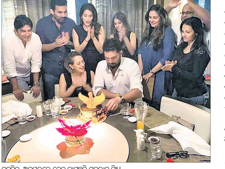
ଜର୍ମାନୀର ଅଧିନାୟକ କେନ୍ଦ୍ରୀୟ ଯୁବରାଜ ସିଂ