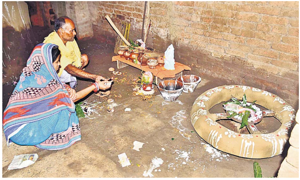
କୁରାଳ ପଞ୍ଚମୀ ଅବସରରେ ପୂଜାର୍ଚ୍ଚନା କରାଯାଇଛି।