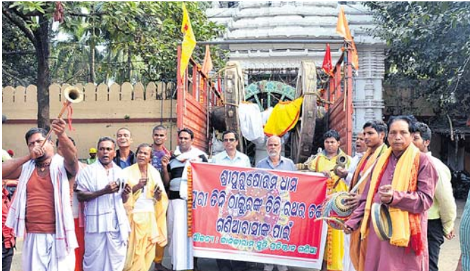
୩ ରଥ ଚକ୍ର ଶୋଭାଯାତ୍ରାରେ ନିଆଯାଇଛି।