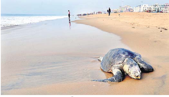
ପୁରୀ ବୋକଭୂମିରେ ମରିପଡ଼ିଥିବା କଇଁଛ।