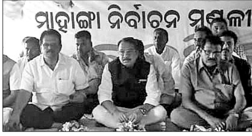
ନବକାଳ ପଞ୍ଚାୟତରେ ଦୁଇ ସ୍ଥାନରେ ହୋଇଥିବା କଂଗ୍ରେସ କର୍ମୀଙ୍କ ବୈଠକ।