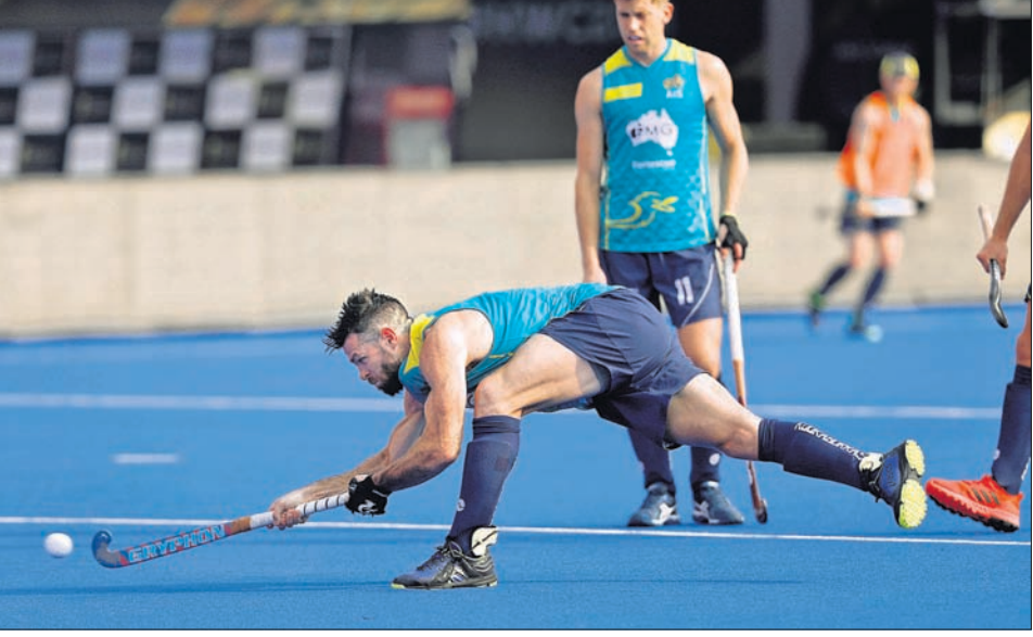
ଶୁକ୍ରବାର କଳିଙ୍ଗ ଷ୍ଟାଡ଼ିୟମରେ ନେଦରଲାଣ୍ଡ ଓ ଅଷ୍ଟ୍ରେଲିଆ ଖେଳାଳିଙ୍କ ଅଭ୍ୟାସ।