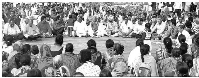
ବାପୁର ଷ୍ଟେସନ ପରିସରରେ ଅନୁଷ୍ଠିତ ପ୍ରତିବାଦ ସଭା।

ଅନୁରାଗ ଜିଲ୍ଲା କିଶୋରନଗର ରୁକ୍ମ ବାପୁର ରେଳ ଷ୍ଟେସନରେ ଭୁବନେଶ୍ୱର-ବଲାଙ୍ଗୀର ଇଣ୍ଟରସିଟି ଏକ୍ସପ୍ରେସ୍ ରହିବା ଆରମ୍ଭ ହେବ। ବାପୁର ଉପଭୋକ୍ତା କମିଟି ପକ୍ଷରୁ ଆରୋହଣ ଡାକରା କ୍ରମେ ସମ୍ବଲପୁର-ଡାକରା ରେଳପଥକୁ ସମ୍ବଲପୁର ଯାଏଁ ଅପରାହ୍ଣ ସାହେ ୧୭ଟି ପର୍ଯ୍ୟନ୍ତ ଅବରୋଧ କରାଯାଇ ଏଥିଯୋଗୁ ୭ଟି ଏକ୍ସପ୍ରେସ୍ ଓ ଲୋକାଲ ଟ୍ରେନ ଚଳାଚଳ ବାଧାପ୍ରାପ୍ତ ହୋଇଥିଲା। ଏଥିସହ କମିଟି ସଭାପତି ତଥା ଆଠମଇଲି ବିଧାନସଭା ସଭ୍ୟ ସାହୁଙ୍କ ସଭାପତିତ୍ୱରେ ଏକ ପ୍ରତିବାଦ ସଭା ଅନୁଷ୍ଠିତ ହୋଇଥିଲା। ଅନ୍ୟପକ୍ଷରେ ରେଳରୋକ୍ତ ସଫଳ