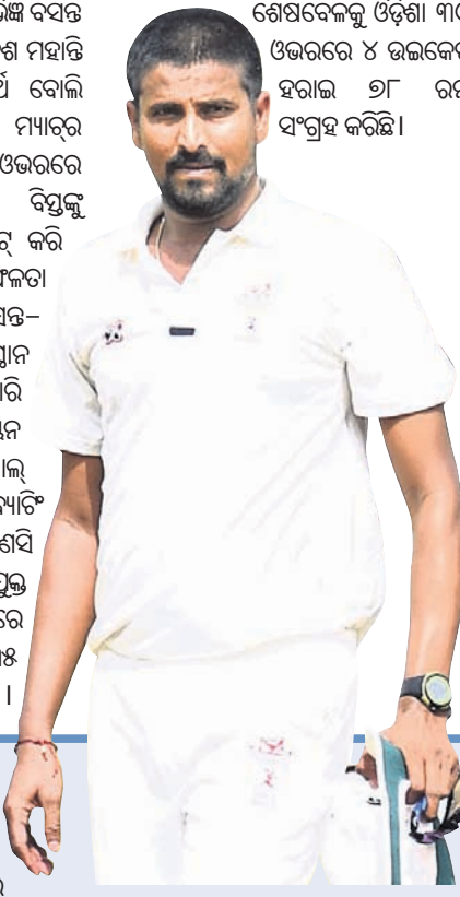
ଶେଷବେଳକୁ ଓଡ଼ିଶା ୩୯ ଓଭରରେ ୪ ଉଇକେଟ୍ ହରାଇ ୬୮ ରନ ସଂଗ୍ରହ କରିଛି।

୧୦୫ ବଲରୁ ୧୪ ଚୋକା ଓ ଗୋଟିଏ ଛକା ସହ ୮୫ ରନ କରି ଲୋମ୍ବରା ଅଜିମ ବ୍ୟାଟ୍ସମ୍ୟାନଭାବେ ଆଉଟ୍ ହୋଇଥିଲେ।