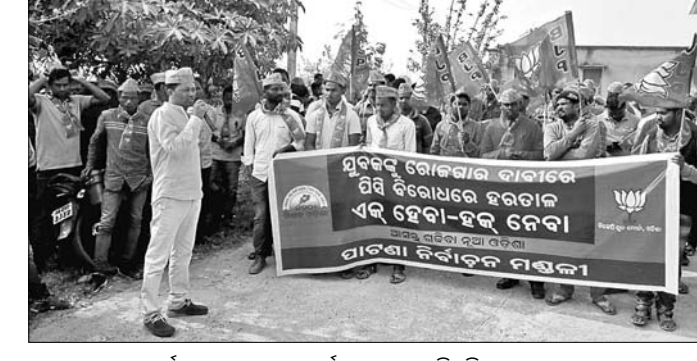
ଗ୍ରାମ ଉନ୍ନୟନ କାର୍ଯ୍ୟାଳୟକୁ ଭାଙ୍ଗିବା କର୍ମୀ ଘେରାଉ କରିଛନ୍ତି।