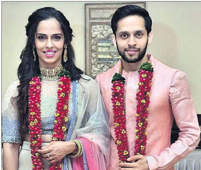
ବିବାହ ବନ୍ଧନରେ ଆବଦ୍ଧ ସାଇନା ନେହାଲ ଓ ପାରୁପଲ୍ଲୀ କାଶ୍ୟପ୍ ।

ଭୁଲ ଭାରତୀୟ ତାରକା ବ୍ୟାଡମିଣ୍ଟନ ଖେଳାଳି ସାଇନା ନେହାଲ ଓ ପାରୁପଲ୍ଲୀ କାଶ୍ୟପ୍ ଶୁକ୍ରବାର ବିବାହ ବନ୍ଧନରେ ଆବଦ୍ଧ ହୋଇଛନ୍ତି।