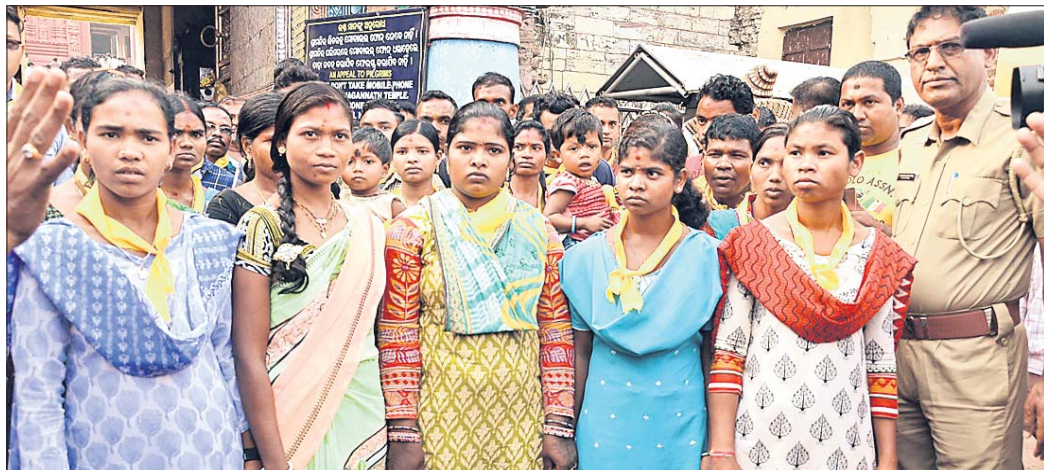
ସମାଜର ମୁଖ୍ୟସ୍ତ୍ରୋତକୁ ଫେରିଥିବା ୩୦ ମାଓବାଦୀ ଶୁକ୍ରବାର ମହାପ୍ରଭୁଙ୍କୁ ଦର୍ଶନ କରି ଫେରିଛନ୍ତି।

ଭୁବନେଶ୍ୱର, ବନ୍ଧୁଙ୍କୁ ପରିଚାଳନା କରି ଘଣ୍ଟା ଜଳାଳରୁ ସମାଜର ମୁଖ୍ୟସ୍ତ୍ରୋତକୁ ଫେରିଥିବା ୩୦ ମାଓବାଦୀ ଶୁକ୍ରବାର ମହାପ୍ରଭୁଙ୍କୁ ଦର୍ଶନ କରିଛନ୍ତି। ଏଥିସହ ମହାପ୍ରଭୁଙ୍କୁ ଖାଇଥିବା ବେଳେ ବଖାଣିଛନ୍ତି ପୁରୁଣା ଦିନର ଅନୁଭୂତି। ଅପରାହ୍ଣ ପ୍ରାୟ ସାଢ଼େ ୨ଟାରେ ଏମାନେ କଟା ସୁରକ୍ଷା ମଧ୍ୟରେ ଆସି ସିଂହସ୍ୱାର ଫାଣ୍ଡି ନିକଟରେ ପହଞ୍ଚିଥିଲେ। ସେମାନଙ୍କୁ ଧାଡ଼ି କରି ମନ୍ଦିରକୁ ନିଆଯାଇଥିଲା। ସାତପାହାଚ ବେଳେ