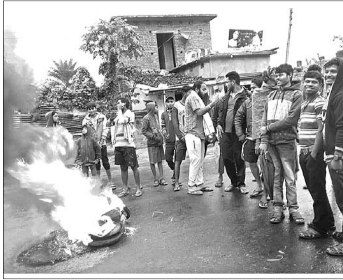
ଖଡ଼ିଆଳଠାରେ ଲୋକେ ଗାୟାର ଜାଳି ରାସ୍ତାବୋକୋ କରୁଛନ୍ତି ।