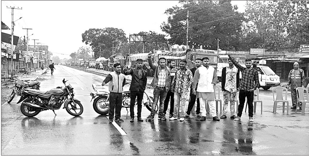
ଏକତା ଛକ ନିକଟରେ ବନ୍ଦ ପାଇବ ବେଳେ ଯୁବ କୋଶଳ ସମନ୍ବୟ ସମିତି କର୍ମକର୍ମୀମାନେ ବିକ୍ଷୋଭ ପ୍ରଦର୍ଶନ କରୁଛନ୍ତି ।