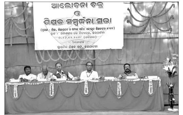
ପ୍ରାଥମିକ ଶିକ୍ଷକ ସଂଘର ସମ୍ମିଳନୀରେ ମଞ୍ଚାସୀନ ଅଟନ୍ତି ।