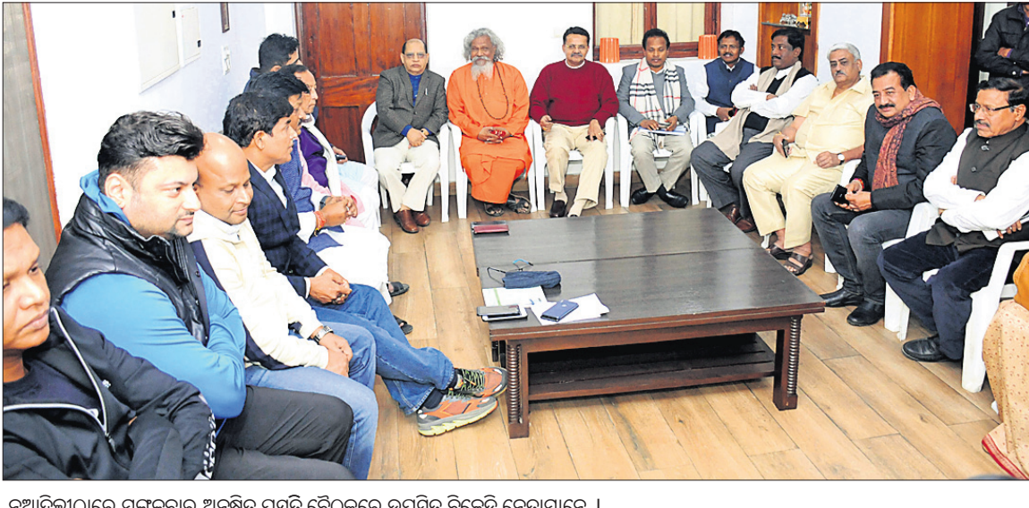
ନୂଆଦିଲ୍ଲୀରେ ମଙ୍ଗଳବାର ଅନୁଷ୍ଠିତ ପ୍ରସ୍ତୁତି ଚିଠିକରେ ଉପସ୍ଥିତ ବିଜେଡି ନେତାମାନେ ।