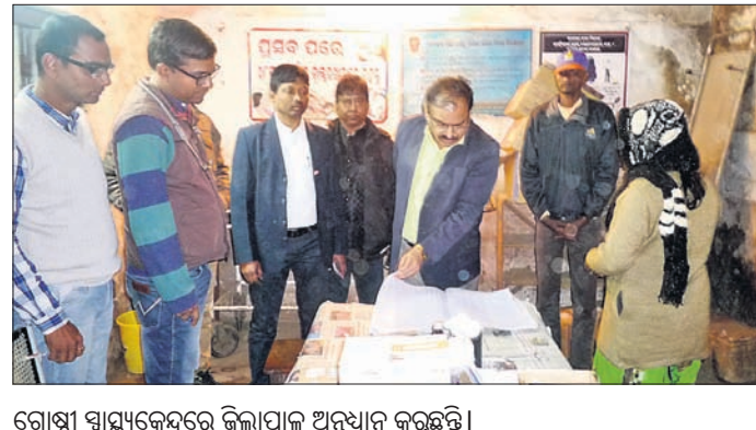
ଗୋଷ୍ଠୀ ସ୍ୱାସ୍ଥ୍ୟକେନ୍ଦ୍ରରେ ଜିଲ୍ଲାପାଳ ଅନୁଧ୍ୟାନ କରୁଛନ୍ତି ।