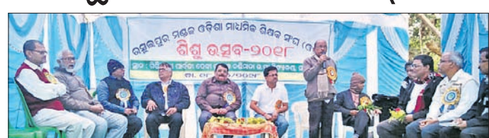
ଶିଶୁମେଳା ଉତ୍ସବରେ ଉପସ୍ଥିତ ଅତିଥି ।

ରସୁଲପୁର ବୁକ ଓଷ୍ଟା ଶିଶୁମେଳା-୨୦୧୮ ମଙ୍ଗଳବାର ଉଦ୍‌ଯାପିତ ହୋଇଛି । ଉଚ୍ଚ ପ୍ରତିଯୋଗିତାରେ ବୁକ ଅଧିକାରୀ ବିଦ୍ୟାଳୟରୁ ୨୦୦ଜଣ ପ୍ରତିଯୋଗୀ ଅଂଶଗ୍ରହଣ କରିଥିଲେ । ଶିଶୁମେଳା ଲୁକ୍ଷ୍ମିତ ପ୍ରତିଭାର ବିକାଶ ଯୋଗାଇବା ସହ ଦେଶ ପାଇଁ ଏକ ସୁନାଗରିକ ଗତି ଚୋକିବାର ଏହା ଏକ ପ୍ରୟାସ ବୋଲି ଅତିଥିମାନେ ମତବକ୍ତା କରିଥିଲେ । ଦେବୀଧାକୁ ନେଇ ନାଟ, ଗୀତ, ଏକକ ଅଭିନୟ, ଚିତ୍ରାଙ୍କନ, ବକ୍ତୃତା, ଭାଷା ସାହିତ୍ୟ ଲିଖନ ଆଦିରେ ପ୍ରତିଯୋଗିତା ଅନୁଷ୍ଠିତ ହୋଇଥିଲା । ପୂର୍ବହରେ ମେଳାକୁ ଶିକ୍ଷାବିତ୍ ପଡ଼ାରିବାରୁ ଏ ବାବଦରେ ତାଙ୍କ ନିକଟରେ କୌଣସି ତଥ୍ୟ ନ ହୋଇ କହିଛନ୍ତି ।