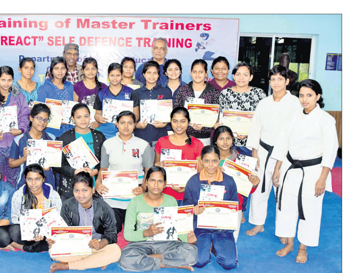
ଉତ୍କଳ କରାଟେ ସ୍କୁଲରେ ଅନୁଷ୍ଠିତ ମାଷ୍ଟର ଟ୍ରେନିଂରେ କୃତିତ୍ୱ ଅର୍ଜନ କରିଥିବା ଛାତ୍ରୀମାନେ କର୍ମକର୍ମାଣ୍ଡ ସହ।