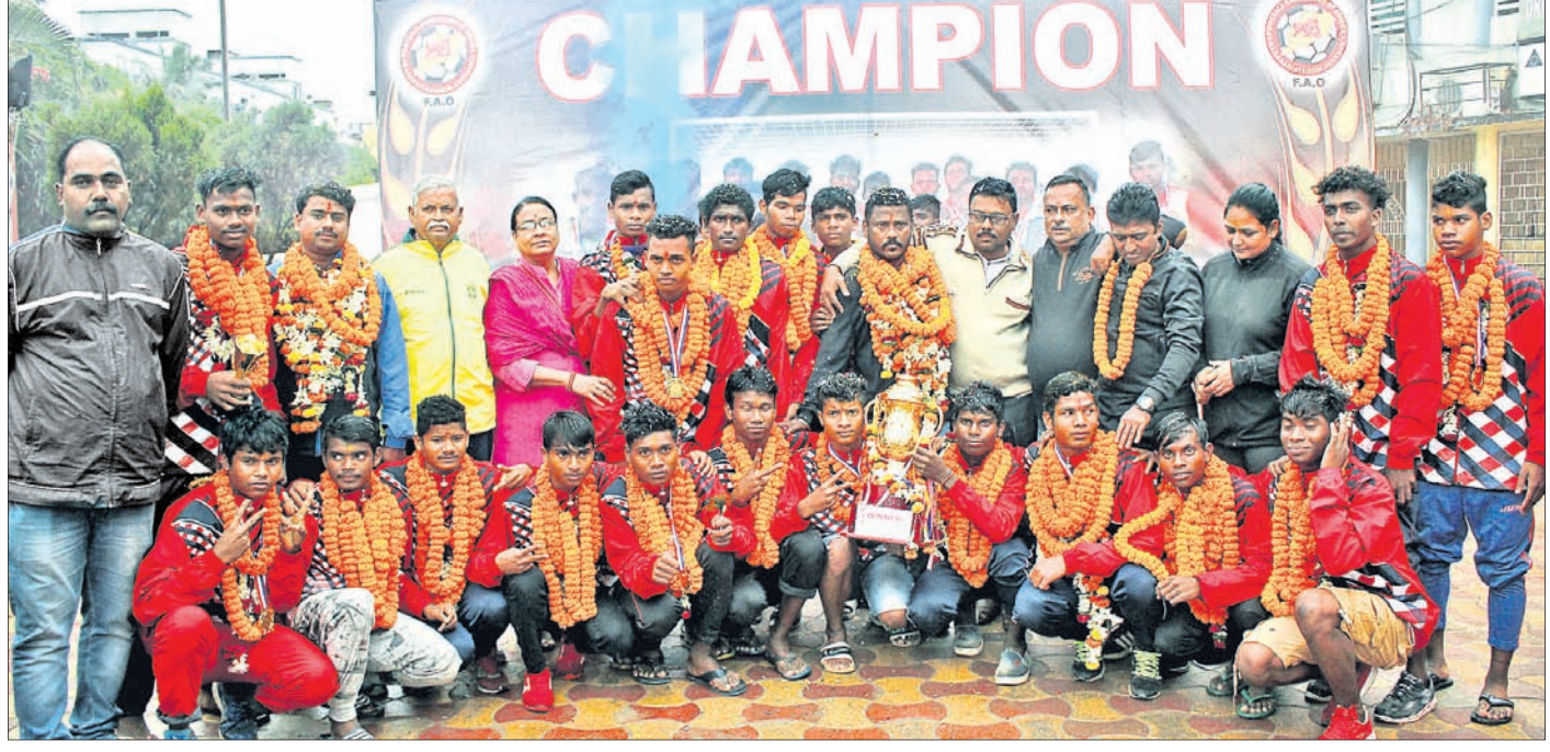
ସବୁଜୁନିୟର ବାଳକ ପୁଟବଲ ଚାମ୍ପିୟନସିପ୍‌ରେ ଚାଇଟଲ ବିଜୟୀ ଓଡ଼ିଶା ଦଳ ମଙ୍ଗଳବାର ପ୍ରତ୍ୟାବର୍ତ୍ତନ କରିବା ପରେ କଟକଠାରେ ସମ୍ବନ୍ଧିତ କରାଯାଇଛି।