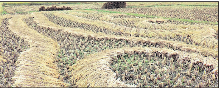
କିଲରେ କଟାହୋଇ ପଡିଥିବା ଧାନ ।