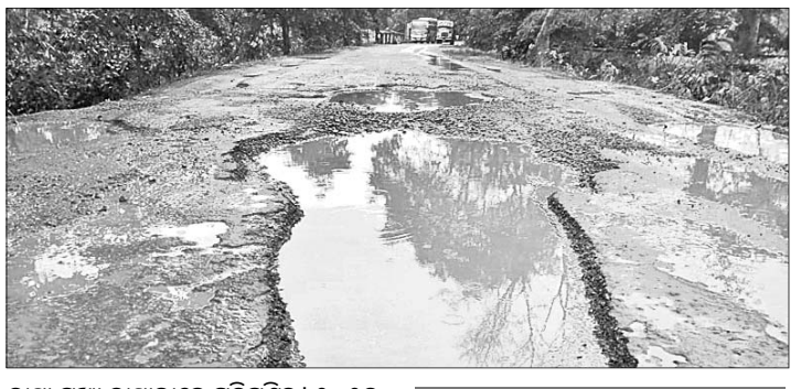
ରାସ୍ତା ପୁଷ୍ପ ରାସ୍ତାରେ ପରିଚାଳିତ। ୨୦୧୭ ଫେବୃଆରୀରେ ପୁଷ୍ପମାମୁନୀବାନୀ ପଞ୍ଚନାୟକ ନଗରୀ ଗସ୍ତ ସମୟରେ ଟମକା-ମଙ୍ଗଳପୁର ରାସ୍ତାକୁ ଚାରିଆଡ଼ା କରିବା ପାଇଁ ଭିଲି ପ୍ରସ୍ତୁତ କରାଯାଇଥିଲା। ହେଲେ ଏ ପର୍ଯ୍ୟନ୍ତ ତାହା କାର୍ଯ୍ୟକାରୀ ହୋଇପାରି ନାହିଁ। ଫଳରେ ଦୈନିକ ହଜାର ହଜାର ସଂଖ୍ୟାରେ ଟ୍ରକ୍ ସହ ବିଭିନ୍ନ ଗାଡ଼ି ମୋଟର ଭଣ୍ଡ ରାସ୍ତା ଦେଇ ଅତିବାହିତ କରୁଛନ୍ତି। ବିଶେଷକରି ଲକ୍ଷ୍ମୀପୁଡ଼ିଆ,

ଭୁବନେଶ୍ୱର ଖଣି ଅଞ୍ଚଳର ବ୍ୟସ୍ତ ବନ୍ଧୁକ ଟମକା-ମଙ୍ଗଳପୁର ରାସ୍ତା ମରଣଯତ୍ନା ପାଲଟିଛି। ରାସ୍ତାରେ ବିଭିନ୍ନ ସ୍ଥାନରେ ଖାଲଖାମା ସୃଷ୍ଟି ହୋଇଛି। ଦୈନିକ ଖଣି ଅଞ୍ଚଳକୁ ବହୁ ସଂଖ୍ୟାରେ ପରିବହନ ଟ୍ରକ୍ ଚଳାଚଳ କରୁଥିବାବେଳେ ରାସ୍ତାର ଅବସ୍ଥା ଦିନକୁଦିନ ଶୋଚନୀୟ ହେବାରେ ଲାଗିଛି। ଏଭଳି ସ୍ଥିତିରେ ବର୍ତ୍ତମାନ ଲକ୍ଷ୍ମୀପାଟଣା ଜନପଥରେ ରାସ୍ତାରେ ପାଣି ଜମି ରହିବାରୁ ପଥଚାରୀ ବିଭିନ୍ନ ସମସ୍ୟାରେ ସମ୍ମୁଖୀନ ହେଉଥିବା ଅଭିଯୋଗ କରିଛନ୍ତି। ଆଗାମୀ ଦିନରେ ରାସ୍ତାର ମରାମତି କରା ନ ଗଲେ ଖଣି ଅଞ୍ଚଳକୁ କ୍ରୋମ୍ ପରିବହନ ବନ୍ଦ କରିବାକୁ ଟ୍ରକ୍ ମାଲିକଙ୍କ ସମେତ ଭାବପା ପକ୍ଷରୁ ଚେତାବନୀ ଦିଆଯାଇଛି। ଖଣି ଅଞ୍ଚଳରେ ପରିବହନ ଓ ଗମନାଗମନ ପାଇଁ ଟମକା-ମଙ୍ଗଳପୁର