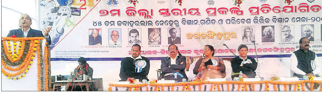
ଜିଲ୍ଲାସ୍ତରୀୟ ପ୍ରଦର୍ଶନୀ, ପ୍ରକଳ୍ପ ପ୍ରତିଯୋଗିତା ଓ ବିଜ୍ଞାନ ମେଳାରେ ଉପସ୍ଥିତ ଅତିଥି ।

ନିଜେ ପଢ଼ି ବୁଝିଲେ ସଫଳତା ନିଶ୍ଚୟ ମିଳିବ। କେହି କାହାକୁ ଦାବି ପିଆଇ ପାରିବେ ନାହିଁ। ଯୋଗ୍ୟ ବିଦ୍ୟାଳୟରେ ଆସିବେ । ଟେଷ୍ଟ ପେପର କିମ୍ବା ଚଏପ୍ ପ୍ରଶ୍ନର ଉତ୍ତର ମନେ ରଖି ଅଧିକ ନୟର ରଖିବା ସମ୍ଭବ । କିନ୍ତୁ ଏହା ବାସ୍ତବ ଜୀବନରେ କାମରେ ଆସିବନାହିଁ । ଯେଉଁଥିପାଇଁ ଅନେକ ଛାତ୍ରଛାତ୍ରୀ ଇଞ୍ଜିନିୟରିଂ ସମେତ ଅନ୍ୟାନ୍ୟ କ୍ଷେତ୍ରରେ ଭଲ ମାର୍କ ରଖି କର୍ମ କ୍ଷେତ୍ରରେ ସଫଳତା ପାଇପାରୁନାହାନ୍ତି । ଏହା ପଢ଼ିବାକୁ ଛାତ୍ରଛାତ୍ରୀଙ୍କୁ ବାଧ୍ୟ କରିଥାନ୍ତି । ଗଳ୍ପ, ଏକାକିତା କିମ୍ବା ଅନ୍ୟ ପୁସ୍ତକ ପଢ଼ିବାକୁ ସୁଯୋଗ ଦିଅନ୍ତି ନାହିଁ । ବାସ୍ତବରେ ସେଭଳି କରିବା କଥା ନୁହେଁ । ପିଲା ଯେବେ ଗଳ୍ପ ବହି ପଢ଼ିଲେ ତାକୁ ପଢ଼ିବାକୁ ସୁଯୋଗ ଦେବା ଆବଶ୍ୟକ । ଏଥିସହ ବର୍ତ୍ତମାନ ଅନେକ ଟ୍ୟାଲେଣ୍ଟ ଯଥା ଶକ୍ତି ସ୍ୱଳ୍ପ, ପ୍ରତ୍ୟକ୍ଷ ଆଦି ଉପରେ ବର୍ଣ୍ଣନା କରିଥିଲେ । ମାନବ ଉପସ୍ଥିତ ଛାତ୍ରଛାତ୍ରୀଙ୍କୁ ଏହା ପାଳନ କରିବା ପାଇଁ ଆହ୍ୱାନ ଦେଇଥିଲେ । ଆସି ଯେତେବେଳେ ଆମ ଦୈନିକ କାର୍ଯ୍ୟକ୍ରମରେ ସେ ଏକଥା ମଧ୍ୟ କହିଥିଲେ ଯେ, ଏହା ପ୍ରମାଣଯୋଗ୍ୟ । ସେ ନିଜେ କମ୍ପ୍ୟୁଟର ଉଦ୍ୟୋଗୀ ମାଧ୍ୟମରେ ଏହା ଜାଣିପାରିଛନ୍ତି । ପଢ଼ିବାରେ ମଧ୍ୟ କୌଣସି କଟକଣା ରହିବା କଥା ନୁହେଁ । ଅନେକ ସମୟରେ ଦେଖାଯାଏ ଅଭିଭାବକ କିମ୍ବା