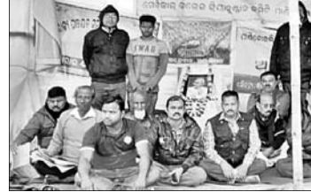
ଧାରଣାସ୍ଥଳରେ ବସିଥିବା କମିଟି କ୍ରିୟାନୁଷ୍ଠାନ କମିଟି ସଦସ୍ୟ।