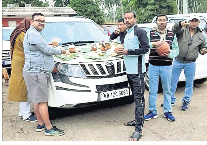
ଜୋଡା ପିନ୍ଧି କାର ବନେଟ୍ ଉପରେ ମହାପ୍ରସାଦ ସେବନ କରୁଛନ୍ତି।