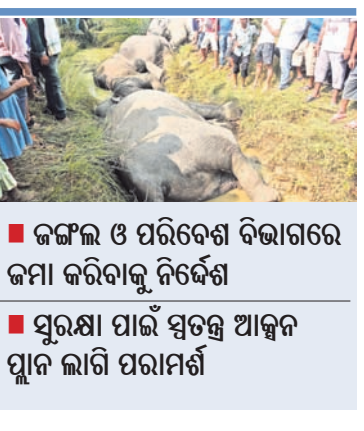
ଜଙ୍ଗଲ ବିଭାଗକୁ ନିର୍ଦ୍ଦେଶ ଦେଇଛନ୍ତି। ହାତୀମୃତ୍ୟୁରେ ଓଡ଼ିଶା ଜାତୀୟସ୍ତରରେ ବଦନାମ ପୁଣ୍ୟାଳୟ ରାଜ୍ୟରେ ଥିବା ବିଭିନ୍ନ ହସ୍ତା ପ୍ରକଳ୍ପଗୁଡ଼ିକର ସୁରକ୍ଷା ପାଇଁ ସ୍ୱତନ୍ତ୍ର ଆକ୍ସନ ପ୍ଲାନ ପ୍ରସ୍ତୁତ କରିବାକୁ ପରାମର୍ଶ ଦେଇଛନ୍ତି ଏନ୍‌ଜିଟି। ଆକ୍ସନ ପ୍ଲାନ କାର୍ଯ୍ୟକାରୀତା ସମ୍ପର୍କରେ ପ୍ରତି ୩ ମାସରେ ପରିବେଶ ମନ୍ତ୍ରାଳୟକୁ ସବିଶେଷ ତଥ୍ୟ ଦେବାକୁ ଟ୍ରିବ୍ୟୁନାଲ୍ ପକ୍ଷରୁ ଜଙ୍ଗଲ ଓ ପରିବେଶ ବିଭାଗକୁ ନିର୍ଦ୍ଦେଶ ଦିଆଯାଇଛି। ବିଦ୍ୟୁତ୍ ଆଘାତରେ ହାତୀମୃତ୍ୟୁ ଘଟଣା ପରେ ଏନ୍‌ଜିଟି ଗତ ଅକ୍ଟୋବର ■ ଜଙ୍ଗଲ ଓ ପରିବେଶ ବିଭାଗରେ ଜମା କରିବାକୁ ନିର୍ଦ୍ଦେଶ ■ ସୁରକ୍ଷା ପାଇଁ ସ୍ୱତନ୍ତ୍ର ଆକ୍ସନ ପ୍ଲାନ ଲାଗି ପରାମର୍ଶ

ଭୁବନେଶ୍ୱର, ୨୦।୧୨(ବୁଧବାର) ଦେଶାନ୍ତର ଜିଲ୍ଲା ଓଡ଼ିଆପଡ଼ା ବ୍ଲକ୍ କମଳାଙ୍ଗରେ ବିଦ୍ୟୁତ୍ ଆଘାତରେ ଏକକାଳୀନ ୭ ହାତୀଙ୍କ ମୃତ୍ୟୁ ଘଟଣାରେ କଟା ଅଭିଯୁକ୍ତୀ ପୋଷଣ କରିଛନ୍ତି ଜାତୀୟ ଗ୍ରାମ୍ ବିଦ୍ୟୁତ୍ ନିଗମ (ଏନ୍‌ଜିଟି)। ହାତୀ ମୃତ୍ୟୁ ପାଇଁ ଗୁରୁତ୍ୱର ଏନ୍‌ଜିଟି ସେଣ୍ଟ୍ରାଲ ଇଲେକ୍ଟ୍ରିସିଟି ସପ୍ଲାଇ ଯୁଗ୍ମିକିଟି (ସେସୁ) ଉପରେ ଜରିମାନା ରାଶିକୁ ୪ କୋଟି ଟଙ୍କାକୁ ବୃଦ୍ଧି କରିଛନ୍ତି। ଉକ୍ତ ଅର୍ଥ ରାଜ୍ୟ ସରକାରଙ୍କ ଜଙ୍ଗଲ ଓ ପରିବେଶ ବିଭାଗରେ ଜମା ଦେବାକୁ ନିର୍ଦ୍ଦେଶ ଦିଆଯାଇଛି। ଜରିମାନା ଅର୍ଥ ହାତୀ ସୁରକ୍ଷା ବିଭାଗରେ ଖର୍ଚ୍ଚ କରିବାକୁ ଟ୍ରିବ୍ୟୁନାଲ୍