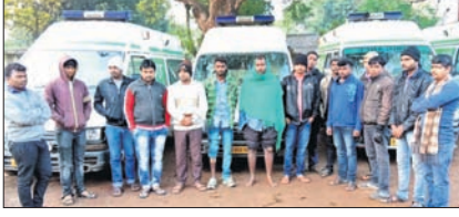
ଆହତ ଆୟୁଲାନୁ କର୍ମଚାରୀମାନେ।

ବଡ଼ସାହି, ୨୦୧୭ (ସ.ପ୍ର) ବଡ଼ସାହି ଥାନା ଅଧୀନ ଚାଉଳିଆଖୋଳ ନିକଟରେ ରୁଧିରା ବନିକ ରାତିରେ ଏକ ୧୦୮ ଆୟୁଲାନୁ ଏକ ଚାଳିକୁ ଧକ୍କା ଦେବାରୁ ଉତ୍ତରଜନା ପ୍ରକାଶ ପାଇଥିଲା। ଉତ୍ତରଜନା ଲୋକେ ଦୁର୍ଘଟଣା ଘଟାଇଥିବା ଆୟୁଲାନୁ କର୍ମଚାରୀଙ୍କୁ ନିୟୁକ୍ତ ମାତ୍ର ମାରିଥିଲେ। ଏଥିରେ ଆୟୁଲାନୁ ଚାଳକ, ଫାର୍ମାସିଷ୍ଟ ଓ କର୍ମଚାରୀଙ୍କ ସମେତ ମୋଟ ୬ଜଣ ଆହତ ହୋଇ ବାରିପଦା ଡାକ୍ତରଖାନାରେ ଚିକିତ୍ସା ହେଉଛନ୍ତି। ଡେବେ ଆକ୍ରମଣକାରୀ ଅଭିଯୁକ୍ତଙ୍କ ବିରୋଧରେ କାର୍ଯ୍ୟାନୁଷ୍ଠାନ ଗ୍ରହଣ କରା ନ ଗଲେ ୧୦୮ ଆୟୁଲାନୁ ଚାଳକ/କର୍ମଚାରୀ ଆନ୍ଦୋଳନକୁ ଓହ୍ଲାଇବେ ବୋଲି ଚେତାବନୀ ଦେଇଛନ୍ତି।