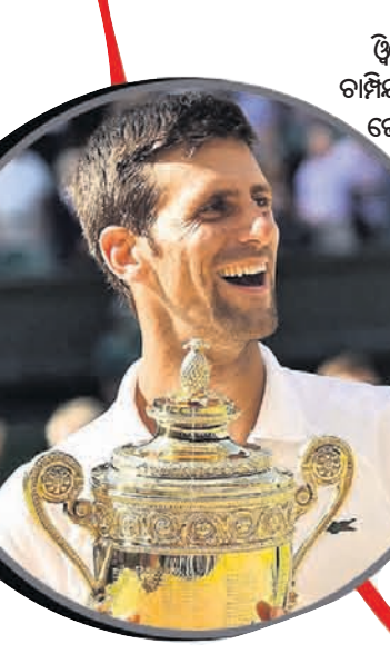
ଫ୍ରେମ୍‌ଲଡନ ଚାମ୍ପିୟନ ନୋଭାକ ଡେକୋଭିଚ୍