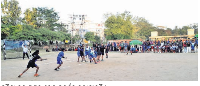
ମହିଳା ଦଳ ପକ୍ଷରୁ ଖେଳ ପ୍ରଦର୍ଶନ କରାଯାଇଛି।

କେନ୍ଦୁଝରରେ ୩୨ତମ ରାଜ୍ୟ ମହିଳା ଓ ପୁରୁଷ ହ୍ୟାଣ୍ଡବଲ ଚାମ୍ପିୟନଶିପ୍ ଗୁରୁବାର ଅପରାହ୍ନରେ ଉଦ୍ଘାଟିତ ହୋଇଯାଇଛି। ଚୁର୍ଣ୍ଣମେଣ୍ଡର ୧୨ ପୁରୁଷ ଏବଂ ୪ ମହିଳା ହ୍ୟାଣ୍ଡବଲ ଦଳ ଯୋଗ ଦେଇଛନ୍ତି। ଉଦ୍ଘାଟନା ଦିବସର ପ୍ରଥମାବର୍ତ୍ତରେ ଡିସେମ୍ବର କେନ୍ଦୁଝର ଇଞ୍ଜିନିୟରିଂ କଲେଜ ପଡ଼ିଆଠାରେ ଅନୁଷ୍ଠିତ ପ୍ରଥମ ମ୍ୟାଚରେ କିଏ ପୁରୁଷ ଦଳ ୧୮-୩ ଗୋଲ ବ୍ୟବଧାନରେ ନୟାଗଡ଼ ଦଳକୁ ପରାସ୍ତ କରିଥିଲା। ଦ୍ୱିତୀୟ ମ୍ୟାଚରେ ଗାମ ପୁରୁଷ ଦଳ ୧୬-୬ ଗୋଲ ବ୍ୟବଧାନରେ ଡେକାନାକକୁ ପରାସ୍ତ କରିଥିଲା। ତୃତୀୟ ମ୍ୟାଚରେ ପୁରୀ ପୁରୁଷ ଦଳ ୧୪-୧୧ ଗୋଲରେ ପାରାଡ଼ାପକୁ ତରୁଥ ମ୍ୟାଚରେ ଜଗତସିଂହପୁର ଦଳ ୧୮-୧୨ ଗୋଲରେ ଭୁବନେଶ୍ୱର ଦଳକୁ