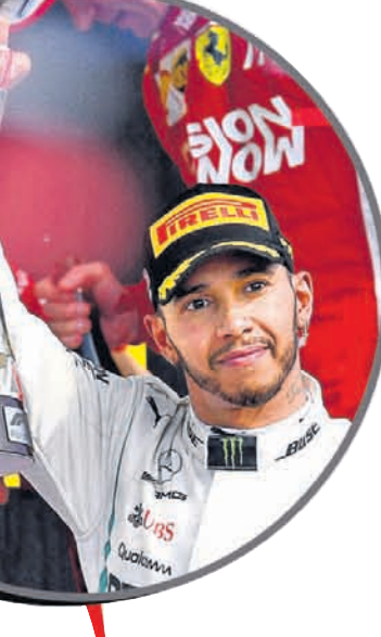
ଫର୍ମୁଲା-୧ ବିଶ୍ୱ ଚାମ୍ପିୟନ ଲୁଇସ୍ ହାମିଲଟନ