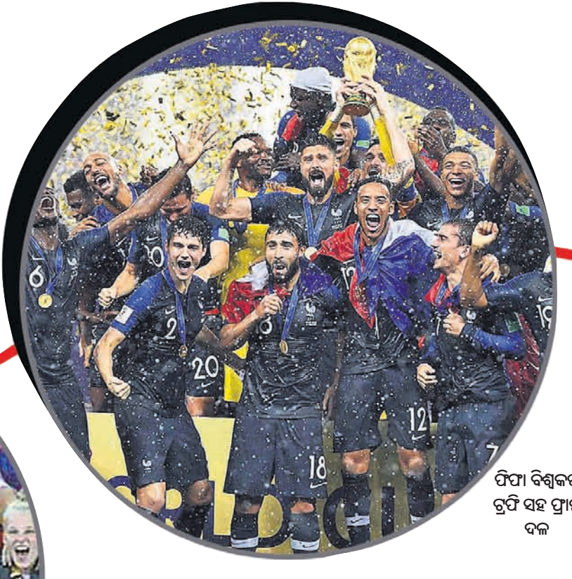
ଫିଫା ବିଶ୍ୱକପ୍ ଟ୍ରଫି ସହ ଫ୍ରାନ୍ସ ଦଳ