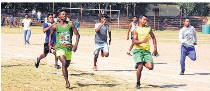
ବୌଦ୍ଧରେ ଭାଗ ନେଇଥିବା ଖେଳାଳି।

ରବିବାର ବୈଲୋଚନ ଏବଂ ତାଙ୍କ ସାଙ୍ଗ ତେଜାନାଥ ଅକ୍ଷୟଙ୍କ ବିଭୂ ପ୍ରସାଦ ବେହେରା ଓ ଘସିପୁରା ଥାନା କଳନିପୁରା ଅଞ୍ଚଳର ବିଭୂ ପ୍ରସାଦଙ୍କ ପ୍ରଧାନ ଘରଗାଁ