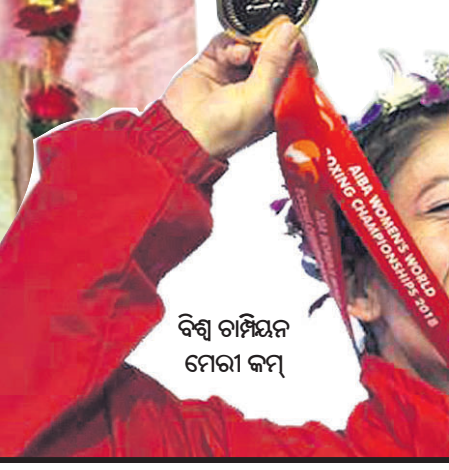
ବିଶ୍ୱ ଚାମ୍ପିୟନ ମେରୀ କମ୍