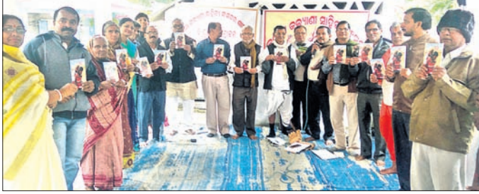
ପୁସ୍ତକ 'ବାପା' ଅତିଥିକ ଦ୍ୱାରା ଉନ୍ମୋଚନ କରାଯାଇଛି।