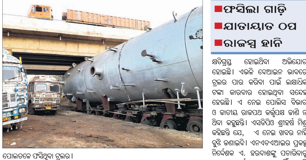
ପୋଲତଳେ ଫସିଥିବା ଟ୍ରେଲର।

ଏକ ଟ୍ରେଲର ଯାତାୟତ ପାଇଁ କେନ୍ଦୁଝର ଜିଲା ମୁଖ୍ୟାଳୟରେ ଭାରତୀୟ ଜାତୀୟ ରାଜପଥ ପ୍ରାଧିକରଣର ବିନା ଅନୁମତିରେ ଜାତୀୟ ରାଜପଥକୁ ଖୋଳା ଯାଇଛି। ରାସ୍ତା ଖୋଳି ଏକ ଟ୍ରେଲରକୁ ପାର କରିବା ଉଦ୍ୟମକୁ ନେଇ ଚର୍ଚ୍ଚା ଜୋର ଧରିଛି। ଜାତୀୟ ରାଜପଥ ନଷ୍ଟ ହେବା ସହ ବ୍ୟାପକ ରାଜସ୍ୱ କ୍ଷତି ହୋଇଛି। ଏହାର ଉଚ୍ଚ ସ୍ତରୀୟ ତଦନ୍ତ ଦାବି ହୋଇଛି। ଗତ ୬ ହେବ ଏକ ଭାରତୀୟ କଲିକତା-ମୁମ୍ବାଇ ୪୯ ନମ୍ବର ଜାତୀୟ ରାଜପଥର କେନ୍ଦୁଝର ସହର ଦେଇ ଯାଇଥିଲା। କୁଟିଆ ଘାଟ ନିକଟ ୨୦ ନମ୍ବର ଜାତୀୟ ରାଜପଥରେ (ଓଭରବ୍ରିଜ) ନିର୍ମାଣ ହୋଇଥିବା ପୋଲ ତଳେ ଟ୍ରେଲର ଅଟକି ରହିଥିଲା। ବହୁ ଉଦ୍ଦର ଏକିଲ ଟ୍ରେଲର ଯାତାୟତ ଉପରେ ପୋଲିସ କଟକଣା ନ କରି ଉଚ୍ଚ ଟ୍ରେଲରକୁ ଯିବା ପାଇଁ ସହଯୋଗ କରିଥିବା ଅଭିଯୋଗ ହୋଇଛି। ରାସ୍ତାକୁ ୫୦୦ ଯୁକ୍ତ ଖୋଳାଯାଇ ଟ୍ରେଲରକୁ ପାର