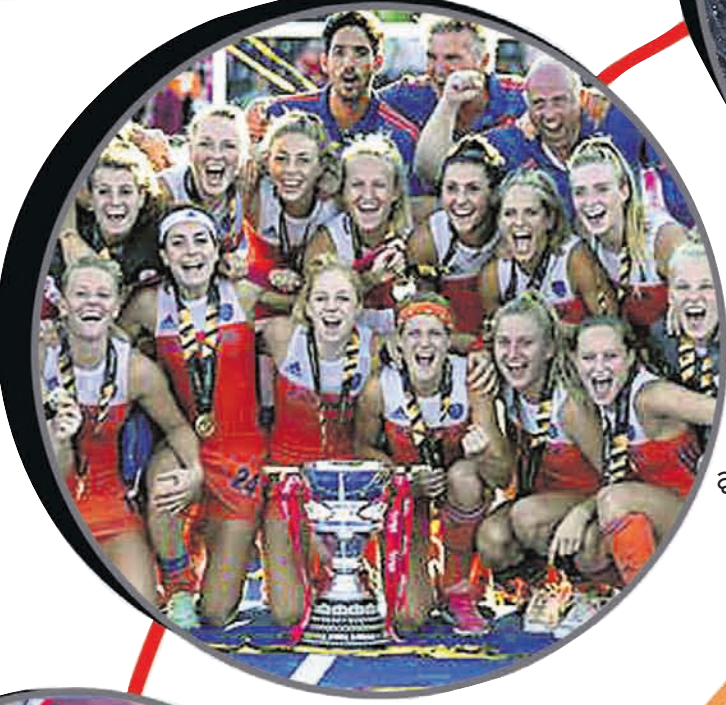
ମହିଳା ହକି ବିଶ୍ୱକପ୍ ଚାମ୍ପିୟନ ନେଦରଲାଣ୍ଡ ଦଳ