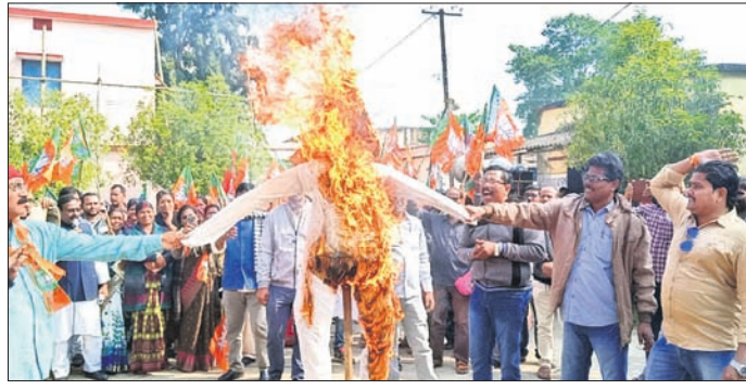
କୃଷକ ମୋର୍ଚ୍ଚା ପକ୍ଷରୁ ମୁଖ୍ୟମନ୍ତ୍ରୀ ଏବଂ ଯୋଗାଣ ମନ୍ତ୍ରୀଙ୍କ କୁଖପୁରଲିକା ଦାହ କରାଯାଇଛି।

ବାଲେଶ୍ୱର କୃଷକ ମୋର୍ଚ୍ଚା ତରଫରୁ ଗୁରୁବାର ପୂର୍ବାହ୍ନ ୧୧ଟା ୩୦ରେ ବିଳମ୍ବରେ ଧାନମଣ୍ଡି ଖୋଲିବା ପ୍ରତିବାଦରେ ଜିଲ୍ଲା ଯୋଗାଣ ଅଧିକାରୀଙ୍କ ଅଫିସ୍ ଘେରାଉ କରାଯାଇଥିଲା। ଦିନକୁ ଦିନ କୃଷକମାନଙ୍କ ସମସ୍ୟା ଜଟିଳ ହେବା ସହ ଜିଲ୍ଲାର କୃଷକଙ୍କର ଆର୍ଥିକ ସ୍ଥିତି ଶୋଚନୀୟ ହେଉଛି। ୧୯ ବର୍ଷର ଶାସନରେ ରାଜ୍ୟ ସରକାର ସମାଧାନର ସୁଦ୍ର ବାହାର କରିବା ପରିବର୍ତ୍ତେ ନାଟକବାଦି ଆରମ୍ଭ କରିଛନ୍ତି ବୋଲି ଭାଜପା କୃଷକ ମୋର୍ଚ୍ଚା ଦଳ ପକ୍ଷରୁ କୁହାଯାଇଛି।