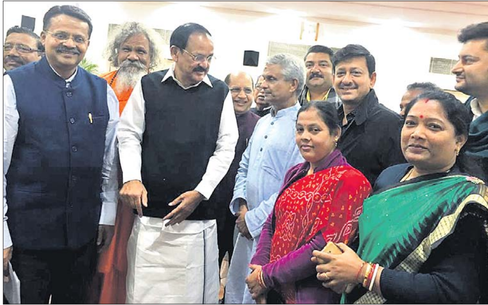
ବିଜେଡି ସଂସଦୀୟ ଦଳ ନେତା ଭର୍ତ୍ତୃହରି ମହାପାତ୍ର (ଲୋକ ସଭା) ଏବଂ ପ୍ରସନ୍ନ ଆଚାର୍ଯ୍ୟ (ରାଜ୍ୟ ସଭା)ଙ୍କ ନେତୃତ୍ୱରେ ବିଜେଡି ଏମ୍ପି ମାନେ ଉପରାଷ୍ଟ୍ରପତି ଭେଙ୍କାୟା ନାଉଡୁକୁ ସାକ୍ଷାତ କରି ମହିଳା ସଂରକ୍ଷଣ ପ୍ରସଙ୍ଗରେ ସମର୍ଥନ ଲୋଡୁଛନ୍ତି।

୭ ଆଇପିଏସ୍ ଅଧିକାରୀଙ୍କୁ ପଦୋନ୍ନତି ଭୁବନେଶ୍ୱର, ୨୦୧୨ (ସ୍ପେଶାଲ): ଓଡ଼ିଶା କ୍ୟାଡରର ୭ ଆଇପିଏସ୍ ଅଧିକାରୀଙ୍କୁ ପଦୋନ୍ନତି ମିଳିଛି। ୨ ଜଣଙ୍କୁ ଆଇଡିଏସ୍ ପଦୋନ୍ନତି ମିଳିଛି। ୫ ଜଣଙ୍କୁ ସିଲେକ୍ଟେଡ୍ ଗ୍ରେଡ୍‌କୁ ପଦୋନ୍ନତି ମିଳିଛି।