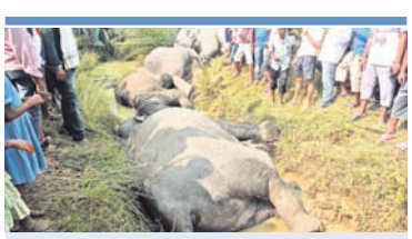
ଜଙ୍ଗଲ ବିଭାଗକୁ ନିର୍ଦ୍ଦେଶ ଦେଇଛନ୍ତି। ହାତୀମୃତ୍ୟୁରେ ଓଡ଼ିଶା ଜାତୀୟସ୍ତରରେ ବଦନାମ ପୁଣ୍ୟାଳୟ ରାଜ୍ୟରେ ଥିବା ବିଭିନ୍ନ ହସ୍ତା ପ୍ରକଳ୍ପଗୁଡ଼ିକର ସୁରକ୍ଷା ପାଇଁ ସ୍ୱତନ୍ତ୍ର ଆକ୍ସନ ପ୍ଲାନ ପ୍ରସ୍ତୁତ କରିବାକୁ ପରାମର୍ଶ ଦେଇଛନ୍ତି ଏନ୍‌ଜିଟି। ଆକ୍ସନ ପ୍ଲାନ କାର୍ଯ୍ୟକାରୀତା ସମ୍ପର୍କରେ ପ୍ରତି ୩ ମାସରେ ପରିବେଶ ମନ୍ତ୍ରାଳୟକୁ ସବିଶେଷ ତଥ୍ୟ ଦେବାକୁ ବ୍ୟବସ୍ଥା କରାଯିବ। ପରାମର୍ଶ ପରିବେଶ ବିଭାଗକୁ ନିର୍ଦ୍ଦେଶ ଦିଆଯାଇଛି। ବିଦ୍ୟୁତ୍ ଆଘାତରେ ହାତୀମୃତ୍ୟୁ ଘଟଣା ପରେ ଏନ୍‌ଜିଟି ଗତ ଅକ୍ଟୋବର

ଭୁବନେଶ୍ୱର, ୨୦।୧୨(ବୁଧବାର) ଦେଶାନ୍ତର ଜିଲ୍ଲା ଓଡ଼ିଆପଡ଼ା ବ୍ଲକ୍ କମଳାଙ୍ଗରେ ବିଦ୍ୟୁତ୍ ଆଘାତରେ ଏକକାଳୀନ ୭ ହାତୀଙ୍କ ମୃତ୍ୟୁ ଘଟଣାରେ କଟା ଅଭିଯୁକ୍ତ ଯୋଗ୍ୟ କରିଛନ୍ତି ଜାତୀୟ ଗ୍ରାମ୍ ବିଦ୍ୟୁତ୍ ନିଗମ (ଏନ୍‌ଜିଟି)। ହାତୀ ମୃତ୍ୟୁ ପାଇଁ ଗୁରୁତ୍ୱର ଏନ୍‌ଜିଟି ସେଣ୍ଟ୍ରାଲ ଇଲେକ୍ଟ୍ରିସିଟି ସପ୍ଲାଇ ଯୁଗ୍ମିକିଟି (ସେସୁ) ଉପରେ ଜରିମାନା ରାଶିକୁ ୪ କୋଟି ଟଙ୍କାକୁ ବୃଦ୍ଧି କରିଛନ୍ତି। ଉକ୍ତ ଅର୍ଥ ରାଜ୍ୟ ସରକାରଙ୍କ ଜଙ୍ଗଲ ଓ ପରିବେଶ ବିଭାଗରେ ଜମା ଦେବାକୁ ନିର୍ଦ୍ଦେଶ ଦିଆଯାଇଛି। ଜରିମାନା ଅର୍ଥ ହାତୀ ସୁରକ୍ଷା ଦିଗରେ ଖର୍ଚ୍ଚ କରିବାକୁ ବ୍ୟବହାର କରାଯିବ।