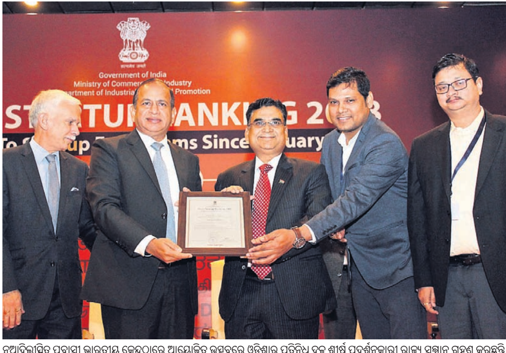
ନୂଆଦିଲ୍ଲୀରୁ ପ୍ରବାସୀ ଭାରତୀୟ କେନ୍ଦ୍ରରେ ଆୟୋଜିତ ଉଦ୍‌ଘାଟନରେ ଓଡ଼ିଶାକୁ ପ୍ରତିନିଧିତ୍ୱ କରି ଶୀର୍ଷ ପ୍ରଦର୍ଶନକାରୀ ରାଜ୍ୟ ସମ୍ମାନ ଗ୍ରହଣ କରୁଛନ୍ତି।

ଔପ୍ୟୋଗିକ ନୀତି ଓ ସମର୍ଥନା ବିଭାଗ (ଡିଆଇପିପି) ଦ୍ୱାରା ରାଜ୍ୟ ସ୍ୱାର୍ଥାପ୍ତ ମାନ୍ୟତା-୨୦୧୮ରେ ଓଡ଼ିଶାକୁ ଶୀର୍ଷ ପ୍ରଦର୍ଶନକାରୀ ରାଜ୍ୟ ଭାବେ ଘୋଷଣା କରାଯାଇଛି।