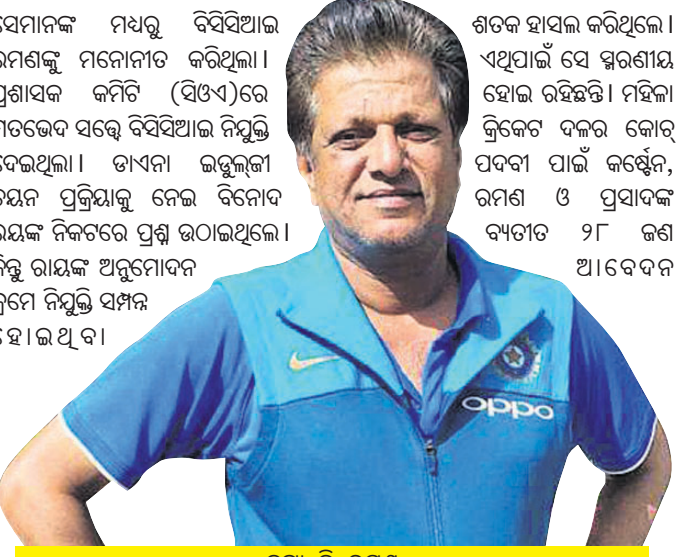
ଡକ୍ଟର ଶ୍ରୀ. ରମଣ

ପୂର୍ବତନ ଓପନର ଡକ୍ଟର ଶ୍ରୀ. ରମଣ ଭାରତୀୟ ମହିଳା କ୍ରିକେଟ ଦଳ କୋର୍ ଦୌଡ଼ରେ ବିଶ୍ୱକପ ଚାମ୍ପିୟନ କୋର୍ ଦଳର କୋର୍ ନିଯୁକ୍ତି କରାଯାଇଥିବା ଦେଖିବା ପାଇଁ ଦେଖିଛନ୍ତି । ତଥ୍ୟ ପ୍ରକାଶ କରାଯାଇଛି ।