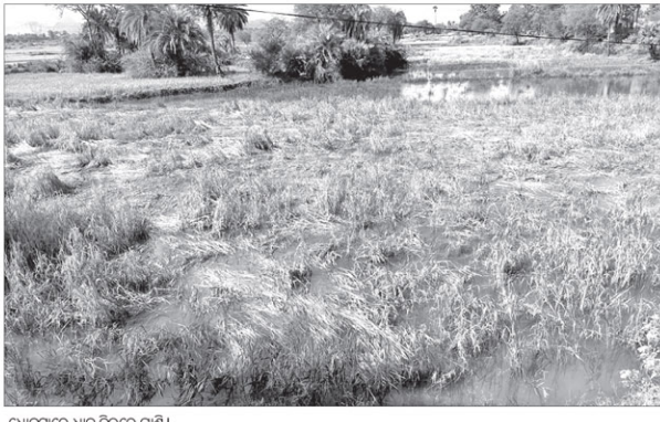
ଧାନ ଉଜାଡିଲା ପେଥାଇ

ବନଜା, ୨୦୧୮ (ଡି.ଏନ.ଏ.)- ଧାନ ଉଜାଡିଲା ପେଥାଇ ଘଟଣା ଘଟିଛି । ଧାନ ଉଜାଡିଲା ପେଥାଇ ଘଟଣା ଘଟିଛି । ଧାନ ଉଜାଡିଲା ପେଥାଇ ଘଟଣା ଘଟିଛି । ଧାନ ଉଜାଡିଲା ପେଥାଇ ଘଟଣା ଘଟିଛି ।