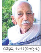
ଶ୍ରୀବତ୍ସ, ୨୦୧୨ (ଡି.ଏଲ୍.ଏ.)