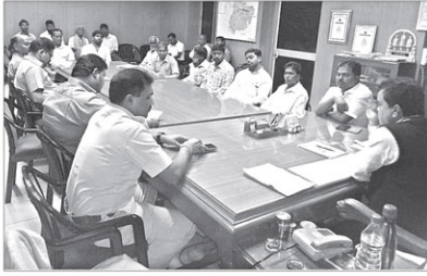
ପ୍ରଶାସନ ଓ ଗ୍ରାମବାସୀଙ୍କ ମଧ୍ୟରେ ଅନୁଷ୍ଠିତ ବୈଠକ।

ଅନୁଗୋଳ ଜିଲାପାଳଙ୍କ ଓଫିସରେ ଯୋଗଦେଇଥିବା ଅଧିକାରୀଙ୍କୁ ବିବାଦ ଛାଡିବାର ନାଁ ଧରିବାକୁ ଦିନକୁ ଦିନ ଧନିଆ କରୁଥିବା ହେତୁ ଏହାକୁ ଛାଡିବାକୁ ପ୍ରଶାସନ ଗ୍ରାମବାସୀଙ୍କୁ ଶୁକ୍ରବାର ପୂର୍ବାହ ୧୧ଟା ପର୍ଯ୍ୟନ୍ତ ମହଲତ ଦେଇଛି।