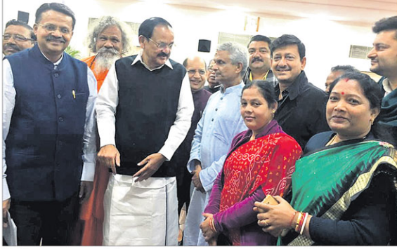
ବିଜେଡି ସଂସଦୀୟ ଦଳ ନେତା ରଘୁବିର ମହାପାତ୍ର (ଲୋକ ସଭା) ଏବଂ ପ୍ରସାର ଆଚାର୍ଯ୍ୟ (ରାଜ୍ୟ ସଭା)ଙ୍କ ନେତୃତ୍ୱରେ...