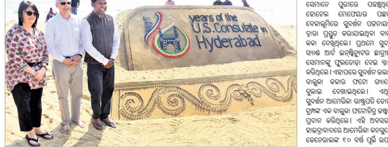
କୋଣାର୍କ ସୂର୍ଯ୍ୟମନ୍ଦିର ପରିଦର୍ଶନ କଲେ ବାଲୁକା ଜଳା ଦେଖିଲେ ଆମେରିକା ରାଷ୍ଟ୍ରଦୂତ

କୋଣାର୍କ ସୂର୍ଯ୍ୟମନ୍ଦିର ପରିଦର୍ଶନ କଲେ ବାଲୁକା ଜଳା ଦେଖିଲେ ଆମେରିକା ରାଷ୍ଟ୍ରଦୂତ । କୋଣାର୍କ ସୂର୍ଯ୍ୟମନ୍ଦିର ପରିଦର୍ଶନ କଲେ ବାଲୁକା ଜଳା ଦେଖିଲେ ଆମେରିକା ରାଷ୍ଟ୍ରଦୂତ ।