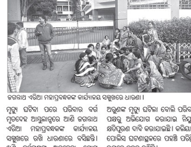
ବରଖା ଅଞ୍ଚଳର ମହାପ୍ରବନ୍ଧକଙ୍କ କାର୍ଯ୍ୟକ୍ରମ ସମ୍ମୁଖରେ ଧାରଣା।

କିଶୋରନଗର ବ୍ଲକ୍ ଗ୍ରାମ ବରଖା ପ୍ରଶାସନ ଯୋଗୁଁ ଗ୍ରାମ ପ୍ରହରାସନ ସାହୁଙ୍କୁ ଜମି ଚିହ୍ନଟ ପାଇଁ ଆବେଦନ ସହଜ କରିବା ନେଇ ଅଭିଯୋଗ କରାଯାଇଥିଲା।