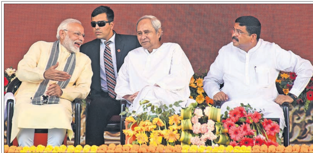
ଆଇଆଇଟି କ୍ୟାମ୍ପସ୍ ପରିସରରେ ଯୋଗଦାନ ଆୟୋଜିତ ବିଭିନ୍ନ ପ୍ରକଳ୍ପର ଶିଳାନ୍ୟାସ ଓ ଲୋକାର୍ପଣ ଉତ୍ସବର ଏକ ବିଶେଷ ମୁହୂର୍ତ୍ତରେ ପ୍ରଧାନମନ୍ତ୍ରୀ ନରେନ୍ଦ୍ର ମୋଦି, ମୁଖ୍ୟମନ୍ତ୍ରୀ ନବୀନ ପଟ୍ଟନାୟକ ଓ କେନ୍ଦ୍ରମନ୍ତ୍ରୀ ଧର୍ମେନ୍ଦ୍ର ପ୍ରଧାନ। (ରିପୋର୍ଟ ପୃଷ୍ଠା-୯)

ଓଡ଼ିଶାର ବିକାଶ ପାଇଁ ପରିବର୍ତ୍ତନର ଆବଶ୍ୟକତା ରହିଛି। ସେହି ପରିବର୍ତ୍ତନ ରାଜ୍ୟବାସୀଙ୍କ ଆଶାବାଦ ଏବଂ ସହଯୋଗରୁ ସମ୍ଭବ ହୋଇପାରିବ। ବିକାଶର ପ୍ରକ୍ରିୟାକୁ ଦ୍ୱିଗୁଣିତ କରିବା ପାଇଁ ଓଡ଼ିଶାରେ ଭାବପାଳ ବିକାଶ କରିବାକୁ ପ୍ରଧାନମନ୍ତ୍ରୀ ନରେନ୍ଦ୍ର ମୋଦି ଯୋଗଦାନ ଖୋର୍ଦ୍ଧାସ୍ଥିତ ନାଲକର ପଡ଼ିଆରେ ଭାବପାଳ ପକ୍ଷରୁ ଆୟୋଜିତ ସ୍ୱାଗତମାନ ସମାବେଶରେ ବକ୍ତବ୍ୟ ରଖିଛନ୍ତି। ପ୍ରଧାନମନ୍ତ୍ରୀ ମୋଦି ଶାପକ ବିଚେତ ଏବଂ ମୁଖ୍ୟମନ୍ତ୍ରୀ ନବୀନ ପଟ୍ଟନାୟକଙ୍କୁ ସିଧାସଳଖ ଚାର୍ଚ୍ଚା କରି ନ ଥିଲେ ମଧ୍ୟ ପରୋକ୍ଷରେ ଚାଷୀ, ପିସି, ଚିତ୍ରପଞ୍ଚ, ସ୍ୱଚ୍ଛତା ଏବଂ ଆୟୁଷ୍ମାନ ଯୋଜନା ପ୍ରସଙ୍ଗରେ ରାଜ୍ୟ ସରକାରଙ୍କୁ ସମାଲୋଚନା କରିଛନ୍ତି। ଏପରି କି ଓଡ଼ିଶାରେ ଭ୍ରଷ୍ଟାଚାର ଏବଂ ଦୁର୍ନୀତିର ଦାନବ ରହିଛି, ଏହାକୁ କିଏ ଦାନାପାଣି ଦେଉଛି ବୋଲି ମୋଦି ପ୍ରଶ୍ନ କରିଛନ୍ତି। ଯାହାକୁ ନେଇ ରାଜ୍ୟ ରାଜନୀତିରେ ଚର୍ଚ୍ଚା ଜୋର ଧରିଛି।