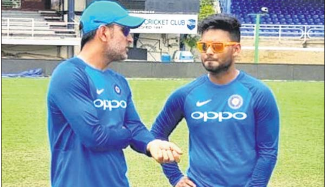
ମହେନ୍ଦ୍ର ସିଂ ଧୋନୀ ଓ ରିଷଭ ପଟ୍ଟ।

ଆଗାମୀ ଦୁଇଦିନ ବିପକ୍ଷ ଟି୨୦ ସିରିଜ ଓ ଅଷ୍ଟ୍ରେଲିଆ ତଥା ଦୁଇଦିନ ବିପକ୍ଷ ଦିନିକିଆ ସିରିଜ ପାଇଁ ଭାରତୀୟ ଦଳ ଘୋଷଣା କରାଯାଇଛି। ଦିନିକିଆ ବିଶ୍ୱକପକୁ ଦୃଷ୍ଟିରେ ରଖି ତୟନକର୍ତ୍ତା ଦଳରେ କେତୋଟି ପରିବର୍ତ୍ତନ କରିଛନ୍ତି। ଅଭିଜ୍ଞ ମହେନ୍ଦ୍ର ସିଂ ଧୋନୀ ଟି୨୦ ଦଳକୁ ପ୍ରତ୍ୟାବର୍ତ୍ତନ କରିଛନ୍ତି। ତେବେ ସୁବ ଉଦ୍ଦେଶ୍ୟ କିପରି ବ୍ୟାଟ୍ସମ୍ୟାନ ରିଷଭ ପଟ୍ଟକୁ ଦିନିକିଆ ଦଳକୁ ବାଦ୍ ଦିଆଯାଇଛି। ଗତମାସ ଅଷ୍ଟ୍ରେଲିଆ ଗସ୍ତରୁ ଧୋନୀଙ୍କୁ ବାଦ୍ ଦିଆଯାଇଥିଲେ ମଧ୍ୟ ତାଙ୍କୁ ଆଶ୍ଚର୍ଯ୍ୟକରଣ ଭାବେ ଦଳରେ ସାମିଲ କରାଯାଇଛି। ସେହିପରି ପକ୍ତ ଦଳକୁ ବାଦ୍ ଦିଆଯିବା ମଧ୍ୟ ଅନେକଙ୍କୁ ଚକିତ କରିଛି। ଆଗାମୀ ୨୦୧୯ ଦିନିକିଆ ବିଶ୍ୱକପ ପାଇଁ ଟିମ୍ ମ୍ୟାନେଜମେଣ୍ଟ ପକ୍ଷରୁ ବର୍ତ୍ତମାନ ସେତେଟା ରୁଚୁରୁ ଦେଉ ନ ଥିବା ଏଥିରୁ ଅନୁମାନ କରାଯାଇଛି। ତେବେ ତୟନ କର୍ତ୍ତା ସଂଯୋଜକ ଅମିତାଭ ଚୋପ୍ରା ଏ ନେଇ କୌଣସି ମନ୍ତବ୍ୟ ଦେବାକୁ ମନା କରିଦେଇଛନ୍ତି। ତେବେ ୩୬ ବର୍ଷୀୟ ଧୋନୀଙ୍କୁ ଦଳରେ ସାମିଲ କରାଯିବୁ ଯଥାସ୍ଥି ବୋଲି କୁହାଯାଇଛି। ବିଶ୍ୱକପ ପୂର୍ବରୁ ଭାରତ ମୋଟ ଉପରେ ୮ଟି ଦିନିକିଆ ଖେଳିବ। ୩ଟି ଦିନିକିଆ ଅଷ୍ଟ୍ରେଲିଆ ଓ ୫ଟି ଦୁଇଦିନ ବିପକ୍ଷରେ ଭାରତ ଖେଳିବ। ତେଣୁ ଧୋନୀଙ୍କୁ ପର୍ଯ୍ୟାପ୍ତ ସୁଯୋଗ ଦେବାକୁ ଧୋନୀଙ୍କୁ ପର୍ଯ୍ୟାପ୍ତ ସୁଯୋଗ ଦେବାକୁ ୩ଟି ଟି୨୦କୁ ମିଶାଇଲେ ବିଶ୍ୱକପ ପୂର୍ବରୁ