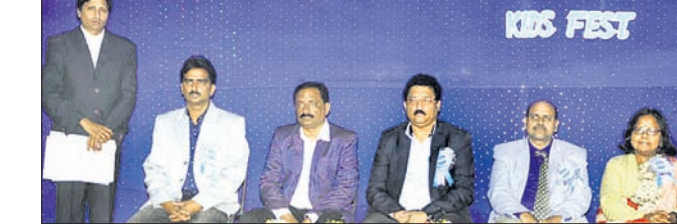
'ଫଟୋଥାକ୍'ରେ ସାମିଲ ଫଟୋଗ୍ରାଫର୍