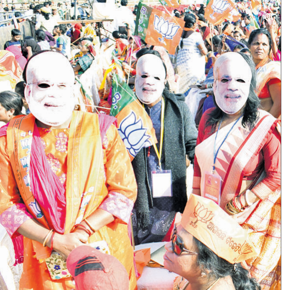
ସମାବେଶରେ ମୋଦିଙ୍କ ମୁଖା ପିନ୍ଧିଥିବା ଭାଜପା ମହିଳା କର୍ମୀ।