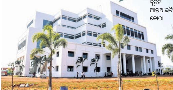
ନୂତନ ଆଇଆଇଟି କୋଠା।