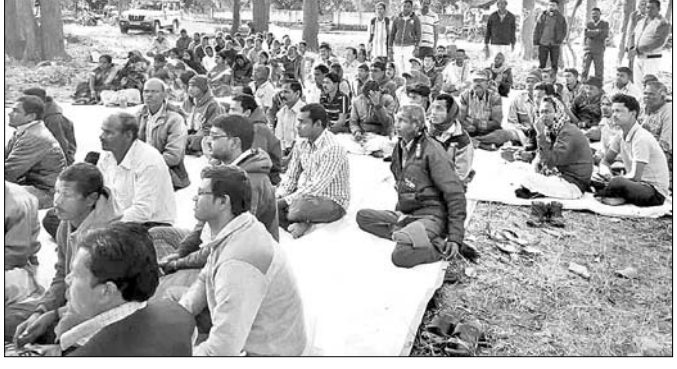
କାର୍ଯ୍ୟକ୍ରମରେ ଯୋଗ ଦେଇଥିବା ଗାଁ ସାଥୀ ଓ ମେଟ୍ଟିଙ୍ଗ୍