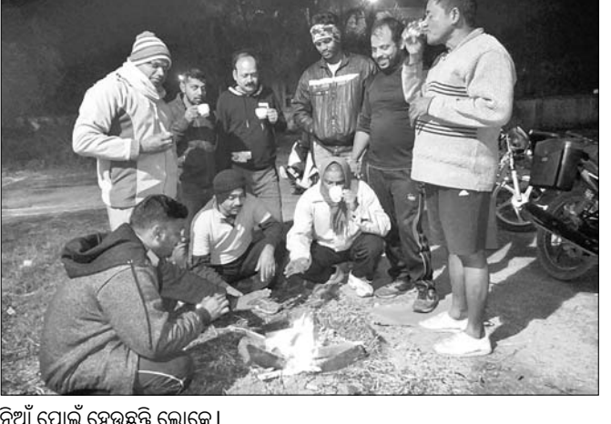
ନିଆଁ ପୋଇଁ ହେଉଛନ୍ତି ଲୋକେ।

ସେଣ୍ଟିଗ୍ରେଡ଼। ଶୁକ୍ରବାର ତାପମାତ୍ରା ୧୦ ଡିଗ୍ରୀ ଉପରେ ଥିବା ବେଳେ ହଠାତ ପାରଦ କ୍ରମଶଃ ତଳକୁ ଖସି ଆସିଛି। ଜନଜୀବନ ବ୍ୟତିଷାପ୍ତ ହୋଇ ପଡ଼ିଛି। ସହର ତଳ ତଥା ଗ୍ରାମାଞ୍ଚଳ ଓ ପାହାଡ଼ିଆ ଅଞ୍ଚଳରେ ତାପମାତ୍ରା ପାଖାପାଖି ୬ ଡିଗ୍ରୀ ତଳକୁ ରହିଥିବା ଅନୁମାନ କରାଯାଇଛି। ପ୍ରବଳ ଅଣ୍ଡାରେ ଅସୁବିଧା ଭୋଗୁଛନ୍ତି।