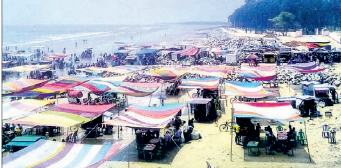
ତାଳସାରୀ ଓ ଉଦୟପୁର ବେଳାଭୂମିରେ ପର୍ଯ୍ୟଟକଙ୍କ ଭିଡ଼

ମଙ୍ଗଳବାର ବଡ଼ଦିନ। ଏଥିମଧ୍ୟରେ ଓଡ଼ିଶାର ସମସ୍ତ ସୈକତ ଉଦୟପୁର, ତାଳସାରୀ, ବିଚିତ୍ରପୁର-ଖଡ଼ିବିଲ୍ ଇତ୍ୟାଦି ଭୂମିକିମ୍ପ ସହିତ 'ଦୀଦା' ବେଳାଭୂମିରେ ଲକ୍ଷାଧିକ ପର୍ଯ୍ୟଟକଙ୍କ ଆଗମନ ହୋଇଛି। ଦୀଦାରେ ସହସ୍ରାଧିକ ହୋଟେଲ, ତାଳସାରୀ ଓ ବି.ଡି.ସି.ରେ ଆଧୁନିକ ବିଦ୍ୟୁତ୍ ରଙ୍ଗବେରଙ୍ଗର ଆଲୋକମାଳାରେ ପର୍ଯ୍ୟଟକମାନଙ୍କୁ ଆକୃଷ୍ଟ ପାଇଁ ସଜ୍ଜିତ କରାଯାଇଛି। ରବିବାର ଓ ସୋମବାର ସରକାରୀ ଛୁଟି ଥିବାରୁ ପର୍ଯ୍ୟଟକମାନେ ଦୂରଦୂରାନ୍ତରୁ ଏଠାକୁ ଆସିଛନ୍ତି। ଜଳେଶ୍ୱର-ଚନ୍ଦନେଶ୍ୱର-ବର୍ତ୍ତର ରାସ୍ତା ଚାରିଦିନିଆ ଯାନର ଲମ୍ବା ଲାଇଟ୍ ଲାଗିଛି। ଆଜିଠୁ ଓଡ଼ିଶାର ଅନନ୍ୟ ବେଳାଭୂମି ତାଳସାରୀ, ଉଦୟପୁର ଖାଉଁ ଜଙ୍ଗଲରେ ଭୋଜିଭାତ, ପାନୀୟର ଆସର ଜମିଛି। ଏଥିସହିତ ପ୍ରସିଦ୍ଧ ଶ୍ରେଣୀପୀଠ ଚନ୍ଦନେଶ୍ୱର ମହାଦେବ, ସର୍ବବୃହତ୍