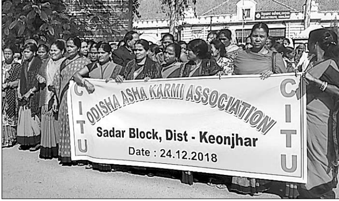
ଆଶା କର୍ମାମାନେ ବିକ୍ଷୋଭ କରୁଛନ୍ତି।