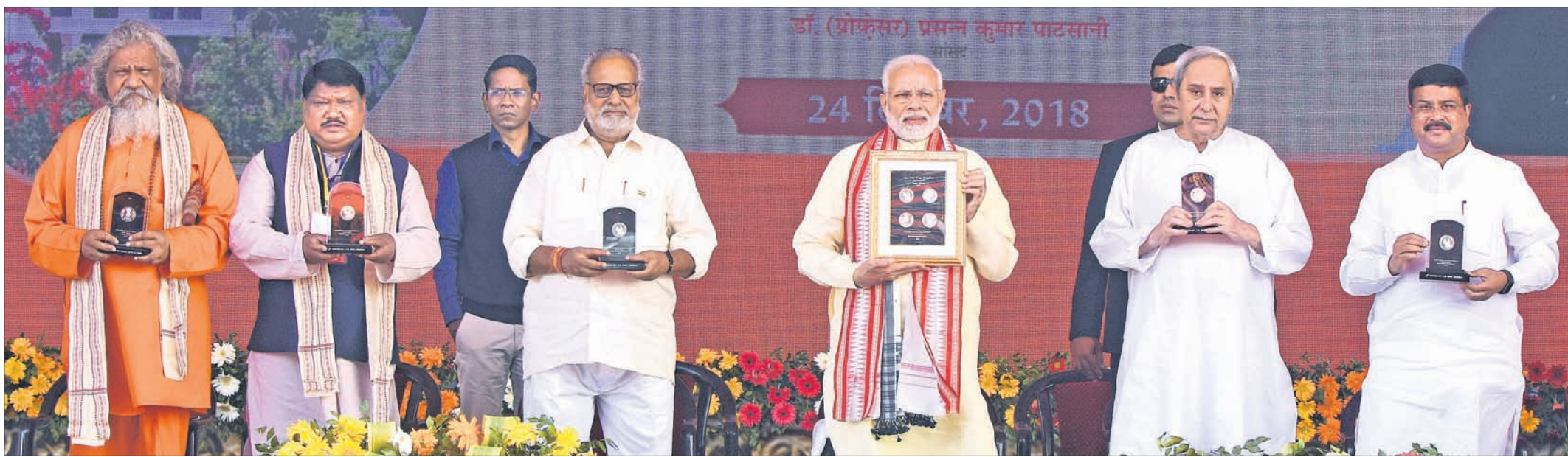
ଅଭ୍ୟୁଦୟ ଆଇଆଇଟି କ୍ୟାମ୍ପସରେ ଆୟୋଜିତ ସମାରୋହରେ ପ୍ରଧାନମନ୍ତ୍ରୀ ନରେନ୍ଦ୍ର ମୋଦି, ରାଜ୍ୟପାଳ ଗଣେଶୀ ଲାଲ, ମୁଖ୍ୟମନ୍ତ୍ରୀ ନବୀନ ପଟ୍ଟନାୟକ, କେନ୍ଦ୍ରମନ୍ତ୍ରୀ ଧର୍ମେନ୍ଦ୍ର ପ୍ରଧାନ, କୁସଲ ଓରାମ ଓ ଭୁବନେଶ୍ୱର ଏମ୍ପି ପ୍ରଦୀପ ପାଟ୍ଟନାୟକ ପାଇକ ବିଦ୍ରୋହ ସ୍ମାରକ ମୁଦ୍ରା ଉଦ୍ଘାଟନ କରୁଛନ୍ତି।

ଓଡ଼ିଶାର ବିକାଶ ପାଇଁ ଆମେ ସଂକଳ୍ପବଦ୍ଧ। ଏ ଦିଗରେ ଅଧିକ ପାଦେ ଆଗକୁ ଯାଇ ୧୪ହଜାର କୋଟିରୁ ଅଧିକ ଟଙ୍କାର ପ୍ରକଳ୍ପକୁ ଶିଳାନ୍ୟାସ ଓ ଲୋକାର୍ପିତ କରାଯାଇଛି। ଏହି ପ୍ରକଳ୍ପ ମଧ୍ୟରେ ଉଚ୍ଚଶିକ୍ଷା, ସ୍ୱାସ୍ଥ୍ୟ, ଗ୍ୟାସ୍ ଯୋଗାଣ, ସଡ଼କ ଓ ସାଂସ୍କୃତିକ ଐତିହ୍ୟ ପରିଯୋଜନା ଆଦି ରହିଛି। ଓଡ଼ିଶାର ପ୍ରଗତି ଓ ଜନଜୀବନକୁ ସୁଗମ କରିବାରେ ଏହିସବୁ ଯୋଜନା ମହତ୍ତ୍ୱପୂର୍ଣ୍ଣ ଭୂମିକା ଗ୍ରହଣ କରିବ। ନୂଆ ଭାରତର ବିକାଶରେ ଓଡ଼ିଶା ଇଞ୍ଜିନ ହେବ ବୋଲି ପ୍ରଧାନମନ୍ତ୍ରୀ ନରେନ୍ଦ୍ର ମୋଦି କହିଛନ୍ତି। ଅଭ୍ୟୁଦୟ ଆଇଆଇଟି କ୍ୟାମ୍ପସ ପରିସରରେ ଯୋଗଦାନ ପ୍ରଧାନମନ୍ତ୍ରୀ ମୋଦି ଭିତ୍ତି ଓ କନଫେରେନ୍ସ କରିଥାରେ ୧୪ହଜାର ୫୨୩କୋଟି ଟଙ୍କାର ବିଭିନ୍ନ ପ୍ରକଳ୍ପ ଶିଳାନ୍ୟାସ ଓ ଉଦ୍ଘାଟନ କରିଛନ୍ତି। ସେଥିମଧ୍ୟରେ ଆଇଆଇଟିର ନୂତନ କ୍ୟାମ୍ପସ୍, ଇଏସଆଇ ହସ୍ପିଟାଲର ଶଯ୍ୟା ବୁକ୍, ଲଳିତଗିରି ପ୍ରତ୍ନତାତ୍ତ୍ୱିକ ସଂଗ୍ରହାଳୟ ଉଦ୍ଘାଟିତ ହୋଇଛି। ସେହିପରି ପାଇକ ବିଦ୍ରୋହ ସ୍ମାରକ ମୁଦ୍ରା ଓ ତାକଟିକତା ଉଦ୍ଘାଟିତ ହୋଇଥିବାବେଳେ ଉତ୍କଳ ବିଶ୍ୱବିଦ୍ୟାଳୟରେ ବକ୍ସି ଜଗବନ୍ଧୁ ଗବେଷଣା ଚେୟାର ସ୍ଥାପନ କରାଯାଇଛି। ୪୫୦୦ କୋଟି ଟଙ୍କାର ସଡ଼କ ପ୍ରକଳ୍ପର ଆଧାରଶିଳା ସ୍ଥାପନ ସାଙ୍ଗକୁ ଗ୍ୟାସ୍ ପାଇପଲାଇନ ପ୍ରକଳ୍ପର ଶିଳାନ୍ୟାସ ମଧ୍ୟ କରାଯାଇଛି।