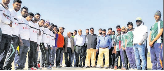
ଖେଳାଳିଙ୍କ ଗହଣରେ ଅତିଥି

ପ୍ରଧାନ ପ୍ରମୁଖ ଯୋଗଦେଇଥିଲେ। ୧୫ ଓଭର ବିଶିଷ୍ଟ ଏହି ମ୍ୟାଚ୍‌ରେ ବେଙ୍ଗାଲ ଟାଇଗର ଓ ବୁଲେଟ୍ ମଧ୍ୟରେ ପ୍ରଥମ ମ୍ୟାଚ୍ ଅନୁଷ୍ଠିତ ହୋଇଥିଲା। ଏଥିରେ ବେଙ୍ଗାଲ ଟାଇଗର ବିଜୟୀ ହୋଇଥିଲା। ସେହିପରି ଦ୍ୱିତୀୟ ମ୍ୟାଚ୍‌ରେ ହିଁ ମାଲକ୍ ଓ ବୁଲେଟ୍-୧୧ ମଧ୍ୟରେ ମ୍ୟାଚ୍ ଅନୁଷ୍ଠିତ ହୋଇଥିଲା। ଏଥିରେ ବୁଲେଟ୍-୧୧ ବିଜୟୀ ହୋଇଥିଲା। ମ୍ୟାଚ୍ ଅଫ୍ ଦି ମ୍ୟାଚ୍ ଭାବେ ଅଞ୍ଜନ କୁମାର ବେହେରାଙ୍କୁ ଦେବକୃତ ବେହେରା ପୁରସ୍କୃତ କରିଥିଲେ। ଏହି ମ୍ୟାଚ୍‌କୁ ଅଭୟ କୁମାର ଦଳାଳି ଓ ସୁରେନ୍ଦ୍ର ସେନା ପରିଚାଳନା କରିଥିଲେ।