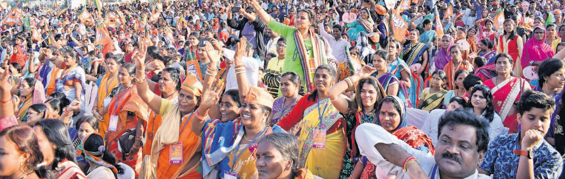
ସୋମବେଳେ ଥିବା ଭାଜପା କର୍ମୀ, ସମର୍ଥକ।