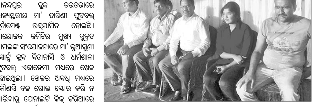
ପୁଟବଲ୍ ମ୍ୟାଚ୍ରେ ଯୋଗ ଦେଇଥିବା ଅତିଥି ।