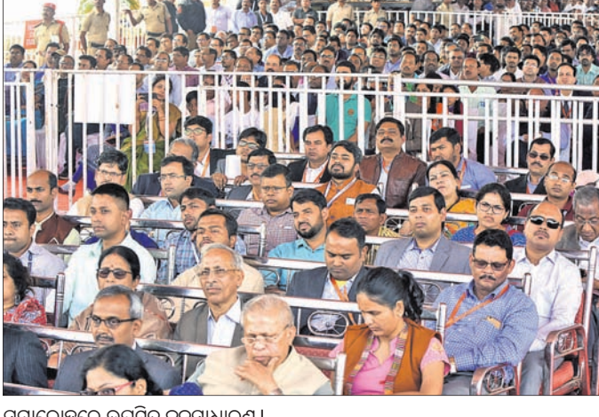
ସମାରୋହରେ ଉପସ୍ଥିତ ଜନସାଧାରଣ।

ମହାନ ସନ୍ତାନ ଥିଲେ। ତାଙ୍କ ବୀରତ୍ୱ ଓ ବଳିଦାନର ଚିତ୍ରଣ ନାହିଁ। ବରୁଣେଇରେ ପାଇକ ବିଦ୍ରୋହର ସ୍ମାରକ ପାଇଁ ରାଜ୍ୟ ସରକାର ମାଗଣାରେ ଜମି ଯୋଗାଇଦେବେ। ପାଇକ ବିଦ୍ରୋହ ସାରା ଦେଶରେ ଚିରସ୍ମରଣୀୟ। ପାଇକ ସଂଗ୍ରାମକୁ ପ୍ରଥମ ସ୍ୱାଧୀନତା ସଂଗ୍ରାମ ମାନ୍ୟତା ପ୍ରଦାନ କରାଯାଉ। ଏହା ପାଇକମାନଙ୍କ ପାଇଁ ପ୍ରକୃତ ଶ୍ରଦ୍ଧାଞ୍ଜଳି ହେବ ବୋଲି ସେ କହିଛନ୍ତି। ଏହି କାର୍ଯ୍ୟକ୍ରମରେ ରାଜ୍ୟପାଳ ଗଣେଶୀ ଲାଲ, କେନ୍ଦ୍ରମନ୍ତ୍ରୀ ଧର୍ମେନ୍ଦ୍ର ପ୍ରଧାନ ଓ କୁସଲ ଓରାମଙ୍କ ସମେତ ଭୁବନେଶ୍ୱର ଏମ୍ପି ପ୍ରଦୀପ ପାଟ୍ଟନାୟକ ଉପସ୍ଥିତ ଥିଲେ। କେନ୍ଦ୍ରମନ୍ତ୍ରୀ ପ୍ରଧାନ ସ୍ୱାଗତ ଭାଷଣରେ କହିଛନ୍ତି, ଏହି ମାଟିରୁ ଓଡ଼ିଶା ବିକାଶର ନୂତନ ଅଧ୍ୟାୟ ଆରମ୍ଭ ହେବାକୁ ଯାଉଛି। ଏହାର ଅଂଶ ସ୍ୱରୂପ ପ୍ରଧାନମନ୍ତ୍ରୀ ୧୪ ହଜାର କୋଟି ଟଙ୍କାରୁ ଅଧିକ ମୂଲ୍ୟର ପ୍ରକଳ୍ପମାନ ଶୁଭାରମ୍ଭ କରୁଛନ୍ତି। କେନ୍ଦ୍ର ସରକାର ୪ର୍ଥ ଶିକ୍ଷିତ ବିପ୍ଳବକୁ ପଞ୍ଚମ ପିଢ଼ି ଆଡ଼କୁ ଅଗ୍ରସର ହେଉଛନ୍ତି। ଓଡ଼ିଶାର ବିକାଶରେ ପ୍ରଧାନମନ୍ତ୍ରୀଙ୍କ ଭବିଷ୍ୟଦୃଷ୍ଟି ସ୍ପଷ୍ଟପୂର୍ଣ୍ଣ ଭୂମିକା ନିଭାଇବ ବୋଲି ସେ କହିଛନ୍ତି।