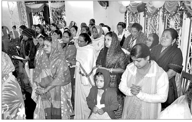
ଶ୍ରୀକୃଷ୍ଣପର୍ବମାଳାରେ ସାମୁହିକ ପ୍ରାର୍ଥନା କରୁଛନ୍ତି।

ମଙ୍ଗଳବାର ପବିତ୍ର ବଡ଼ଦିନ। ବଡ଼ଦିନର ଅବ୍ୟବହୃତ ପୂର୍ବରୁ ସୋମବାର ମଧ୍ୟରାତ୍ରରେ ପୂଜା ସମ୍ପନ୍ନ କରିବାକୁ ପୁଣି ଯିଶୁଙ୍କ ଜନ୍ମଦିନ ପାଳନ କରାଯାଇଥିଲା।