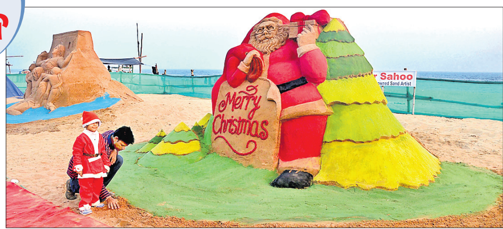
ଶ୍ରୀକ୍ଷମାସ ଅବସରରେ ପୁରୀ ବେଳାଭୂମିରେ ଶିଶୁ ମାନସ ରଞ୍ଜନ ସାହୁ ବାଲୁକା କଳା ମାଧ୍ୟମରେ ଶାନ୍ତିର ବାର୍ତ୍ତା ଦେଉଛନ୍ତି।