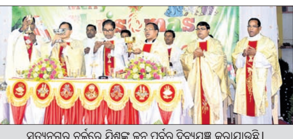
ସତ୍ୟନଗର ଚର୍ଚ୍ଚକ ଯିଶୁଙ୍କ ଜନ୍ମ ପୂର୍ବରୁ ବିଦ୍ୟାୟତ୍ନ କରାଯାଇଛି।

ଅପରାହ୍ଣ ୫ଟାକୁ ରାତି ୯ଟା ପର୍ଯ୍ୟନ୍ତ ସାମ୍ପ୍ରତିକ କାର୍ଯ୍ୟକ୍ରମ ଅନୁଷ୍ଠିତ ହେବ। ସେହିଭଳି ଯୁନିଟ୍-୮, ବରପୁଣ୍ଡା ଆଦି ଗ୍ରାମରେ ଥିବା ଚର୍ଚ୍ଚକ ମଧ୍ୟ ବଡ଼ଦିନ ପାଇଁ ସ୍ୱତନ୍ତ୍ର କାର୍ଯ୍ୟକ୍ରମ ଆୟୋଜନ କରାଯାଇଛି।