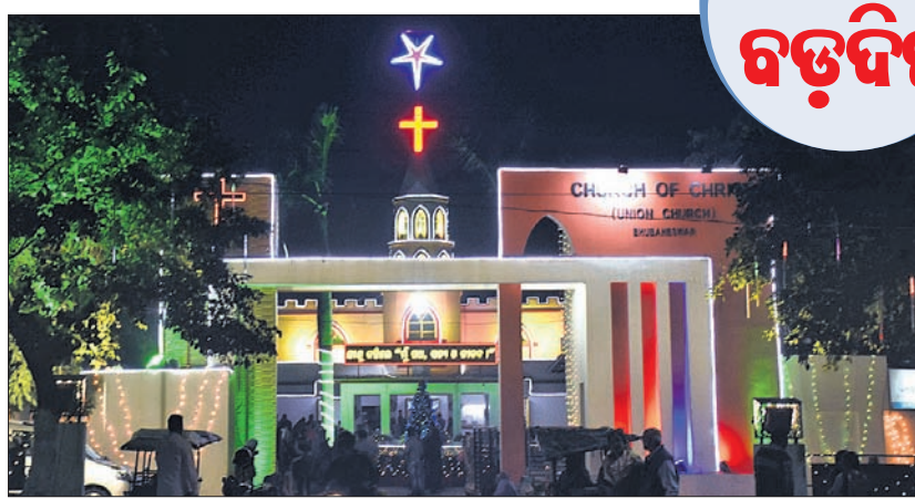
ବଡ଼ଦିନ ପାଇଁ ଭୁବନେଶ୍ୱର ଯୁନିଟ୍-୪ ଚର୍ଚ୍ଚକ ରଞ୍ଜିତ ଆଲୋକମାଳାରେ ସଜାଯାଇଛି।

ବେରମାନା ହେଉଛି ସମସ୍ତ ପାପର ଜନନୀ - ଶିଶୁଟି ସାଜବାବା