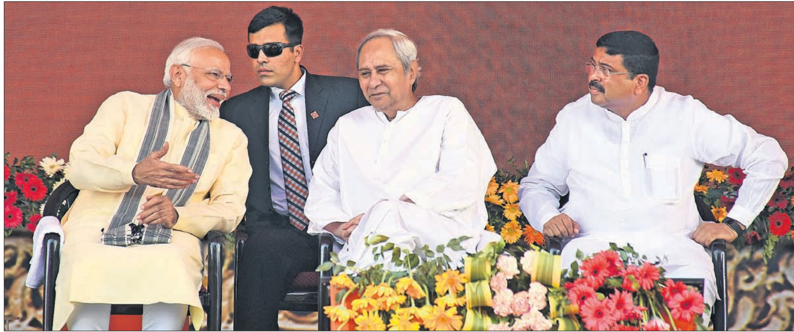
ଆଇଆଇଟି କ୍ୟାମ୍ପସ୍ରେ ସୋପନାର ବିଭିନ୍ନ ପ୍ରକଳ୍ପର ଶିଳାମାଧ୍ୟାୟ ଓ ଲୋକାର୍ପଣ ଉତ୍ସବରେ ପ୍ରଧାନମନ୍ତ୍ରୀ ନରେନ୍ଦ୍ର ମୋଦି, ମୁଖ୍ୟମନ୍ତ୍ରୀ ନବୀନ ପଟ୍ଟନାୟକ ଓ କେନ୍ଦ୍ରମନ୍ତ୍ରୀ ଅର୍ଜୁନ ପ୍ରଧାନ। (ରିପୋର୍ଟ ପୃଷ୍ଠା-୧୦)

କଲିକତା ଅଭିନେତ୍ରୀ ଚାପିକା ପାଠୁକୋନ୍ 'ଛପକ'ରେ ଅଭିନୟ ପାଇଁ ଉତ୍ସାହିତ ହୋଇପଡ଼ିଛନ୍ତି।