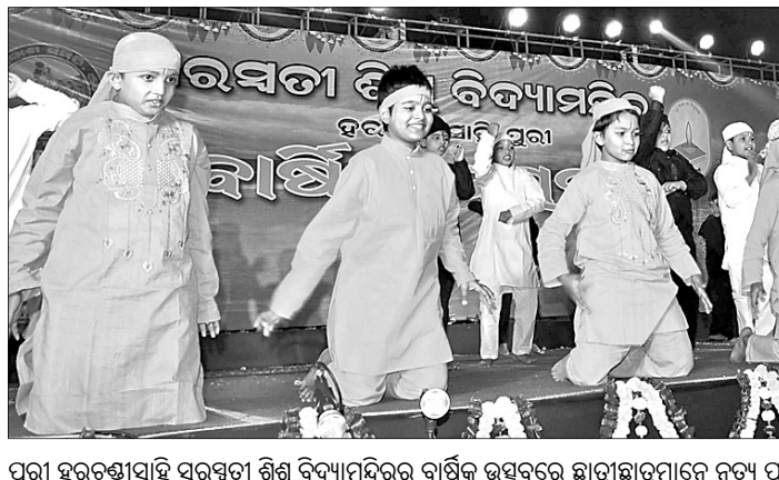
ପୂଜା ସମ୍ପନ୍ନ ହେବା ପରେ ଶିଶୁ ବିଦ୍ୟାଳୟର ବାର୍ଷିକ ଉତ୍ସବରେ ଛାତ୍ରଛାତ୍ରୀମାନେ ନୃତ୍ୟ ପରିବେଷଣ କରୁଛନ୍ତି।

ସାମାଜିକ ସଂସ୍କୃତି, ପାରିବାରିକ ବୃଦ୍ଧମାନଙ୍କୁ ସମ୍ମାନ ଦେବା ଓ ସମ୍ମାନ ଦେବାକୁ ପ୍ରୋତ୍ସାହିତ କରିବା ପାଇଁ 'ଜେଜେମା' ଓ 'ଜେଜେବାପା' ସମାଜର ସମ୍ପଦ ହେବ।