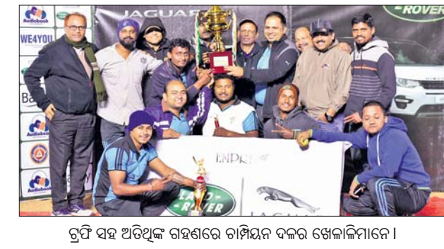
ତ୍ରିପ୍ତି ସହ ଅତିଥିକ ଗ୍ରହଣରେ ଗଞ୍ଜାମ ଦଳର ଖେଳାଳିମାନେ ।