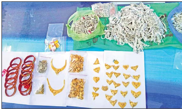
ଜବତ ସୁନା, ରୂପା ଅଳଙ୍କାର ।