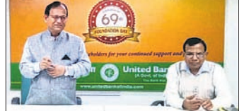
ୟୁନାଇଟେଡ ବ୍ୟାଙ୍କର ୬୯ତମ ପ୍ରତିଷ୍ଠା ଦିବସ ପାଳିତ ହୋଇ ଯାଇଛି।