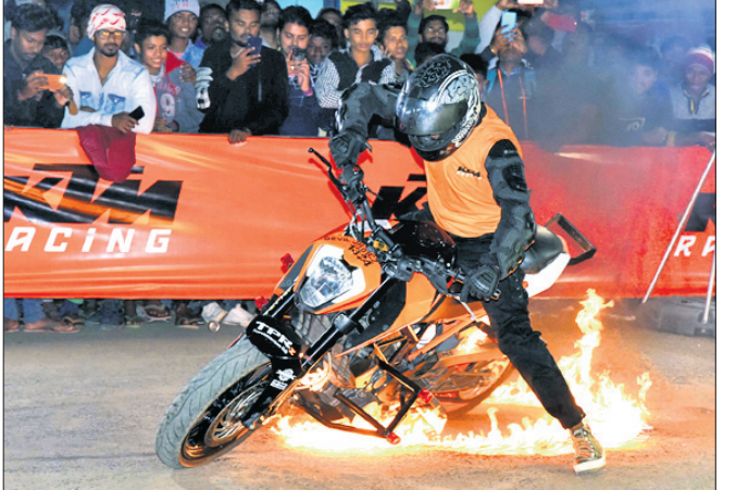
କେଟିଏମ୍ ପକ୍ଷରୁ ବାଲେଶ୍ୱର ନୂଆ ବସ୍ତୁଖଣ୍ଡରେ ଆକର୍ଷଣୀୟ ଷ୍ଟଣ୍ଟ ଶୋ' ଆୟୋଜନ କରାଯାଇଛି।

କେଟିଏମ୍ ପକ୍ଷରୁ ବାଲେଶ୍ୱର ନୂଆ ବସ୍ତୁଖଣ୍ଡରେ ଆକର୍ଷଣୀୟ ଷ୍ଟଣ୍ଟ ଶୋ' ଆୟୋଜନ କରାଯାଇଛି। ଏଥିରେ ପ୍ରଦର୍ଶନୀଳା ଷ୍ଟଣ୍ଟ ପ୍ରଦର୍ଶନକାରୀ ଭାବେ ନେବା ସହ ଷ୍ଟଣ୍ଟ ପ୍ରଦର୍ଶନ କରିଥିଲେ। କାର୍ଯ୍ୟକ୍ରମରେ ଦର୍ଶକ ଓ ବାଲକପ୍ରେମୀମାନେ ନୂତନ ଭାବେ ଉନ୍ମୋଚିତ ହୁଏତ ୧୨୫ ଏଡିଏସ୍ ମଡେଲକୁ ଦେଖିବାକୁ ପାଇଥିଲେ।