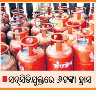
ସର୍ବସିଡିମୁକ୍ତରେ ୬୮ଟଙ୍କା ହ୍ରାସ

କେନ୍ଦ୍ର ସରକାର ରୋଷେଇ ଗ୍ୟାସ୍ ବ୍ୟବହାରକାରୀଙ୍କୁ ଏହାକୁ ବଦଳାଇ ଦେବାକୁ ନିର୍ଦ୍ଦେଶ ଦେଇଛନ୍ତି। ଚଳିତ ବର୍ଷ କମ୍ପାନୀଗୁଡ଼ିକ ଯୋଗ୍ୟର ସର୍ବସିଡିମୁକ୍ତ ଓ ଅଣସର୍ବସିଡିମୁକ୍ତ ଏଲ୍ପିଜି ବିକ୍ରି କରିବାକୁ ନିର୍ଦ୍ଦେଶ ଦେଇଛନ୍ତି।