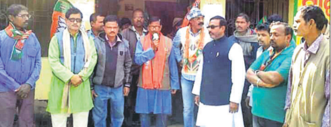
ଭାଙ୍ଗପା କୃଷକ ମୋର୍ଚ୍ଚା ପକ୍ଷରୁ ଘେରାଉ କରାଯାଇଛି।