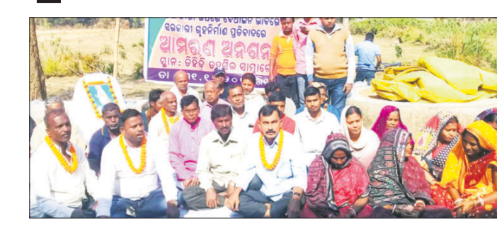
ଉପସ୍ଥାପନ କରୁଛି ଗ୍ରାମବାସୀ ଅନଶନରେ ବସିଛନ୍ତି।