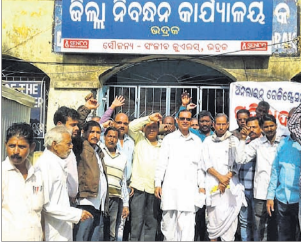
ଜିଲ୍ଲା ନିବନ୍ଧନ କାର୍ଯ୍ୟକ୍ରମ ଆରମ୍ଭରେ ମୋହରୀର ସଂଘର କର୍ମକର୍ମୀ।