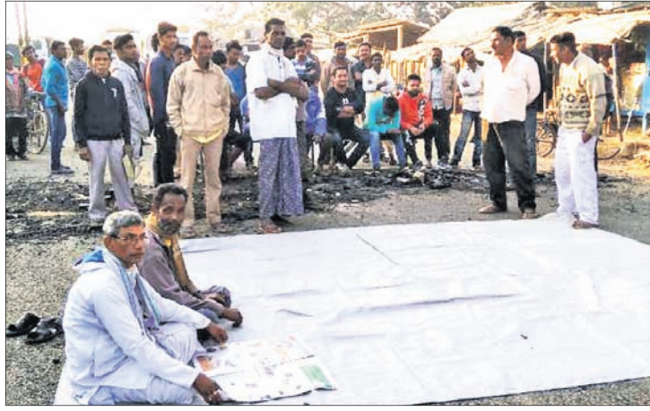
ଭଦ୍ରକ-ଆନନ୍ଦପୁର ରାସ୍ତାକୁ ଲୋକେ ଅବରୋଧ କରିଛନ୍ତି।

ଭଦ୍ରକ-ଆନନ୍ଦପୁର ୫୩ ନମ୍ବର ରାଜ୍ୟ ରାଜପଥର ଗଣିକାଙ୍ଗ ବଜାର ଅଞ୍ଚଳ ରାସ୍ତାରେ କାର୍ଯ୍ୟ ଆରମ୍ଭ ପୂର୍ଣ୍ଣ ହୋଇଛି। ନିମ୍ନମାନର ନିର୍ମାଣ କାର୍ଯ୍ୟ ପ୍ରତିବାଦରେ ସ୍ଥାନୀୟ ଶତାଧିକ ଲୋକେ କାର୍ଯ୍ୟକୁ ବନ୍ଦ କରିବା ସହ ଗଣିକାଙ୍ଗ ବଜାର ରାସ୍ତା ଉପରେ ସୋମବାର ଅପରାହ୍ନରେ ଆନ୍ଦୋଳନ କରିଥିଲେ।