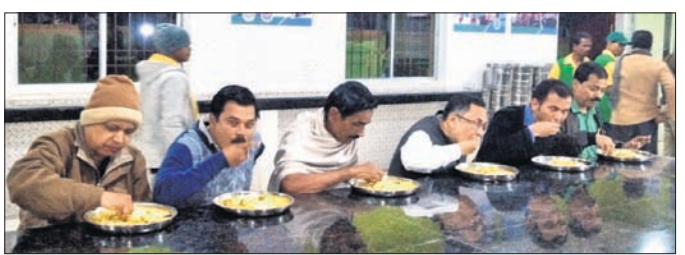
ଆହାର କେନ୍ଦ୍ରରେ ବିଧାୟକ ଓ ଉପଜିଲ୍ଲାପାଳ ବସି ଭୋଜନ କରୁଛନ୍ତି।

ନୀଳଗିରି ତାଳୁକାରେ ଖୋଲିଲେ ରାଜିନିଆର ଆହାର କେନ୍ଦ୍ରରେ ଘୋଷଣା କରାଯାଇଛି। ଘଟଣାରେ ଆହତ ଲୋକଙ୍କୁ ଚିକିତ୍ସା ପାଇଁ ସାମାଜିକ କର୍ମୀମାନଙ୍କୁ ଯୋଗାଯୋଗ କରିବାକୁ ପଡ଼ିଥିଲା।