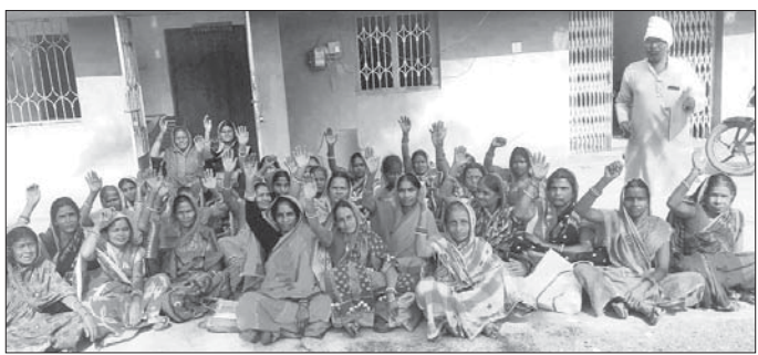
ଗ୍ରାମବାସୀ ଧାରଣାରେ ବସିଛନ୍ତି।

ଆତଙ୍କିୟତା କେନାଲ ଖୋଳା ପରେ ଖଜୁରା ବ୍ଲକ୍ ସାମାଜିକ କର୍ମୀମାନଙ୍କୁ ଯୋଗାଯୋଗ କରିବାକୁ ପଡ଼ିଥିଲା। ଘଟଣାରେ ଆହତ ଲୋକଙ୍କୁ ଚିକିତ୍ସା ପାଇଁ ସାମାଜିକ କର୍ମୀମାନଙ୍କୁ ଯୋଗାଯୋଗ କରିବାକୁ ପଡ଼ିଥିଲା।