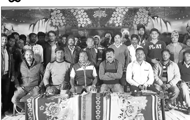
ନେସ୍କୋ ସୁନିୟମ ବୈଠକରେ ଉପସ୍ଥିତ କର୍ମଚାରୀ।

ବଡ଼ସାହି, ୩୧୧୨୨ (ସ.ପ୍ର.): ବଡ଼ସାହି ଠାରେ ନେସ୍କୋ ପାଖାର ଏମ୍ପ୍ଲୟିଜ୍ ସୁନିୟମ ଉଦ୍ଘାଟନା ଉତ୍ସବରେ ଉପସ୍ଥିତ କର୍ମଚାରୀଙ୍କୁ ନେସ୍କୋ ପାଖାର ଏମ୍ପ୍ଲୟିଜ୍ ସୁନିୟମ ଉଦ୍ଘାଟନା କରାଯାଇଛି। ଏହି ଉତ୍ସବରେ କର୍ମଚାରୀଙ୍କୁ ନେସ୍କୋ ପାଖାର ଏମ୍ପ୍ଲୟିଜ୍ ସୁନିୟମ ଉଦ୍ଘାଟନା କରାଯାଇଛି।