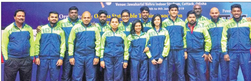
ଜାତୀୟ ସିନିୟର ଟେଷ୍ଟ ଦଳ ପ୍ରକାଶନ ଓଡ଼ିଶା ଦଳ ।