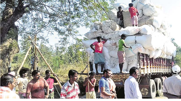
ଆନ୍ଧ୍ରକୁ ଚାଷୀ ପାଇଁ ଟ୍ରକରେ କପାବସ୍ତା ଲାଦାଉଛନ୍ତି।

ଦୁଇ କୁଇଣ୍ଟାଲ ମଧ୍ୟରେ ସାମିତ ରହିଛି। ଗୋଟିଏ ଏକର କପାଗଣ ପାଇଁ ଚାଷୀମାନେ ପ୍ରାୟ ୧୦୦ ୧୨୫ଟି ଟଙ୍କା ଖର୍ଚ୍ଚ କରୁଛନ୍ତି। ଏହି ଆନ୍ଧ୍ରକୁ ପଢ଼ାଣା ଆନ୍ଧ୍ର ରାଜ୍ୟର ବ୍ୟବସାୟୀମାନେ ଆସି ଚାଷୀମାନଙ୍କର କପା କୁଇଣ୍ଟାଲ ପିଛା ୫୫ଟି ୨୫ଟି ଟଙ୍କାରେ କିଣି ନେଉଛନ୍ତି। ଯାହାକି ଉଚିତ୍ ବଜାର ଦରଠାରୁ କ୍ଷେତ୍ର କମ୍। ଫଳରେ ଚାଷୀମାନେ ଚାଷରେ ବିନିଯୋଗ କରିଥିବା ଅର୍ଥ ମଧ୍ୟ ପାଇପାରୁ ନାହାନ୍ତି। କ୍ଷତିରେ ପଡ଼ିଥିବା କପାଗଣା ମୁଣ୍ଡରେ ହାତ ଦେଇଛନ୍ତି। ଅନ୍ୟପକ୍ଷରେ ସରକାରଙ୍କ ପକ୍ଷରୁ କପା କିଣିବା ପାଇଁ କୌଣସି ମଣି ବ୍ୟବସ୍ଥା ନ ଥିବାରୁ ଚାଷୀମାନେ ଅମଳରେ କ୍ଷତି ସହିବାବେଳେ ଏବେ ବିକିବା ପାଇଁ ସମସ୍ୟାରେ ପଡ଼ିଛନ୍ତି। ସେମାନଙ୍କ ଆର୍ଥିକ ମେରୁଦଣ୍ଡ ଭାଙ୍ଗିପଡ଼ିଛି। ଏଥିପ୍ରତି ସ୍ଥାନୀୟ ପ୍ରଶାସନ ଦୃଷ୍ଟି ଦେବାକୁ ଦାବି ହୋଇଛି। ସରକାର ଯଦି ବ୍ୟବସ୍ଥିତ ଭାବରେ ଚାଷୀଙ୍କଠାରୁ କପା କ୍ରୟକରି ଉଚିତ୍ ମୂଲ୍ୟ ପ୍ରଦାନ କରନ୍ତେ, ତେବେ ସେମାନେ ଉପକୃତ ହେବା ସହ ଗଜପତି ଜିଲ୍ଲାର କପା ବାହାର ରାଜ୍ୟକୁ କମ୍ ମୂଲ୍ୟରେ ଯା'ତା ନାହିଁ ବୋଲି ସ୍ଥାନୀୟ କପାଗଣୀମାନେ ମତ ଦେଇଛନ୍ତି।