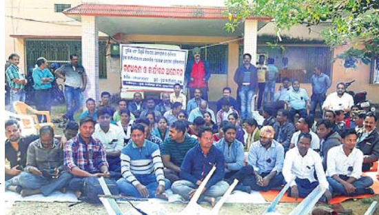
କର୍ମଚାରୀମାନେ କାର୍ଯ୍ୟବନ୍ଦ କରି ଧାରଣାରେ ବସିଛନ୍ତି।