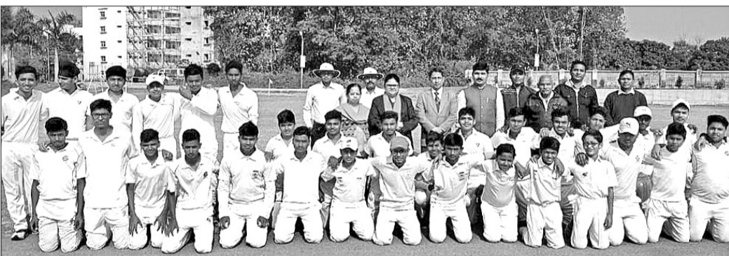
ଗୁରୁବାର ସମ୍ବଲପୁର ବିକାଶ ସ୍ଫୁଲ୍ଲ ପଡ଼ିଆରେ କ୍ରିକେଟ ମ୍ୟାଚ ପୂର୍ବରୁ ଅତିଥିଙ୍କ ସହ ଖେଳାଳିମାନେ ।

ସିବିଏସ୍ ସହସାୟକ ଆନ୍ତର୍ଜାତୀୟ କ୍ରିକେଟ ଚୁର୍ଣ୍ଣାମେଣ୍ଟ ଗୁରୁବାର ଶାସନସ୍ଥିତ ବିକାଶ ବ୍ଲକ୍ କମ୍ପ୍ଲେକ୍ସରେ ଉଦଘାଟିତ ହୋଇଯାଇଛି ।