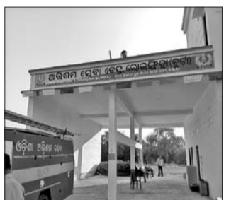
ଲୋଇସିଂହା ଅଗ୍ନିଶମ ନୂତନ କାର୍ଯ୍ୟାଳୟ।

ବଲାଙ୍ଗୀର ଜିଲା ଲୋଇସିଂହା(ବୁର୍ତ୍ତା) ଅଗ୍ନିଶମ କାର୍ଯ୍ୟାଳୟ ନୂତନ କୋଠାର ପ୍ରତିଷ୍ଠା ସମାବେଶ ନବବର୍ଷ ଦିନ ସମ୍ପନ୍ନ ହୋଇଯାଇଛି। ବିଭାଗୀୟ ଜିଲା ଅଧିକାରୀଙ୍କ ନିର୍ଦ୍ଦେଶକ୍ରମେ ପ୍ରତିଷ୍ଠା ସମାବେଶ ପରେ ନୂତନ କୋଠାରେ କାର୍ଯ୍ୟାରମ୍ଭ ହୋଇଛି। ଅପରପକ୍ଷେ ସରକାରୀଭାବେ କାର୍ଯ୍ୟାଳୟର ଉଦ୍ଘାଟନ କାର୍ଯ୍ୟକ୍ରମ ପରବର୍ତ୍ତୀ ସମୟରେ କରାଯିବ।