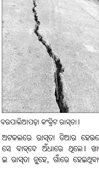
ବରପାଲିଆପଡ଼ା କଂକ୍ରିଟ ରାସ୍ତା।