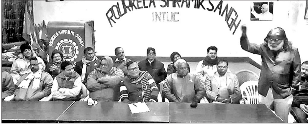
ମିଳିତ ଟ୍ରେଡ୍ ୟୁନିୟନ ବୈଠକରେ ଉପସ୍ଥିତ ଶ୍ରମିକ ସଂଘର କର୍ମକର୍ତ୍ତା।

କେନ୍ଦ୍ରୀୟ ଟ୍ରେଡ୍ ୟୁନିୟନ ତାକରାରେ ଆସନ୍ତା ୮ ଓ ୯ ତାରିଖରେ ସର୍ବଭାରତୀୟ ଧର୍ମାନ୍ତର ତଥା ହରତାଳ ନେଇ ରାଉରକେଲା ଶ୍ରମିକ ସଂଘ କାର୍ଯ୍ୟାଳୟରେ ଗୁରୁବାର ମିଳିତ ଟ୍ରେଡ୍ ୟୁନିୟନ ପକ୍ଷରୁ ଏକ ବୈଠକ ଅନୁଷ୍ଠିତ ହୋଇଯାଇଛି।