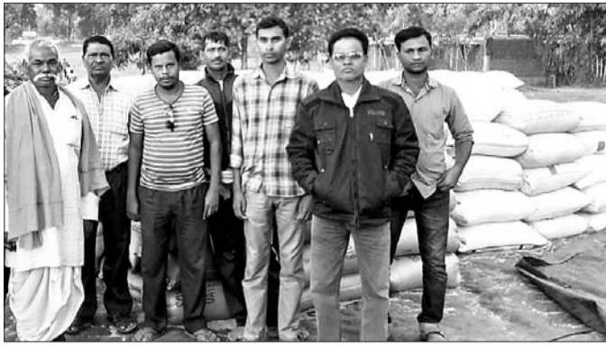
ଧାନ ଭିତର ଧାନ ଖପ୍ରାଖୋଲ ମଞ୍ଡିରେ ଗାଷୀମାନେ।

ବଲାଙ୍ଗୀର ଜିଲା ଖପ୍ରାଖୋଲ ବୁକ୍ ସଦର ମହକୁମା ପ୍ରାଥମିକ କୃଷି ସମବାୟ ସମିତି ଧାନ ମଞ୍ଡିରେ ବ୍ୟାପକ ଅବ୍ୟବସ୍ଥା ଦେଖିବାକୁ ମିଳିଛି। ଏକ ସପ୍ତାହ ହେଲେ ଗାଷୀ ଶହ ଶହ ବସ୍ତ୍ରାଧାର ମଞ୍ଡିରେ ରଖାଯାଇଛି।