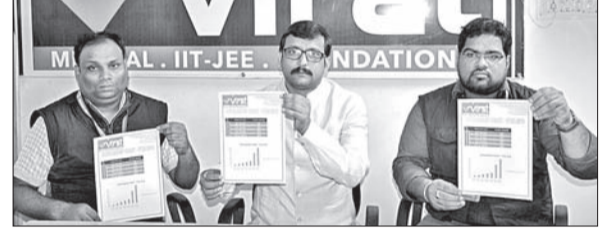
ବିରାଟ ଶିକ୍ଷାନୁଷ୍ଠାନ କର୍ତ୍ତୃପକ୍ଷ ମେଧାବୃତ୍ତି ପରୀକ୍ଷା ଫଳ ପ୍ରକାଶ କରୁଛନ୍ତି।