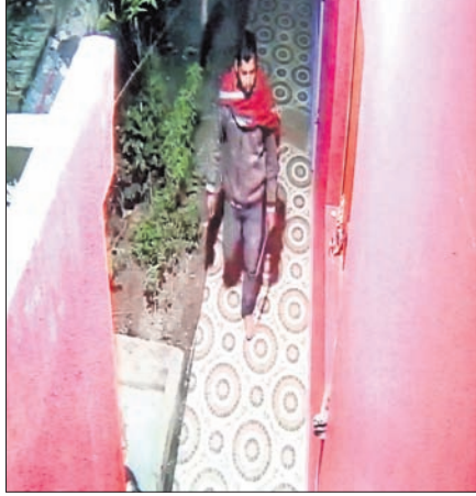
ସିସିଟିଭିରେ କଏଦ ହୋଇଥିବା ଲୁଚେରା ଫାଟକ ଡେଇଁ ଘରେ ପ୍ରବେଶ କରୁଛି।