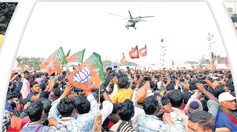
ହେଲିକପ୍ଟର ଅବତରଣ ପୂର୍ବରୁ ଉତ୍ସାହିତ କର୍ମୀ।

ନିଜର ବେଶ ପୋଷାକକୁ ନେଇ ଚର୍ଚ୍ଚାରେ ରହୁଥିବା ପ୍ରଧାନମନ୍ତ୍ରୀ ମୋଦିଙ୍କ ହାତ ଜ୍ୟାକେଟକୁ ଲୋକେ ମୋଦି ଜ୍ୟାକେଟ୍ ବୋଲି କହିଥାନ୍ତି। ଶନିବାର ମୋଦିଙ୍କ ସଭା ସ୍ଥଳ ନିକଟରେ ତଥା ଉପଜିଲ୍ଲାପାଳଙ୍କ ସରକାରୀ ବାସଭବନ ସମ୍ମୁଖରେ ଏହି ଜ୍ୟାକେଟ୍ ବିକ୍ରୟ ପାଇଁ ପସରା ମେଲାଣିରେ କଲିକତାରୁ ଆସିଥିବା କେତେକ ବ୍ୟବସାୟୀ। ଲୋକେ ମଧ୍ୟ ଏହାକୁ ଜିଣିବା ଲାଗି ଭିଡ଼ ଜମାଇଥିଲେ।