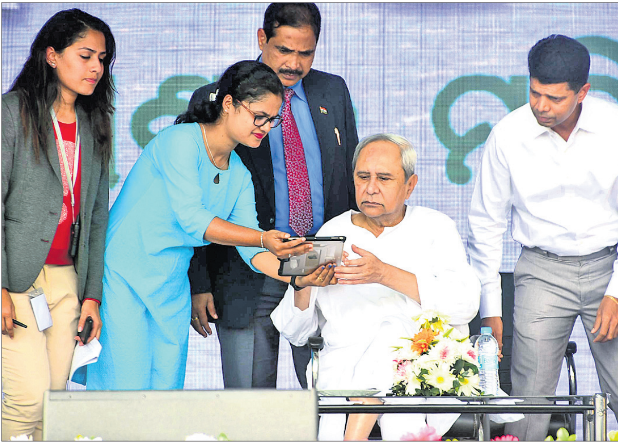
ପୁଞ୍ଜୀମନ୍ତ୍ରୀ ନବୀନ ପଟ୍ଟନାୟକ ପୁରୀ ଜିଲାର ଏସ୍‌ଏଚ୍‌ଇକୁ ସହାୟତା ରାଶି ବ୍ୟାଙ୍କ ଗ୍ରାହ୍ୟତା କରୁଛନ୍ତି।

ଅଙ୍ଗନୱାଡି କର୍ମୀ ଓ ସହାୟକାଙ୍କୁ ଯଥାକ୍ରମେ ୫୦୦ ଓ ୨୦୦ ଟଙ୍କାର ପ୍ରୋତ୍ସାହନ ରାଶି ଘୋଷଣା କରାଯାଇଛି। କେବଳ ପୁରୀ ଜିଲାର ଅଙ୍ଗନୱାଡି କର୍ମୀ ଓ ସହାୟକାଙ୍କୁ ୮୭ ଲକ୍ଷ ଟଙ୍କାର ପ୍ରୋତ୍ସାହନ ରାଶି ପ୍ରଦାନ କରାଯାଇଛି। ସେହିପରି ସମଗ୍ର ରାଜ୍ୟର ଅଙ୍ଗନୱାଡି କର୍ମୀ ଓ ସହାୟକାଙ୍କ ନିମନ୍ତେ ୨୦.୦୯ କୋଟି ଟଙ୍କାର ପ୍ରୋତ୍ସାହନ ରାଶି ବ୍ୟୟ ହୋଇଛି।