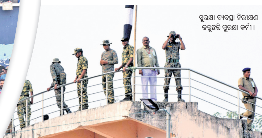
ପୁରସ୍କା ବ୍ୟବସ୍ଥା ନିରୀକ୍ଷଣ କରୁଛନ୍ତି ପୁରସ୍କା କର୍ମୀ।

ପୋଲିସ ପଡିଆଠାରେ ପ୍ରଧାନମନ୍ତ୍ରୀଙ୍କ ସରକାରୀ ସଭା କାର୍ଯ୍ୟକ୍ରମ ଥିଲା। ବିଭିନ୍ନ ବିଭାଗର ଅଧିକାରୀ, ଗଣାମାଧ୍ୟମ ପ୍ରତିନିଧି ଓ ସ୍ୱତନ୍ତ୍ର ନିମନ୍ତ୍ରିତ ଅତିଥି ଏହି କାର୍ଯ୍ୟକ୍ରମକୁ ନିମନ୍ତ୍ରିତ ହୋଇଥିଲେ। ଏଥିରେ ଅଳ୍ପ ସଂଖ୍ୟକ ଚୌକି ପଡିଥିବା ବେଳେ ସିଟ୍ ପୂରଣ ହେବା ସତ୍ତ୍ୱେ ବହୁ ଲୋକ ସ୍ଥାନରେ ନିମନ୍ତ୍ରଣ ପତ୍ର ଧରି ଭିଡ଼ ଜମାଇଥିଲେ। ଯାହା ଫଳରେ ଗଣଗୋଳିଆ ପରିସ୍ଥିତି ସୃଷ୍ଟି ହୋଇଥିଲା। ଭାଙ୍ଗିବା ନେତା ଅଧିକ ସଂଖ୍ୟାରେ ନିମନ୍ତ୍ରଣ ପତ୍ର ବନ୍ଧନ କରିଥିବାବୁଦ୍ଧି ଏଭଳି ପରିସ୍ଥିତି ସୃଷ୍ଟି ହୋଇଥିବା ଚର୍ଚ୍ଚା ଚାଲିଥିଲା।