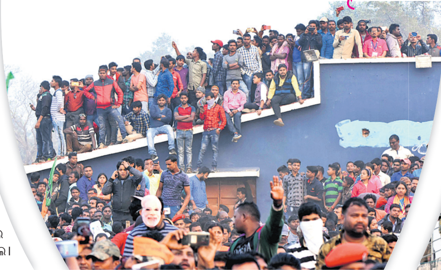
ମୋଦିଙ୍କ ଅପେକ୍ଷାରେ ପ୍ରଶଂସକ।