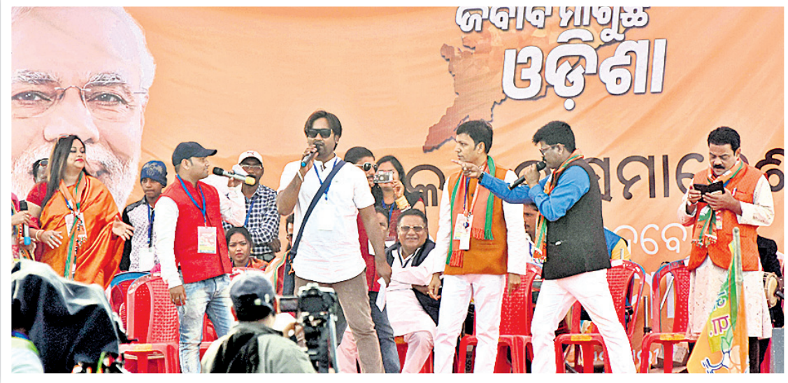
ସମାବେଶ ମଞ୍ଚରେ ସଂଗୀତ ଆସର।

ମୋଦିଙ୍କ ଗସ୍ତ ଲାଗି ବାରିପଦା ସହରରେ ଗ୍ରାମିକ କଟକଣା ହୋଇଥିଲା। ତେବେ ଦୋକାନୀ ବଜାର ବନ୍ଦ କରିବା ପାଇଁ ମଧ୍ୟ ପୋଲିସ ଦୋକାନୀଙ୍କୁ ଜୋର ଜବରଦସ୍ତି କରୁଥିବା ଦେଖିବାକୁ ମିଳିଥିଲା। ଫଳରେ କଚେରି ମାକେଟ୍ ଅଞ୍ଚଳରେ ଦୋକାନୀ ଓ ପୋଲିସ ମଧ୍ୟରେ ଗଣଗୋଳ ହୋଇଥିଲା।