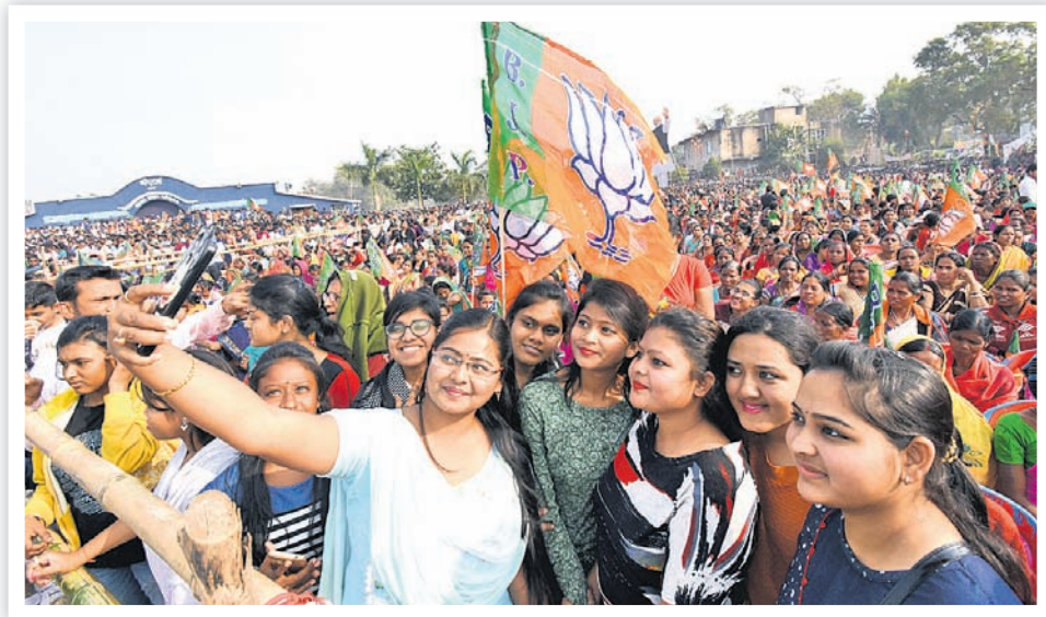
ସମାବେଶକୁ ଆସିଥିବା ଯୁବତୀମାନେ ସେଲଫି ନେଉଛନ୍ତି।