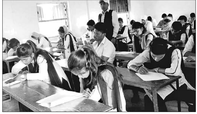
ନାଆଁମା ମହାବିଦ୍ୟାଳୟରେ ପ୍ରତିଯୋଗିତାରେ ଭାଗ ନେଇଥିବା ଛାତ୍ରଛାତ୍ରୀ।

ଭଦ୍ରକ ଜିଲ୍ଲା ଭଣ୍ଡାରିପୋଖରୀ ବ୍ଲକ୍ ମଧ୍ୟମିକା ଶିକ୍ଷାକେନ୍ଦ୍ରରୁ ନାଆଁମା ମହାବିଦ୍ୟାଳୟରୁ ଆନ୍ତଃଜିଲ୍ଲା ସାଧାରଣ ଜ୍ଞାନ ପ୍ରତିଯୋଗିତା ସ୍ତରୀୟ ବିଦେଶୀୟ ମୁନି ସଂସଦ ଆନୁକୂଲ୍ୟରେ ଶନିବାର ଅନୁଷ୍ଠିତ ହୋଇଯାଇଛି।