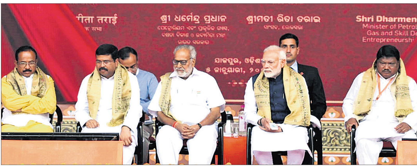
ବାରମ୍ବାର ପୋଲିସ୍ ହାଇସ୍କୁଲ ପଡ଼ିଆଠାରେ ଆୟୋଜିତ ସରକାରୀ କାର୍ଯ୍ୟକ୍ରମରେ ଏମ୍‌ପି ରାମଚନ୍ଦ୍ର ହାଁସବା, କେନ୍ଦ୍ରମନ୍ତ୍ରୀ ଧର୍ମେନ୍ଦ୍ର ପ୍ରଧାନ, ରାଜ୍ୟପାଳ ଗଣେଶୀଲାଲ, ପ୍ରଧାନମନ୍ତ୍ରୀ ନରେନ୍ଦ୍ର ମୋଦି ଓ କେନ୍ଦ୍ରମନ୍ତ୍ରୀ କୁସଲ୍ ଓରାମ ।

ବାରମ୍ବାର ପୋଲିସ୍ ହାଇସ୍କୁଲ ପଡ଼ିଆଠାରେ ଆୟୋଜିତ ସରକାରୀ କାର୍ଯ୍ୟକ୍ରମରେ ପ୍ରଧାନମନ୍ତ୍ରୀ ନରେନ୍ଦ୍ର ମୋଦି ଉପସ୍ଥିତ ଗର୍ଭା ଶିଳ୍ପୀମାନଙ୍କୁ ଆରମ୍ଭ କରିଥିଲେ। କେନ୍ଦ୍ର ସରକାରଙ୍କ 'ସବୁଜା ସାଥ, ଟେକ୍ ବିକାଶ' ଓ ସମ୍ପୂର୍ଣ୍ଣ ବିକାଶ ପାଇଁ ଗୋଟିଏ ଦିନରେ ଓଡ଼ିଶାରେ ୪,୫୦୦ କୋଟି ଟଙ୍କାର ବିଭିନ୍ନ ପ୍ରକଳ୍ପ ଆରମ୍ଭ କରିଛନ୍ତି। ଏହାଦ୍ୱାରା ଓଡ଼ିଶାର ଜନଜୀବନ