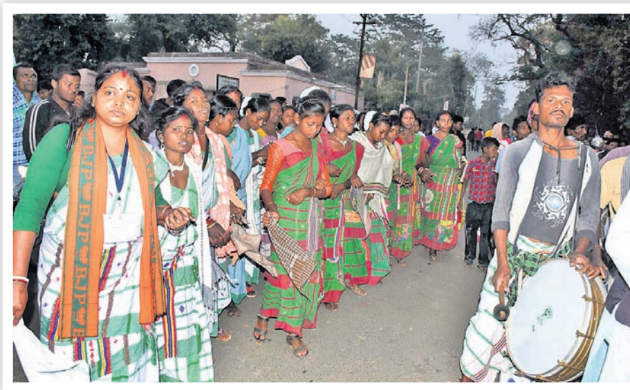
ମୋଦିଙ୍କ ସ୍ୱାଗତ ଲାଗି ପାରମ୍ପରିକ ନୃତ୍ୟ।