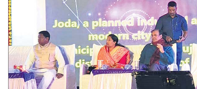
ଉଦ୍ଘାଟନରେ ଯୋଗ ଦେଇଥିବା ଅତିଥି। ଯୋଡ଼ା, ୫୧୧(ଡି.ଏନ.ଏ.)