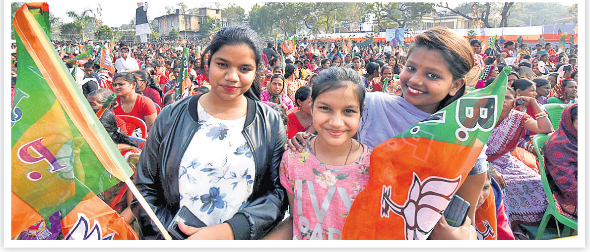
ଭାଙ୍ଗିବା ପଡାକା ସହ ଉତ୍ସାହିତ ପ୍ରଶଂସକ।

ପ୍ରଧାନମନ୍ତ୍ରୀ ମୋଦି ଏତେ ବାବୁରୁ ଆସିଛନ୍ତି, ଆମେ ଏଇ ପାଖରୁ ଆସିପାରିବୁନି! ମୋଦିଙ୍କୁ ପାଖରୁ ଦେଖିବାକୁ ଏହା ଏକ ବଡ଼ ସୁଯୋଗ। ଗାଡି ଲାଗିଲା ଆସିଲୁ, ଭୋଟ କଥା ଅଛି। ସମୟ ଆସିଲେ ଠିକ୍ ଲୋକଙ୍କୁ ଭୋଟ ଦେବୁ ବୋଲି ବେତନଟୀ ଅଞ୍ଚଳରୁ ଆସିଥିବା ୩୦ ବର୍ଷର ଜଣେ ଯୁବକ କହିଛନ୍ତି।