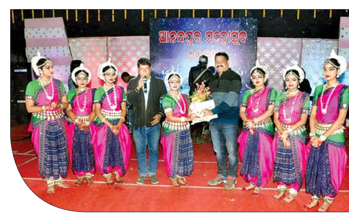
କଳାକାରଙ୍କୁ ପୁରସ୍କୃତ କରାଯାଇଛି। ବେଶ ଆକର୍ଷଣୀୟ କରିଛି। ଆନନ୍ଦପୁର ମହୋତ୍ସବ କମିଟିର ଅଧ୍ୟକ୍ଷ ତଥା