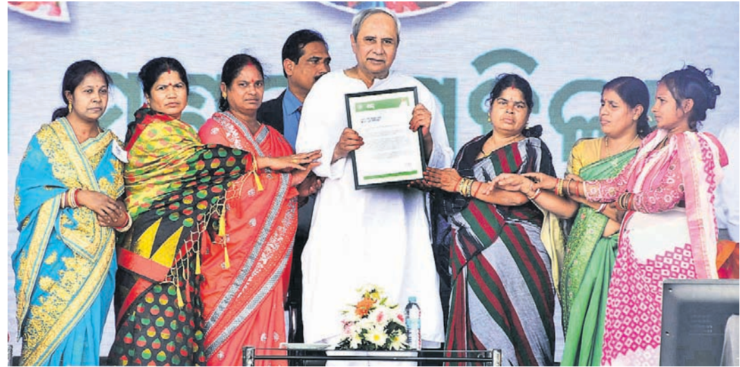
ପୁରୀରେ ଶନିବାର ଆୟୋଜିତ ମିଶନ ଶକ୍ତି ମହାସମାବେଶରେ ମୁଖ୍ୟମନ୍ତ୍ରୀ ନବୀନ ପଟ୍ଟନାୟକ ଏସ୍‌ଏଚ୍‌ଟି ସହଯୋଗୀ ସାଂଘିକଙ୍କ ପ୍ରଦାନ କରୁଛନ୍ତି।

ପୁରୀ ଅଧିକ, ୫୧ ରାଜ୍ୟର ପ୍ରତ୍ୟେକ ମହିଳା ସଶକ୍ତ ହେବେ। ସେମାନେ ନିଜେ ସ୍ଵାବଲମ୍ବୀ ହେବେ ଏବଂ ପରିବାରରେ ସେମାନଙ୍କର ଆର୍ଥିକ ସହଭାଗିତା ରହିବ। ଏହି ଆଭିପ୍ରାୟ ରାଜ୍ୟ ସରକାର ମହିଳା ସଶକ୍ତକରଣ କାର୍ଯ୍ୟକ୍ରମକୁ ଅଧିକ ପ୍ରତ୍ୟାଶା ଓ ଶକ୍ତିଶାଳୀ କରିଛନ୍ତି। ପୁରୀ ତାଳବଣିଆସ୍ଥିତ ବିଜୁ ପଟ୍ଟନାୟକ ଇନ୍‌ଡୋର ଷ୍ଟାଡ଼ିୟମରେ ଶନିବାର ଆୟୋଜିତ ମିଶନ ଶକ୍ତି ମହାସମାବେଶରେ ଘୋଗଦେଇ ମୁଖ୍ୟମନ୍ତ୍ରୀ ନବୀନ ପଟ୍ଟନାୟକ ମହିଳାଙ୍କ ପାଇଁ ଏକାଧିକ ନୂଆ ସହାୟତା ଘୋଷଣା କରିଛନ୍ତି। ଏଣିକି ରାଜ୍ୟର ପ୍ରତ୍ୟେକ ସ୍ଵୟଂ ସହାୟକ ଗୋଷ୍ଠୀ (ଏସ୍‌ଏଚ୍‌ଟି)କୁ ବିନା ସୁଧରେ ୩ ଲକ୍ଷ ଟଙ୍କା ପର୍ଯ୍ୟନ୍ତ ରଖି ପ୍ରଦାନ କରାଯିବ ବୋଲି ଘୋଷଣା କରିଛନ୍ତି। ଏଥିସହ ନୂତନ ଏସ୍‌ଏଚ୍‌ଟି