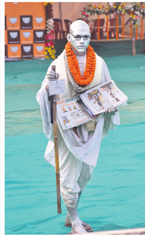
ସ୍ୱଚ୍ଛତାର ବାଉଁଶ ବାହୁଥିବା ସାଇକ୍ଲ ଗାଣୀ ବେଶ।