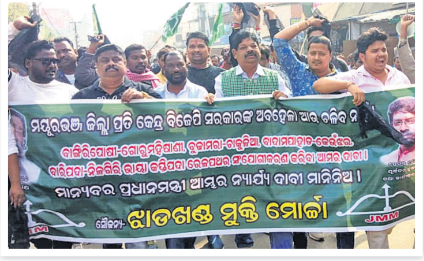
ଜେଏନଏମ କର୍ମୀଙ୍କ ବିକ୍ଷୋଭ ଶୋଭାଯାତ୍ରା।