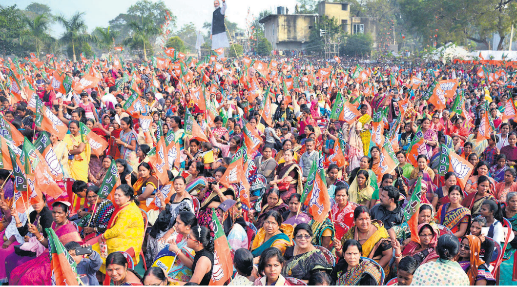
ବାରପଦା ଛନ୍ଦ ପଢ଼ିଆରେ ଆୟୋଜିତ ଭାଜପା ସମାବେଶରେ ଉପସ୍ଥିତ କର୍ମୀ, ସମର୍ଥକ ଓ ଜନସାଧାରଣ ।