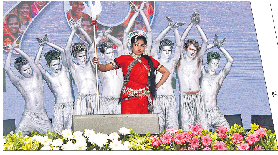
ମିଶନ ଶକ୍ତି ସମାବେଶରେ ପ୍ରମୁଖ ଡ୍ୟାନ୍ସ ଗ୍ରୁପ୍ ପକ୍ଷରୁ ପରିବେଷିତ ନୃତ୍ୟ ।