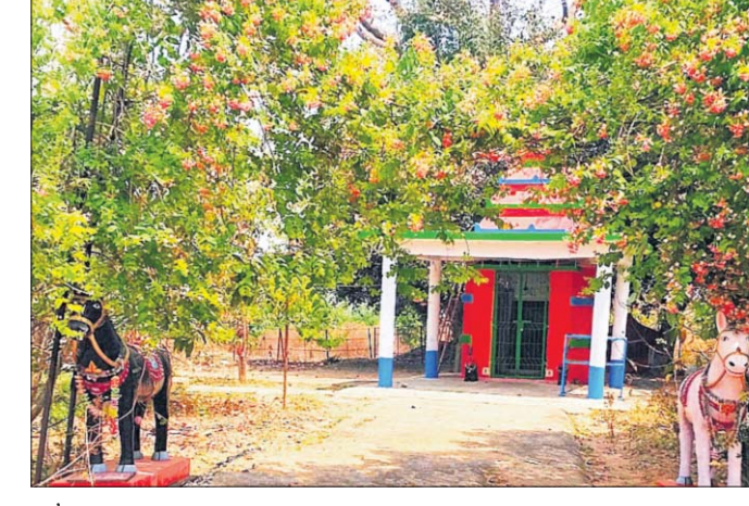
ମା' ଧନେଇ ଠାକୁରାଣୀଙ୍କ ପୀଠ।

ଆନନ୍ଦପୁର, ୫୧୧(ସ୍ୱ.ପ୍ର.) ଆନନ୍ଦପୁରର ଐତିହାସିକ କିମ୍ବଦନ୍ତୀ ସମ୍ପନ୍ନ ଶିଆଡ଼ିମାଳିଆର ମା' ଧନେଇ ଠାକୁରାଣୀଙ୍କ ମକର ମେଳା ପାଇଁ କମିଟି ପକ୍ଷରୁ ବ୍ୟାପକ ପ୍ରସ୍ତୁତି କାର୍ଯ୍ୟ ଆରମ୍ଭ ହୋଇଛି। ମକର ମେଳା ପଡ଼ିଆର ସପେକ୍ଷ କାର୍ଯ୍ୟ ଆରମ୍ଭ ହୋଇଛି। ମନ୍ଦିରକୁ ରଜ କରାଯିବା କାର୍ଯ୍ୟ ଶେଷ ହୋଇଛି। ଚଳିତ ବର୍ଷ ମେଳାକୁ ତିନିଦିନକୁ ୫ ଦିନକୁ ବୃଦ୍ଧି କରାଯାଇଥିବାରୁ ଉକ୍ତ ଅଞ୍ଚଳ ଚଳଚଞ୍ଚଳ କରାଯାଇଛି। ମହାଆତ୍ମରରେ ପାଳନ କରିବା ନିମନ୍ତେ ବିଭିନ୍ନ ପ୍ରକାରର କାର୍ଯ୍ୟକ୍ରମ ହାତକୁ ନିଆଯାଇଥିବା କମିଟିର ସଭାପତି ବିକଳ ଜୁମାର ମିଶ୍ର ପ୍ରକାଶ କରିଛନ୍ତି।