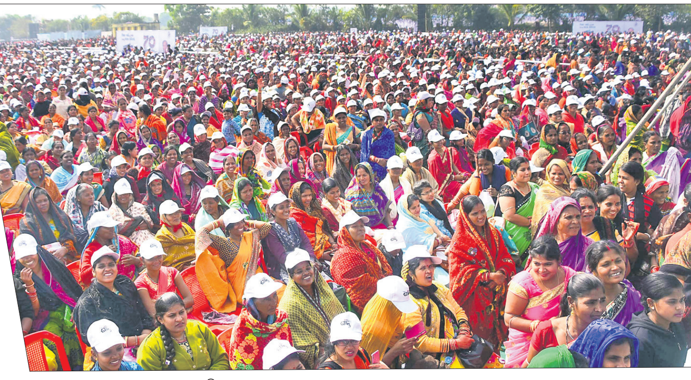
ସମାବେଶରେ ଯୋଗଦେଇଥିବା ଏସ୍‌ଏଚ୍‌ଇ ଗ୍ରୁପ୍ ସଦସ୍ୟାମାନେ ।