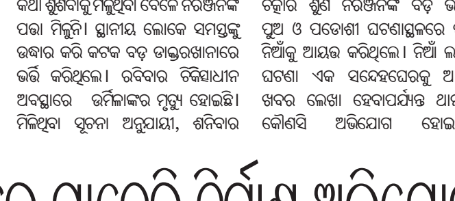
ଗୋଟି ଜମିରେ ପାଚେରି ନିର୍ମାଣ କରାଯାଇଛି।

ରଘୁଲପୁର ବ୍ଲକ୍ ଅଧୀନ ଲକ୍ଷ୍ମୀନଗର ପଞ୍ଚାୟତରେ ନୂଆ ପ୍ରାଥମିକ ସ୍କୁଲ କେନ୍ଦ୍ରର ପାଚେରି ନିର୍ମାଣ କାର୍ଯ୍ୟ ଗୋଟି ଜମିରେ ଚାଲୁଛି। ଏ ନେଇ ଗ୍ରାମବାସୀଙ୍କ ପକ୍ଷରୁ ରଘୁଲପୁର ତହସିଲଦାରଙ୍କ ନିକଟରେ ଗୁରୁତର ଅଭିଯୋଗ ହୋଇଛି। ଅଭିଯୋଗ ଆଧାରରେ ରାଜସ୍ୱ ନିରୀକ୍ଷକ ରମେଶ ଚନ୍ଦ୍ର ସାହୁ ଉପରକୁ ଚାଲି ଚିହ୍ନଟ କରି ତହସିଲଦାରଙ୍କୁ ରିପୋର୍ଟ ପ୍ରଦାନ କରିଛନ୍ତି। ଏହି ପଞ୍ଚାୟତରେ ସ୍କୁଲକେନ୍ଦ୍ର ପାଚେରି ନିର୍ମାଣ କାର୍ଯ୍ୟ ନିମନ୍ତେ କୋରେଇ ବିଧାୟକଙ୍କ ଅନୁଦାନ ପାଣ୍ଟିରୁ ୩.୫ଲକ୍ଷ ଟଙ୍କା ପ୍ରଦାନ କରାଯାଇଛି। ପାଚେରି ନିର୍ମାଣ କାର୍ଯ୍ୟ ଖାତା ନଂ-୪୮୮, ପୁଅ ନଂ-୨୩୪ରେ ଜମି ଉପରେ କରାଯାଇଛି। ସାହାକି ଗୋଟି ଜମି ଅଟେ ବୋଲି ଗ୍ରାମବାସୀଙ୍କ ପକ୍ଷରୁ ଅଭିଯୋଗ ହେଉଛି। ପାଚେରି ନିର୍ମାଣ ଦ୍ୱାରା ଗ୍ରାମରେ ଥିବା ଏକମାତ୍ର ଗୋରୁଗାଳ ଚାଉଣ ଛୁଇଁ ଅବରୋଧ ହୋଇଯାଇଛି। ଏଥି ସହ ଗାଁ ଗଣ୍ଡାକୁ ବହି ଆସୁଥିବା ବର୍ଷାଜଳ ପ୍ରବାହ ବନ୍ଦ ହୋଇଯିବ। ଫଳରେ ଗ୍ରାମବାସୀଙ୍କୁ ଦୃଷ୍ଟି ଜଳ ପ୍ରଭାବିତ କରିବା ସହ