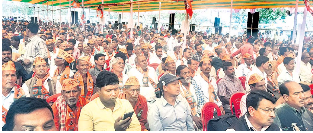
କାର୍ଯ୍ୟକ୍ରମରେ ଯୋଗଦେଇଥିବା ଦକୀୟ କର୍ମୀ ଓ ଜନସାଧାରଣ।

କେନ୍ଦ୍ରମନ୍ତ୍ରୀ ଧର୍ମେନ୍ଦ୍ର ପ୍ରଧାନ ରବିବାର ସାଧାରଣ ସଭାରେ ଯୋଗଦେବା ପାଇଁ ୨ୟାକ ବିଳମ୍ବରେ ଆସିଥିଲେ। ଭାଙ୍ଗପା ଚୁଟାୟ ମହଲରେ ବସି ସୁଇଚ୍ ଟିପି ପାନାୟ ଜଳ ପ୍ରକଳ୍ପ ଉଦ୍ଘାଟନ କରୁଛନ୍ତି। ବାହାଘର ବେଳେ ବାଜରାଣ ରୁଆ ଭଳି କାର୍ଯ୍ୟକ୍ରମ କରୁଛନ୍ତି। ଜିଲ୍ଲାରେ ବାରମ୍ବାର ବିଦ୍ୟୁତ୍ କାଟ ହେଉଛି, ବିଦ୍ୟାଳୟରେ ଶିକ୍ଷକ ନାହାନ୍ତି, ଡାକ୍ତରଖାନାରେ ଡାକ୍ତର ଅଭାବ। ଏହାକୁ କମ୍ପୁଟି ବିକାଶର ଚିତ୍ର। ନୟାଗଡ଼ବାସୀ ଏହାର ଜବାବ୍ ମାଗୁଛନ୍ତି ବୋଲି ଧର୍ମେନ୍ଦ୍ର କହିଥିଲେ। ଓଡ଼ିଆ ଲୋକଙ୍କ ପାଇଁ ସରକାର ପ୍ରଧାନମନ୍ତ୍ରୀ ଆୟୁଷମାନ ଯୋଜନା କାର୍ଯ୍ୟକ୍ରମ କରୁନାହାନ୍ତି ବୋଲି ସେ ପ୍ରଶ୍ନ କରିଥିଲେ। ଜିଲ୍ଲାରେ କାଳିଆ ଯୋଜନାରେ ଦକୀୟ କର୍ମୀମାନଙ୍କୁ ସାମିଲ କରାଯାଇଥିବା ନେଇ ଅଭିଯୋଗ କରିଥିଲେ। ଦୁର୍ନୀତି, ଚିରଫ୍ଟ ଧାରଣା ଓ ଖଣି ଦୁର୍ନୀତି ଯୋଗୁ ଓଡ଼ିଶାବାସୀ କଷ୍ଟ ପାଇଛନ୍ତି। ଦୁର୍ନୀତିର ଦାନବକୁ ନିଜେ ମୁଖ୍ୟମନ୍ତ୍ରୀ ଦାନା ଦେଉଛନ୍ତି। ମୁଖ୍ୟମନ୍ତ୍ରୀଙ୍କ ଘରେ ବିଶେଷ ନିଗମରେ ପାଇଖାନା ପାଇଁ ୧୨ ହଜାର ଟଙ୍କା ପ୍ରଦାନ କରାଯାଇଛି। ହେଲେ ନୟାଗଡ଼ରେ ୧୦୦ରେ ୩୦୦ଟି ପାଖାପାଖି ପାଇଖାନା ହୋଇନାହିଁ। ଅତୁଣ୍ଡ ଭାଙ୍ଗଳ ପକେଟକୁ ଗୁଞ୍ଜା ଯାଉନାହିଁ ବୋଲି ଦେଉଛନ୍ତି, ଏ କ'ଣ ହିସାବ କରାଯାଉଛି। ଅନ୍ୟପଟେ ମନ୍ତ୍ରୀ ପ୍ରତାପ ମହାରଥୀ ଏହାକୁ ନେଇ ଅତୁଟ୍ଟିକର ମତ୍ତବ୍ୟ ପ୍ରଧାନମନ୍ତ୍ରୀ ନରେନ୍ଦ୍ର ମୋଦିଙ୍କ କାର୍ଯ୍ୟକ୍ରମକୁ ବଦଳାଇ କରି ନ ପାରି ତରବରିଆ ଭାବେ ବନ୍ଧୁ ସହାୟତା ରୋଷ୍ଟା (ଏସ୍ଏଚ୍ଡି) ଟିଏକ୍ସ ଆୟୋଜନ କଲେ। ଏକ ମିନିଟ୍