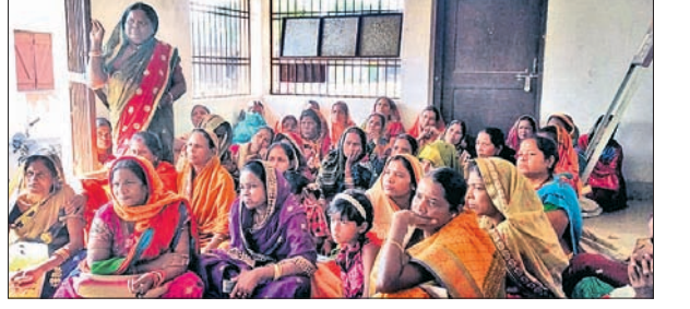
ମଦ ଦୋକାନ ଉଚ୍ଛେଦ ଦାବିରେ ମହିଳାମାନେ ଏକାଠି ହୋଇଛନ୍ତି।