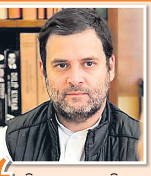
କଂଗ୍ରେସ ଆଧାର ଦେଶବାସୀଙ୍କୁ ବିକ୍ରାନ୍ତ କରୁଛନ୍ତି।