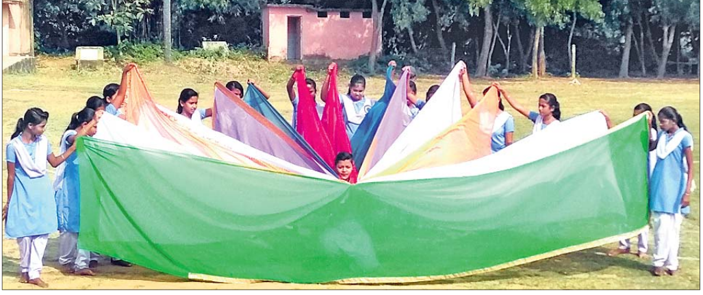
ଛାତ୍ରୀମାନେ କ୍ରୀଡ଼ା ଭସବ ଉଦ୍‌ଘାଟନ ଅବସରରେ ହାତରେ ଶାଢ଼ି ଡ୍ରେଇ ପ୍ରଦର୍ଶନ କରୁଛନ୍ତି।