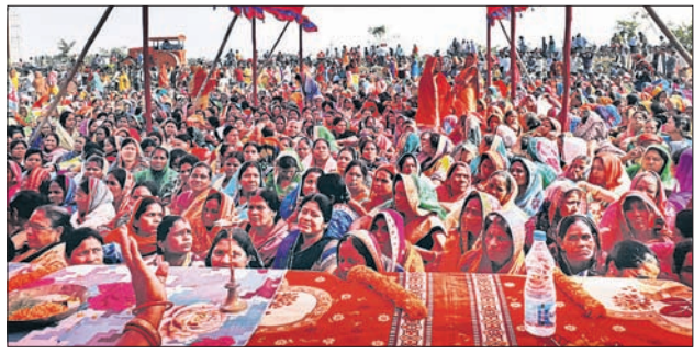
ସମାବେଶରେ ଉପସ୍ଥିତ ମହିଳାମାନେ।