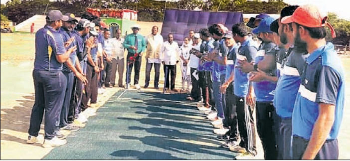
ମ୍ୟାଚ୍ ପୂର୍ବରୁ ପଡ଼ିଆରେ ଉଭୟ ଟିମ୍ମର ଖେଳାଳି ଓ ଅନ୍ୟମାନେ।