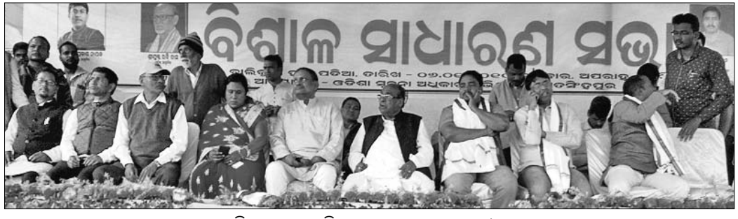
ମଞ୍ଚରେ ଉପସ୍ଥିତ ପାରାଦୀପ ବିଧାୟକ ଦାମୋଦର ରାଉତ ଓ ଅନ୍ୟମାନେ।