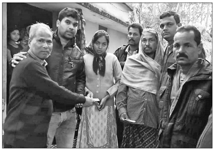
ଶୁଭସ୍ମିତାଙ୍କୁ ପୁରସ୍କୃତ କରାଯାଇଛି।