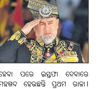
ହେବା ପରେ ଇସ୍ତଫା ଦେବାରେ ମହମ୍ମଦ ହେଉଛନ୍ତି ପ୍ରଥମ ରାଜା।

କ୍ୟାଲିଙ୍ଗୁର: ମାଲେସିଆର ପଞ୍ଚଦଶ ରାଜା ସୁଲତାନ୍ ମହମ୍ମଦ୍ ପଞ୍ଚମ ରାଜପଦ ତ୍ୟାଗ କରିଛନ୍ତି। ସେ ରୁଷିଆର ପୂର୍ବତନ ମିସ୍ ମସ୍କୋଙ୍କୁ ବିବାହ କରିଥିବା ଗୁରୁତ୍ଵ ପ୍ରଚାରିତ ହେବା ପରେ କିଛି ଦିନ ହେଲା ଛୁଟିରେ ଥିଲେ। ତାଙ୍କ ଭବିଷ୍ୟତକୁ ନେଇ ଚର୍ଚ୍ଚା କୋର ଧରିଥିବାବେଳେ ମହମ୍ମଦ ଇସ୍ତଫା ଦେଇଥିବା ରାଜଭବନ କାର୍ଯ୍ୟାଳୟ ପକ୍ଷରୁ କୁହାଯାଇଛି। ୧୯୫୭ରେ ମାଲେସିଆ ସ୍ଵାଧୀନ ହେବା ପରେ ଇସ୍ତଫା ଦେବାରେ ମହମ୍ମଦ ହେଉଛନ୍ତି ପ୍ରଥମ ରାଜା।