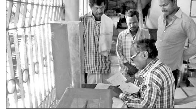
ଚାଷୀ ମାନଙ୍କ ନାମ ପଞ୍ଜୀକରଣ କରାଯାଉଛି।

ରାଇକିଆ ବ୍ଲକ୍‌ରେ କାଳିଆ ଯୋଜନାରେ ଚାଷୀମାନଙ୍କ ନାମ ପଞ୍ଜୀକରଣ ଆରମ୍ଭ ହୋଇଯାଇଛି। ଏଥିପାଇଁ ପ୍ରତ୍ୟେକ ଦିନ ଚାଷୀ ନିଜ ନାମ ପଞ୍ଜୀକରଣ ପାଇଁ ଆବେଦନ କରୁଛନ୍ତି। ବିଭିନ୍ନ ପଞ୍ଚାୟତରେ ଆବେଦନ ପାଇଁ ଏକ ସ୍ୱତନ୍ତ୍ର ଫର୍ମରେ ସମସ୍ତ ବ୍ୟବସ୍ଥା କରାଯାଇଛି, କିନ୍ତୁ ଅନେକ ଚାଷୀ ଆବେଦନକୁ ନେଇ ବ୍ୟବହାର ପଡ଼ୁଛନ୍ତି। ଆବଶ୍ୟକୀୟ କାଗଜପତ୍ର ନଥିବାରୁ ନିରାଶ ହୋଇ ଚାଷୀମାନେ ବିଶେଷ କରି ଯେଉଁଠି ଚାଷୀମାନଙ୍କର ନାମ ପଞ୍ଜୀକରଣ ହୋଇ ନାହିଁ, ସେମାନେ ଆବେଦନ ପାଇଁ କୋଣସି ଫୋଟୋଗ୍ରାଫି ବିଶେଷ କରି ଯେଉଁଠି ଚାଷୀମାନଙ୍କର ନାମ ପଞ୍ଜୀକରଣ ହୋଇ ନାହିଁ, ସେମାନଙ୍କ ପାଇଁ ପରବର୍ତ୍ତୀ ପର୍ଯ୍ୟାୟରେ ଆବେଦନ କରିପାରିବେ।