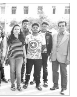
ଆୟୁର୍ବେଦ କଲେଜ ପରିବର୍ତ୍ତନରେ ଆସିଥିବା ବଲାଙ୍ଗୀର ଆୟୁର୍ବେଦ କଲେଜର ଛାତ୍ରାଛାତ୍ର ।

କେଏଟିଏସ୍ ଆୟୁର୍ବେଦ କଲେଜ ବୁଲିଲେ ବଲାଙ୍ଗୀର ଛାତ୍ରାଛାତ୍ର