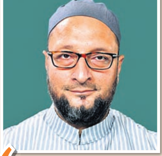
ଦଳିତଙ୍କୁ ନ୍ୟାୟ ପାଇଁ ସଂରକ୍ଷଣ ଆବଶ୍ୟକ । - ଆସାଫୁଦ୍ଦିନ ଓଝାଲସି