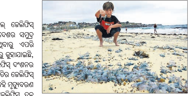
ଆକ୍ରମଣର ଶିକାର ହୋଇଥିଲେ । ଅଧିକାଂଶ ଦଂଶନ ଘଟଣା କୁଇନ୍ସଲାଣ୍ଡର ଜନବହୁଳ ଅଞ୍ଚଳ ରୋଲ୍‌କୋଷ୍ଟ ଏବଂ ସନଶାଲନ୍ କୋଷ୍ଟ ଅଞ୍ଚଳରେ ଘଟିଛି ।

କାନବେରା: ଅଷ୍ଟ୍ରେଲିଆର ହଜାର ହଜାର ଲୋକ କୁବଚଲ୍ ଜେଲିଫିସ୍ ଦଂଶନର ଶିକାର ହୋଇଛନ୍ତି । କୁଇନ୍ସଲାଣ୍ଡ ପ୍ରଦେଶର ସମୁଦ୍ର ଉପକୂଳରେ ଜେଲିଫିସ୍ ବହୁମାତ୍ରରେ ଲାଗିଥିବାରୁ ଏପରି ଘଟିଛି । ସର୍ପ ଲାଲଟି ଯେଉଁଠି କୁଇନ୍ସଲାଣ୍ଡ ପକ୍ଷରୁ କୁହାଯାଇଛି, ସପ୍ତାହକ ମଧ୍ୟରେ ୨୬୦୦ରୁ ଊର୍ଦ୍ଧ୍ୱ ଲୋକ ଜେଲିଫିସ୍ ଦଂଶନର ଶିକାର ହୋଇ ଚିକିତ୍ସିତ ହୋଇଛନ୍ତି । କୁବଚଲ୍ ପ୍ରକାରି ଜେଲିଫିସ୍ ଦଂଶନ ଯନ୍ତ୍ରଣାଦାୟକ ହେଲେ ମଧ୍ୟ ଏଥିପାଇଁ କେହି ମୃତ୍ୟୁବରଣ କରିନି ନାହିଁ । ଅସ୍ୱାଭାବିକ ବାୟୁ ପ୍ରବାହ ଯୋଗୁ ଜେଲିଫିସ୍ ଦଳ ସମୁଦ୍ରକୂଳକୁ ଚାଲିଆସିଥିଲେ । ଗତ ସପ୍ତାହକ ମଧ୍ୟରେ ୧୩, ୦୦୦ ଲୋକ ଜେଲିଫିସ୍ ଆକ୍ରମଣର ଶିକାର ହୋଇଛନ୍ତି । ଗତବର୍ଷ ଏହି ସମୟ ବେଳକୁ ପାଖାପାଖି ଏକ ତୃତୀୟାଂଶ ଲୋକ ଏଭଳି