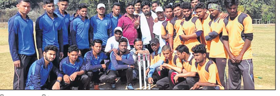
ଅତିଥିକ ସହ ଖେଳାଳି।

ଫୁଲବାଣୀ ଅଫିସ୍, ୭୧୧ ଫୁଲବାଣୀ ଏକେଡ଼ି ସାଇକ୍ଲ ପଡ଼ିଆ (ବି.ଡି.ଏ.)ରେ ଜିଲ୍ଲାସ୍ତରୀୟ ଏସ୍ଏସ୍ଡି କ୍ରିକେଟ ଟୁର୍ନାମେଣ୍ଟ ଆରମ୍ଭ ହୋଇଛି। ସୋମବାର ଅନୁଷ୍ଠିତ ୨ଟି ମ୍ୟାଚରେ ବିଶିପଡ଼ା ଏବଂ ଚିଟିରାପଞ୍ଜା ଟିମ୍ ବିଜୟୀ ହୋଇଛନ୍ତି। ପ୍ରଥମ ମ୍ୟାଚ ଶଙ୍କରାଖୋଳ ଓ ବିକେସିସି ବିଶିପଡ଼ା ମଧ୍ୟରେ ହୋଇଥିଲା। ବିଶିପଡ଼ା ପ୍ରଥମେ ବ୍ୟାଟି କରି ନିର୍ଦ୍ଧାରିତ ୧୫ ଓଭରରେ ୧୧୭ ରନ କରିଥିଲା। ଜବାବରେ ଶଙ୍କରାଖୋଳ ନିର୍ଦ୍ଧାରିତ ଓଭରରେ ୧୧୦ ରନ କରି ମ୍ୟାଚ ହାରିଥିଲା। ସେହିପରି ଦ୍ୱିତୀୟ ମ୍ୟାଚ ଚିଟିରାପଞ୍ଜା ଓ ବିକେସିସି ମଧ୍ୟରେ