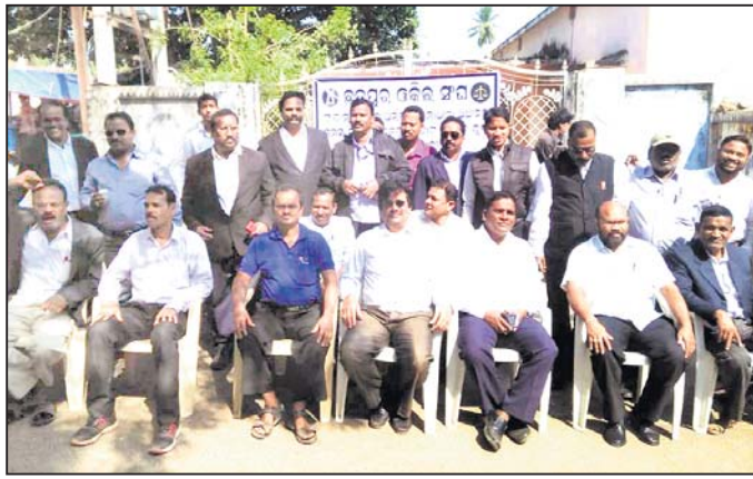
ଓକିଲଙ୍କ ପକ୍ଷରୁ କାର୍ଯ୍ୟବନ୍ଧ ଆନ୍ଦୋଳନ ଚାଲିଛି।