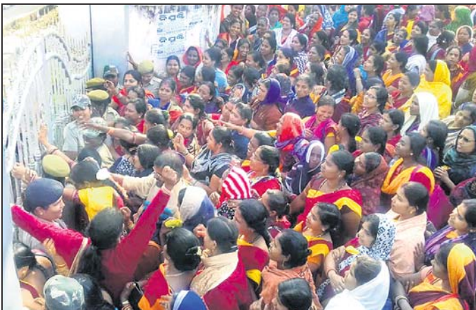
ଜିଲ୍ଲାପାଳଙ୍କ କାର୍ଯ୍ୟାଳୟକୁ ଧକ୍କା ପଶିବାକୁ ଉଦ୍ୟମ କରୁଛନ୍ତି ଅଙ୍ଗନୱାଡ଼ି କର୍ମୀ।

ଭାରତୀୟ ମତ୍ସ୍ୟ ସଂଘ ଅନୁବନ୍ଧିତ ଗଞ୍ଜାମ ଜିଲ୍ଲା ଅଲ ଓଡ଼ିଶା ଅଙ୍ଗନୱାଡ଼ି ଲେଡିଜ୍ ଓ୍ୱାର୍କର୍ସ ସଂଘ ୧୩୦୮୮୮ ଦାବିନେଇ ଯୋଗଦାନ ଜିଲ୍ଲାପାଳଙ୍କ କାର୍ଯ୍ୟାଳୟ ସମ୍ମୁଖରେ ବିକ୍ଷୋଭ ପ୍ରଦର୍ଶନ କରିବା ସହ ଜେଲଭରୋ ଆନ୍ଦୋଳନ କରିଥିଲେ। ୨୦୧୮ ନଭେମ୍ବର ୨୬ରୁ ଅଙ୍ଗନୱାଡ଼ି କର୍ମୀ ବିଧାନସଭା ନିକଟରେ ଗଣ ଧାରଣାରେ ବସି ରହିଛନ୍ତି। ରାଜ୍ୟ ସରକାର କାଣିଶୁଣି ଅଙ୍ଗନୱାଡ଼ି କର୍ମଚାରୀମାନଙ୍କର ଦାବି ପୂରଣ ଦିଗରେ ଅବହେଳା କରୁଥିବା ସଂଘ ଅଭିଯୋଗ କରିଛି। ରାଜ୍ୟ ସଂଘର ନିଷ୍ପତ୍ତି ଅନୁଯାୟୀ ସମସ୍ତ ରାଜ୍ୟରେ ଜିଲ୍ଲାପାଳଙ୍କ କାର୍ଯ୍ୟାଳୟ ସମ୍ମୁଖରେ ଅଲ ଓଡ଼ିଶା ଅଙ୍ଗନୱାଡ଼ି ଲେଡିଜ୍ ଓ୍ୱାର୍କର୍ସ କର୍ମଚାରୀ ବିକ୍ଷୋଭ କରିବା ସହିତ ଜେଲଭରୋ ଆନ୍ଦୋଳନରେ ସାମିଲ ହୋଇଥିଲେ। ଯଥାଶୀଘ୍ର ସଂଘର ଦାବିଗୁଡ଼ିକୁ ରାଜ୍ୟ ସରକାର ପୂରଣ