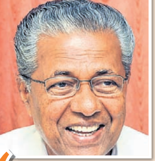
ସ୍ୱାଗତଯୋଗ୍ୟ ନିଷ୍ପତ୍ତି, ପୂର୍ବରୁ ନେବା ଥିଲା । - ପିନାରାୟୀ ବିକୟନ