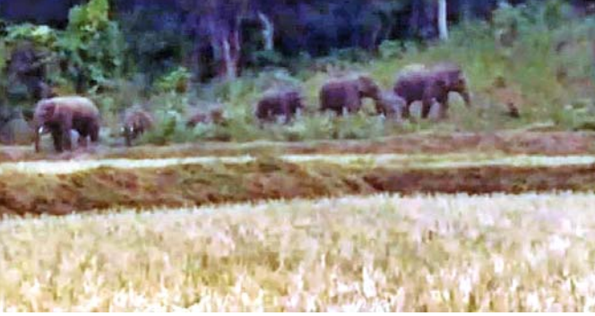
ମେଟୁକରେଡ଼ା ସଂରକ୍ଷିତ ଜଙ୍ଗଲରେ ରହିଥିବା ହାତୀପଲ ।

ଆନ୍ଧ୍ରପ୍ରଦେଶ ରାଜ୍ୟ ବୀରମୋଚୀ ସଂରକ୍ଷିତ ଜଙ୍ଗଲରୁ ଗତ ଶନିବାର ସନ୍ଧ୍ୟାରେ ଓଡ଼ିଶା ଭିତରକୁ ଚାଲି ଆସିଥିବା ହାତୀପଲ ରାୟଗଡ଼ା ଜିଲ୍ଲା ଛାଡ଼ୁନାହିଁ । ଏଭଳିକି ନାଗାବଳୀ ନଦୀର ଅପରପାର୍ଶ୍ୱରେ ଥିବା ମେଟୁକରେଡ଼ା ସଂରକ୍ଷିତ ଜଙ୍ଗଲର ଏକ ବୃଦ୍ଧାୟୁ ଗୁଞ୍ଜନାହିଁ । କେବଳ ପାଣି ପିଇବା ପାଇଁ ନାଗାବଳୀ ନଦୀକୁ ଆସି ପୁଣି ସେହି ବୃଦ୍ଧାୟୁ ଚାଲିଯାଉଛନ୍ତି । ଆଉ ହାତୀ ଘଉଡ଼ାଲବାରେ ବନ ବିଭାଗ ସମ୍ପୂର୍ଣ୍ଣ ଫେଲ୍ ମାରିଛି । ପୁଷ୍ୟତଃ ଅକ୍ଷର ସମୟରେ ହାତୀ ଘଉଡ଼ାଲବା ନିମନ୍ତେ ଉତ୍ତୁଷ୍ଟ ବୋଲିଯାଉଥିବା ବେଳେ ବନ ବିଭାଗ କର୍ମଚାରୀମାନେ ସେହି ସ୍ଥାନକୁ ଯାଇ ନ ଥିବା ଗ୍ରାମବାସୀ ଅଭିଯୋଗ କରିଛନ୍ତି । ବନ ବିଭାଗ କର୍ମଚାରୀମାନେ ଦୁଇଟି ଟିମ୍‌ରେ ବିଭକ୍ତ ହୋଇ ବୋରୁହାଲୁଆ ଓ ଅଶିଳା ଗ୍ରାମରେ ହିଁ ରହିଛନ୍ତି । ସନ୍ଧ୍ୟା ହେଲେ ବନ କର୍ମଚାରୀମାନେ ଗାଁ ଠାରୁ ବାହାକୁ ପାଦ କାଢ଼ି ନ ଥିବା ଯୋଗୁଁ ଲୋକେ ହିନସ୍ତା ହେଉଛନ୍ତି । ପୁଷ୍ୟତଃ ଅଶିଳା, ବୋରୁହାଲୁଆ, ଏମ୍‌ଲ(ଓଲିଆ) ଓ ମେଟୁକରେଡ଼ା ଗ୍ରାମବାସୀ ଗତ ୨ଦିନ