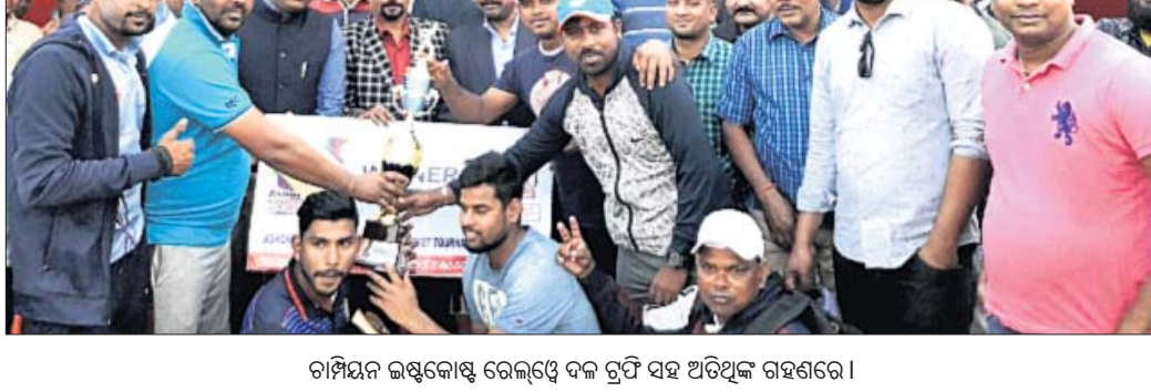
ଚାମ୍ପିୟନ୍ ଇଷ୍ଟକୋଷ୍ଟ ରେଲଓ୍ୱେ ଦଳ ଟ୍ରଫି ସହ ଅତିଥିଙ୍କ ଗହଣରେ

ଜିଲ୍ଲା କ୍ରିକେଟ୍ ଆସୋସିଏଶନ୍ ଆନୁକୁଲ୍ୟରେ ଯାଜପୁର ଅଶୋକ ମଦନାଗରେ ଅନୁଷ୍ଠିତ ୬୫୫ ଅଶୋକ ଦାସ ମେମୋରିଆଲ୍ ସର୍ବଭାରତୀୟ କ୍ରିକେଟ୍ ସୋମବାର ଉଦ୍‌ଯାପିତ ହୋଇଛି। ଇଷ୍ଟକୋଷ୍ଟ ରେଲଓ୍ୱେ ଓ ରାଷ୍ଟ୍ର ରେଲଓ୍ୱେ ମଧ୍ୟରେ ଫାଇନାଲ୍ ଅନୁଷ୍ଠିତ ହୋଇଥିଲା। ଇଷ୍ଟକୋଷ୍ଟ ରେଲଓ୍ୱେ ପ୍ରଥମେ ବ୍ୟାଟି କରି ନିର୍ଦ୍ଧାରିତ ୩୦ ଓଭରରେ ୮ ଉଇକେଟ୍ ହରାଇ ୧୯୭ ରନ କରିଥିଲା।