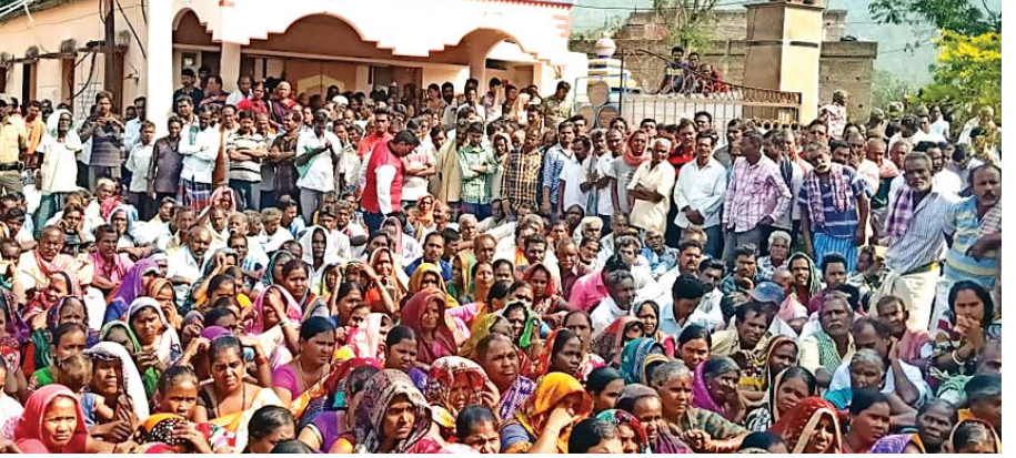
ନବନିର୍ମାଣ କୃଷକ ସଂଗଠନର ସଦସ୍ୟମାନେ ଗୋଷାଣି ବ୍ଲକ୍ କାର୍ଯ୍ୟାଳୟ ଘେରାଉ କରିଛନ୍ତି।

ଗୋଷାଣି/ପାରଳାଖେମୁଣ୍ଡି, ୭୧୧(ଡି.ଏନ.ଏ./ସ.ପ୍ର.)