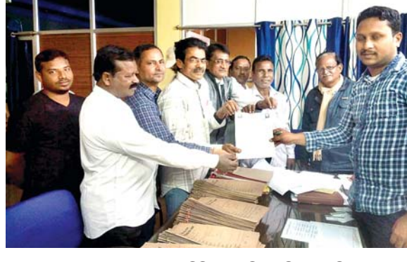
କାଶୀନଗର କୃଷକ ସମାଜ ପକ୍ଷରୁ ବିଭିନ୍ନ ଦାବିପତ୍ର ଦିଆଯାଇଛି।