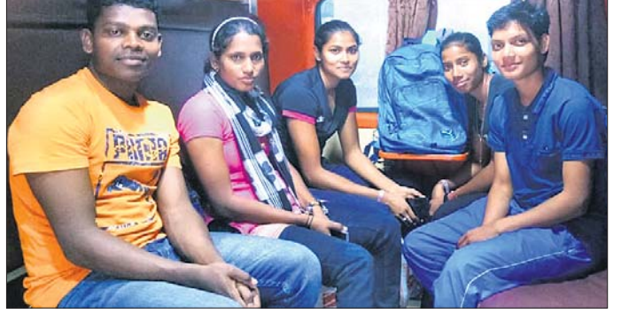
ଖେଳୋ ଇଣ୍ଡିଆ ସ୍ଥୁଥ୍ ଗେମ୍ ପାଇଁ ମନୋନୀତ ଓଡ଼ିଶା ଦଳ

ଚଳିତ ମାସ ୯ରୁ ୨୦ ତାରିଖ ପର୍ଯ୍ୟନ୍ତ ପୁଣେରେ ୨ୟ ଖେଳୋ ଇଣ୍ଡିଆ ସ୍ଥୁଥ୍ ଗେମ୍ ଅନୁଷ୍ଠିତ ହେବ। ସ୍ଥୁଥ୍ ଗେମ୍ ଅନୁଷ୍ଠିତ ହେବ । ସ୍ଥୁଥ୍ ଗେମ୍ ଅନୁଷ୍ଠିତ ହେବ । ସ୍ଥୁଥ୍ ଗେମ୍ ଅନୁଷ୍ଠିତ ହେବ।