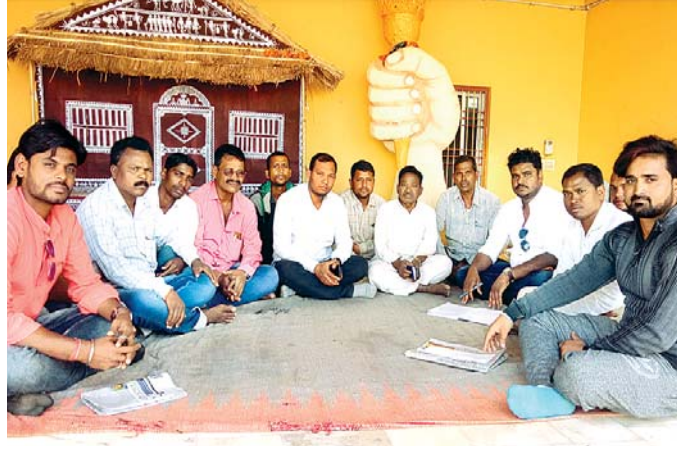
ପ୍ରସ୍ତୁତି ବୈଠକରେ ଯୋଗ ଦେଇଥିବା ଭାଜପା କର୍ମୀମାନେ ।

ଆଣ୍ଡି ନବୁଲ ପିପୁଲସ୍ ଫୋର୍ସ୍ (ଏଏନପିପିଏଫ୍)କୁ ମାଓବାଦୀଙ୍କ ବିରୋଧ କରାଯାଇଛି । ଏକ ପ୍ରେସ୍ ବିଜ୍ଞପ୍ତି ଜାରି କରାଯିବା ସହ ପ୍ରଚାର ପତ୍ର ବନ୍ଧନ କରି ଏଏନପିପିଏଫ୍‌କୁ ବିରୋଧ କରାଯାଇଛି । ଲୋକଙ୍କ ପାଇଁ ବିପ୍ଳବ କରୁଥିବା ମାଓବାଦୀ ସଙ୍ଗଠନ ବିରୋଧରେ ଯେଉଁ ଜନସୂଚକ ଘୋଷଣା ହୋଇଛି ତାହାକୁ ଗଣତାନ୍ତ୍ରିକ ଉପାୟରେ ହୁଏତ ବରଂ ପିଏନଜିଏଫ୍‌ରେ ଯୋଗଦାନ ଚାପ ବିରୋଧ କରିବା ପାଇଁ ଆହ୍ୱାନ ଜଣାଯାଇଛି । ସିପିଆଇ(ମାଓବାଦୀ) ସଙ୍ଗଠନର ଓଡ଼ିଶା ରାଜ୍ୟ କମିଟି ପକ୍ଷରୁ ଏହା ଜାରି କରାଯାଇଛି । ଏଥିସହ ପୋଲିସ୍ ଇନଫର୍ମର, ଚୋକିବାର, ହୋମଗାର୍ଡ, ଏସିପିଆନେ ଚାକିରି