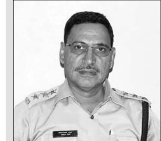
ପୁରୁଣା ଏସ୍ପିପିଓଙ୍କ ସରକାରୀ କ୍ୟୁର୍ସରୁ ହଟିବି ସାଇନବୋର୍ଡ