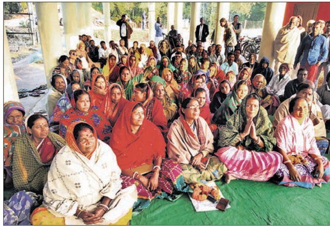
ପ୍ରତିବାଦ ସଭାରେ ଯୋଗଦେଇଥିବା ମହିଳାମାନେ