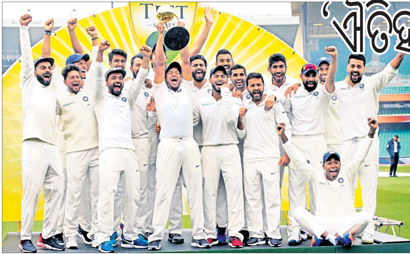
ଅଷ୍ଟ୍ରେଲିଆ ବିପକ୍ଷରେ ଚେଷ୍ଟିକା କରୁଥିବା ଭାରତୀୟ ଦଳର ସଭ୍ୟମାନଙ୍କ ଛବି।