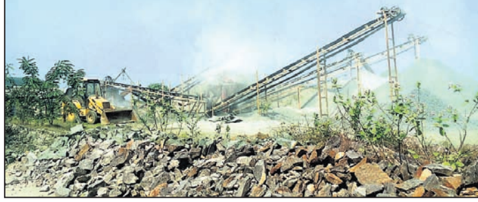
୨୦୧୬-୧୭ ବର୍ଷରେ ଟ୍ୟାଙ୍କୁଫୋର୍ସ କମିଟି ଗଠିତ ୩୦ରୁ ଉର୍ଦ୍ଧ୍ୱ କ୍ରୀଡ଼ା ସିଲ୍ କରାଯାଇଥିଲା

ଯାଜପୁର ଜିଲ୍ଲା ଧର୍ମଶାଳା ତହସିଲ ଅଧୀନ ଅଞ୍ଚଳ ନୌଜାମା ମାଝିଆଗଡ଼ାଠାରେ ବେଆଇନଭାବେ ବହୁ କ୍ରୀଡ଼ା ଗଢ଼ାଉଛି। କ୍ରୀଡ଼ାରୁ ନିର୍ଗତ ଧୂଳିଧୂଆଁରେ ଅଞ୍ଚଳବାସୀ ବିଭିନ୍ନ ସମସ୍ୟାରେ ସମ୍ମୁଖୀନ ହେଉଥିବାବେଳେ ଜାତୀୟ ରାଜପଥରେ ଦୁର୍ଘଟଣା ବଢ଼ିବାରେ ଲାଗିଛି। ଅପରପକ୍ଷେ କ୍ରୀଡ଼ାମାଲିକମାନେ ଜଙ୍ଗଲ କ୍ଷୟ ପାଇବାରୁ ବେଆଇନଭାବେ ପଥର ଉତ୍ତୋଳନ କରି କ୍ରୀଡ଼ା ଚଳାଉଥିବା ସ୍ଥାନୀୟ ଅଞ୍ଚଳବାସୀ ଅଭିଯୋଗ କରିଛନ୍ତି।