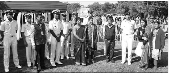
କାର୍ଯ୍ୟକ୍ରମରେ ଉପସ୍ଥିତ ଜିଲ୍ଲାପାଳ, କୋଷ୍ଠଗାର୍ଡ ଅଧିକାରୀ ଓ ଅନ୍ୟମାନେ

ପାରାଦୀପ କେନ୍ଦ୍ରୀୟ ବିଦ୍ୟାଳୟ ପରିସରରେ ସୋମବାର କୋଷ୍ଠଗାର୍ଡ ପକ୍ଷରୁ ବୃକ୍ଷରୋପଣ କରାଯାଇଛି। ଏଥିସହ ବିଦ୍ୟାଳୟ ପରିସରରେ କରାଯାଇଥିବା ଜଙ୍ଗଲ ପ୍ରାଣୀଙ୍କ ପ୍ରତିରୁକ୍ତିକୁ ଅନାବରଣ କରାଯାଇଛି। ଏହି ଅବସରରେ ବିଦ୍ୟାଳୟ ପରିସରରେ ଆୟୋଜିତ କାର୍ଯ୍ୟକ୍ରମରେ ଜଗତ୍‌ସିଂହପୁର ଜିଲ୍ଲାପାଳ ଯାମିନୀ ସତ୍ତ୍ୱେ ମୁଖ୍ୟଅତିଥି ଭାବେ ଯୋଗଦେଇ ବୃକ୍ଷରୋପଣ କରିଥିଲେ। ଅନ୍ୟମାନଙ୍କ