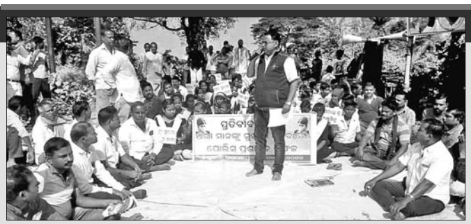
ରାସ୍ତାରେ ରୋକା କରିଥିବା ଗ୍ରାମବାସୀ ଓ ଛାତ୍ରୀଛାତ୍ରୀ