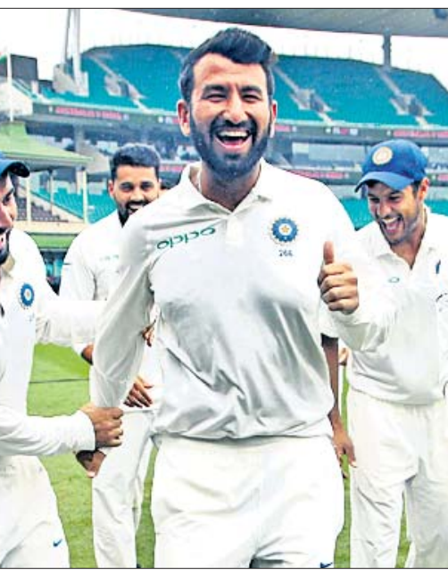
ଚେଷ୍ଟିକା କରୁଥିବା ପୂଜାରୀଙ୍କ ସହ ସାଥୀ ଖେଳାଳିମାନେ ଖୁସି ମନାଉଛନ୍ତି ।

ପୂଜାରୀ ଓ ବୁମରାଙ୍କ ପ୍ରଭାବୀ ପ୍ରଦର୍ଶନ ଯୋଗୁଁ ଭାରତୀୟ ଦଳ ଭାରତୀୟ ଚେଷ୍ଟିକାରେ ପ୍ରଥମଥର ଲାଗି ଭାରତୀୟ ଚେଷ୍ଟିକା କରିବାକୁ ହେଲେ ଆହୁରି ୩ ଯେସ୍ ବୋଲରଙ୍କ ଆବଶ୍ୟକତା ରହିଛି। ଏହି ସିରିଜରେ ଦଳ ସୁରକ୍ଷା ପ୍ରଦର୍ଶନ କରିଛି। ଆଗାମୀ ଚୁନାମେଧ ଲାଗି ଦଳକୁ ଶୁଭକାମନା।