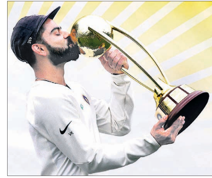
ବର୍ତ୍ତମାନ-ଗାଭାସ୍କର ଟ୍ରଫି ସହ ବିରାଟ କୋହିଲି।

ଦୀର୍ଘ ୭୧ ବର୍ଷ ପ୍ରତୀକ୍ଷାର ଅବସାନ ଘଟିଛି। ଭାରତୀୟ କ୍ରିକେଟ ଇତିହାସରେ ଯୋଗ ହୋଇଛି ନୂଆ ଅଧ୍ୟାୟ। ଅଷ୍ଟେଲିଆ ମାଟିରେ ସର୍ବପ୍ରଥମ ଟେଷ୍ଟ ସିରିଜ ବିଜୟ ହାସଲ କରିଛନ୍ତି ଚଳିଥିଲା। ପୂର୍ବରୁ ୧୧ ଉଦ୍ୟମରେ ଯାହା ସମ୍ଭବ ହୋଇ ନ ଥିଲା ତାହା ଏବେ କାମରେ କରି ଦେଖାଇଛନ୍ତି ବିରାଟ ସାହିନୀ। ସିଦ୍ଧୀ କ୍ରିକେଟ ଗ୍ରାଉଣ୍ଡରେ ଅନୁଷ୍ଠିତ ୪ର୍ଥ ତଥା ଅନ୍ତିମ କ୍ରିକେଟ ଟେଷ୍ଟରେ ଶେଷ ଦିବସ ଖେଳ ଖରାପ ପାଗ ଯୋଗୁ ସମ୍ଭବ ହୋଇ ନ ଥିଲା। ଫଳରେ ମ୍ୟାଚ ଡ୍ର ରହିବା ସହ ଭାରତ ୨-୧ରେ ସିରିଜ ବିଜୟ ହୋଇ ବର୍ତ୍ତମାନ-ଗାଭାସ୍କର ଟ୍ରଫି ହାସଲ କରିଛି। ୧୯୪୭-୪୮ ସିଜନରେ ଭାରତ-ଅଷ୍ଟେଲିଆ ଟେଷ୍ଟ ସିରିଜ ଆରମ୍ଭ ହୋଇଥିଲା। ଭାରତ ସ୍ୱାଧୀନ ହେବାର ଅଳ୍ପକିଛି ମାସ ପରେ ସେତେବେଳେ ଲାଲ ଅମରନାଥଙ୍କ ଦଳ ଅଷ୍ଟେଲିଆ ଯାଇ ସାର୍ ଡବ୍ ଗ୍ରାହ୍ୟମାନଙ୍କ ଟିମକୁ ଭେଟିଥିଲା। ୫ ମ୍ୟାଚ ବିଶିଷ୍ଟ ଏହି ସିରିଜରେ ଅଷ୍ଟେଲିଆ ୪-୦ରେ ବିଜୟ ହୋଇଥିଲା। ୧୯୬୭-