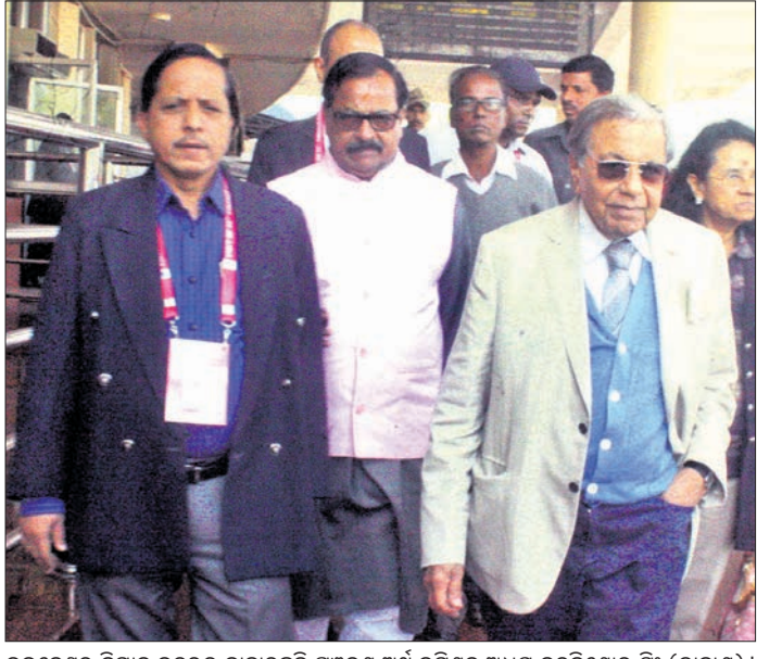
ଭୁବନେଶ୍ୱର ବିମାନ ବନ୍ଦରକୁ ବାହାରୁଛନ୍ତି ପଞ୍ଚଦଶ ଅର୍ଥ କମିଶନ ଅଧ୍ୟକ୍ଷ ନନ୍ଦକିଶୋର ସିଂ (ତାହାଣ)।

ଦେଶର ଅର୍ଥନୀତି ବିକାଶ ପାଇଁ ଓଡ଼ିଶା ଏକ ଆଗ୍ରାଣୀ ରାଜ୍ୟ ଭାବେ କାର୍ଯ୍ୟ କରିବାର ପର୍ଯ୍ୟାୟ ସୁଯୋଗ ରହିଛି। ଏବିଗରେ ଅର୍ଥ କମିଶନ କେଉଁ ଭୂମିକା ଗ୍ରହଣ କରି ପାରିବ ତାହା ଉପରେ ଯୋଜନା କରାଯିବ ବୋଲି ପଞ୍ଚଦଶ ଅର୍ଥ କମିଶନ ଅଧ୍ୟକ୍ଷ ନନ୍ଦକିଶୋର ସିଂ କହିଛନ୍ତି। ନନ୍ଦକିଶୋର ସୋମବାର ୩ ଦିନିଆ ଓଡ଼ିଶା ଗସ୍ତରେ ଆସିଛନ୍ତି। ରାଜ୍ୟ ସରକାରଙ୍କଠାରୁ ଆମେ ସ୍ମାରକ ପତ୍ର ପାଇଛୁ। ରାଜ୍ୟ ଅର୍ଥମନ୍ତ୍ରୀଙ୍କ ସହ ଆଲୋଚନା କରାଯିବ। ଚାଷୀଙ୍କ ପାଇଁ ରଣ କ୍ଷାତ୍ର କିମ୍ବା ଅନ୍ୟାନ୍ୟ ସହାୟତା ବିଷୟରେ ଆମେ ଆଲୋଚନା କରିବୁ ନାହିଁ। ତାହା ରାଜ୍ୟ ସରକାରଙ୍କ ବିଷୟ। ରାଜ୍ୟ ସରକାର ରାଜ୍ୟର ଆର୍ଥିକ ବିକାଶ ଓ ଅର୍ଥନୀତି ଉପରେ କ'ଣ ସବୁ ପଦକ୍ଷେପ ନେଇଛନ୍ତି, ଏପରିକି ଓଡ଼ିଶାରେ ଆର୍ଥିକ ବିକାଶ ଦିଗରେ କ'ଣ ସବୁ ସୁଯୋଗ ଓ ଚ୍ୟାଲେଞ୍ଜ ରହିଛି ସେହି ଉପରେ ଆଲୋଚନା ହେବାର କାର୍ଯ୍ୟକ୍ରମ ରହିଛି ବୋଲି କମିଶନ ଅଧ୍ୟକ୍ଷ କହିଛନ୍ତି। ଅର୍ଥ କମିଶନ ଅଧ୍ୟକ୍ଷ ଓ ଅନ୍ୟ