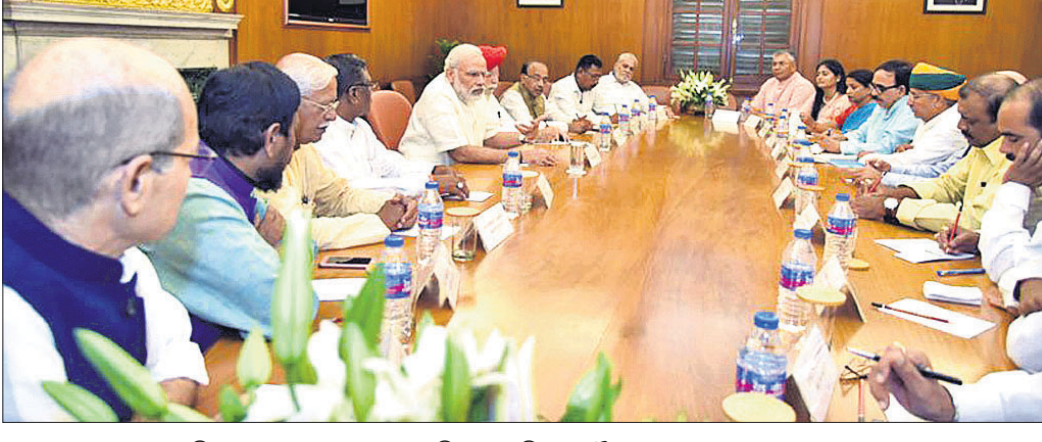
ପ୍ରଧାନମନ୍ତ୍ରୀ ନରେନ୍ଦ୍ର ମୋଦିଙ୍କ ଅଧ୍ୟକ୍ଷତାରେ ସୋମବାର ବସିଥିବା କ୍ୟାବିନେଟ୍ ବୈଠକ।

ବିରୋଧୀ ସମାଲୋଚନା କରିଛନ୍ତି। ଉକ୍ତ କାବିର ଆର୍ଥିକ ଦୁର୍ବଳ ଭାବେ କେଉଁମାନଙ୍କୁ ବିବେଚିତ କରାଯିବ ତାହାର ଏକ ମାପଦଣ୍ଡ ସରକାର ନିର୍ଦ୍ଧାରଣ କରିଛନ୍ତି। ଯେଉଁମାନଙ୍କ ବାର୍ଷିକ ଆୟ ୮ ଲକ୍ଷ ଟଙ୍କା କମ୍ ହୋଇଥିବ ଏବଂ ୫ ଏକରୁ କମ୍ ଚାଷଜମି ଥିବ ସେମାନେ ଏହି ସଂରକ୍ଷଣ ସୁବିଧା ପାଇବାକୁ ଯୋଗ୍ୟ ବିବେଚିତ ହେବେ ବୋଲି କେନ୍ଦ୍ରମନ୍ତ୍ରୀ