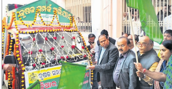
କାଳିଆ ଯୋଜନା ପତାକା ହଲାଇ ସଚେତନତା ରଥ ଉଦ୍‌ଘାଟନ କରୁଛନ୍ତି