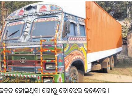
ଜବତ ହୋଇଥିବା ଗୋରୁ ବୋଝେଇ କଣ୍ଠେନର।

ଭଲେଜର ଗାଡ଼ିରେ ଥିବା ଯୁବକମାନେ ଏ ସମ୍ପର୍କରେ ଭଦ୍ରକ ଗଞ୍ଜନ ପୋଲିସକୁ ଖବର ଦେଇଥିଲେ। ଗଞ୍ଜନ ପୋଲିସ୍ ୧୬ ନମ୍ବର ଜାତୀୟ ରାଜପଥ ତାହାଣିଗଡ଼ିଆ ନିକଟରୁ ଗୋରୁ ବୋଝେଇ କଣ୍ଠେନରୁ ଜବତ କରିଥିଲା।