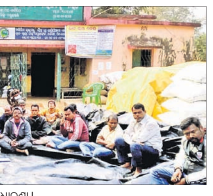
ବାସିପିଠା ଲ୍ୟାଣ୍ଡ ସମ୍ପର୍କରେ ଉତ୍ତେଜନା ଚାଷୀଙ୍କ ଧାରଣା।

ଖୁଞ୍ଜା, ୯୧ (ଡି.ଏନ.ଏ.) ଖୁଞ୍ଜା ବ୍ଲକ୍ ଅଧୀନ ବାସିପିଠା ଲ୍ୟାଣ୍ଡରେ ଧାନ ଜିଣାରେ ଅବ୍ୟବସ୍ଥା ଯୋଗୁ ବୁଧବାର ଚାଷୀଙ୍କ ମଧ୍ୟରେ ଉତ୍ତେଜନା ବେଶ୍ ଦେଖାଯାଇଛି।