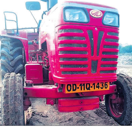
ଦୁର୍ଭବ ଛଡ଼ାଇ ନେଇଥିବା ଟ୍ରାକ୍ଟର।

ବଡ଼ସାହି, ୯୧ (ସ୍ୱ.ପ୍ର) ବଡ଼ସାହି ତହସିଲ ଅଧୀନ ବୁଢ଼ାବଳଙ୍ଗ ନଦୀ ପାରାରେ ଚୋରାଚୋର ବାଲି ବୋଝେଇ କରି ଯାଉଥିବା ଏକ ଟ୍ରାକ୍ଟରକୁ ପ୍ରଶାସନ ଉପସ୍ଥିତିରେ କେତେକ ଲୋକେ ଛଡ଼ାଇ ନେଇଛନ୍ତି।