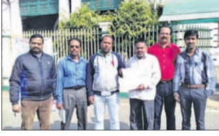
ରାଜସ୍ୱାୟୀ, ୯୧ (ଡି.ଏନ.ଏ.)

ବାରପଦା ଅଫିସ୍, ୯୧ ମୟୂରଭଞ୍ଜ ଜିଲ୍ଲା ଓ ଝାଡ଼ଖଣ୍ଡ ସଂଯୋଗ କରୁଥିବା ବୁଢ଼ାମାମା-ଚାକୁଳିଆ ୪୦ କି.ମି. ଦୂରତା ବିଶିଷ୍ଟ ରେଳପଥ ନିର୍ମାଣ ନିମନ୍ତେ ସର୍ବେ କାମ ଆରମ୍ଭ ହୋଇଛି।