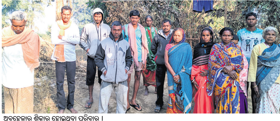
ଅବହେଳାର ଶିକାର ହୋଇଥିବା ପରିବାର ।

କୋରୁକୋଣ୍ଡା ବ୍ଲକ୍ ସଦର ମହକୁମାସ୍ଥିତ ଖ୍ରୀଷ୍ଟିୟାନ ସାହିରେ ପୋଲ ଅପର ପାର୍ଶ୍ୱରେ ଥିବା ବୋରାଗୁଡ଼ା ଗ୍ରାମରେ ୧୨ଟି ପରିବାର ଦୀର୍ଘ ୩୦ ବର୍ଷ ହେଲା ବାସ କରୁଛନ୍ତି । ଏହି ପରିବାରଗୁଡ଼ିକ ପ୍ରତି ପ୍ରଶାସନ ଅଣଦେଖା କରି ଚାଲିଥିବା ଅଭିଯୋଗ ହେଉଛି । ୧୨ଟି ପରିବାରରୁ ୬ଟି ପରିବାର ସରକାରଙ୍କ ବିଭିନ୍ନ ଯୋଜନାକୁ ବଞ୍ଚିତ ହୋଇଛନ୍ତି । ୩୦ବର୍ଷର ବାସିନ୍ଦା ହୋଇଥିଲେ ମଧ୍ୟ କୌଣସି ପରିବାରରେ ବିଦ୍ୟୁତ୍ ସଂଯୋଗ ହୋଇପାରିନାହିଁ । ବାରମ୍ବାର ପ୍ରଶାସନିକ ଅଧିକାରୀଙ୍କୁ କଣ୍ଠାକଲେ ମଧ୍ୟ କୌଣସି ସୁଫଳ ମିଳିନାହିଁ । ୧୨ଟି ପରିବାର ପାଇଁ ରହିଛି ଗୋଟିଏ ନକଲ୍ । ତେବେ ଏହାର ପାଣି ପାନୀୟ ଉପଯୋଗୀ ନୁହେଁ । ନକଲ୍ ପୂର୍ଣ୍ଣ ବାହାରିବା ପାଣିର ରଙ୍ଗ ନାଲି ହୋଇଥିବାରୁ ଏହାକୁ ପାଟିରେ ଦେଇ ହେଉନାହିଁ । ଫଳରେ ଗ୍ରାମବାସୀ ନିକଟସ୍ଥ ନଦୀ