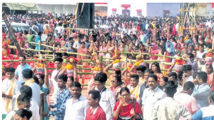
ମହୋତ୍ସବରେ ଉପସ୍ଥିତ ଜନସାଧାରଣ ।