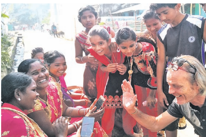
ବେଲଜିୟମର ଜଣେ ପର୍ଯ୍ୟଟକ କଳାକାରମାନଙ୍କ ସହିତ ଭାବ ବିନିମୟ କରୁଛନ୍ତି ।