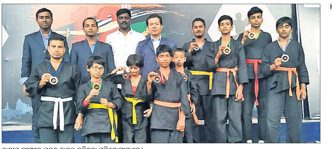
ଜାତୀୟ କୁଫୁରେ ପଦକ ହାସଲ କରିଥିବା ପ୍ରତିଯୋଗୀମାନେ।

ଫୁଲ ଓ ସାଖା (ଫାଇଲ୍)ରେ ୨ ସ୍ୱର୍ଣ୍ଣ, ହାରଦ୍ରାବାଦର ଗାନ୍ଧିପାଠିକ ଇନ୍ଦ୍ରଜିତ ଶୁଭେନ୍ଦ୍ରମେ ୧୨ତମ ଜାତୀୟ କୁଫୁ ପ୍ରତିଯୋଗିତା ଅନୁଷ୍ଠିତ ହୋଇ ଯାଇଛି।