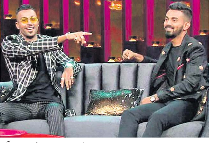
ହାର୍ଦିକ ପାଣ୍ଡ୍ୟା ଓ କୋହଲିଙ୍କ ରାହୁଲ।

ନୂଆଦିଲ୍ଲୀ/ସିନ୍ଧୁ, ୧୧୧ (ପି.ଟି.) ଏକ ଟିଭି ଶୋ'ରେ ମହିଳାଙ୍କ ଉପରେ ବିବାଦୀୟ ମନ୍ତବ୍ୟ ଦେଇଥିବା ଅଭିଯୋଗରେ ଭାରତୀୟ କ୍ରିକେଟର ହାର୍ଦିକ ପାଣ୍ଡ୍ୟା ଓ କେ.ଏଲ୍ ରାହୁଲ ଭାରତର କ୍ରିକେଟ ପ୍ରଶାସକ (ସିଓଏ) ଦ୍ୱାରା ଶୁକ୍ରବାର ସସ୍ପେଣ୍ଡ ହୋଇଛନ୍ତି। ଅଧିନାୟକ ବିରାଟ କୋହଲି ଖେଳାଳିମାନଙ୍କ ମନ୍ତବ୍ୟକୁ ସମାଲୋଚନା କରିବାର କିଛି ଘଣ୍ଟା ପରେ ଏହି ଦସ୍ତାବିଜ ଆଜି ଘୋଷଣା କରାଯାଇଛି। ଫଳରେ ସିନ୍ଧୁଗାଠାରେ ଶିବିରର ଆରମ୍ଭ ହେବାକୁଥିବା ମ୍ୟାଚ ବିଶିଷ୍ଟ ଅଷ୍ଟ୍ରେଲିଆ ବିପକ୍ଷ ଅନ୍ତର୍ଜାତୀୟ ଦିନିକିଆ ସିରିଜକୁ ଏହି ଖେଳାଳିମାନଙ୍କୁ ବାଦ ଦିଆଯାଇଛି। ସେମାନଙ୍କୁ ଭୁବନେଶ୍ୱରରେ ପଠାଇ ଦିଆଯିବାର ବ୍ୟବସ୍ଥା କରାଯାଇଛି। ପାଣ୍ଡ୍ୟା ଓ ରାହୁଲଙ୍କ ବିରୋଧରେ ଆନୁଷ୍ଠାନିକ ତଦନ୍ତ ଆରମ୍ଭ କରାଯିବ। ଏହା ପୂର୍ବରୁ ସେମାନଙ୍କ ବିରୋଧରେ ସାନି କାରଣଦର୍ଶୀ ଆ ନୋଟିସ ଜାରି କରାଯିବ। ସିଓଏ ଟେଲିଭିସନର ବିନୋଦ ରାୟ ଏହି ସୂଚନା ଦେଇଛନ୍ତି। ଅନ୍ୟପକ୍ଷରେ ଏହି ଦୁଇ କ୍ରିକେଟରଙ୍କୁ ନେଇ 'କଫି ଓ ଫୁଲ କରନ୍'ର ଅଧ୍ୟାୟକ୍ତ ସମ୍ପୂର୍ଣ୍ଣ ବ୍ୟାନେଇ ଏହାର ଅନୁଲୋଚନା ପ୍ରାଥମିକତା ହେବ ବୋଲି ଦେଖିଲେ। ବିଷୟର ତଦନ୍ତ ଭାରତୀୟ କ୍ରିକେଟ କଣ୍ଟ୍ରୋଲ ବୋର୍ଡ(ବିସିଆଇ)ର ଆଇଡ଼ରଗଣ କମିଟି କିମ୍ବା ଇଣ୍ଡିଆନ୍ କ୍ରିକେଟ କଣ୍ଟ୍ରୋଲ ବୋର୍ଡ(ବିସିଆଇ)ର ଅଧିକାରୀଙ୍କୁ ଜାରି କରିଥିଲେ।