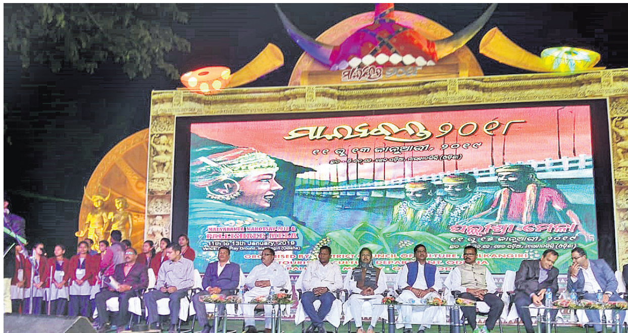
ଜିଲ୍ଲାସ୍ତରୀୟ ମାଲ୍ୟବତ ମହୋତ୍ସବରେ ମଞ୍ଚାୟାନ ଅତିଥି ।