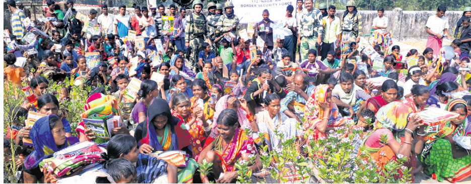
ଶିବିରରେ ଯୋଗ ଦେଇଥିବା ଜନସାଧାରଣ ।