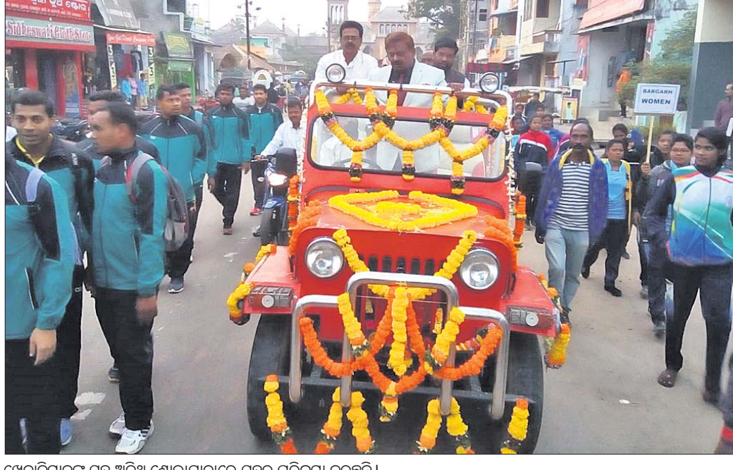
ଖେଳାଳିମାନଙ୍କ ସହ ଅତିଥି ଶୋଭାଯାତ୍ରାରେ ସହର ପରିକ୍ରମା କରୁଛନ୍ତି।

ରଜପତି ଜିଲ୍ଲା ସଦରମହକୁମା ପାରଳାଖେମୁଣ୍ଡିଠାରେ ଶୁକ୍ରବାର ୬୬ତମ ରାଜ୍ୟସ୍ତରୀୟ ଦିବାରାତ୍ର କବାଡ଼ି ଟୁର୍ନାମେଣ୍ଟ ଉଦ୍‌ଘାଟିତ ହୋଇଛି। ଏହା ୧୩ତାରିଖ ପର୍ଯ୍ୟନ୍ତ ଚାଲିବ। ରାଜ୍ୟ କବାଡ଼ି ସଂଘ ଓ ପାରଳା ସ୍ୱାଜିମାନ ମଞ୍ଚ ମିଳିତ ଆନୁକୁଲ୍ୟରେ ହାଇଲେଭ୍ ପ୍ଲାଇ ସମ୍ପୂର୍ଣ୍ଣ ଖେଳପଡ଼ିଆରେ ଏହାର ଆୟୋଜନ କରାଯାଇଛି। ଏଥିରେ ବିଭିନ୍ନ ଜିଲ୍ଲା ୨୮ଟି ପୁରୁଷ ଦଳ ଓ ୨୪ଟି ମହିଳା ଦଳ ଭାଗ ନେଇଛନ୍ତି। ବିଭିନ୍ନ ଦଳର ଖେଳାଳି, ପରିଚାଳକ ଏବଂ କର୍ମଚାରୀଙ୍କୁ ମିଶାଇ ପ୍ରାୟ ୮୫୫ ଜଣ ବ୍ୟକ୍ତି ଏଠାରେ ଆସି ପହଞ୍ଚିଛନ୍ତି। ଗ୍ଲାନୀୟ ରାଜନାଥ ସମ୍ପୂର୍ଣ୍ଣ ଖେଳାଳିମାନେ ଭୁଜିତ ଧାଡ଼ିରେ ଶୋଭାଯାତ୍ରାରେ ବାହାରି ସହର ପରିକ୍ରମା କରିଥିଲେ। ଅତିଥି ଭାବେ ପାରଳା ସ୍ୱାଜିମାନ ମଞ୍ଚର ମୁଖ୍ୟ ଚିରୁପତି