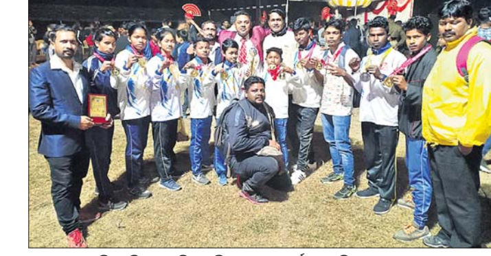
ଜାତୀୟ ସ୍କୁଲ କିକ୍‌ବକ୍ସିଂ ସବ୍‌ଜୁନିୟର ବିଭାଗରେ ରନର୍ସଅପ୍ ଓଡ଼ିଶା ଦଳ।

ଭୁବନେଶ୍ୱର, ୧୧୧(କ୍ରୀଡ଼ା ପ୍ରତିନିଧି) ସବ୍‌ଜୁନିୟର କାଟେଗୋରିରେ ଭାଗ ନେଇଥିବା ୧୦ ଜଣୀୟ ଓଡ଼ିଶା ଦଳ ୧୦ ବିଏସ୍‌ଏଫ କ୍ୟାମ୍ପରେ ଅର୍ଜୁନ ଆଇଏକେଓ(ଇଣ୍ଡିଆନ ଆସୋସିଏସନ ଅଫ୍ କିକ୍‌ବକ୍ସିଂ ଅଗାମାଲକେଶନ) ଜାତୀୟ ସ୍କୁଲ କିକ୍‌ବକ୍ସିଂ ଚାମ୍ପିୟନଶିପ୍‌ରେ ସବ୍‌ଜୁନିୟର କାଟେଗୋରିରେ ଓଡ଼ିଶା ରନର୍ସଅପ୍ ହୋଇଛି। ପ୍ରତିଯୋଗିତାରେ ଖୁବ୍‌ଜୁନିୟର ପାଖାପାଖି ୪୦୦ ପ୍ରତିଯୋଗୀ ଅଂଶଗ୍ରହଣ କରିଥିଲେ।