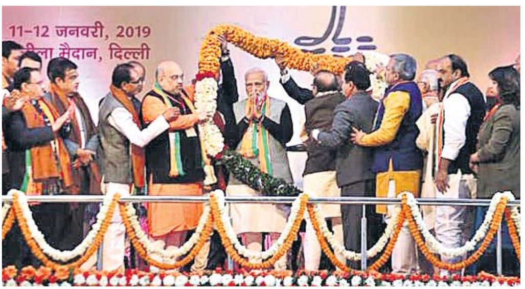
ଭାଜପା ରାଷ୍ଟ୍ରୀୟ ଅଧିବେଶନର ଉଦ୍‌ଘାଟନା ସମାରୋହରେ ଅଧ୍ୟକ୍ଷ ଅମିତ ଶାହ ଓ ପ୍ରଧାନମନ୍ତ୍ରୀ ନରେନ୍ଦ୍ର ମୋଦିଙ୍କ ସହ ଦଳୀୟ ନେତୃବୃନ୍ଦ।