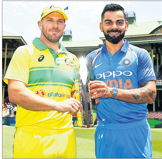
ଦିନିକିଆ ସିରିଜ ଟ୍ରଫି ସହ ଅଧିନାୟକ ଆରୋନ୍ ଫିଞ୍ଚ ଓ ବିରାଟ କୋହଲି।

ଶନିବାରଠାରୁ ଆରମ୍ଭ ହେବାକୁ ଯାଉଛି ଅଷ୍ଟ୍ରେଲିଆ ବିପକ୍ଷ ଦିନିକିଆ ସିରିଜ। ଚେଷ୍ଟା ସିରିଜରେ ଐତିହାସିକ ବିଜୟ ହାସଲ କରିବା ପରେ ଭ୍ରମଣକାରୀ ଭାରତ ୩ ମ୍ୟାଚ ବିଶିଷ୍ଟ ଏହି ଦିନିକିଆ ସିରିଜରେ ବାକି ମାଟିବା ଲକ୍ଷ୍ୟରେ ରହିଛି।