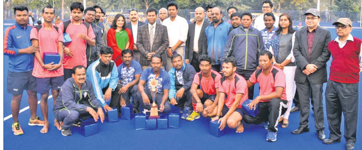
ପୂର୍ବାଞ୍ଚଳ ଏଜି ହକି ଟୁର୍ନାମେଣ୍ଟରେ ଚାମ୍ପିୟନ ପଶ୍ଚିମବଙ୍ଗ ଓ ରନର୍ସଅପ୍ ଓଡ଼ିଶା ଦଳ ପୁରୁଷର ସହ ଅତିଥି ଗ୍ରହଣରେ।