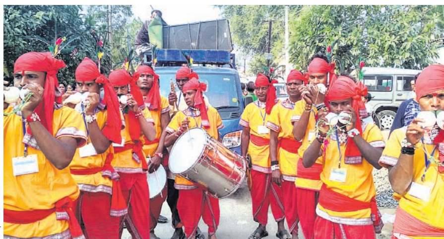
ଗଞ୍ଜାମର କଳାକାରମାନେ ଯୋଡ଼ିଶାଖ ବଜାଉଛନ୍ତି ।