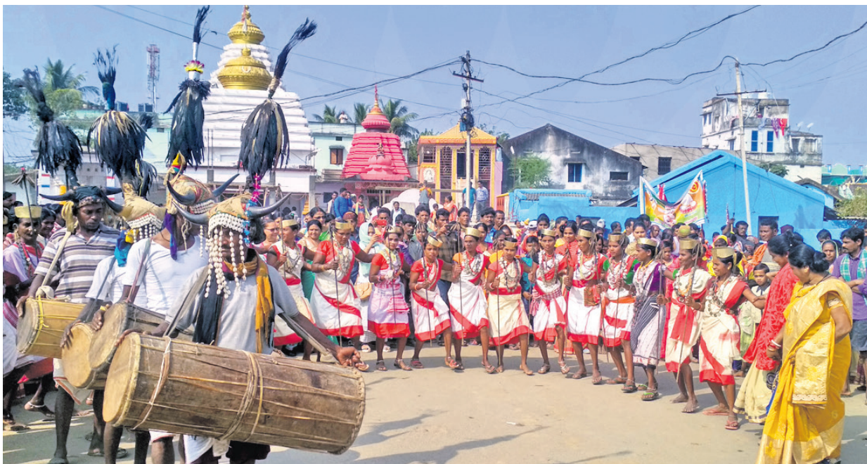
କଳାକାରମାନେ କୋଝା ଓ ଶିଳା ନୃତ୍ୟ ପ୍ରଦର୍ଶନ କରୁଛନ୍ତି ।