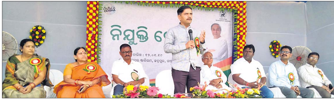
ନିୟୁକ୍ତି ମେଳା ଉଦ୍ଘାଟନ କାର୍ଯ୍ୟକ୍ରମରେ ଜିଲ୍ଲାପାଳ ସୂଚନା ଦେଉଛନ୍ତି।

ରାଜ୍ୟ ସରକାରଙ୍କ ଓଡ଼ିଶା ଦକ୍ଷିଣା ବିକାଶ ପ୍ରାଧିକାରୀ ଓ ଗଞ୍ଜାମ ଜିଲ୍ଲା ପ୍ରଶାସନର ମିଳିତ ଆନ୍ତରାଳୀୟ ଛତ୍ରପୁର କ୍ଷୁଦ୍ରମାନବ ଶନିବାର ଜିଲ୍ଲାସ୍ତରୀୟ ନିୟୁକ୍ତି ମେଳା ଅନୁଷ୍ଠିତ ହୋଇଥିଲା।