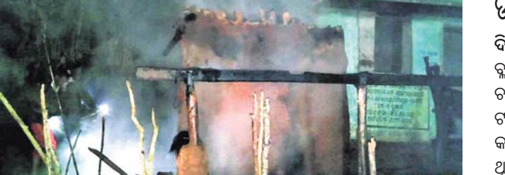
ଅଗ୍ନିକାଣ୍ଡରେ ଘର ପୋଡିଯାଇଛି ।

କନ୍ଧମାଳଜିଲ୍ଲା ରାଉଁଜିଆ ବ୍ଲକ୍‌କରତାଗ୍ରାମରେ ଶନିବାର ସକାଳୁ ଅଗ୍ନିକାଣ୍ଡ ଘଟି ବ୍ରହ୍ମପୁରର ଫିହରାପାଳ ଘର ପୋଡି ଯାଇଛି।