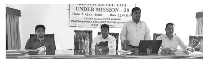
ତାଲିମ ଶିବିରରେ ମହାଧିକାରୀ ଅତିଥି। ଯୁବକ ଯୁବତୀମାନଙ୍କୁ ସେମାନଙ୍କ ଯୋଗ୍ୟତା ମୂଳକ ଭାବେ ତାଲିମ ଯୋଜନା ଉପରେ ଆଲୋଚନା କରାଯାଇଥିଲା।

ଆସିକା, ୧୨୧(ଡି.ଏନ୍.ଏ.) ଆସିକା ବ୍ଲକ୍ ସଭା ଗୃହରେ ଶୁକ୍ରବାର ରୁଜୁ ଯୁଗାୟ ଦି ଦି ଯତ୍ନ ଉପାଧ୍ୟାୟ ଗ୍ରାମୀଣ କୌଶଳ ଯୋଜନା ତାଲିମ ଶିବିର ସଭାରେ ଗ୍ରାମର ସାମଗ୍ରିକ ଅଧିକାରୀ ଅନୁଷ୍ଠିତ ହୋଇଥିଲା।