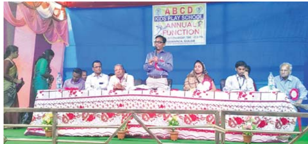
ମଞ୍ଚାସୀନ ଅତିଥିବୃନ୍ଦ । ବେଗୁନିଆପଡ଼ା, ୧୨।୧(ଡି.ଏନ.ଏ.)

ବେଗୁନିଆପଡ଼ାସ୍ଥିତ ଏକସିଡି କିଡ଼ି ସ୍କୁଲର ଦ୍ୱିତୀୟ ବାର୍ଷିକ ଉତ୍ସବ ଗୁରୁବାର ପାଳିତ ହୋଇଯାଇଛି। ବିଦ୍ୟାଳୟର ଉପଦେଷ୍ଟା ସାମାଜିକ ଶତପଥୀଙ୍କ ସଭାପତିତ୍ୱ ଅନୁଷ୍ଠିତ ଉତ୍ସବ ବୃକ୍ଷ ଅଧିକା କେ. ରାଜକଲ୍ୟାଣୀ ଦୋଢା ଉଦ୍‌ଘାଟନ କରିଥିଲେ।