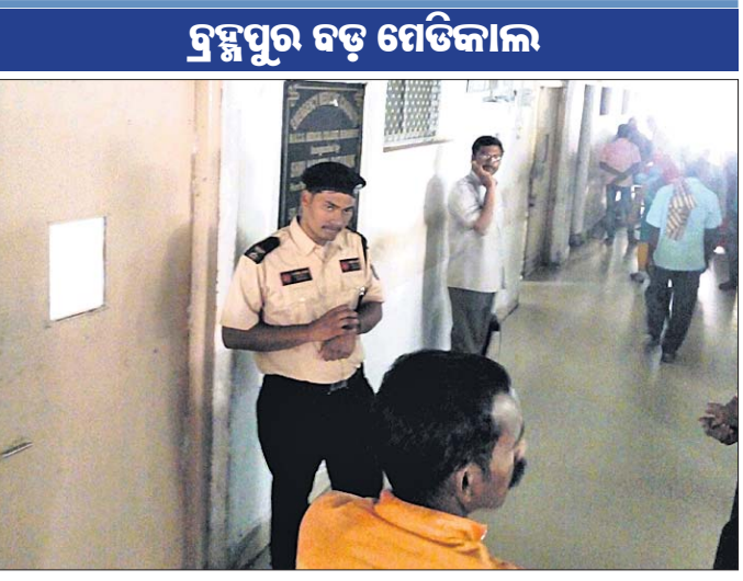
କାନ୍ଥୁଆଲିଟିରେ ବିଦ୍ୟୁତ୍ ସେବା ବିଚ୍ଛିନ୍ନ ସମୟର ଦୃଶ୍ୟ । ତାହା ଆପେ ଆପେ ଯେଭଳି କାର୍ଯ୍ୟକ୍ଷମ ହେବ ସେଥିନେଇ ପଦକ୍ଷେପ ଗ୍ରହଣ କରାଯାଇଛି ।

ବ୍ରହ୍ମପୁର ବଡ଼ ମେଡିକାଲର କାନ୍ଥୁଆଲିଟି (ଆଣ୍ଡୁ ଚିକିତ୍ସା ବିଭାଗ)ରେ ଶନିବାର ଅପରାହ୍ନରେ ୧୬ ମିନିଟ୍ ବିଦ୍ୟୁତ୍ ସରବରାହ ବିଚ୍ଛିନ୍ନ ହୋଇଥିବା ଦେଖିବାକୁ ମିଳିଥିଲା । ଫଳରେ ଉକ୍ତ ସମୟରେ ରୋଗୀ ସେବା ବାଧାପ୍ରାପ୍ତ ହୋଇଥିବା ଅଭିଯୋଗ ହୋଇଥିଲା । ୧୬ ମିନିଟ୍ ପରେ ବିଦ୍ୟୁତ୍ ସରବରାହ ସ୍ୱାଭାବିକ ହୋଇଥିବା ଦେଖିବାକୁ ମିଳିଥିଲା । ପ୍ରକାଶଯେ, ୨୪ ଘଣ୍ଟା ଆନବରତ ବିଦ୍ୟୁତ୍ ସରବରାହ ରହିବା ସହିତ ରୋଗୀଙ୍କୁ ସମସ୍ୟା ଯେପରି ନ ଆସେ ସେଥିପାଇଁ ବ୍ରହ୍ମପୁର ବଡ଼ ମେଡିକାଲରେ ସାଧାରଣ ଲେଭ୍ ଡିଭିଜନ (କମ୍ ଶବ୍ଦର ଡିଭିଜନ) କେନ୍ଦ୍ରରେ ଘୁାପନ ହୋଇଛି । ଏହା ଉଚ୍ଚ କ୍ଷମତା ସମ୍ପନ୍ନ ଏବଂ ସ୍ୱୟଂଚାଳିତ ହୋଇଥିବାରୁ କୌଣସି କାରଣରୁ ବିଦ୍ୟୁତ୍ ସେବା ବିଚ୍ଛିନ୍ନ ହେଲେ ବନ୍ଦୋବସ୍ତ ସହେ କାନ୍ଥୁଆଲିଟିରେ ଦୀର୍ଘ ୧୬ ମିନିଟ୍ ଯାଏ ବିଦ୍ୟୁତ୍ ନ ରହିବା କରାଯାଇଛି । ତେବେ ଏଭଳି ସମସ୍ତ