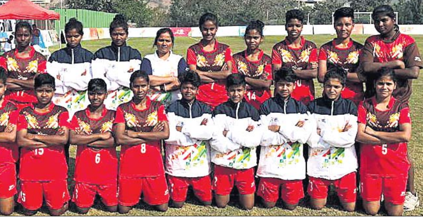
ବିଜୟ ହାସଲ ପରେ ୧୭ ବର୍ଷରୁ କମ୍ ଓଡ଼ିଶା ବାଳିକା ପୁରବଳ ଦଳ।