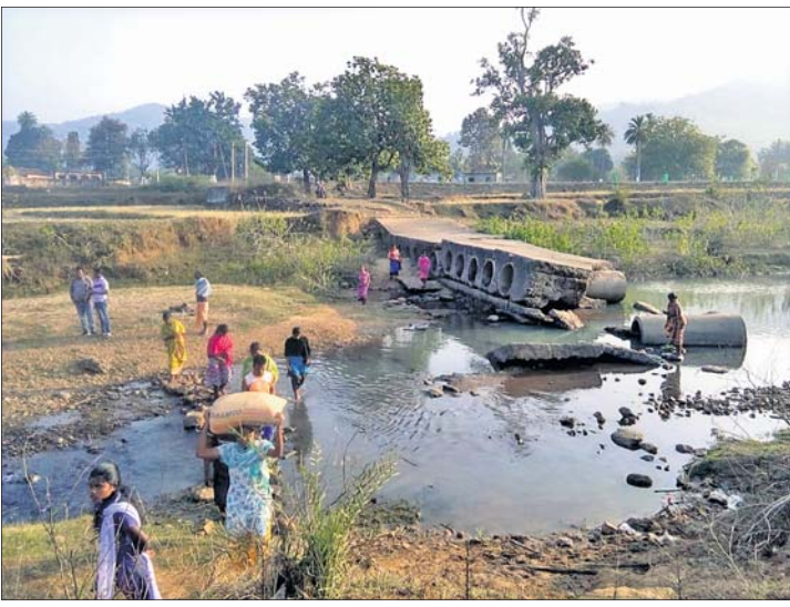
ନାଳ ପାର ହୋଇ ଲୋକେ ଯାଉଛନ୍ତି।

ଫିରିଙ୍ଗିଆ ବ୍ଲକ୍ ଡିଭିଜନାଲ ପଞ୍ଚାୟତ ଚେଳାପାଲିର ସିଦ୍ଧାନ୍ତପଦର ଗ୍ରାମରେ ଏବେ ବି ବିଚ୍ଛିନ୍ନାଞ୍ଚଳ ଭଳି ଅନେକ ସମସ୍ୟା ରହିଛି।