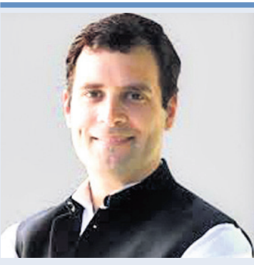
■ ରାହୁଲଙ୍କ ଗପ୍ତ ନେଇ ପୂର୍ବରତା ■ ରାଜଧାନୀରେ ହେବ ସମାବେଶ, ବୁଦ୍ଧିଜୀବୀ ସମ୍ମିଳନୀ ■ ଛୋଟ ଦଳ ସହ ମେଣ୍ଡ ସମାବେଶ