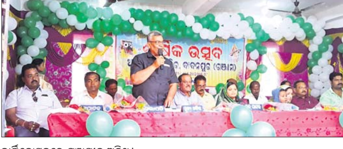
ବାର୍ଷିକୋତ୍ସବରେ ମଞ୍ଚାସୀନ ଅତିଥି ।