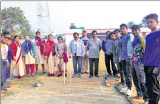
ଗଞ୍ଜାମ, ୧୨।୧(ଡି.ଏନ.ଏ.): ଗଞ୍ଜାମ ସହରସ୍ଥିତ ଭାରତୀ ବିନ୍ୟାପୀଠ ମିଳିତ କ୍ରିକେଟ ଟୁର୍ଣ୍ଣାମେଣ୍ଟରେ ୧୦ମ ଶ୍ରେଣୀର ଛାତ୍ର ବିଜୟୀ ହୋଇଥିଲେ।