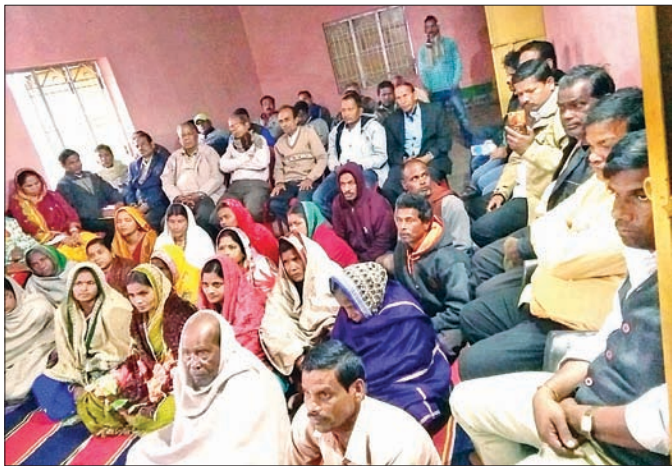
ବୈଠକରେ ଉପସ୍ଥିତ ଆଞ୍ଚଳିକ ସୁରକ୍ଷା ସମିତି କର୍ମକର୍ତ୍ତା ଓ ଅନ୍ୟମାନେ।

ଭୂତମୁଖାଇଠାରେ ନିର୍ମାଣ ହେବାକୁ ଥିବା ଟ୍ରକ୍ ଚର୍ଚ୍ଚନାକୁ ବିରୋଧ କରି ଶନିବାର ସନ୍ଧ୍ୟାରେ ଗ୍ରାମୀଣ ରାଜାବ ଗାନ୍ଧୀ ସେବାକେନ୍ଦ୍ରରେ ଆଞ୍ଚଳିକ ସୁରକ୍ଷା ସମିତି ପକ୍ଷରୁ ଏକ ବୈଠକ ଅନୁଷ୍ଠିତ ହୋଇଛି। ଆସନ୍ତା ମଙ୍ଗଳବାରଠାରୁ ଫେବୃଆରୀ ୧୨ ପର୍ଯ୍ୟନ୍ତ ପ୍ରସ୍ତାବିତ ନିର୍ମାଣ ସ୍ଥଳରେ ସମିତି ପକ୍ଷରୁ ଧାରଣା ଦିଆଯିବ ବୋଲି ଏଥିରେ ନିଷ୍ପତ୍ତି ହୋଇଛି। ପ୍ରକାଶ ଯେ, ପୂର୍ବରୁ ପିଟିଏ (ପାରାଦୀପ ଉନ୍ନୟନ କର୍ମସୂଚୀ) ଟ୍ରକ୍ ଚର୍ଚ୍ଚନା ପାଇଁ ଯେଉଁ ନକ୍ସା ପ୍ରସ୍ତୁତ କରିଥିଲେ ତାହାକୁ ଅଣଦେଖା କରି ବନ୍ଦର ପକ୍ଷରୁ ଭୂତମୁଖାଇର ଜନସମିତି ନିକଟରେ ଚର୍ଚ୍ଚନା କରିବାକୁ ଯୋଜନା ଚାଲିଛି। ଶିଳ୍ପ ପ୍ରଭାବରେ ହେଉଥିବା ପ୍ରଦୂଷଣ ଯୋଗୁଁ ଗ୍ରାମୀଣ ଲୋକେ ବହୁ ରୋଗବ୍ୟାଧିର ଶିକାର ହୋଇଆସୁଛନ୍ତି। ଏପରି ସ୍ଥିତିରେ ସାଧାରଣ ଲୋକଙ୍କ ସ୍ୱାସ୍ଥ୍ୟସେବାକୁ ଗୁରୁତ୍ୱ ଦେବା ଶିଳ୍ପ ସଂଗ୍ରା ଓ ବନ୍ଦରର ଆଇନଗତ ଦାୟିତ୍ୱ ହୋଇଥିବାବେଳେ