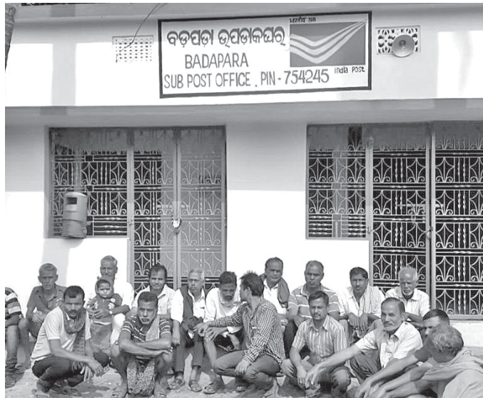
ଉପ ଡାକଘର ତାଲା ପକାଇ ଗ୍ରାମବାସୀ ଧାରଣାରେ ବସିଛନ୍ତି ।

ଡେରାବିଶା, ୧୨୧୧ (ସ.ପ୍ର.): ଡେରାବିଶା ଡିଗ୍ରୀ ମହିଳା ମହାବିଦ୍ୟାଳୟ ପରିସରରେ ଛାତ୍ରୀ ଆତ୍ମରକ୍ଷା କୌଶଳ ଶିବିର ଗୁରୁତ୍ୱପୂର୍ଣ୍ଣ ଭାବେ ଆୟୋଜନ କରାଯାଇଛି ।