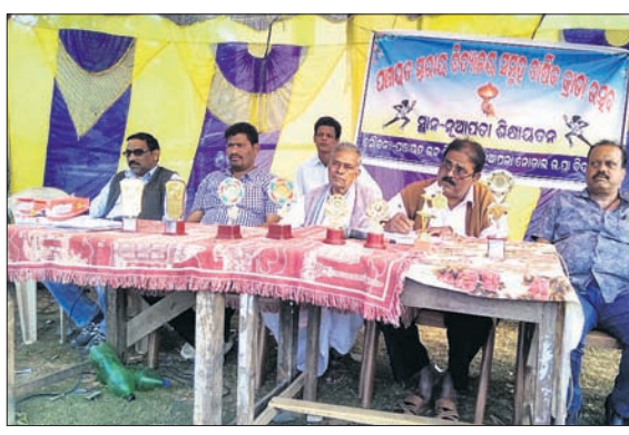
ବାର୍ଷିକ କ୍ରୀଡା ଉଦ୍‌ଯାପନା ଉତ୍ସବରେ ଯୋଗ ଦେଇଥିବା ଅତିଥି