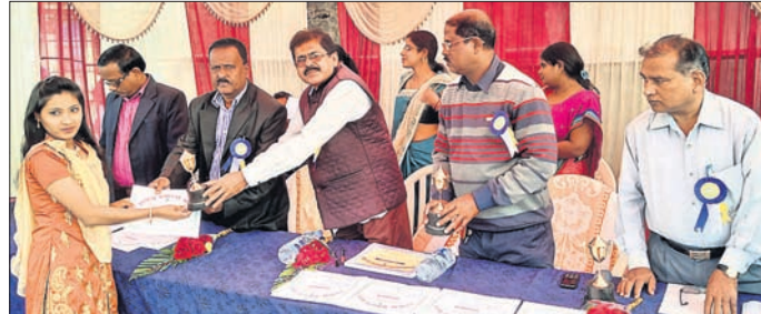
ଅତିଥି ଜଣେ କୃତା ଛାତ୍ରୀଙ୍କୁ ପୁରସ୍କୃତ କରୁଛନ୍ତି।