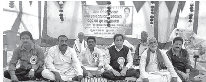
ଉତ୍ସବରେ ଉପସ୍ଥିତ ଅତିଥିମାନଙ୍କୁ ।

ଡେରାବିଶା ଡିଗ୍ରୀ ମହିଳା ମହାବିଦ୍ୟାଳୟ ପରିସରରେ ଛାତ୍ରୀ ଆତ୍ମରକ୍ଷା କୌଶଳ ଶିବିର ଗୁରୁତ୍ୱପୂର୍ଣ୍ଣ ଭାବେ ଆୟୋଜନ କରାଯାଇଛି ।