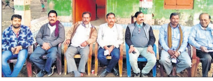
ଖବରଦାତା ସମ୍ମିଳନୀରେ କଂଗ୍ରେସ ନେତୃମଣ୍ଡଳୀ।

୨୫ହଜାର ଟଙ୍କା ସତରତନ ଖର୍ଚ୍ଚ ପାଇଁ ଯାଏନ୍‌ସିଆର କରାଯାଇଥିବା ବେଳେ ସରକାରଙ୍କ ପ୍ରଣୀତ ଆମ ଗାଁ ଆମ ବିକାଶ ଯୋଜନା ଏବେ ଆମ ବିନାଶ ଯୋଜନାରେ ପରିଣତ ହୋଇଛି। ଉତ୍କଳା ଯୋଜନା-ଆହାର ଯୋଜନା, ଯୁବବାହିନୀ- ଗୁଣ୍ଡାବାହିନୀରେ ପରିଣତ ହୋଇଥିବା ବେଳେ ସମସ୍ତାକରଣ ନାମରେ ମହିଳାମାନଙ୍କୁ ଠକିବାର ଯୋଜନା କରାଯାଇଛି। ‘ପିଠା’ ଯୋଜନାରେ ପ୍ରଥମ ପର୍ଯ୍ୟାୟରେ ସରପଞ୍ଚ ଓ ପଞ୍ଚାୟତ ନିର୍ବାହୀମାନଙ୍କୁ ଜିଏସ୍ ଆକାଉଣ୍ଟରେ