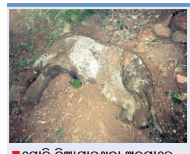
■ ପୋତି ଦିଆଯାଇଥିବା ଅବସ୍ଥାରେ ଉଦ୍ଧାର ■ ଦୋଷୀଙ୍କ ବିରୋଧରେ ନିଆଯିବ କାର୍ଯ୍ୟାନୁଷ୍ଠାନ