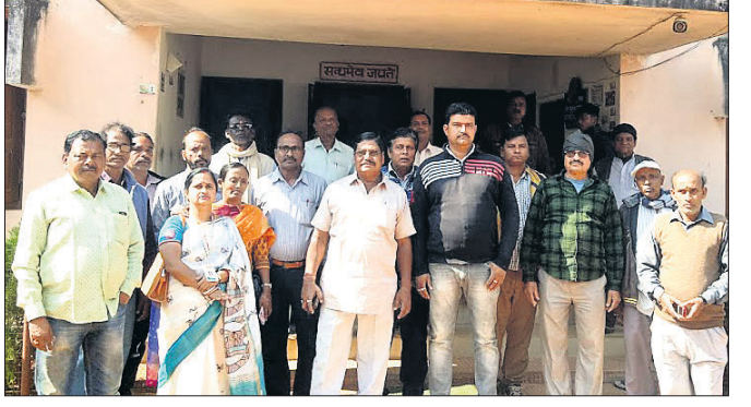
ଜିଲା ମହିଳା କଂଗ୍ରେସ ଓ ଜିଲା କଂଗ୍ରେସ ସଭାପତିଙ୍କ ସହ କର୍ମକର୍ତ୍ତା

କସ୍ତିପଦା, ୧୭୧୧ (ଡି.ଏନ.ଏ) : କସ୍ତିପଦା ବ୍ଲକ୍ ପ୍ରାକୃତିକ ସୌନ୍ଦର୍ଯ୍ୟର ଗଣାଘର ପୌରାଣିକ କାର୍ତ୍ତିକା ଚାକିରିଆ ଓ ବାସାଘରୀଙ୍କ କର୍ମକ୍ଷେତ୍ର ମୟୂରଭଞ୍ଜ ପାହାଡ଼ରେ ମକର ମେଳାରେ ଲକ୍ଷାଧିକ ଲୋକଙ୍କ ସମାଗମ ହୋଇଥିବା ଦେଖିବାକୁ ମିଳିଛି । ପାହାଡ଼ ଉପରେ ଥିବା ଦସନ୍ତ ବାବା, ନାରଣ ବାବା ଏବଂ ଜଗଦୀଶ ବାବା ରହୁଥିବା ଗୁମ୍ଫାଗୁଡ଼ିକ ଜନସାଧାରଣ ବୁଲି ଦେଖିବା ସହିତ ପାହାଡ଼ ଶୀର୍ଷରେ ପୂଜା ପାଉଥିବା ଦେବୀ ଚାକିରିଆ ଏବଂ ଚାକିରିଶ୍ୱର ମହାଦେବଙ୍କ ନିକଟରେ ମଧ୍ୟ ପ୍ରବଳ ଭିଡ଼ ପରିଲକ୍ଷିତ ହୋଇଥିଲା । ଉକ୍ତ ପୀଠରେ ମକର ପର୍ବ ଉପଲକ୍ଷେ ପାହାଡ଼ ନିକଟରେ ଭାଗବତ ପାରାୟଣ ଓ ବିଭିନ୍ନ ସାଂସ୍କୃତିକ କାର୍ଯ୍ୟକ୍ରମ, ଆଦିବାସୀ ଯାତ୍ରା ଅନୁଷ୍ଠିତ ହେଉଛି । ସପ୍ତରାତ୍ରି ଆକର୍ଷଣୀୟ ହେଉଛି ଏହି ପାହାଡ଼ ଉପରୁ ସୁନେଇ ବନ୍ଧନ ଦୃଶ୍ୟ । ଗ୍ରାମର ଉନ୍ନତ ମୁଦକ ତଥା ଗ୍ରାମବାସୀଙ୍କ ନେତୃତ୍ୱରେ ଏଠାରେ ବହୁ ଡାକକମଳରେ ଏହି ମେଳା ମେଳା ପାଳିତ ହେଉଛି ।