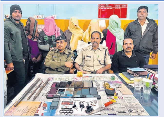
ଗିରଫ ମୁଦକ ଓ ଜବତ ସାମଗ୍ରୀ