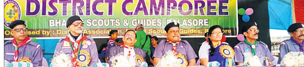
ଭାରତ ସ୍କାଉଟ୍‌ସ୍ ଏବଂ ଗାଇଡ୍‌ସ୍ କ୍ୟାମ୍ପୋରି କାର୍ଯ୍ୟକ୍ରମରେ ମହାସଭା ଅତିଥି।

ବାଲେଶ୍ୱର ପବ୍ଲିକ୍ ହାଇସ୍କୁଲ ପରିସରରେ ଥିବା ସ୍କାଉଟ୍‌ସ୍ ଏବଂ ଗାଇଡ୍‌ସ୍ ଭବନରେ ୧୭ତମ ଜିଲ୍ଲାସ୍ତରୀୟ ଭାରତ ସ୍କାଉଟ୍‌ସ୍ ଏବଂ ଗାଇଡ୍‌ସ୍ କ୍ୟାମ୍ପୋରି ଚୁରୁବାର ଉଦ୍‌ଘାଟିତ ହୋଇଯାଇଛି। ଏହା ଶ୍ରଦ୍ଧାଧର ପାଳିତ ହେବ। ଜିଲ୍ଲାରେ ମୋଟ ୨୮୧ଟି ବିଦ୍ୟାଳୟରୁ ସ୍କାଉଟ୍‌ସ୍ ଶିବିରୀୟା ୬୧୯, ଗାଇଡ୍‌ସ୍ ଶିବିରୀୟା ୨୦୪ ଏବଂ ସ୍କାଉଟ୍ ମାଷ୍ଟର ଓ ଗାଇଡ୍ କ୍ୟାମ୍ପୋରି ସଂଖ୍ୟା ୨୮୮ ମୋଟ ୧୧୧୧ ଜଣ ଶିବିରରେ ୧୭ତମ ଜିଲ୍ଲାସ୍ତରୀୟ ଭାରତ ସ୍କାଉଟ୍‌ସ୍ ଏବଂ ଗାଇଡ୍‌ସ୍ କ୍ୟାମ୍ପୋରିରେ ଚୁରୁବାର ଉଦ୍‌ଘାଟିତ ହୋଇଯାଇଛି। କାର୍ଯ୍ୟକ୍ରମରେ ପ୍ରଦର୍ଶନୀ, ସ୍ୱର୍ଣ୍ଣ ପେଣ୍ଡିଂ, କୁଲ୍‌ଜ, ସ୍କିଲ୍-୦-ରାମା, ପିକାଲ ଡିସ୍‌ପ୍ଲେ, ଆଡ଼ଭାନ୍ସିଙ୍ଗ୍ ଆକ୍ଟିଭିଟିଜ୍, ସ୍କିଲ୍‌ଡେମୋ, ପାଞ୍ଚ-ଆଡ଼, ଭିଲେଜ୍ ଫେୟାର, ମାସ୍ କ୍ଲିନିକ୍, ମାଟ୍‌ସ୍‌ସ୍, କ୍ୟାମ୍ପ ଟ୍ରାଫ୍ଟ୍, ଫକ୍ ଡ୍ୟାନ୍ସ, ଫକ୍ ସଙ୍ଗ, ପେଜେକ୍ ଶୋ’ ଏବଂ କ୍ୟାମ୍ପୋରି ଭଳି ବିଭିନ୍ନ ପ୍ରତିଯୋଗିତା