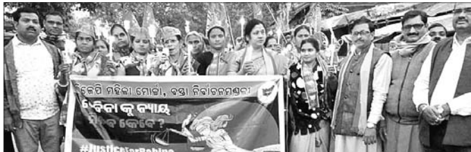
ଭାଙ୍ଗପା ମହାଳା ମୋଟି ପକ୍ଷରୁ ବାହାରିଥିବା ବିକ୍ଷୋଭ ଶୋଭାଯାତ୍ରା ।