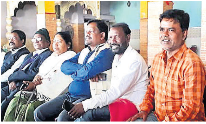
ପ୍ରସ୍ତୁତ ବୈଠକରେ ଉପସ୍ଥିତ ଜ୍ୟେଷ୍ଠମଣ୍ଡଳ ନେତୃବୃନ୍ଦ