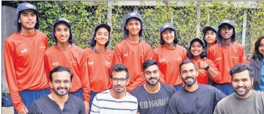
ମେଲବର୍ନ୍ରେ ଅଷ୍ଟ୍ରେଲିଆ ଓପନ ଚେନିସ୍ ବଳକାର୍ଣ୍ଣକ ସହ ଭାରତୀୟ କ୍ରିକେଟ ଦଳର ଖେଳାଳିମାନେ ।

କ୍ରୀଡ଼ାଲୋକ, ୧୭୧୧(ପି.ଟି.)- ଭାରତୀୟ ଶ୍ୱାସ ଶକ୍ତିର ସାଇନା ନେହାଲ ଏଠାରେ ଚାଲିଥିବା ମାଲେସିଆ ମାଷ୍ଟର୍ସ ବ୍ୟାଡମିଣ୍ଟନ ମହିଳା ସିଙ୍ଗଲ୍ କ୍ୱାର୍ଟରରେ ପ୍ରବେଶ କରିଛନ୍ତି ।