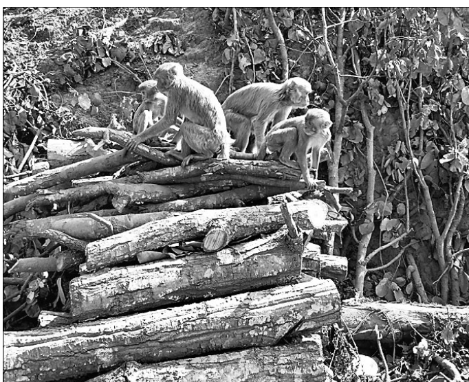
ରାସ୍ତା କଟରେ ଥିବା ମାଙ୍କଡ଼ ପାଇଁ

କେନ୍ଦୁଝର ଜିଲ୍ଲାରେ ଜଙ୍ଗଲ ଧ୍ୟୁସ ଯୋଗୁଁ ବନ୍ୟପ୍ରାଣୀ ବାସହରା ହୋଇପଡ଼ିଛନ୍ତି। ବନ୍ୟପ୍ରାଣୀଙ୍କ ପାଇଁ ଖାଦ୍ୟ ଭାବ ଦେଖାଦେଇଛି। ବନ ବିଭାଗ ପକ୍ଷରୁ ଜଙ୍ଗଲରେ ବନ୍ୟପ୍ରାଣୀଙ୍କ ଖାଦ୍ୟ ଓ ପାନୀୟ ଜଳର ବ୍ୟବସ୍ଥା ପର୍ଯ୍ୟାପ୍ତ ହେଉନଥିବାରୁ ହାତୀ, ମାଙ୍କଡ଼, କୁରୁରା, ହରିଣ, ବାରହା, ଭାଲୁ, ଶିଆଳ ଆଦି ଜନବସତି ମୁହାଁ ହେଉଛନ୍ତି। ବନ୍ୟପ୍ରାଣୀ ଜନବସତି ଆଡ଼କୁ ଆସି ମୃତ୍ୟୁ ପୁଖରେ ପଡ଼ୁଛନ୍ତି। କେନ୍ଦୁଝର ଜିଲ୍ଲା ପୁଖ୍ୟାଳୟ ଦେଇ ଯାଇଥିବା ୪୯ ନମ୍ବର ଜାତୀୟ ରାଜପଥର କେନ୍ଦୁଝରଠାରୁ କାଞ୍ଜିପାଣି ରାସ୍ତା ଓ କାଞ୍ଜିପାଣିଠାରୁ ଓଡ଼ିଆ ଦେଇ ତେଲକୋଇ ଯାଇଥିବା ରାସ୍ତା ସମ୍ପ୍ରଦାୟର ପାଇଁ ବ୍ୟାପକ ଜଙ୍ଗଲ କଟା ଚାଲିଛି। ବନ୍ୟପ୍ରାଣୀ ବିଶେଷ କରି ମାଙ୍କଡ଼ଙ୍କ ପାଇଁ ସମସ୍ୟା ଦେଖାଦେଇଛି। ଏହି ଜଙ୍ଗଲରେ ଆଗରୁ ବହୁ ସଂଖ୍ୟାରେ ମାଙ୍କଡ଼ ଥିଲେ। ଜଙ୍ଗଲ ମଧ୍ୟରେ ପ୍ରଚୁର ଖାଦ୍ୟ ଥିବାରୁ ବାହାରକୁ ଆସୁ ନ ଥିଲେ। ଗତ କିଛି ବର୍ଷ ହେଲା ମାଙ୍କଡ଼ ରାସ୍ତା ଉପରକୁ ଖାଦ୍ୟ ପାଇଁ ଚାଲିଆସୁଛନ୍ତି। ସେମାନଙ୍କ ସୁରକ୍ଷା ପାଇଁ ପଦକ୍ଷେପ ଦାବି