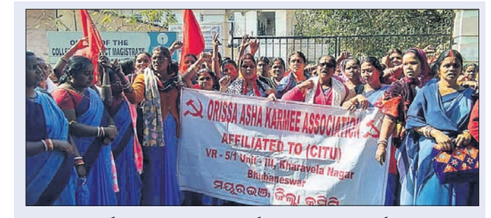
ଜିଲାପାଳଙ୍କ କାର୍ଯ୍ୟାଳୟ ସମ୍ମୁଖରେ ଆଶା କର୍ମୀମାନେ ବିକ୍ଷୋଭ ପ୍ରଦର୍ଶନ