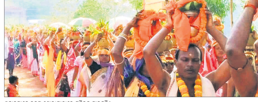
ଶ୍ରଦ୍ଧାଳୁମାନେ କଳସ ଶୋଭାଯାତ୍ରାରେ ମନ୍ଦିରକୁ ଯାଉଛନ୍ତି