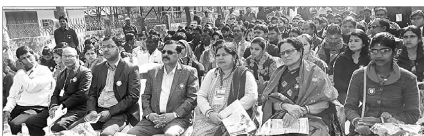
ସଚେତନତା କାର୍ଯ୍ୟକ୍ରମରେ ଅତିଥି ଓ ଛାତ୍ରାଛାତ୍ରୀ ।