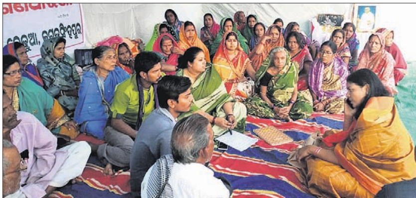
ଧାରଣାପ୍ରକଳରେ ବ୍ଲକ୍ ଅଧ୍ୟକ୍ଷା ଓ ଜିଲା ଯୋଜନାବୋର୍ଡ଼ ଉପାଧ୍ୟକ୍ଷା ଆଲୋଚନା କରୁଛନ୍ତି।