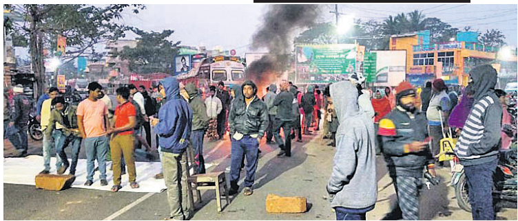
ଲୋକଙ୍କ ଦ୍ୱାରା ରାସ୍ତା ଅବରୋଧ।

ଏହି ସମୟରେ ଗୁମାସ୍ତା ଆନା ଅଧିକାରୀ ଘଟଣାସ୍ଥଳରେ ପହଞ୍ଚିବାକୁ ସମର୍ଥନ ଦେଇଥିଲେ।