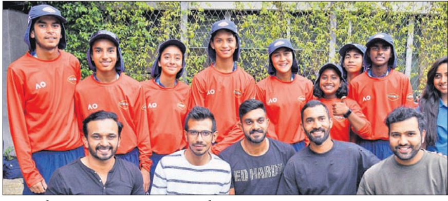
ମେଲବର୍ନ୍ରେ ଅଷ୍ଟ୍ରେଲିଆନ ଓପନ ଚେନିସ୍ ବଲକାର୍ଣ୍ଣକ ସହ ଭାରତୀୟ କ୍ରିକେଟ ଦଳର ଖେଳାଳିମାନେ ।