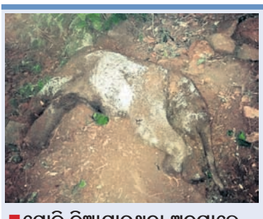
ପୋଡ଼ି ଦିଆଯାଇଥିବା ଅବସ୍ଥାରେ ଉଦ୍ଧାର