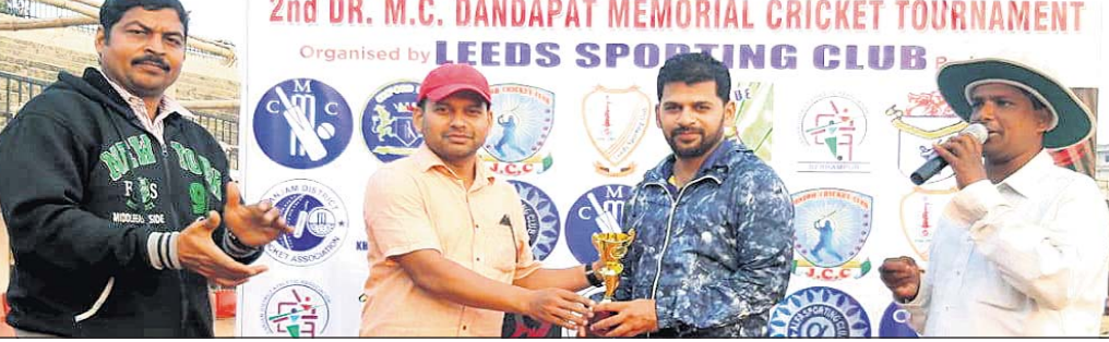
ଲିଡ଼ସ ଟ୍ରୀପାର୍ଟି ୬୨୫ ରକ୍ଷା କରିଥିଲା ।

ଦିତି ଓ ଏବଂ ବ୍ରହ୍ମପୁର ଉପଜିଲ୍ଲାପାଳଙ୍କ ସହିତ ଆୟୋଜନ କରିଥିଲେ । ପରେ ଲିଡ଼ସର ଲିଡ଼ସ ଟ୍ରୀପାର୍ଟି ୬୨୫ ରକ୍ଷା କରିଥିଲା ।