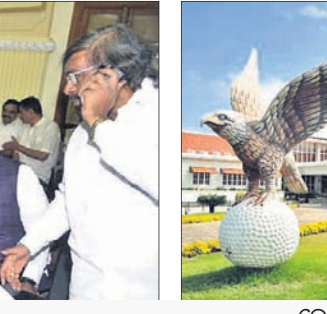
ବେଙ୍ଗାଳୁରୁରୁଁଡି ଇଗଲଟର୍ ଉପର

ପ୍ରଧାନମନ୍ତ୍ରୀ ନରେନ୍ଦ୍ର ମୋଦି ଓ ଭାଜପା ରାଷ୍ଟ୍ରୀୟ ଅଧ୍ୟକ୍ଷ ଅମିତ୍ ଶାହ କର୍ମଚାରୀ ସରକାରର ପତନ ଘଟଣାକୁ ଉଦ୍ୟମ କରୁଛନ୍ତି।