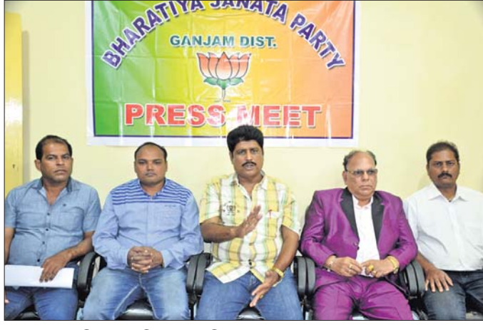
ଖବରଦାତା ସମ୍ମିଳନୀରେ କିଛି ସଭାପତି ଓ ଅନ୍ୟମାନେ ।

ବିଧାନସଭା ୧୮୧ ଶୁଖି କର୍ମିଶାନ ଅଧ୍ୟକ୍ଷ ଅଛନ୍ତି । ଏହି କର୍ମିଶାନ ଆଧାରରେ ଗୃହ ବିଭାଗ ରହିଛି । ତେବେ ବିଧାୟକ ଏ ଦିଗରେ ଉଦ୍ୟମ କରୁ ନଥିବା ତାଙ୍କ ଆରମ୍ଭ ହୋଇଯାଇଥିବା ସ୍ପଷ୍ଟ ହୋଇଛି । ଏହି ପ୍ରସଙ୍ଗରେ ଭାଜପା ପକ୍ଷରୁ ଆୟୋଜିତ ନେଇ ଆୟୋଜନ ଚଳାଇବ ବୋଲି ପତି କହିଛନ୍ତି ।