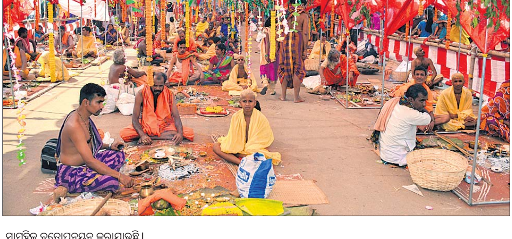
ସାମୂହିକ ବ୍ରତୋପନୟନ କରାଯାଇଛି ।