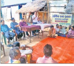
ବ୍ରହ୍ମପୁର ଅଫିସ, ୧୮୧୧

ବିଜ୍ଞାନ ଉପକରଣ ଆର୍ଥ ଆୟସାତ୍ର ମାମଲା କୋର୍ଟରେ ବନ୍ଧନ ଚଳେ ଏହାପରି ସଭାପତି