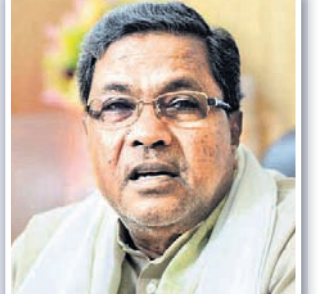
-ସିଦ୍ଧାରାମାୟା, ବରିଷ୍ଠ କଂଗ୍ରେସ ନେତା

ପ୍ରଧାନମନ୍ତ୍ରୀ ନରେନ୍ଦ୍ର ମୋଦି ଓ ଭାଜପା ରାଷ୍ଟ୍ରୀୟ ଅଧ୍ୟକ୍ଷ ଅମିତ୍ ଶାହ କର୍ମଚାରୀ ସରକାରର ପତନ ଘଟଣାକୁ ଉଦ୍ୟମ କରୁଛନ୍ତି।