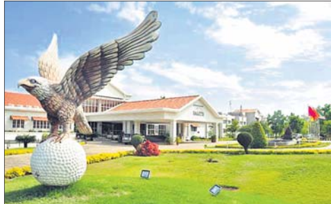
ବେଙ୍ଗାଲୁରୁରୁଁତ ଇଗଲ୍ ଟର୍ନ ରିସର୍ଟ

ପ୍ରଧାନମନ୍ତ୍ରୀ ନରେନ୍ଦ୍ର ମୋଦି ଓ ଭାଙ୍ଗିବା ରାଷ୍ଟ୍ରୀୟ ଅଧକ୍ଷ ଅମିତ୍ ଶାହ କର୍ମାଚକ ସରକାରର ପତନ ଘଟାଇବାକୁ ଉଦ୍ୟମ କରୁଛନ୍ତି। କାରଣ ଆଗାମୀ ଲୋକ ସଭା ନିର୍ବାଚନରେ ଭାଙ୍ଗିବାର ପରାଜୟ ନିଶ୍ଚିତ ବୋଲି ଜାଣି ଦୁହେଁ ଭୟଭୀତ ହୋଇଯାଇଛନ୍ତି।