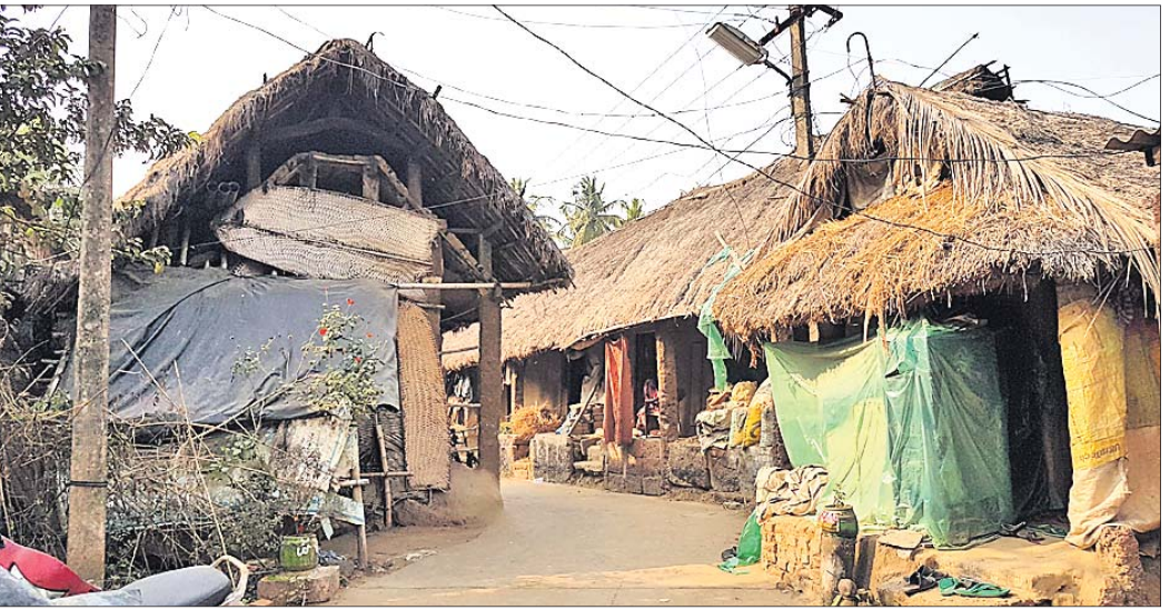
ପୁରୀ ଜିଲ୍ଲା ପିପିଲି ବ୍ଲକର ସାନସରଗାଈଲେ ଗ୍ରାମ।

ଦେଓ ରଞ୍ଜନ ସ୍ଵୀକାର କରିଛନ୍ତି। ଏଠାରେ ଉଲ୍ଲେଖଯୋଗ୍ୟ ଯେ, ସଚିବ କହିଥିବା ୨୧ଲକ୍ଷ ଘର ମଧ୍ୟରେ କେନ୍ଦ୍ର ସରକାରଙ୍କ ଯୋଜନାରେ ଅର୍ଦ୍ଧନିର୍ମିତ ଘରଗୁଡ଼ିକ ମଧ୍ୟ ସାମିଲ। ଅର୍ଥାତ୍ ସରକାରଙ୍କ ପକ୍ଷରୁ ଦାବି କରାଯାଉଥିବା ୨୧ ଲକ୍ଷ ନିର୍ମିତ ଘର ବିକୁ ପଙ୍କାଘର ଯୋଜନା ଅନ୍ତର୍ଭୁକ୍ତ ନୁହେଁ ଏବଂ ପୁରୁଣା ଘର ନିର୍ମିତ ହେଉଥିବାରୁ ନୂତନ ହିତାଧିକାରୀ ଲାଭବାନ ହୋଇପାରୁ ନାହାନ୍ତି। ପ୍ରଥମ କଥା ସରକାରଙ୍କ ହିତାଧିକାରୀ ଚୟନକୁ ବନ୍ଧୁ ଯୋଗ୍ୟତ୍ଵ