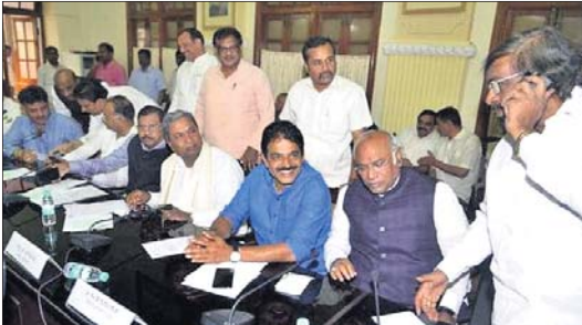
କଂଗ୍ରେସ ବିଧାୟକ ଦଳ ବୈଠକ