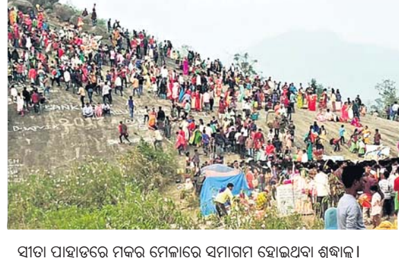
ସାତା ପାହାଡ଼ରେ ମକର ମେଳାରେ ସମାଗମ ହୋଇଥିବା ଶ୍ରଦ୍ଧାଳୁ ।