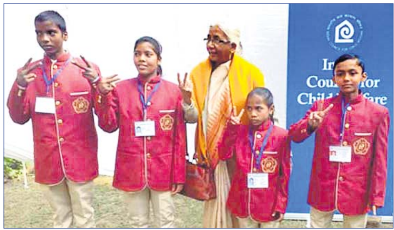
ଜାତୀୟ ସାହସିକତା ପୁରସ୍କାର ପାଇଁ ମନୋନୀତ ହୋଇଥିବା ଓଡ଼ିଶାର ୪ ଶିଶୁ।