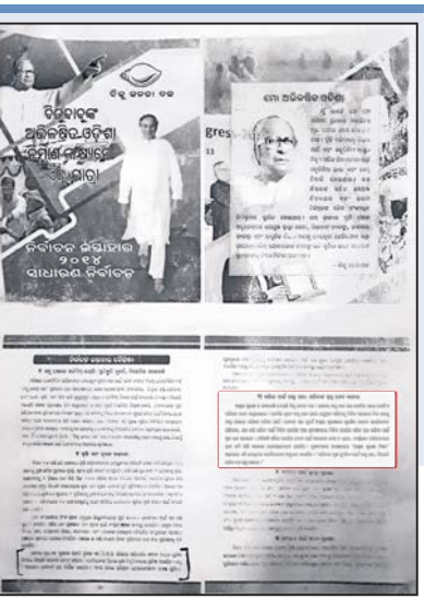
୨୦୧୪ରେ ବିଜେଡିର ନିର୍ବାଚନ ଇସ୍ତାହାର।