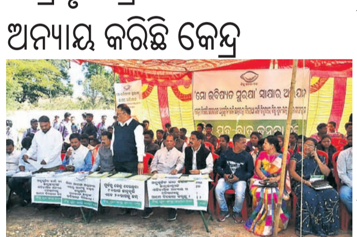
ଆୟୋଜିତ ସାଧାରଣ ସଭାରେ ବିକ୍ର ଛାତ୍ର, ମୁବତ୍ତାକ ଉପସ୍ଥିତ କର୍ମକର୍ତ୍ତା ।