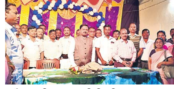
ବୈଠକରେ ଅତିଥିକ ସହ ପ୍ରଧାନ ଶିକ୍ଷକମାନେ ।