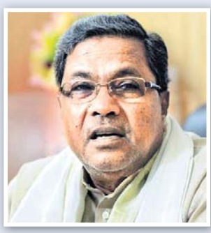
-ସିଦ୍ଧାରାମାୟା, ବରିଷ୍ଠ କଂଗ୍ରେସ ନେତା

ପ୍ରଧାନମନ୍ତ୍ରୀ ନରେନ୍ଦ୍ର ମୋଦି ଓ ଭାଙ୍ଗିବା ରାଷ୍ଟ୍ରୀୟ ଅଧକ୍ଷ ଅମିତ୍ ଶାହ କର୍ମାଚକ ସରକାରର ପତନ ଘଟାଇବାକୁ ଉଦ୍ୟମ କରୁଛନ୍ତି। କାରଣ ଆଗାମୀ ଲୋକ ସଭା ନିର୍ବାଚନରେ ଭାଙ୍ଗିବାର ପରାଜୟ ନିଶ୍ଚିତ ବୋଲି ଜାଣି ଦୁହେଁ ଭୟଭୀତ ହୋଇଯାଇଛନ୍ତି।