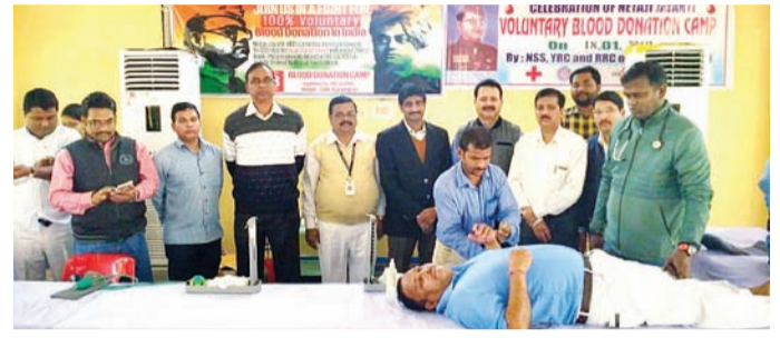
ରକ୍ତଦାନ ଶିବିରରେ ଜଣେ ରକ୍ତଦାତା ରକ୍ତ ଦେଇଛନ୍ତି ।