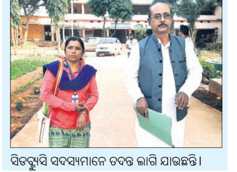
ବିତଦ୍ଦ୍ୟୁସି ସଦସ୍ୟମାନେ ଚନ୍ଦନ ଲାଗି ଯାଉଛନ୍ତି।

ସମ୍ପର୍କୀୟ ବୋଲି ପ୍ରାଥମିକ ଚନ୍ଦନକୁ ଜଣାପଡ଼ିଛି। ଉଭୟ ନାବାଳିକା ଏବଂ ଅଭିଯୁକ୍ତ ଡାକ୍ତରୀମାଳନା କରାଯାଇଛି। ଅପରପକ୍ଷେ ଜିଲା ମଙ୍ଗଳ ବିଭାଗ, ଶିଶୁ ସୁରକ୍ଷା ବିଭାଗର ପଦାଧିକାରୀ ଶୁଣ୍ଠିକାର ପୂର୍ବରୁ ୧୧ଟାକୁ ରାତି ୭ଟା ଯାଏ ଛାତ୍ରୀନିବାସ ପ୍ରକୋଷ୍ଠରେ ରୁକ୍ତହୀନ ଚନ୍ଦନ କରିଛନ୍ତି। ଗଣମାଧ୍ୟମ ପ୍ରତିନିଧି, ଜନପ୍ରତିନିଧିଙ୍କ ଆହ୍ୱାନରେ କରାଯାଇଥିବା ଏହି ଗୋପନ ଚଢ଼ିକ ଛିଡ଼ା କରାଇଛି ଏକାଧିକ ପ୍ରଶ୍ନ। ପାଟିଭାଳ ପରିବାର ସଦସ୍ୟଙ୍କ କହିବା ଅନୁଯାୟୀ, ଛାତ୍ରୀ ଜଣକ ୪ର୍ଥ ଶ୍ରେଣୀରୁ ସପ୍ତଶଯ୍ୟା ଆଶ୍ରମ ସ୍କୁଲରେ ରହି ପାଠପଢ଼ୁଛନ୍ତି। ବଡ଼ନିନ ଛୁଟିରେ ସେ ଗ୍ରାମକୁ ଯାଇ ଗତ ୧୬ ତାରିଖରେ ସ୍କୁଲକୁ ଫେରିଥିଲେ। ଅସ୍ପଷ୍ଟ ଅନୁଭବ କରିବାରୁ