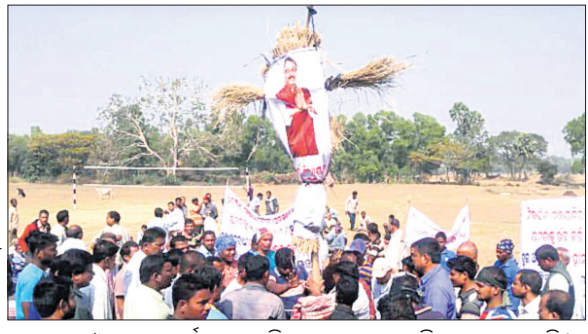
ସରପଞ୍ଚ ଓ ତାଙ୍କ ସମର୍ଥକମାନେ ବିଧାୟକଙ୍କ କୁଶପୁରଲିକା ଦାହ କରୁଛନ୍ତି।

ଭଦ୍ରକ ଜିଲ୍ଲା ଚିହ୍ନିକି ବ୍ଲକ ପାଲିଆଦିଆ ପଞ୍ଚାୟତରେ 'ପିଠା' କାର୍ଯ୍ୟକ୍ରମକୁ ନେଇ ରାଜନୀତି ଜୋରଦାର