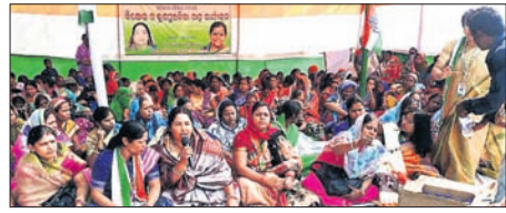
ମହିଳା କଂଗ୍ରେସର ପ୍ରତିବାଦ ସଭା।