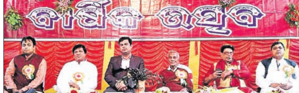
ଶିଶୁମନ୍ଦିର ବାର୍ଷିକ ଉତ୍ସବରେ ଉପସ୍ଥିତ ଅତିଥିମାନେ।