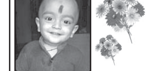
ଦୁର୍ଦ୍ଦିହ ଦାଶି Tikarpada, Puri

ମହାପ୍ରଭୁ ଶ୍ରୀଚରଣାଥଙ୍କ ନିକଟରେ ପ୍ରାର୍ଥନା କୋର କୋପସ ସର୍ବଦା ଚୁପ୍‌ଚାପରେ ଗୋ ଡାକ୍ତରୀ ଚଳାଉଛନ୍ତି। ଶୁଭେଚ୍ଛା ସହ: ମାମା, ପାପା, ଭାଇ, ଦାଦା, ବାପା, ମା, ଦାଦା, ଭୃତୀ ଓ ବନ୍ଧୁପରିବାରକର୍ମୀ। ଧ-୧୦୭୬୮