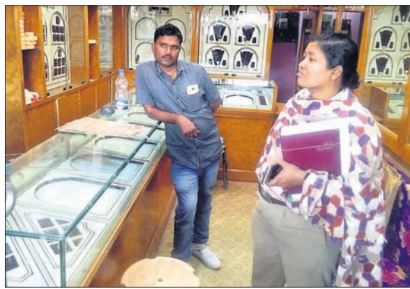
ଗହଣା ଦୋକାନରେ ପୋଲିସ୍ ତଦନ୍ତ କରୁଛି ।