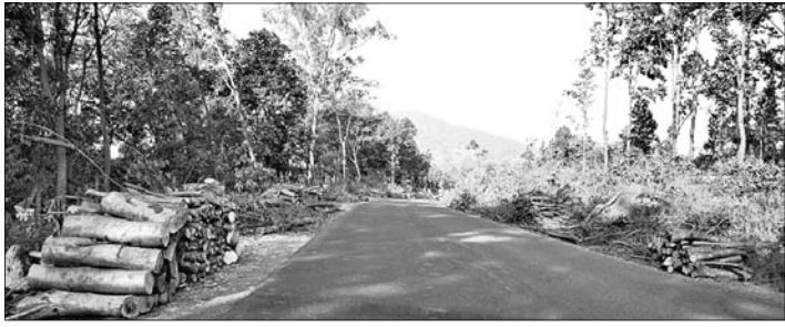
ରାସ୍ତା ପାଇଁ ଚାଲିଛି ଗଛକଟା।

କେନ୍ଦୁଝର ଜିଲ୍ଲାରେ ଖଣିଖାଦାନ, ଶିଳ୍ପ ପରେ ରାସ୍ତା ପାଇଁ ବହୁ ପୁରୁଣା ଓ ନାନାଦାନୀ ଗଛ ଧରାଶାୟୀ ହୋଇଯାଇଛି। ଫଳରେ ମୂଲ୍ୟବାନ ଜଙ୍ଗଲ ସମ୍ପଦ ନଷ୍ଟ ହୋଇଛି। ଏହି କାରଣରୁ ଜିଲ୍ଲାର ପରିବେଶ ବହୁ ମାତ୍ରାରେ କ୍ଷତି ହୋଇଛି। ଜଳବାୟୁରେ ପରିବର୍ତ୍ତନ ଯୋଗୁଁ ବର୍ଷା ଓ ଶୀତରେ ଅନିୟମାତମା ଦେଖାଦେବା ସହ ଖରା, ବର୍ଷାର ପ୍ରକୋପ ଦେଖିବାକୁ ମିଳିଛି। ବିକାଶ ଆକରେ ଚାଲିଛି ଜଙ୍ଗଲ କଟା। ତେବେ ନିୟମାବଳୀ କଟାଯାଇଥିବାରୁ ଗଛ ଓ ନଷ୍ଟ ହେଉଥିବା ଜଙ୍ଗଲ ବାବଦକୁ ଦୁଇ ଗୁଣା ବୃକ୍ଷରୋପଣ କରି ଜଙ୍ଗଲ ସୃଷ୍ଟି କରି କ୍ଷୟକ୍ଷତି ପରିଶୋଧ କରାଯାଉ ନ ଥିବାରୁ ଭୟାବହ ପରିସ୍ଥିତି ଉତ୍ପନ୍ନ ହେଉଛି।