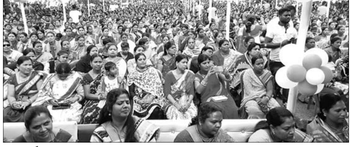
ବୁଦ୍ଧ କାର୍ଯ୍ୟକ୍ରମ ନିମନ୍ତେ ଉପସ୍ଥିତ ଲୋକେ।

ଆମ ଗାଁ ଆମ ବିକାଶ କାର୍ଯ୍ୟକ୍ରମ ହିତକାରୀ ପ୍ରକଳ୍ପ ରୂପେ ସମ୍ପର୍କରେ ଅତି ଉଚ୍ଚ ଆଲୋଚନା ମାଧ୍ୟମରେ ବର୍ଣ୍ଣାଯାଇଥିଲା। ଏହାପରେ ମୁଖ୍ୟମନ୍ତ୍ରୀ ଭିତ୍ତି ଓ କନଫରେନ୍ସ ମାଧ୍ୟମରେ ଯୋଡା ବୁଦ୍ଧର ବିଭିନ୍ନ ପଞ୍ଚାୟତରୁ ଆସିଥିବା ଜନସାଧାରଣଙ୍କୁ ସମ୍ବୋଧିତ କରିଥିଲେ। ପରେ ରାଜ୍ୟ ସରକାରଙ୍କ ବିଭିନ୍ନ ଲୋକପ୍ରିୟ କାର୍ଯ୍ୟକ୍ରମ ମାଧ୍ୟମରେ ଯୋଡା ବୁଦ୍ଧର ୧୯ଟି ପଞ୍ଚାୟତକୁ ୧୦୦ଟି ପ୍ରକଳ୍ପ ପାଇଁ ୪ କୋଟିରୁ ଊର୍ଦ୍ଧ୍ୱ ଅନୁଦାନ ମଞ୍ଜୁର ଓ ଭରା ଟଙ୍କା ୩ ଶହରୁ ୫ ଶହକୁ ବୃଦ୍ଧି କରାଯାଇଥିବା ନେଇ ମୁଖ୍ୟମନ୍ତ୍ରୀ ଯୋଷଣା କରିଥିଲେ। ତେବେ ଏହି କାର୍ଯ୍ୟକ୍ରମ ପାଇଁ ଆବଶ୍ୟକ ଜନସାଧାରଣଙ୍କୁ ବିଭିନ୍ନ ଅଞ୍ଚଳକୁ ଗାଡି ଯୋଗେ ଆଣିବାକୁ