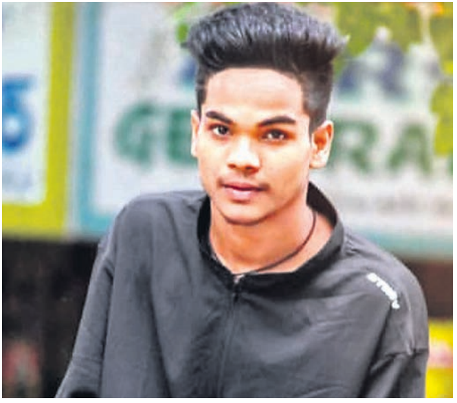
ଯୁବ ପ୍ରତିଭା କାହା ମହାନ୍ତି

ହାସ୍ୟ, ପ୍ରତିଭାକୁ ମାର୍ଜିତ ପାଇଁ ଗୁରୁ ଆବଶ୍ୟକ । କିନ୍ତୁ ସେ ଥିଲେ ନିଜେ ନିଜର ଗୁରୁ । ତିନି ଏବଂ ଇଣ୍ଡିଆନ୍ ଟ୍ୟାଲେଣ୍ଟ୍ କୋରିଓଗ୍ରାଫର୍ ଏବଂ ଡ୍ୟାନ୍ସରଙ୍କ ନୃତ୍ୟକୁ ବେଶ୍ ପ୍ରଶଂସା ନେଇଥିଲେ । ଭୁଲ୍ କରୁଥିଲେ, ପୁଣି ନିଜେ ନିଜକୁ ପ୍ରାଧିକାରୀ ନେଉଥିଲେ । ନିଜ ସ୍ୱପ୍ନକୁ ସଫଳ କରିବାକୁ ଜଣେ ମଣିଷ ଯେ, କେତେ ପରିଶ୍ରମ କରିପାରେ, ସଂପୂର୍ଣ୍ଣ କରିପାରେ, ତ୍ୟାଗ କରିପାରେ, ତାହାର ଏକ ଉଦାହରଣ ପାଇଁ ତେଲୁଗୁ ଡ୍ୟାନ୍ସିଂ ରିଆଲିଟି ଶୋ' ଜଗତରେ ଧମାକା କରୁଛନ୍ତି । ନିଜ ଡ୍ୟାନ୍ସର ଯାତ୍ରାରେ ସମସ୍ତଙ୍କ ମନ ଜିଣୁଛନ୍ତି । ମାତ୍ର ୧୬ ବର୍ଷ ବୟସରେ ସେ ତେଲୁଗୁ ଟେଲିଭିଜନ୍ ଜଗତରେ ସଫଳ ଡ୍ୟାନ୍ସର ଏବଂ କୋରିଓଗ୍ରାଫର୍ ଭାବେ ସ୍ୱତନ୍ତ୍ର ପରିଚୟ ସୃଷ୍ଟି କରିପାରିଛନ୍ତି ।