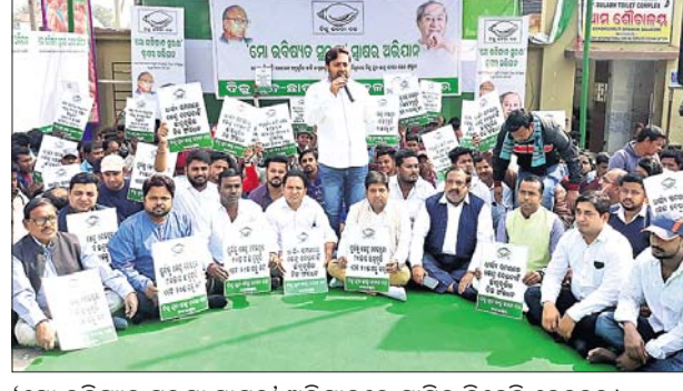
'ମୋ ଭବିଷ୍ୟତ ସୁରକ୍ଷା ସ୍ୱାକ୍ଷର' ଅଭିଯାନରେ ସାମିଲ ବିଜେଡି ନେତୃବୃନ୍ଦ।