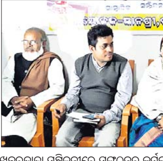
ଖବରଦାତା ସମ୍ମିଳନୀରେ ସଙ୍ଗଠନର କର୍ମକର୍ତ୍ତା।