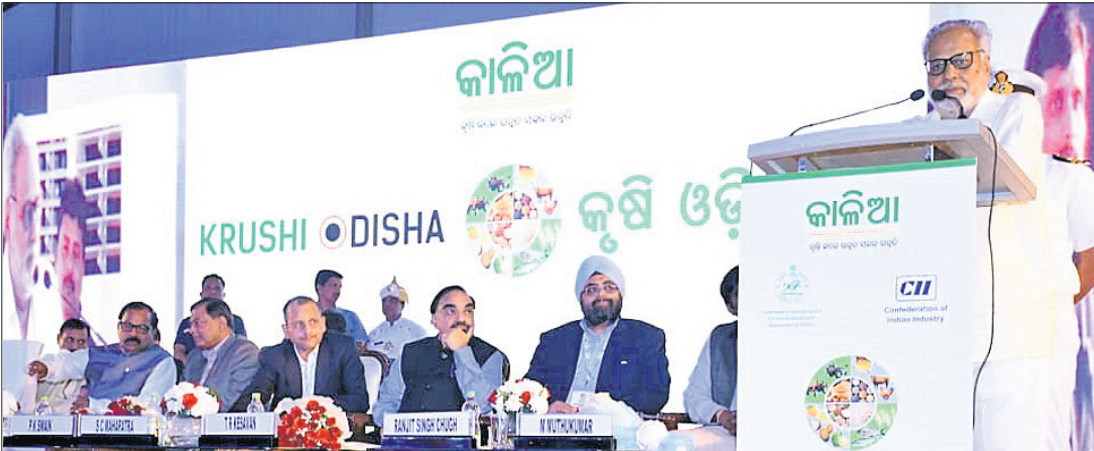
କାର୍ଯ୍ୟକ୍ରମରେ ରାଜ୍ୟପାଳ ଗଣେଶୀ ଲାଲ ଉଦ୍‌ଘାଟନା ଦେଉଛନ୍ତି।

ଭୁବନେଶ୍ୱର, ୧୯।୧ (ବ୍ୟୁରୋ) ମନୁଷ୍ୟ ଜୀବନଧାରଣ ପାଇଁ ମାଟି ଓ ପାଣି ସବୁଠାରୁ ଗୁରୁତ୍ୱପୂର୍ଣ୍ଣ। ମାଟିର ସାମ୍ବନ୍ଧରେ ପାଇଁ ବିଶେଷ ଧ୍ୟାନ ଦେବା ଦରକାର। ମାତ୍ର ବାସ୍ତବରେ ତାହା ହେଉ ନାହିଁ। ମାଟି ଓ ପାଣି ପ୍ରତ୍ୟକ୍ତ ହେଉଛି। ମାଟି ଶୁଦ୍ଧୀକରଣକୁ ଦ୍ୱାରଦତ କରିବାକୁ ରାଜ୍ୟପାଳ ପ୍ରଫେସର ଗଣେଶୀ ଲାଲ ପରାମର୍ଶ ଦେଇଛନ୍ତି। ବରମୁଣ୍ଡାଠାରେ ଅନୁଷ୍ଠିତ କୃଷି ଓଡ଼ିଶା ସମାରୋହର ଉଦ୍‌ଘାଟନା ଉତ୍ସବରେ ମୁଖ୍ୟ ଅତିଥି ଭାବେ ଯୋଗଦେଇ ରାଜ୍ୟପାଳ କହିଛନ୍ତି ଯେ, କୃଷକମାନଙ୍କ ଜୀବିକା ଓ ଜୀବନଧାରଣ ମାନରେ ଉନ୍ନତି ହେବା ଦରକାର। କୃଷି କ୍ଷେତ୍ରର ବିକାଶ ପାଇଁ ଉତ୍ତମ କେନ୍ଦ୍ର ଓ ରାଜ୍ୟ ସରକାର ବହୁବିଧ କାର୍ଯ୍ୟକ୍ରମ ଓ ଯୋଜନା କାର୍ଯ୍ୟକାରୀ କରୁଛନ୍ତି। ଏହାର ଫଳାଫଳ ଗଣେଶୀ ପାଖରେ ପହଞ୍ଚିବା ଦରକାର ବୋଲି ରାଜ୍ୟପାଳ କହିଛନ୍ତି। ପୃଥ୍ୱୀକୁ ମା' ସମାନ ଆଦର କରିବା ସହିତ କୃଷକମାନେ ଯେପରି ଉଚିତ ସମ୍ମାନ ପାଇବେ ସେ ଦିଗରେ ସମସ୍ତେ ଯତ୍ନବାନ୍ ହେବା ଆବଶ୍ୟକ। କୃଷକମାନଙ୍କର ଜୀବନଧାରଣ ମାନରେ ଉନ୍ନତି ଆଣିବା ପାଇଁ କୃଷିବିଜ୍ଞାନିକ ଓ ପ୍ରଶାସନ ପ୍ରଭୃତି ପ୍ରଚେଷ୍ଟା ଜାରି ରହିବା ଦରକାର। ଫଳରେ ଗଣେଶୀ ଆମୃତହତ୍ୟା ଭଳି ଘଟଣା ଶୁଣିବାକୁ ମିଳିବ ନାହିଁ ବୋଲି ରାଜ୍ୟପାଳ କହିଛନ୍ତି। ଉତ୍ସବରେ ସମ୍ମାନିତ ଅତିଥି ଭାବେ ଯୋଗଦେଇ ଖାଦ୍ୟ ଯୋଗାଣ ଓ ଖାଉଟି କଳାଶ, ସମବାୟ ମନ୍ତ୍ରୀ