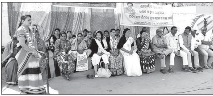
ଧାରଣାରେ ସାମିଲ ହୋଇଥିବା କଂଗ୍ରେସ କର୍ମକର୍ମୀମାନେ।