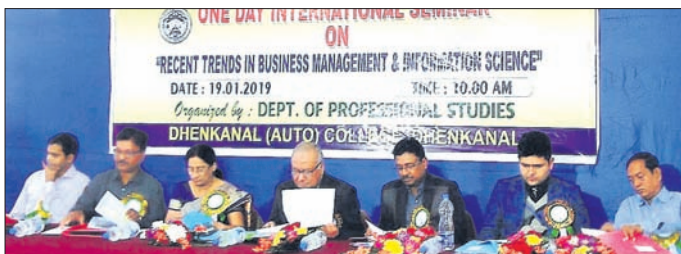
ଆଲୋଚନାଚକ୍ରରେ ମହାସଭା ଅତିଥିମାନେ।