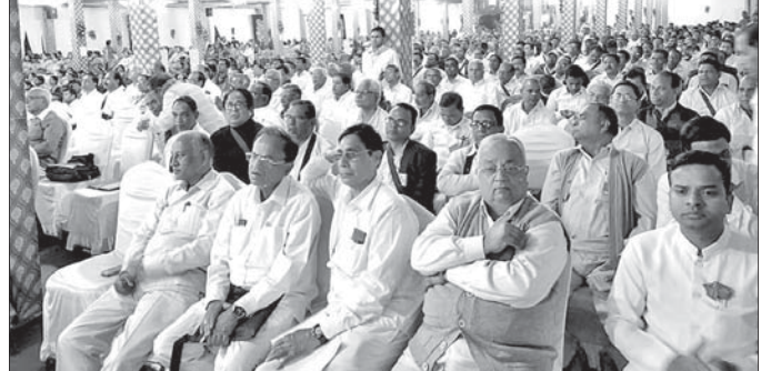
ସମ୍ମିଳନୀରେ ଯୋଗ ଦେଇଥିବା ସଙ୍ଗଠନର ସଦସ୍ୟମାନେ ।