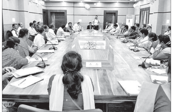
ସମୀକ୍ଷା ବୈଠକରେ ପ୍ରଶାସନିକ ଅଧିକାରୀମାନେ ।