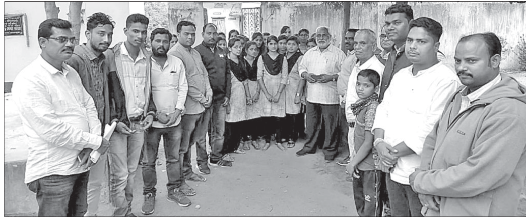
କଲେଜ ଶୌଚାଳୟ ଉଦ୍‌ଘାଟନା କାର୍ଯ୍ୟକ୍ରମରେ ଏମ୍ପିକ ପ୍ରତିନିଧିଙ୍କ ସହ ଅନ୍ୟମାନେ ।