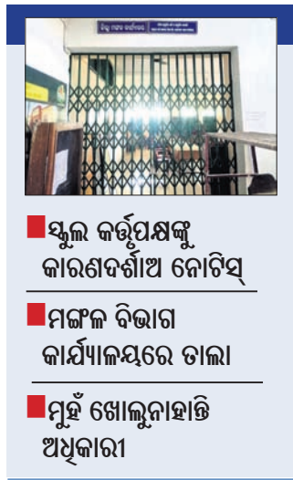
ସ୍କୁଲ କର୍ତ୍ତୃପକ୍ଷଙ୍କୁ କାରଣବଶୀ ଅନେତିସ୍

ଢେଙ୍କାନାଳ ସଦର ବ୍ଲକ୍ ବେଳଚିକିରି ଶେକ୍ସପିର ହୋମ୍ରେ ଅନ୍ଧେବାସୀଙ୍କୁ ଯୌନଶୋଷଣ ଘଟଣାରେ ପଦାରେ ପଡ଼ିଥିଲା ପ୍ରଶାସନିକ ଅପାରଗତା।