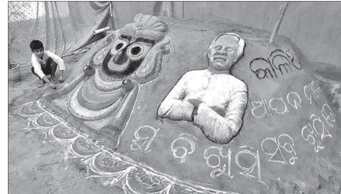
ବାଲୁକା କଳାରେ କାଳିଆ ଯୋଜନା ସମ୍ପର୍କିତ ବାର୍ତ୍ତା।

ସାହୁଙ୍କ ସମେତ ବିଭାଗୀୟ ଅଧିକାରୀ ଯୋଗଦେଇ ରାଜ୍ୟ ସରକାରଙ୍କ ବିଭିନ୍ନ ସମ୍ପର୍କରେ ଲୋକମାନଙ୍କୁ ସଚେତନ କରାଯାଇଥିଲା। ପରେ ସ୍ୱୟଂ ସହାୟକ ଗୋଷ୍ଠୀକୁ ମାନପତ୍ର ଓ ଏଲଇଡି ବଲ୍‌ବ ବ୍ୟବହାର କରାଯାଇଥିଲା। ଏହି ଉପଲକ୍ଷେ ବରସାହି ପଞ୍ଚାୟତଠାରେ କାଳିଆ ଯୋଜନାକୁ ନେଇ ବାଲୁକାକଳା ପ୍ରଦର୍ଶିତ ହୋଇଥିଲା। ବିଭୁ ଯୁବ ସାହିତ୍ୟର ସମଗ୍ର ସଦସ୍ୟ ସହଯୋଗ କରିଥିଲେ।