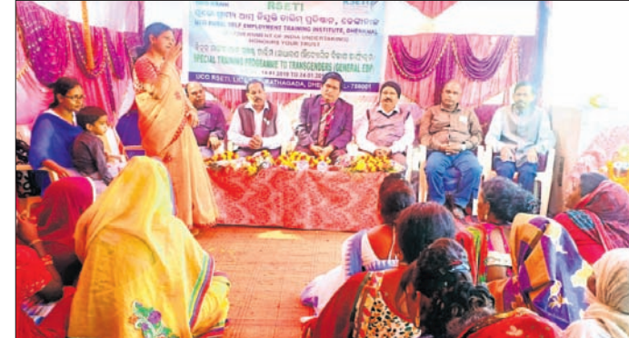
କାର୍ଯ୍ୟକ୍ରମର ଲକ୍ଷ୍ୟ ଏବଂ ଉଦ୍ଦେଶ୍ୟ ସମ୍ପର୍କରେ ସଚେତନ କରାଯାଉଛି।

କିନ୍ନରଙ୍କୁ ସଶକ୍ତ କରାଇବା ଉଦ୍ଦେଶ୍ୟରେ ଢେଙ୍କାନାଳ ବୋରାପଦାସ୍ଥିତ ଐିଆର ସ୍ଵେଚ୍ଛାସେବୀ ଅନୁଷ୍ଠାନ କାର୍ଯ୍ୟାଳୟରେ ଶନିବାରଠାରୁ ଆରମ୍ଭ ହୋଇଛି ସାଧାରଣ ଔଦ୍ୟୋଗିକ ବିକାଶ କାର୍ଯ୍ୟକ୍ରମ।