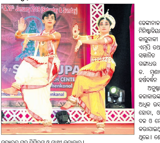
ନୃତ୍ୟରତ ଗୁରୁ ତିନିମୁଁ ଓ ସାଥୀ କଳାକାର।