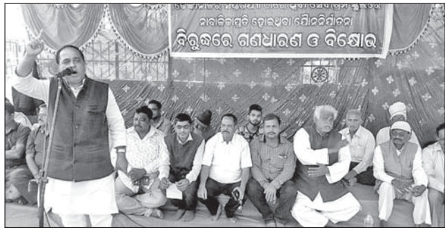
ଭାଜପା ପକ୍ଷରୁ ଆୟୋଜିତ ଗଣଧାରଣା।