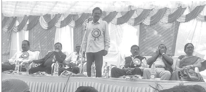
ବାର୍ଷିକ କ୍ରୀଡ଼ା କାର୍ଯ୍ୟକ୍ରମରେ ମହାଧିକାରୀ ଅତିଥିମାନେ।