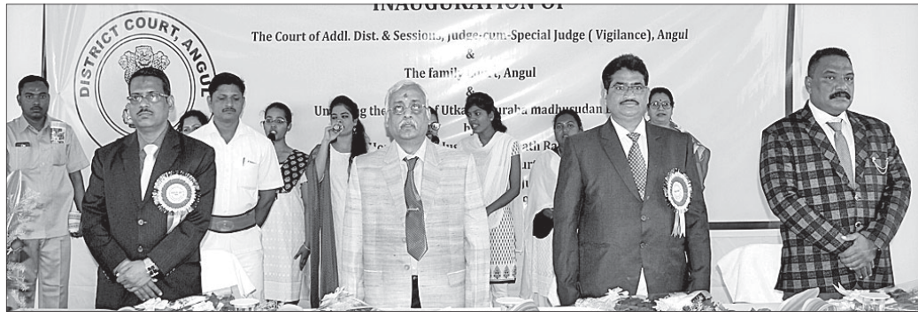
ଅଦାଲତ ଉଦ୍‌ଘାଟନା କାର୍ଯ୍ୟକ୍ରମରେ ଯୋଗ ଦେଇଥିବା ଅତିଥିମାନେ ।

ଅନୁଗୋଳ ଜିଲ୍ଲା ନ୍ୟାୟାଳୟ ପରିସରରେ ଶନିବାର ପରିବାର ଓ ଭିଜିଲାନ୍ସ ଅଦାଲତ ଉଦ୍‌ଘାଟିତ ହୋଇଛି । ଏଥିସହ ଉତ୍କଳ ଗୌରବ ମଧୁସୂଦନ ଦାସଙ୍କ ପ୍ରତିମୂର୍ତ୍ତି ମଧ୍ୟ ଉଦ୍‌ଘାଟନା କରାଯାଇଛି ।