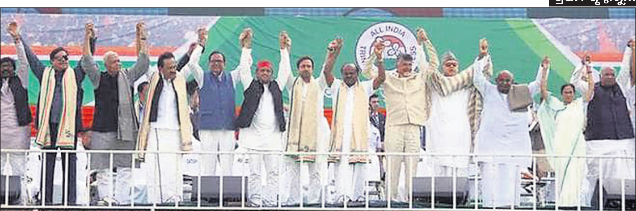
କୋଲକାତାରେ ପଶ୍ଚିମବଙ୍ଗ ମୁଖ୍ୟମନ୍ତ୍ରୀ ମମତା ବାନାର୍ଜୀଙ୍କ ସହ ବିରୋଧୀ ଦଳଗୁଡ଼ିକର ନେତାମାନେ।