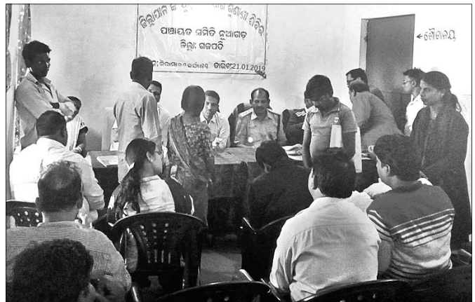
ଲୋକ ଅଭିଯୋଗ ଶୁଣୁଛନ୍ତି ଜିଲାପାଳ।

ନୂଆପଲ୍ଲୀ ବ୍ଲକ୍ କିରାମା ପଞ୍ଚାୟତ କାର୍ଯ୍ୟାଳୟରେ ପୋଲିସର ଆଦର୍ଶ ବିଦ୍ୟାଳୟ ଛାତ୍ରାଧିକାରୀଙ୍କୁ ଉଦ୍‌ଘାଟିତ କରାଯାଇଛି।