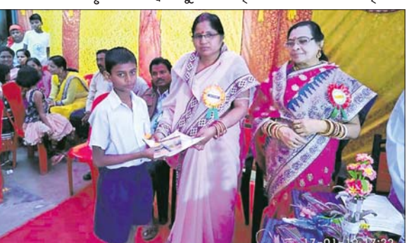
ଜଣେ ଛାତ୍ରକୁ ପୁସ୍ତକ ପ୍ରଦାନ କରାଯାଇଛି।

ଭଞ୍ଜନଗର, ୨୧୧୧ (ଡି.ଏନ.ଏ.) ଭଞ୍ଜନଗର ବୁକ୍ ଗାମୁଣ୍ଡି ଉଚ୍ଚ ପ୍ରାଥମିକ ବିଦ୍ୟାଳୟର ବାର୍ଷିକୋତ୍ସବ ପାଳିତ ହୋଇଯାଇଛି। ପ୍ରଧାନ ଶିକ୍ଷୟିତ୍ରୀ ଜ୍ୟୋତ୍ସ୍ନା ଦାସଙ୍କ ସଭାପତିତ୍ଵରେ ପାଳିତ ହୋଇଥିଲା।