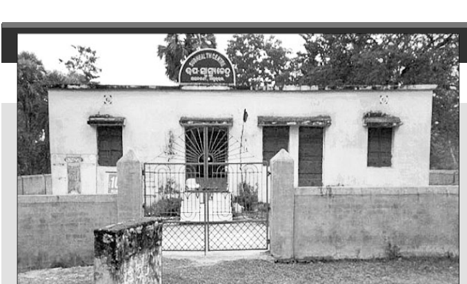
ଅସନବଣି କେନ୍ଦ୍ରରେ ତାଳା ଝୁଲୁଛି ।

କସ୍ତିପଦା ବ୍ଲକ ଅଧୀନ ପିଲୁ ପଞ୍ଚାୟତରେ ଥିବା ଅସନବଣି ସ୍ୱାସ୍ଥ୍ୟ ଉପକେନ୍ଦ୍ର ୪ ବର୍ଷ ହେବ ନିର୍ମିତ ହୋଇଥିବା ବେଳେ ଦୀର୍ଘଦିନ ହେଲା ସ୍ୱାସ୍ଥ୍ୟକର୍ମୀ ପଦବୀ ଫାଙ୍କା ପଡ଼ିଛି । ଦାୟିତ୍ୱରେ ଥିବା ଅତିରିକ୍ତ ମହିଳା ସ୍ୱାସ୍ଥ୍ୟକର୍ମୀ କେନ୍ଦ୍ରରେ ରହୁ ନ ଥିବାରୁ ସ୍ୱାସ୍ଥ୍ୟସେବା ବିପର୍ଯ୍ୟସ୍ତ ହୋଇପଡ଼ିଥିବା ଅଭିଯୋଗ ହେଉଛି । ଏହି ଉପକେନ୍ଦ୍ର ଅଧୀନରେ ଫୁଲବାଡ଼ିଆ, ତାଙ୍ଗରତୁଆ, ବଡ଼ଝାଡ଼, ଅସନବଣି, ଗଡ଼ିଆପାଳ ଓ ତୁଳସିପାଣି ରାଜ୍ୟ ଗ୍ରାମର ୪ ହଜାରରୁ ଊର୍ଦ୍ଧ୍ୱ ଲୋକ ନିର୍ଭର କରିଥାନ୍ତି । ମାତ୍ର ଏହି ଉପକେନ୍ଦ୍ରର ଅତିରିକ୍ତ ମହିଳା ସ୍ୱାସ୍ଥ୍ୟକର୍ମୀ କେନ୍ଦ୍ରରେ ରହୁ ନ ଥିବା ବାରମ୍ବାର ଅଭିଯୋଗ