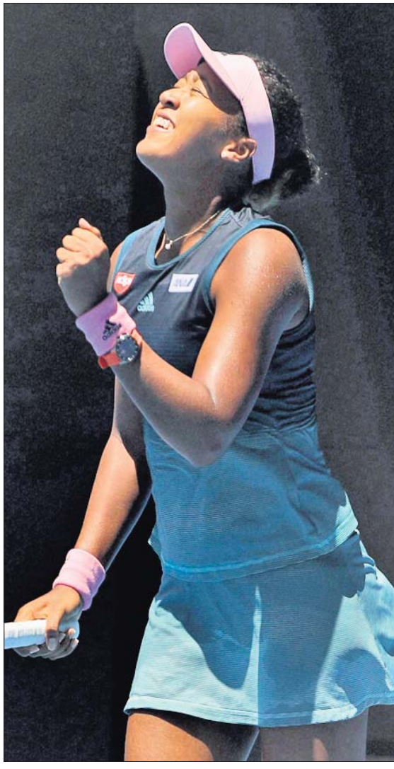
ମ୍ୟାଚ୍ ବିଜୟ ପରେ ସେରେନା ଉଲିୟା ଓ ନାଓମି ଓସାକାଙ୍କ ପ୍ରତିକ୍ରିୟା ।