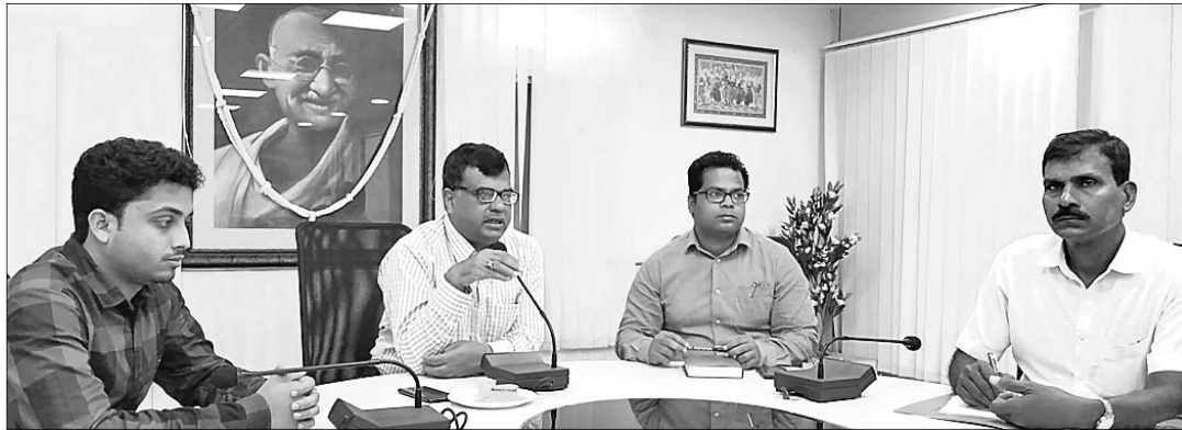
ଅତିରିକ୍ତ ଜିଲାପାଳ ସୂଚନା ଦେଉଛନ୍ତି।