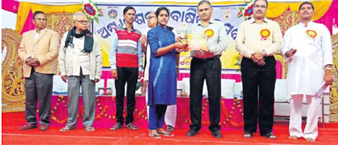
ଜଣେ ଛାତ୍ରୀଙ୍କୁ ଅତିଥି ସମ୍ମାନିତ କରୁଛନ୍ତି ।