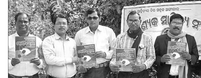
ଅତିଥିମାନେ ମାଟି ଫୁଲ ପତ୍ରିକାର ଉଦ୍‌ଘାଟନ କରୁଛନ୍ତି ।