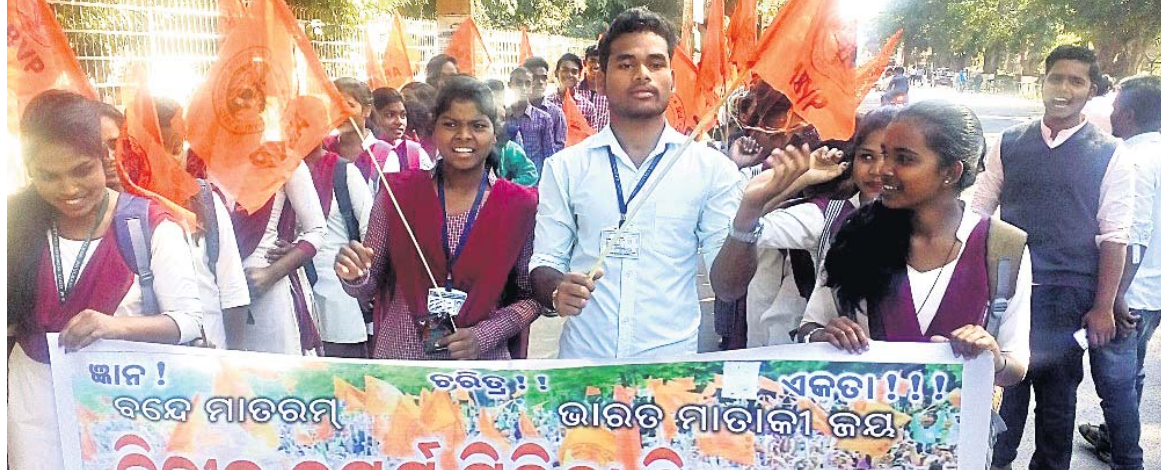
ଛାତ୍ରାଛାତ୍ରୀମାନେ ବିକ୍ଷୋଭ ପ୍ରଦର୍ଶନ କରୁଛନ୍ତି।