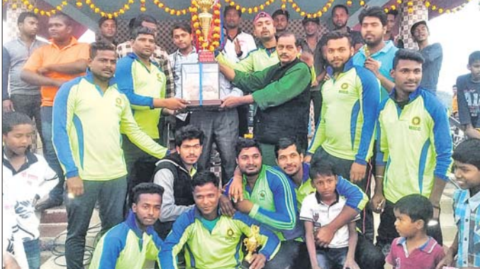
ଚାମ୍ପିୟନ ବମ୍ବେରୁ ଦଳର ଖେଳାଳିମାନେ ଅତିଥିଙ୍କୁ ପୁରସ୍କାର ଗ୍ରହଣ କରୁଛନ୍ତି ।