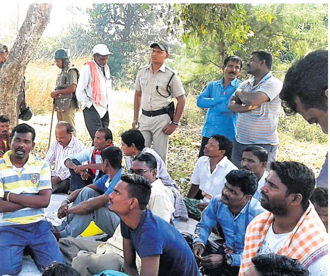
ଧାରଣାସ୍ଥଳରେ ଗ୍ରାମବାସୀ ଓ ପୋଲିସର ଆଲୋଚନା ।

ଗ୍ରାସୀମ ଲକ୍ଷ୍ମଣଙ୍କୁ ନିୟୁକ୍ତି ଓ ଅନ୍ୟାନ୍ୟ ପ୍ରସଙ୍ଗରେ ଏହି ବ୍ଲକ୍ କାର୍ଯ୍ୟକ୍ରମ ପଞ୍ଚାୟତର କର୍ମାଗଣପୁର ଏବଂ ଜରାପଦର ଗ୍ରାମବାସୀ କମ୍ପାନୀ ପକ୍ଷରୁ ହାତୀପୁରରେ ସୋମବାର ଧାରଣା ଦେବା ସହ କମ୍ପାନୀକୁ ଜଳ ଯୋଗାଣ ବନ୍ଦ କରି ଦେଇଥିଲେ ।