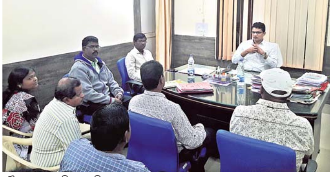
ବୈଠକରେ ଉପସ୍ଥିତ ଉପଜିଲ୍ଲାପାଳ ଭାବରେ ଓ ବ୍ୟବସାୟୀମାନେ ।