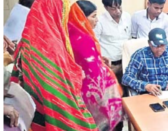
ଏଡିଏମ୍ ଅଭିଯୋଗ ଶୁଣୁଛନ୍ତି ।

ପ୍ରତ୍ୟେକ ମାସ କୃଷୀ ସେବା ବିଭାଗର ଗଣ୍ଡାମ ଜିଲ୍ଲାପାଳ ଭଞ୍ଜନଗର ଆସି ଲୋକଙ୍କ ଆପତ୍ତି ଅଭିଯୋଗ ଶୁଣିବା ପାଇଁ ସମୟ ଧାର୍ଯ୍ୟ ହୋଇଛି ।