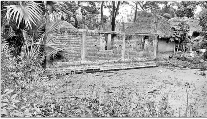
ଏକ ଅଙ୍ଗନୂଆଡ଼ି କେନ୍ଦ୍ର ଗୃହ ଅଧ୍ୟାପକରିଆ ହୋଇ ରହିଛି ।

ଭଦ୍ରକ ଜିଲା ଚାନ୍ଦବାଲି ବ୍ଲକ ଅନ୍ତର୍ଗତ ସୁନ୍ଦରପୁର ଏବଂ ଓଳର ପଞ୍ଚାୟତରେ ୧୭ଟି ଅଙ୍ଗନୂଆଡ଼ି କେନ୍ଦ୍ର ରହିଛି । ସେଥିମଧ୍ୟରୁ ଅନୁତ ମଣୋହି ଓ ପାରଡିଆ-ଚମ୍ପାସାହି ଅଙ୍ଗନୂଆଡ଼ି କେନ୍ଦ୍ରର ନିର୍ମାଣ ଗୃହ ନିର୍ମାଣ ସରିଛି । ଏହି ୨ କେନ୍ଦ୍ରରେ ପ୍ରାୟ ବିଦ୍ୟାଳୟ ଶିଶୁମାନେ ଅଧ୍ୟୟନ କରୁଛନ୍ତି । ଅବଶିଷ୍ଟ ୧୫ କେନ୍ଦ୍ର ମଧ୍ୟରୁ ୨ଟିର ନୂତନ ଗୃହରେ ଛାତ୍ର ପଢ଼ିଯାଇଛି । ଅନ୍ୟ କେନ୍ଦ୍ରଗୁଡ଼ିକ ମଧ୍ୟରୁ କେଉଁଠି ନିର୍ମାଣ କାର୍ଯ୍ୟ ଅଧ୍ୟାପକରିଆ ଭାବେ ରହିଛି ତ ଆଉ କେଉଁଠି ନିର୍ମାଣ କାର୍ଯ୍ୟ ଆରମ୍ଭ ହୋଇପାରି ନାହିଁ । ଅଙ୍ଗନୂଆଡ଼ି ଗୃହ ନିର୍ମାଣ କାର୍ଯ୍ୟ ଶେଷ ପାଇଯାଇ ନାହିଁ । ଫଳରେ ପ୍ରାୟ ବିଦ୍ୟାଳୟ ଶିଶୁମାନେ କେଉଁଠି ଅଙ୍ଗନୂଆଡ଼ି କର୍ମୀଙ୍କ ଗୃହରେ ପଢ଼ୁଛନ୍ତି ତ ଆଉ କେଉଁଠି କ୍ଲବ ଘର ଏପରିକି ପରିଷଦ ଗୃହରେ ପାଠ ପଢ଼ୁଛନ୍ତି । ଏହାକୁ ନେଇ ଅଭିଭାବକ ମହଲରେ ଅସନ୍ତୋଷ ପ୍ରକାଶ ପାଇଛି । ପୂର୍ବରୁ ସରକାରୀ ଜମି କେବଳ