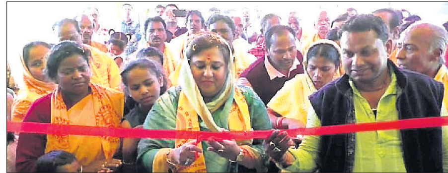
ଏମ୍ପି ପ୍ରକଳ୍ପର ଉଦ୍ଘାଟନା ସମୟରେ କନ୍ୟାମାଳ ସମାଜର ସଭ୍ୟମାନେ ଉଦ୍ଘାଟନା କରୁଛନ୍ତି ।