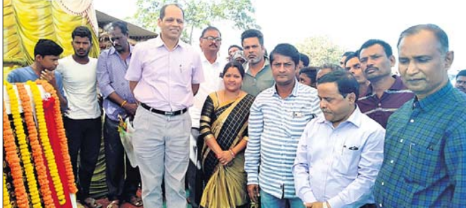
ଦେଉଳିଆ ବନ୍ଧର ଶିଳାମ୍ୟାସ କରୁଛନ୍ତି ବିଧାୟକ ।

ଦେଉଳିଆ, ବଡ଼ବନ୍ଧ ଉନ୍ନତୀକରଣ ପାଇଁ ଶିଳାମ୍ୟାସ