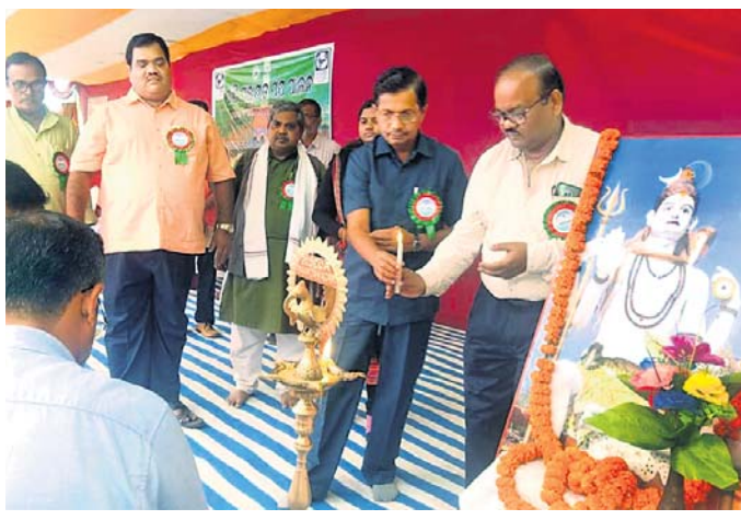
ଅତିଥିମାନେ ପ୍ରତୀପ ପ୍ରଚ୍ଛଦନ କରି କାର୍ଯ୍ୟକ୍ରମକୁ ଉଦ୍ଘାଟନ କରୁଛନ୍ତି।

ଭଞ୍ଜନଗର ଜଳସମ୍ପଦ ବିଭାଗ ପକ୍ଷରୁ ଯୋଜନା କରାଯାଇଥିବା ପାଣି ପଞ୍ଚାୟତ ପକ୍ଷ ପାଳିତ ହୋଇଯାଇଛି।