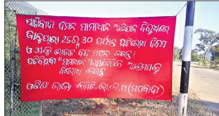
ରାସ୍ତା ପାର୍ଶ୍ଵରେ ବନ୍ଧାଯାଇଥିବା ବ୍ୟାନର। ବିଭିନ୍ନ ସ୍ଥାନରେ ଏଭଳି ପୋଷ୍ଟର ଓ ବ୍ୟାନର ମରାଯାଇଥିବା ବେଶ୍ଵାବୁ ମିଳିଥିଲା। ଉକ୍ତ ପୋଷ୍ଟରରେ ଫାଶିବାଦ

କନ୍ଧମାଳ ଜିଲ୍ଲା ବାଲିଗୁଡ଼ା ଉପଖଣ୍ଡ ଅଞ୍ଚଳରେ ଗତ ୩ ଦିନ ହେଲା ମାଓବାଦୀ ପୋଷ୍ଟର ମରାଯାଇଥିବାରୁ ଏକ ପ୍ରକାର ଭୟର ବାତାବରଣ ସୃଷ୍ଟି ହୋଇଛି। ଶନିବାର ସୁଦ୍ଧା ପଞ୍ଚାୟତରେ ମାଓବାଦୀ ପୋଷ୍ଟର ଲାଗିଥିବାବେଳେ ରବିବାର କୋଟଗଡ଼ ବ୍ଲକ୍ ତଥା ଥାନା ଅନ୍ତର୍ଗତ ପକାରୀ ପଞ୍ଚାୟତ କାର୍ଯ୍ୟାଳୟ ଫାଟକ ଓ ସମିତି ସଭାକ୍ଷେତ୍ର ଆଗରେ ଧମକପୂର୍ଣ୍ଣ ପୋଷ୍ଟର ଲାଗିଥିଲା। ପୁଣି ସୋମବାର ରୁମୁଡ଼ିବନ୍ଧ ବ୍ଲକ୍ ମୁଣ୍ଡଗଡ଼ ପଞ୍ଚାୟତର ସେସୋରଗାଁରେ