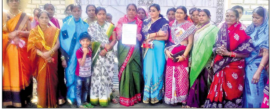
ଦାବିପତ୍ର ପ୍ରଦାନ କରିବାକୁ ଯାଇଥିବା ମହିଳାମାନେ।