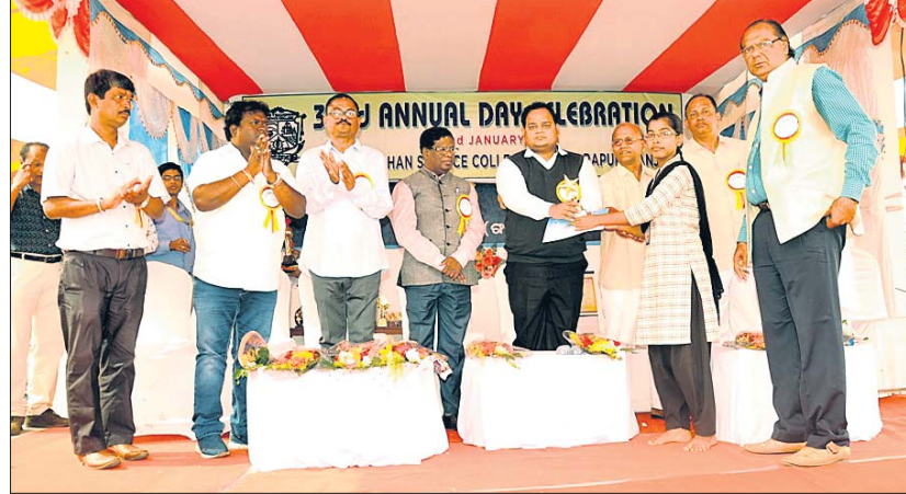
କୃତୀ ଛାତ୍ରୀଙ୍କୁ ପୁରସ୍କୃତ କରାଯାଇଛି।