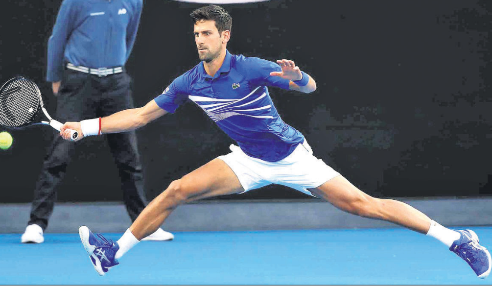
କାର୍ତ୍ତିକ ଫାଇନାଲ ମ୍ୟାଚ୍ ଅବସରରେ ନୋଭାକ ଜୋକୋଭିଚ୍।

ବର୍ଷର ପ୍ରଥମ ଗ୍ରାଣ୍ଡସ୍ଲାମ ଚୁର୍ନାମେଣ୍ଟ ଅଷ୍ଟ୍ରେଲିଆ ଓପନ୍ ଟେନିସ୍ ଚୁର୍ନାମେଣ୍ଟ ରୁଧ୍ଵାର ଦଶମ ଦିବସରେ ପହଞ୍ଚିଛି। ଚୁର୍ନାମେଣ୍ଟର ପୁରୁଷ ଓ ମହିଳା ସିଙ୍ଗଲ୍ ସେନିଫାଇନାଲ ମୁକାବିଲା ସ୍ଵପ୍ନ ହୋଇଛି। ମଙ୍ଗଳବାର ପୁରୁଷ ସିଙ୍ଗଲ୍ ଇଭେଣ୍ଟରେ ଦ୍ୱିତୀୟ ସିଡ୍ ରାଫାଲ ନାଡାଲ ଓ ପ୍ରଥମ ଷ୍ଟେଫାନୋସ ସିଡ୍‌ସିପାସ ମଧ୍ୟରେ ସେନିଫାଇନାଲ ସ୍ଵପ୍ନ ହୋଇଥିଲା। ସେହିପରି ରୁଧ୍ଵାର ଚତୁର୍ଥ ସିଡ୍ ସର୍ବିଆର ନୋଭାକ ଜୋକୋଭିଚ୍ ଓ ଫ୍ରାନ୍ସର କ୍ଲୋଏ ପାଉଲିକ ମଧ୍ୟରେ ସେନିଫାଇନାଲ ମୁକାବିଲା ଖେଳାଯିବ। ନିର୍ଣ୍ଣୟ ହୋଇଛି। ଅନ୍ୟପଟେ ମହିଳା ସିଙ୍ଗଲ୍ ଇଭେଣ୍ଟରେ ମଙ୍ଗଳବାର ଅଷ୍ଟମ ସିଡ୍ ଟେନ୍ ଗଣରାଜ୍ୟର ପ୍ରେମ୍ ଜିଗୋଭ ଓ ଆମେରିକାର ଡାନିଏଲ କିଲିନ୍ସ୍କ ମଧ୍ୟରେ ସେନିଫାଇନାଲ ମ୍ୟାଚ୍ ଧ୍ଵର ହୋଇଥିଲା। ରୁଧ୍ଵାର ଚତୁର୍ଥ ସିଡ୍ ଲାପାନର ନାଓମି ଓସାକା ଓ ଚେନ୍ ଗଣରାଜ୍ୟର ସପ୍ତମ ସିଡ୍ ଖୋଲି କାରୋଲିନା ପ୍ଲିଙ୍କୋଭାଙ୍କ ମଧ୍ୟରେ ଦ୍ୱିତୀୟ ସେନିଫାଇନାଲ ଖେଳାଯିବ ନିର୍ଣ୍ଣୟ ହୋଇଛି।