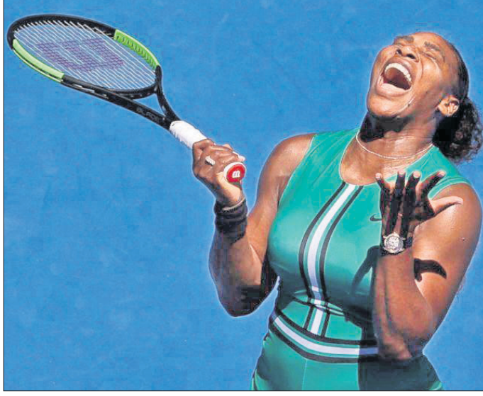
ପରାଜୟ ପରେ ଦୁଃଖରେ ମୁଗ୍ଧମାଣ ସେରେନା ଓଲିୟମ୍ସ।