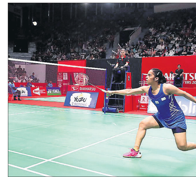
ଇଣ୍ଡୋନେସିଆ ମାଷ୍ଟର୍ସ୍ ଚୁର୍ନାମେଣ୍ଟରେ ଏକ ଡିଟର୍ ଶର୍ ଖେଳୁଛନ୍ତି ସାଇନା ଜେହ୍ଲା।