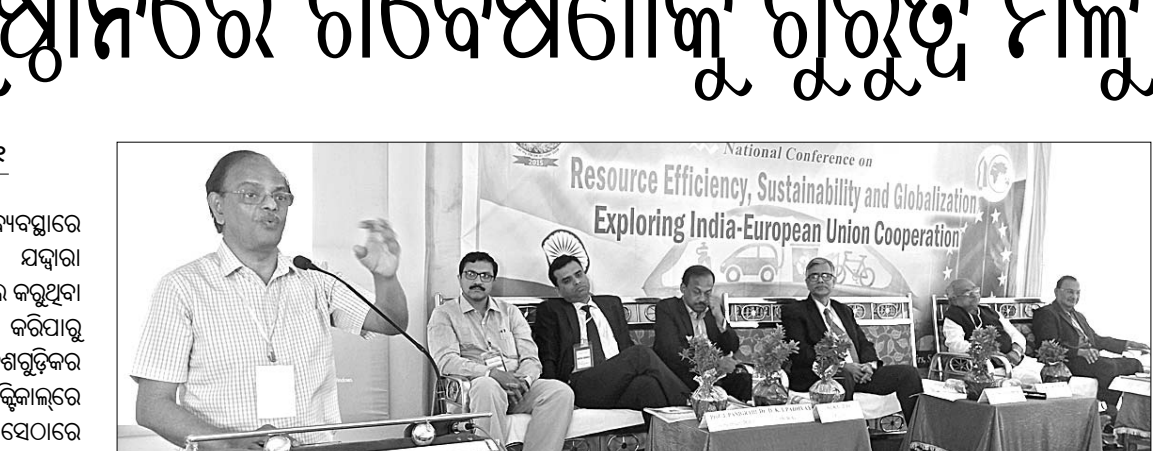
ମଞ୍ଚାସୀନ ଅତିଥି ଏବଂ ବିଶ୍ୱବିଦ୍ୟାଳୟ କର୍ତ୍ତୃପକ୍ଷ ।