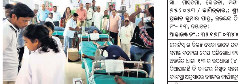
ଶିବିରରେ ରକ୍ତ ସଂଗ୍ରହ କରାଯାଇଛି।

ଶେରଗଡ଼, ୨୩୧୧ (ଡି.ଏନ.ଏ.) ଶେରଗଡ଼ ରକ୍ତ ବିଜୁ ଯୁବବାହିନୀ ପକ୍ଷରୁ ଏକ ମେଗା ରକ୍ତ ଦାନ ଶିବିର ଶେରଗଡ଼ ସ୍ଥିତ ମହାମାତା ଉଚ୍ଚ ବିଦ୍ୟାଳୟରେ ରୁପାବାର ଅନୁଷ୍ଠିତ ହୋଇଯାଇଛି। ଶିବିରକୁ ମୁଖ୍ୟ ଅଧିକାରୀ ସାହୁଙ୍କ ଶୁଭାରମ୍ଭ କରିଥିଲେ। ବିଜୁବାହିନୀ ଓ ସାମାଜିକସ୍ଥିତି ରକ୍ତଦାନ ବିଜୁ ଯୁବବାହିନୀର ମଧ୍ୟ ଏହି ଶିବିରରେ ରକ୍ତଦାନ ଶିବିର ଆୟୋଜନ ହୋଇଛି।