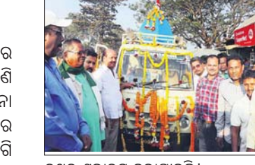
ରଥର ଶୁଭାରମ୍ଭ କରାଯାଇଛି।

ଆସିକା ବିଜୁ ପଟ୍ଟନାୟକ ଛକଠାରେ ରୁପାରୀ ଅପରାହ୍ନରେ ପାଣି ପଞ୍ଚାୟତ ରଥକୁ ସ୍ଵାଗତ ସମ୍ବର୍ଦ୍ଧନା ଦିଆଯାଇଥିଲା। ଏହି ଅବସରରେ ଗଞ୍ଜାମରାଜ୍ୟରେ ଜଳସେଚନ ଲାଗି ରହିଥିବା କେନାଲ ଜଳକୁ ପାରଦ୍ଵାରକ ସହଯୋଗ ଭିତ୍ତିରେ ସହଯୋଗ କରିବା ସହ ଜଳର ଉପଯୁକ୍ତ ପରିଚାଳନା ଓ କେନାଲର ସୁରକ୍ଷା ଦିଗରେ ସହଯୋଗ ହେବା ଲାଗି ନିବେଦନ କରାଯାଇଥିଲା।