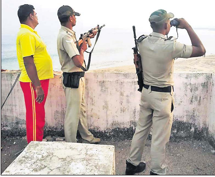
ସମୁଦାୟ ଚକରେ ନକର ରଖାଯାଇଛି ।

ଇତ୍ତପୁର, ୨୩।୧ (ବି.ଏନ.ଏ.) - ଗଞ୍ଜାମ ପୋଲିସ ଜିଲ୍ଲା ଅଧୀନ ଆର୍ଯ୍ୟମଙ୍ଗଳା ନେରାଇନ ଥାନା ପକ୍ଷରୁ ୨ ଦିନ ଧରି ଡଳି ଆଡ଼ଙ୍ଗବାଦୀ ସମରାଭ୍ୟାସ ବୃଥାବାର ଶେଷ ହୋଇଛି । ତିନି ଆଡ଼ଙ୍ଗବାଦୀଙ୍କୁ ବୁଧବାର ପୋଲିସ ପକ୍ଷରୁ ଠାବ କରାଯାଇଛି । ଗଞ୍ଜାମ ବୁକ ପ୍ରଧାନ ଠାବ ବନ୍ଦ ପର୍ଯ୍ୟନ୍ତ ସମସ୍ତ ସମୁଦାୟ ଓ ଏହାକୁ ସଂଯୋଗ କରୁଥିବା ଜାତୀୟ ରାଜପଥରେ ସମରାଭ୍ୟାସ କରାଯାଇଥିଲା । ଡିଏସପି କେଶବ ଚନ୍ଦ୍ର ବେହେରା, ଆର୍ଯ୍ୟମଙ୍ଗଳା ନେରାଇନ ଥାନା ଆଇଆଇସି ବିଶ୍ୱଜିତ ଜୁମାର ରାଉତରାୟଙ୍କ ସହିତ ମିଳିତ ଭାବେ କାର୍ଯ୍ୟକ୍ରମ କରାଯାଇଛି । ଘରୁ ୪ ବ୍ୟବସାୟ, ୬ ହାତୀକାରୀ ଏଥିରେ ସାମିଲ ଥିବା ବେଳେ ସମସ୍ତ ଚକରେ ୪୦ ପୋଲିସ କର୍ମଚାରୀଙ୍କ ସହିତ ଯୁଦ୍ଧ କରାଯାଇଥିବା ବେଳେ