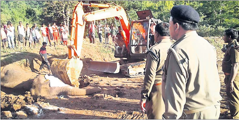
ମୃତ ହାତୀକୁ ପୋଡ଼ା ଯାଉଛି।

କନ୍ଧମାନଙ୍କ ଲଙ୍କାଗଡ଼ ବନାଞ୍ଚଳ ଲଙ୍କାଗଡ଼ ସଂରକ୍ଷିତ ଜଙ୍ଗଲ କେନ୍ଦ୍ରପଡ଼ା ଗ୍ରାମ ନିକଟ ବୁଡେଲ ନାଳ ନିକଟରେ ଅସ୍ଥୁର ହୋଇ ପଡିଥିବା ମାଛ ହାତୀର ରୂପବାର ପୂର୍ବାହ ଫଟାରେ ମୃତ୍ୟୁ ଘଟିଛି।