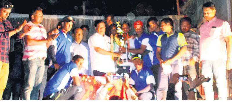
ଚାମ୍ପିୟନ ଦଳର ଖେଳାଳିମାନେ ଅତିଥିତାରୁ ଚୁଫି ଗ୍ରହଣ କରୁଛନ୍ତି।

ବାଙ୍କୀ, ୨୩।୧ (ସ.ପ୍ର.) - ବାଙ୍କୀ ଆଥଲେଟିକ୍ ଆସୋସିଏଶନ ଅନୁକୂଲ୍ୟରେ ଚାଲିଥିବା ରାଜ୍ୟସ୍ତରୀୟ କ୍ରିକେଟ ଚୁର୍ନାମେଣ୍ଟର ଫାଇନାଲ ଖେଳ ରୁଧ୍ଵାର ବାଙ୍କୀ ଆଥଲେଟିକ୍ ଆସୋସିଏଶନ ଓ ଖୋର୍ଦ୍ଧା କଳିଙ୍ଗ କ୍ରିକେଟ କ୍ଲବ ମଧ୍ୟରେ ଅନୁଷ୍ଠିତ ହୋଇଯାଇଛି। ଏଥିରେ ଖୋର୍ଦ୍ଧା ପ୍ରଥମେ ବ୍ୟାଟି କରି ନିର୍ବାରିତ ୨୩ ଓଭରରେ ୧୫୮ ରନ୍ କରିଥିଲା। ଜବାବରେ ବାଙ୍କୀ ୧୬୨ ରନ୍ କରି ବିଜୟୀ ହୋଇଥିଲା। ଫାଇନାଲ ଖେଳକୁ କ୍ରିକେଟ ଖେଳାଳି ଅମିତ ପ୍ରକା ରାଉତ ଉଦ୍‌ଘାଟନ କରିଥିଲେ। ଉଦ୍‌ଘାଟନୀ ଉଦ୍‌ଘରେ ପୂର୍ବତନ ବିଧାୟକ ଦେବଶିଖ ପଟ୍ଟନାୟକ ମୁଖ୍ୟ ଅତିଥି ଭାବେ ଯୋଗଦେଇ ବିଜୟୀ ଦଳ ବାଙ୍କୀ ଆଥଲେଟିକ୍ ଆସୋସିଏଶନକୁ ପ୍ରଦାନ କଲେ। ସାଲ୍ ମେମୋରିଆଲ କପ୍ ଏବଂ ନଗଦ ୧୦ ହଜାର ଟଙ୍କା ଏବଂ ଉପବିଜେତା ଖୋର୍ଦ୍ଧା କଳିଙ୍ଗ କ୍ରିକେଟ କ୍ଲବକୁ କପ୍ ସହ ନଗଦ ୮ ହଜାର ଟଙ୍କା ପ୍ରଦାନ କରିଥିଲେ। ସମ୍ପାଦିତ ଅତିଥି ଭାବରେ ବିଶା କୁଟର