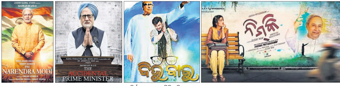
ନିର୍ବାଚନ ହେଉଥିବା ବିଭିନ୍ନ ସିନେମାର ପୋଷ୍ଟର

ଭୁବନେଶ୍ୱର, ୨୩୧ (ବ୍ୟୁରୋ) ପିଲ୍ଲ ମାଧ୍ୟମରେ ଚଳିଛି ନିର୍ବାଚନ ପ୍ରଚାର। ନିଜ ସଫଳତାର ପ୍ରଚାର ପ୍ରସାର ପାଇଁ ପିଲ୍ଲ ମାଧ୍ୟମ କରୁଛନ୍ତି ରାଜନୈତିକ ଦଳ। ଆଗକୁ ସମଗ୍ର ଦେଶରେ ସାଧାରଣ ନିର୍ବାଚନ ହେବାକୁଥିବା ବେଳେ ଏହାପୂର୍ବରୁ ଏଭଳି ପଇଆପଣାଉଛନ୍ତି ଉଭୟ କେନ୍ଦ୍ର ଏବଂ ରାଜ୍ୟ ସରକାର। ନିକଟରେ ଚଳିଛି ହୋଇଥିବା ଇଲେକ୍ଟନ୍ ପ୍ରୋପାଗାଣ୍ଡା କୁହାଯାଉଥିବା ବେଳେ ଏବେ ଏହିଦିନରେ ରାଜ୍ୟ ସରକାର ସାମିଲ ହୋଇଥିବା ଚର୍ଚ୍ଚା ହେଉଛି। ପିଲ୍ଲ ମାଧ୍ୟମରେ 'ବ୍ରାଣ୍ଡ ନବୀନ'ର ପ୍ରଚାର ପ୍ରସାର ପାଇଁ ନୂଆ ଶ୍ରେଣୀ ପ୍ରସ୍ତୁତ ହୋଇଛି। ନବୀନ ପଟ୍ଟନାୟକ ସରକାରଙ୍କ ୧୮ ବର୍ଷ ଶାସନର ଲୋକାଭିମୁଖୀ ଦିଗ ତଥା ସଫଳତାକୁ ଲୋକଙ୍କ ନିକଟରେ ପହଞ୍ଚାଇବାକୁ ପିଲ୍ଲ ସାହାରା ନିଆଯାଇଛି। ଗତ ୧୫ ତାରିଖରେ 'ବିଜୁ ବାବୁ' ପିଲ୍ଲର ପୋଷ୍ଟର ଚଳିଛି ଓ ରୁଧିରା ଚଳିଛି ହୋଇଥିବା ପିଲ୍ଲ 'ନିର୍ମଳି'ରେ ବିଜେଡି ନିଜ ବ୍ରାଣ୍ଡ ଇମେଜର ପ୍ରମୋଶନ କରୁଥିବା ନେଇ ଚର୍ଚ୍ଚା ହେଉଛି। ଗତ ୧୧ ତାରିଖରେ ସମଗ୍ର ଦେଶରେ ଚଳିଛି ହୋଇଥିବା ବୁଲ୍ ବହୁଚର୍ଚ୍ଚିତ ତଥା ବହୁ ବିବାଦୀୟ ପିଲ୍ଲ 'ଦି ଆକ୍ସିଡେଣ୍ଟାଲ୍ ପ୍ରାଇମ ମିନିଷ୍ଟର' ଏବଂ 'ଉଡି ଦି ସର୍ଭିକାଲ୍ ଷ୍ଟାଲ୍'। ୨୦୧୯ ସାଧାରଣ ନିର୍ବାଚନକୁ ଦୃଷ୍ଟିରେ ରଖି ନରେନ୍ଦ୍ର ମୋଦି ସରକାରଙ୍କ ଇଲେକ୍ଟନ୍ କ୍ୟାମ୍ପେନ୍ ଅଂଶଭାବେ ଉଭୟ ପିଲ୍ଲ ପ୍ରସ୍ତୁତ ହୋଇଥିବା ନେଇ ଚର୍ଚ୍ଚା ହୋଇଥିଲା। ଏପରିକି ଟ୍ରେଲର୍ ଲାଞ୍ଚି ହେବା ପରଠାରୁ ହିଁ ବିବାଦ ଘେରରେ ରହିଥିଲା 'ଦି ଆକ୍ସିଡେଣ୍ଟାଲ୍ ପ୍ରାଇମ ମିନିଷ୍ଟର'। ୨୦୦୪ରୁ ୨୦୧୪ ପର୍ଯ୍ୟନ୍ତ ପ୍ରଧାନମନ୍ତ୍ରୀଭାବେ ଭାରତର ଶାସନ ଭାର ସମ୍ଭାଳିଥିବା ମନମୋହନ ସିଂହ ରାଜନୈତିକ ଜୀବନକୁ ନେଇ ଏହି ପିଲ୍ଲର କାହାଣୀ ପ୍ରସ୍ତୁତ ହୋଇଥିବା ବେଳେ ଏଥିରେ କଂଗ୍ରେସକୁ ନିକାରାତ୍ମକଭାବେ ଦର୍ଶାଯାଇଥିଲା। ଯାହାକୁ ନେଇ ପରବର୍ତ୍ତୀ ସମୟରେ ପ୍ରତିବାଦ ପିଲ୍ଲର ସାହାରା ନିଆଯାଇଛି। ଗତ ୧୫ ତାରିଖରେ 'ବିଜୁ ବାବୁ' ପିଲ୍ଲର ପୋଷ୍ଟର ଚଳିଛି ଓ ରୁଧିରା ଚଳିଛି ହୋଇଥିବା ପିଲ୍ଲ 'ନିର୍ମଳି'ରେ ବିଜେଡି ନିଜ ବ୍ରାଣ୍ଡ ଇମେଜର ପ୍ରମୋଶନ କରୁଥିବା ନେଇ ଚର୍ଚ୍ଚା ହେଉଛି।