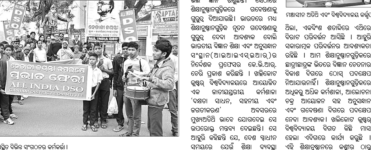
ନେତାଜୀଙ୍କ ପ୍ରତିମୂର୍ତ୍ତିରେ ମାଲ୍ୟାପର୍ଣ୍ଣ ବେଳେ ଉପସ୍ଥିତ ବିଭିନ୍ନ ସଂଗଠନ କର୍ମକର୍ତ୍ତା ।