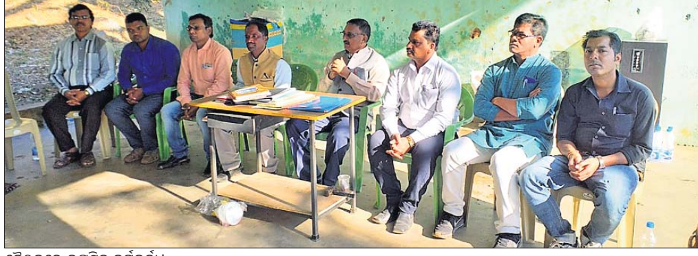
ବୈଠକରେ ଉପସ୍ଥିତ କର୍ମକର୍ତ୍ତା।