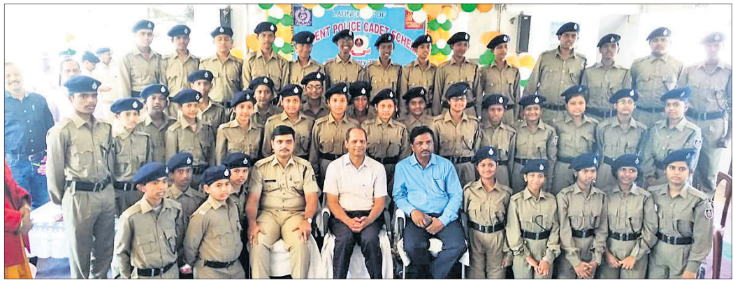
କେନ୍ଦ୍ରୀୟ ବିଦ୍ୟାଳୟରେ ଏସ୍‌ପିସି କାର୍ଯ୍ୟକ୍ରମର ଶୁଭାରମ୍ଭ ସମାବେଶରେ ଅତିଥିମାନଙ୍କ ସହିତ ସମସ୍ତ କର୍ମୀଙ୍କର ଫୋଟୋ ।