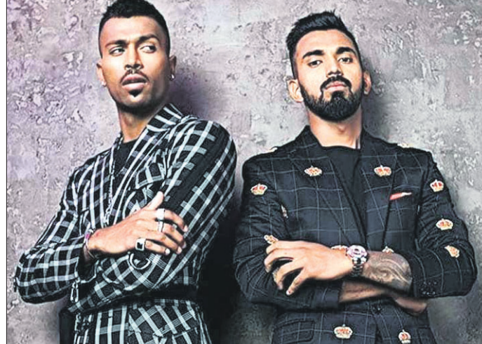
ହାର୍ଦ୍ଦିକ ପାଣ୍ଡ୍ୟା ଓ ଲୋକେଶ ରାହୁଲ ଚାଲିଯାଇଛି। ତେଣୁ ମୁଁ ଏଥିପାଇଁ ଦୁଃଖିତ ବୋଲି କରନ କହିଛନ୍ତି। ଏହି ଘଟଣା ପରେ ସିଏସ୍‌ସି ଜାତୀୟ ଦଳ ଚରଫରୁ ଖେଳୁଥିବା କ୍ରିକେଟରମାନଙ୍କ ପାଇଁ ଏକ ବ୍ୟବହାରିକ ପରାମର୍ଶ କାର୍ଯ୍ୟକ୍ରମ ଲାଗୁ କରିବାକୁ ନିଷ୍ପତ୍ତି ନେଇଥିଲା।