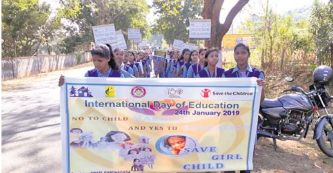
ଛାତ୍ରମାନେ ଶୋଭାଯାତ୍ରାରେ ଯାଉଛନ୍ତି।