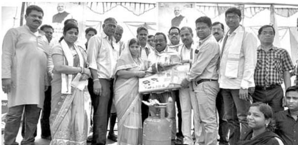
ଜଣେ ହିତାଧିକାରୀଙ୍କୁ ଗ୍ୟାସ୍ ଉପକରଣ ବଣ୍ଟନ କରାଯାଇଛି।

ଉତ୍କଳା ସ୍ୱାଭିମାନ ଦିବସ ଉପଲକ୍ଷେ ଗୋପାଳପୁର ନିର୍ବାଚନମଣ୍ଡଳୀକାରୀମାନଙ୍କୁ ହିତାଧିକାରୀଙ୍କୁ ମାଗଣା ଗ୍ୟାସ୍ ବଣ୍ଟନ କରାଯାଇଛି। ପୂର୍ଣ୍ଣାଧିକାରୀ ଉପକରଣ ବଣ୍ଟନ କରାଯାଇଥିଲା। କାର୍ଯ୍ୟକ୍ରମରେ ଆଇଡିଏସ୍‌ଏଲ୍ ସହାୟକ କର୍ମଚାରୀ ଓ ଭାଙ୍ଗା ରାଜ୍ୟ ସମ୍ପାଦକ ବିଭୁତି ଭୂଷଣ ଜେନା ଉପସ୍ଥିତ ଥିଲେ।