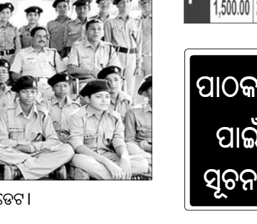
ଅତିଥିମାନଙ୍କ ଗହଣରେ ଖୁଡେଖ-ପୋଲିସ୍ କ୍ୟାଡେଟ୍।