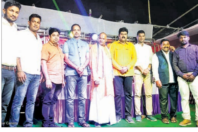
ରତ୍ନଦାନ ଶିବିରରେ ଯୋଗଦେଇଥିବା ଅତିଥିମାନେ ।