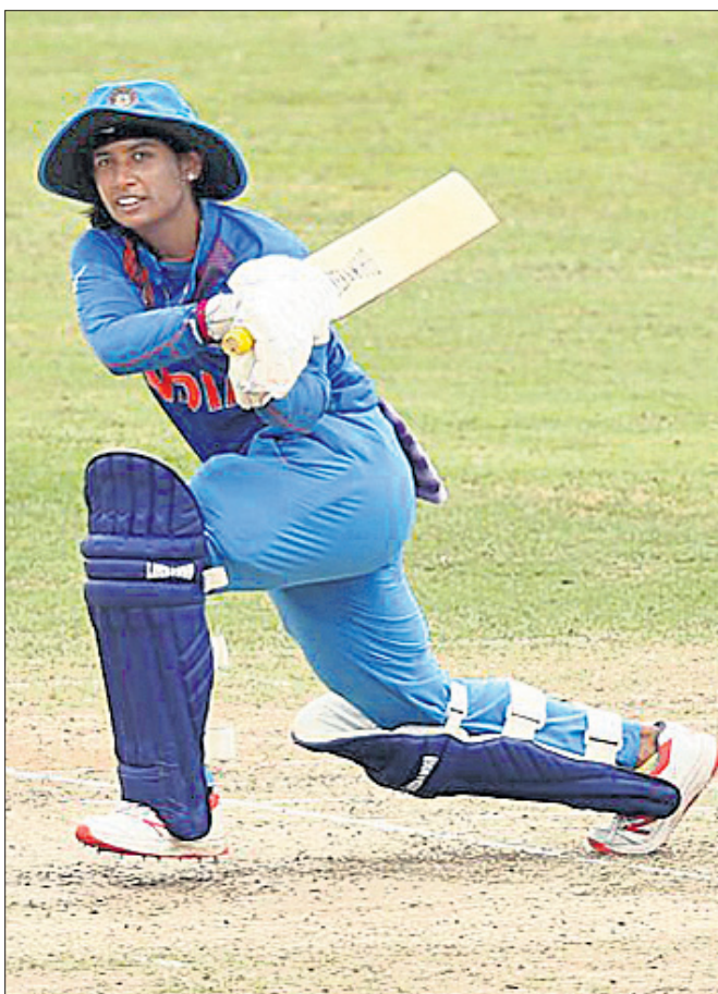
ଅର୍ଦ୍ଧଶତକୀୟ ଇନ୍‌ସିଦ ଅବସରରେ ମିଥାଲି ରାଜ ।

ହାସଲ କରିନେଇଥିଲା । ଏହି ବିଜୟ ସହ ଭାରତୀୟ ମହିଳା କ୍ରିକେଟ୍ ଟିମ୍ ୩ ମ୍ୟାଚ୍‌ବିଶିଷ୍ଟ ଦିନିକିଆ ସିରିଜକୁ ୨-୦ରେ ଆଗୁଆ କଦଳା କରିନେଇଛି । ପୂର୍ବରୁ ସିରିଜର ପ୍ରଥମ ମ୍ୟାଚ୍‌କୁ ଭାରତ ୯ ଭଜକେଟ୍‌ରୁ ବ୍ୟବଧାନରେ ବିଜୟ ଲାଭ କରିଥିଲା । ସିରିଜର ଅକ୍ତିମ ତଥା ୩ୟ ମ୍ୟାଚ୍ ଶୁକ୍ରବାର ହାମିଲଟନ୍‌ରେ ଅନୁଷ୍ଠିତ ହେବ । ଏହାପରେ ବୁଲଟେଣ୍ଟ ମଧ୍ୟରେ ୩ ମ୍ୟାଚ୍‌ବିଶିଷ୍ଟ ଟି୨୦ ସିରିଜ ଫେବୃୟାରୀ ୨୧ରୁ ଆରମ୍ଭ ହେବ । ସ୍ଥାନୀୟ ଦେ ଓଭାଲ ଗ୍ରାଉଣ୍ଡରେ ଖେଳାଯାଇଥିବା ଏହି ଚତୁର୍ଥମୁର୍ତ୍ତି ମ୍ୟାଚ୍‌ରେ ଟ୍ରିଟି ଭାରତୀୟ ଅଧିନାୟିକା ମିଥାଲି ରାଜ ପ୍ରଥମେ ବୋଲି କରିବାକୁ ନିଷ୍ପତ୍ତି ନେଇଥିଲେ । ଜବାବରେ ଆମ୍ବୁଶ ପାଇ ପ୍ରଥମେ ବ୍ୟାଟ୍ କରିଥିବା ଘରୋଇ କିଓ୍ବି ଦଳ ନିର୍ଦ୍ଧାରିତ ବ୍ୟବଧାନରେ ଭଜକେଟ୍