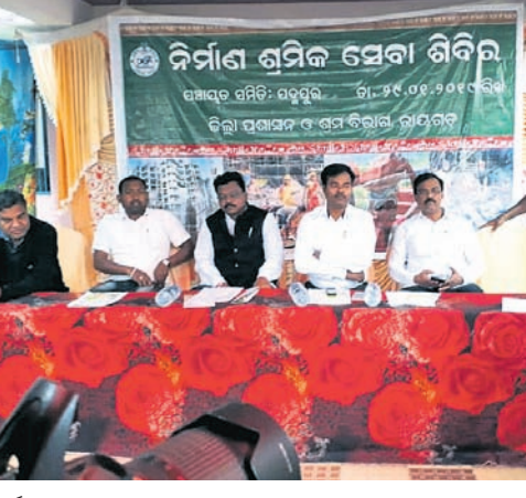
କାର୍ଯ୍ୟକ୍ରମରେ ଉପସ୍ଥିତ ଅତିଥି ।