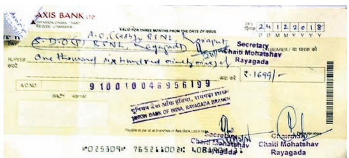
ଫେରସ୍ତ ହୋଇଥିବା ଚେକ୍ ।

ରାୟଗଡ଼ା ଜିଲ୍ଲା ଲୋକ ମହୋତ୍ସବ ଚଳଚ୍ଚିତ୍ର ୨୦୧୮ ଉଦ୍ଘାଟନ ୨୬ରୁ ୩୦ତାରିଖ ପର୍ଯ୍ୟନ୍ତ ଧୂମଧାମ୍ରେ ପାଳନ କରାଯାଇଛି ।