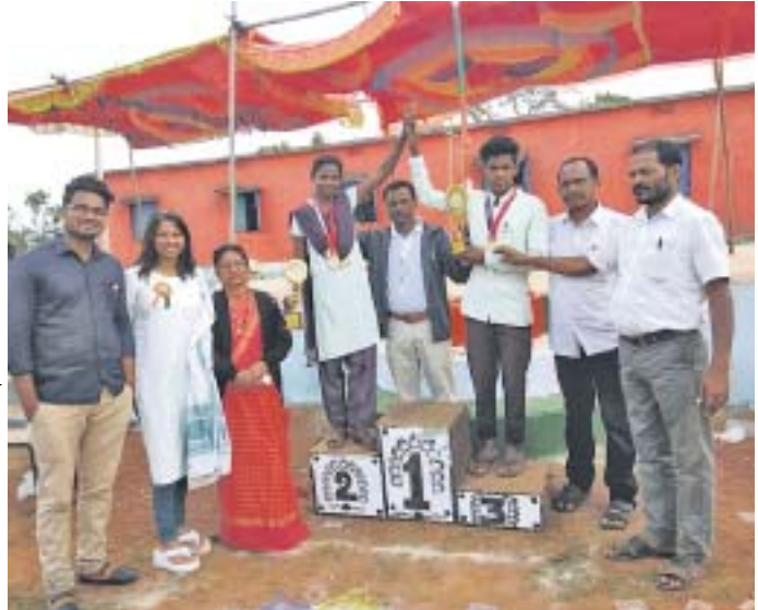
ଅତିଥିଙ୍କ ଗହଣରେ କୃତୀ ପ୍ରତିଯୋଗୀ।