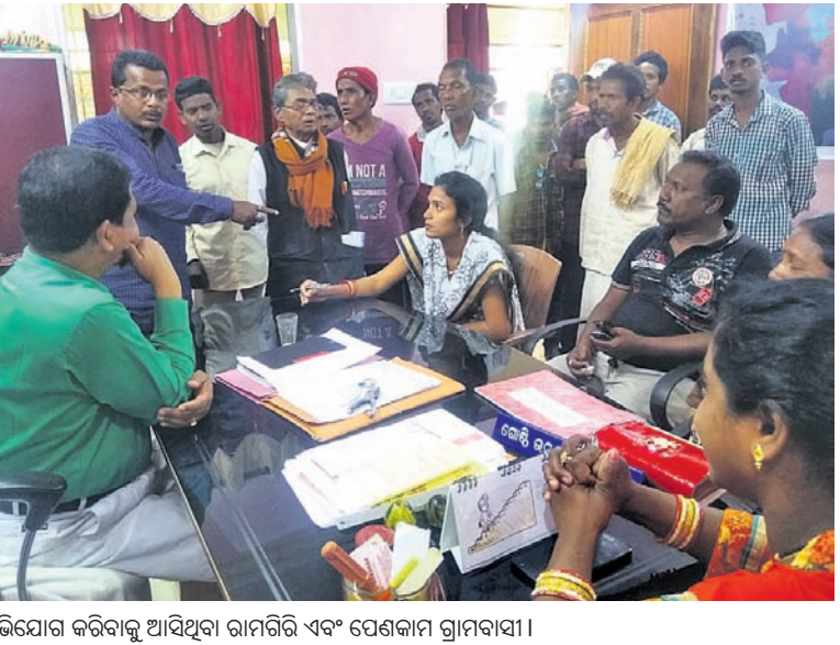
ଅଭିଯୋଗ କରିବାକୁ ଆସିଥିବା ରାମଗିରି ଏବଂ ପେଟକାମ ଗ୍ରାମବାସୀ ।

ଦେବାକୁ ପିଇଓମାନଙ୍କୁ ଜଣାଯାଇଥିଲା । ଭିତ୍ତିମଧ୍ୟରେ ୩ ମାସ ବିତି ଥିଲେ ସୁଦ୍ଧା ୧୨ଟି ପଞ୍ଚାୟତ ମଧ୍ୟରୁ ମାତ୍ର ଗୋଟିଏ ପଞ୍ଚାୟତରୁ ଚାଲିବା ଆସିଛି ।