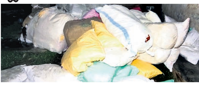
ଜବତ ହୋଇଥିବା ଗୁଟଖା ।