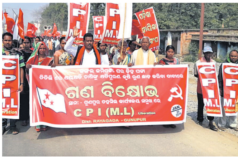
ଏକ ପକ୍ଷରୁ ବାହାରିଥିବା ଶୋଭାଯାତ୍ରା ।

ରାୟଗଡ଼ା ଜିଲ୍ଲା ଗୁଣପୁର ବିଭିନ୍ନ ସମସ୍ୟା ନେଇ ସିପିଆଇ (ଏମଏଲ) ପକ୍ଷରୁ ମଙ୍ଗଳବାର ଡହସିଲ ଅଫିସ୍ ଘେରାଉ କରାଯାଇଛି ।