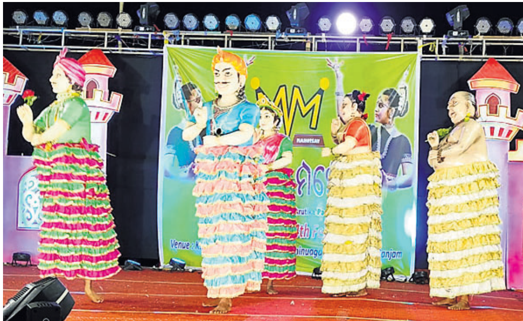
ଦିଗପହଣ୍ଡି ବିଚିତ୍ର ବର୍ଣ୍ଣାଳୀ ନାଟ୍ୟ ସଂସଦର କଳାକାରମାନେ ପଶୁମୁଖା ନୃତ୍ୟ ପରିବେଷଣ କରୁଛନ୍ତି ।