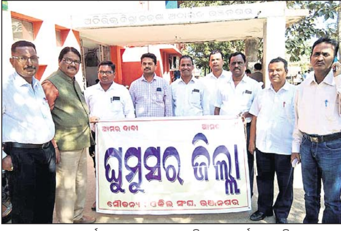
ଆଇନଜୀବୀମାନେ କୋର୍ଟ ପୂର୍ଣ୍ଣ ପାଠକ ସମ୍ମୁଖରେ ବିରୋଧ ପ୍ରଦର୍ଶନ କରୁଛନ୍ତି।

ରାଜ୍ୟରେ ଆଉ ଦିନି ନୂଆ ଜିଲ୍ଲା ଘୋଷଣା ହେବ ବୋଲି ଚର୍ଚ୍ଚା ହେଉଛି, କିନ୍ତୁ ଉକ୍ତ ଚର୍ଚ୍ଚାରେ ସ୍ୱପ୍ନସର ଜିଲ୍ଲା ନାହିଁ। ଯାହାକୁ ନେଇ ସ୍ୱପ୍ନସରବାସୀଙ୍କ ମଧ୍ୟରେ ଅସନ୍ତୋଷ ପ୍ରକାଶ ପାଇଛି। ସ୍ୱପ୍ନସର ଜିଲ୍ଲା ଘୋଷଣା ଦାବିନେଇ ଭଞ୍ଜନଗର ବାର ଆସୋସିଏଟସନ ବିଗତ କିଛିବର୍ଷ ହେବ ମାସର ଶେଷ ଦୁଇ କାର୍ଯ୍ୟଦିବସରେ କାର୍ଯ୍ୟ ବନ୍ଦ କରି ଆନ୍ଦୋଳନ କରୁଛି। ରୁଧିରାଣୀ ମଧ୍ୟ କାର୍ଯ୍ୟବନ୍ଦ ଆନ୍ଦୋଳନ ହୋଇଥିଲା। ଫଳରେ ଲୋକେ ହଇଚାଣ ହୋଇଥିଲେ। ଗୁରୁବାର ମଧ୍ୟ କୋର୍ଟ କାର୍ଯ୍ୟ ବନ୍ଦ ରହିବ।