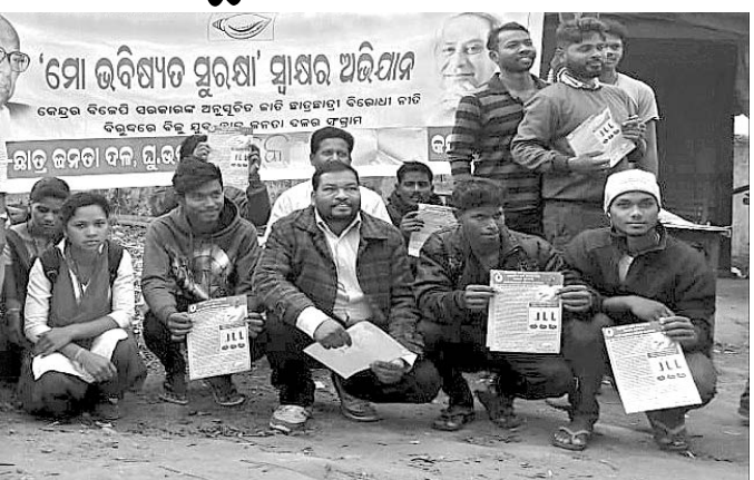
ଉପସ୍ଥିତ ବିଜେଡି କର୍ମକର୍ତ୍ତା।

କେନ୍ଦ୍ର ସରକାରଙ୍କ ଛାତ୍ର ବୃତ୍ତି କମ କରିବା ପ୍ରତିବାଦରେ ସାରା ରାଜ୍ୟରେ ବିଜେଡି ଚରଫତୁ ମୋ ଭବିଷ୍ୟତ ସୁରକ୍ଷା ସ୍ୱାକ୍ଷର ଅଭିଯାନ ଆରମ୍ଭ ହୋଇଛି। ଏହି କ୍ରମରେ ଜି.ଉଦୟଗିରି ବୁକ ବିଜେଡି ଚରଫତୁ ସ୍ୱାକ୍ଷର ଅଭିଯାନ ଅନୁଷ୍ଠିତ ହୋଇଥିଲା।