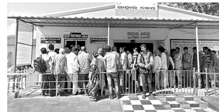
ଆହାର କେନ୍ଦ୍ରରେ ଲାୟାଉଟି।

ଜି.ଉଦୟଗିରି ସହରରେ ଗତ ୨୩ ତାରିଖ ତହସିଲ କାର୍ଯ୍ୟାଳୟ ପାର୍ଶ୍ୱରେ ଆହାର କେନ୍ଦ୍ର ଖୋଲିଥିଲା। କିନ୍ତୁ ଶହେ ଜଣଙ୍କ ପାଇଁ ଆହାର କେନ୍ଦ୍ରରେ ଖାଇବା କୁପନ ମିଳିଥିଲା। ଆହାର କେନ୍ଦ୍ରରେ ଦୈନିକ ୩ଶହ ଲୋକଙ୍କ ପାଇଁ ଖାଦ୍ୟ ବ୍ୟବସ୍ଥା ସମ୍ପର୍କରେ ଲେଖାଯାଇଥିବା ବେଳେ ମାତ୍ର ଶହେ ଜଣଙ୍କୁ କାର୍ଯ୍ୟକ୍ରମରେ ଉପସ୍ଥିତ କରିବାକୁ ପଡ଼ିଥିଲା।