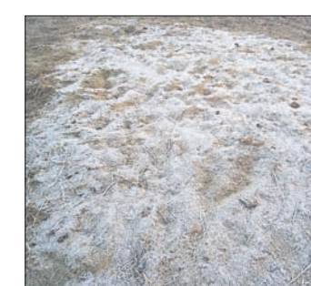
ଦାରିଙ୍ଗବାଡ଼ିର ବି.ଡକେବାଡ଼ି ଅଞ୍ଚଳରେ ତୁଷାରପାତ।

ହଠାତ୍ ତୁଷାରପାତ ଯୋଗୁ ଶୀତ ବୃଦ୍ଧି ପାଇବା ସହ ଜନଜୀବନ ଅସ୍ଵାଭାବିକ ହୋଇପଡିଛି। ଘରୁ ପଦାକୁ ବାହାରିବା ପୁସ୍ତକ ହୋଇପଡିଛି। ଦାରିଙ୍ଗବାଡ଼ିର ବି.ଡକେବାଡ଼ି ଅଞ୍ଚଳ ସମେତ ବିଦ୍ୟୁତ୍ କାର୍ଯ୍ୟାଳୟ, କଫିବରିତା, କିଲ୍ଲାବାଡ଼ି ପ୍ଲେହରୀ, ସିମନବାଡ଼ି, ସିଆଙ୍ଗବାଲି, ଭ୍ରାମରବାଡ଼ି, ଗ୍ରାମବାଡ଼ି, ଦନେକବାଡ଼ିଆଦି ଅଞ୍ଚଳରେ ଅଧିକ ତୁଷାରପାତ ହୋଇଛି। ଦାରିଙ୍ଗବାଡ଼ିକୁ ଆସିଥିବା ପର୍ଯ୍ୟଟକ ତୁଷାରପାତର ମଜା ନେଇଥିଲେ। ଏକଲି ତୁଷାରପାତ ପ୍ରଥମଥର ପାଇଁ