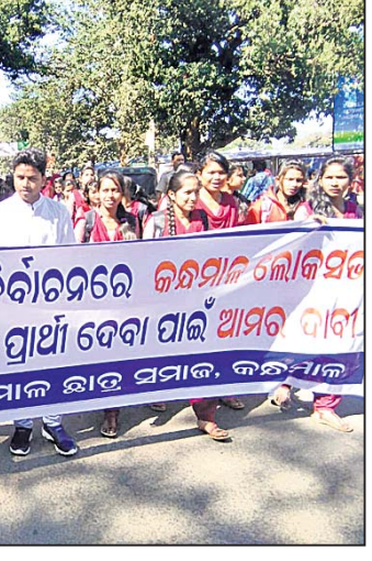
ଛାତ୍ର ସମାଜ ବିରୋଧ ପ୍ରଦର୍ଶନ କରୁଛନ୍ତି।

କନ୍ଧମାଳ ଲୋକସଭା ଆସନରେ ବାହାର ଜିଲାର ପ୍ରାର୍ଥୀଙ୍କୁ ଅଗ୍ରାଧିକାର ଦିଆଯାଇଛି। ଆଉ କିଛିଦିନ ପରେ ସାଧାରଣ ନିର୍ବାଚନ ଆସି ଜିଲ୍ଲାରେ ବହୁ ଯୋଗ୍ୟ ପ୍ରାର୍ଥୀ ଅଛନ୍ତି। ତେଣୁ ଅଗ୍ରାଧିକାର ଭିତରେ ଆମ ଜିଲାରୁ ଜଣେ ପ୍ରାର୍ଥୀଙ୍କୁ ଲୋକ ସଭା ନିର୍ବାଚନ ଲଢ଼ିବା ପାଇଁ ସୁଯୋଗ ଦିଆଯିବା ଦାବିରେ ରୁଧିରାଣୀ କନ୍ଧମାଳ ଛାତ୍ର ସମାଜ ପକ୍ଷରୁ ଏକ ରାଲି ଅନୁଷ୍ଠିତ ହୋଇଯାଇଛି। ସୂଚନା ଅନୁସାରେ ଏହି ରାଲି ଗୋପବନ୍ଧୁ ଛକରୁ ବାହାରିବାକୁ କାର୍ଯ୍ୟକ୍ରମ ଘିର ହୋଇଥିଲା। ହେଲେ କେତେକେଣେ ପଡ଼ିଆକୁ ବାହାରିଥିଲା। ସେଠାରୁ ସହର ପରିକ୍ରମା ଦୂରର କଥା ମାତ୍ର ୧୦୦ ମିଟର ଦୂର ଜିଲ୍ଲାପାଳଙ୍କ କାର୍ଯ୍ୟାଳୟ ପାଖରେ ଯାଇ ସମାପ୍ତ ହେଲା।