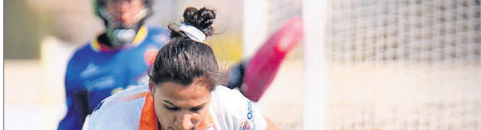
ମହିଳା ହକି: ଭାରତ-ସ୍ୱେନ୍ ମ୍ୟାଚ୍ରେ ଅନୁଷ୍ଠିତ ମ୍ୟାଚ୍।

ସ୍ୱେନ୍ ଓ ଭାରତ ମହିଳା ହକି ଦଳ ମଧ୍ୟରେ ଅନୁଷ୍ଠିତ ଚତୁର୍ଥ ତଥା ଅନ୍ତିମ ମ୍ୟାଚ୍ ୨-୨ରେ ଅମୀମ୍ୟାଦିତ ଭାବେ ଶେଷ ହୋଇଛି।