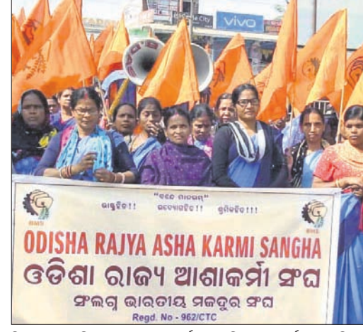
ଜିଲାପାଳଙ୍କ ଅଫିସ ସମ୍ମୁଖରେ ଆଶାକର୍ମୀମାନେ ବିକ୍ଷୋଭ ପ୍ରଦର୍ଶନ କରୁଛନ୍ତି।