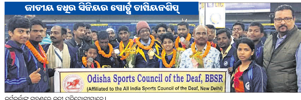
କର୍ମକର୍ମୀଙ୍କ ସମ୍ମାନରେ କୃତା ପ୍ରତିଯୋଗୀମାନେ।

ଭୁବନେଶ୍ୱର, ୩୧୧୧ (ସୋର୍ସ୍ ଟ୍ୟୁବୋ) ପ୍ରତିଯୋଗୀମାନେ ଉଲ୍ଲେଖନୀୟ ପ୍ରଦର୍ଶନ କରିଛନ୍ତି।