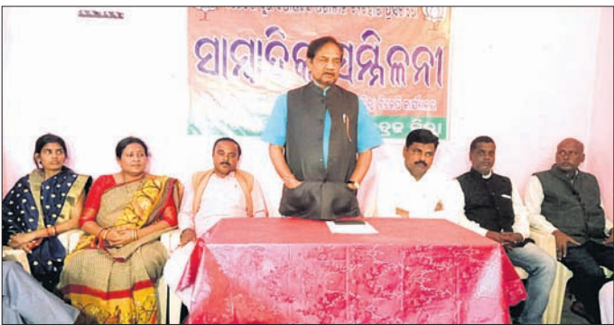
ଖବରଦାତା ସମ୍ମିଳନୀରେ ଭାଜପା ନେତାମାନେ।