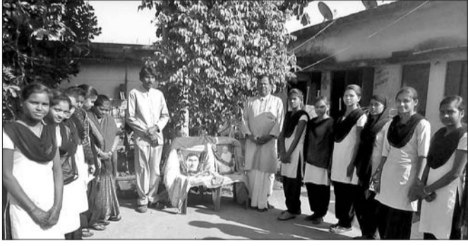
ଶହାଦ ଦିବସ ପାଳନ ଅବସରରେ ଉପସ୍ଥିତ ଭ୍ରାତୃଭ୍ରାତୃ, ଅତିଥି।

ରାଉରକେଲା ଅଫିସ୍, ୩୧।୧- ରାଉରକେଲା ମହାନଗର ନିଗମ (ମାନ୍ସୁନି) ପକ୍ଷରୁ ବ୍ରାହ୍ମଣୀ ସ୍ତ୍ରୀମାନଙ୍କୁ ମହାତ୍ୟା ଗୁଣ୍ଡାମାଡ଼ ରହିବା ପର୍ଯ୍ୟନ୍ତ ଦିଆଯିବ। ଶୁଣ୍ଠିପାରେ ଅନୁଷ୍ଠିତ ହେବ। ଏଥିରେ ବିଭିନ୍ନ କାର୍ଯ୍ୟକ୍ରମ ସହ ସମ୍ଭାଷଣ ଆକର୍ଷଣୀୟ ସାଂସ୍କୃତିକ କାର୍ଯ୍ୟକ୍ରମ ପରିଚେଷ୍ଟା କରାଯିବ।