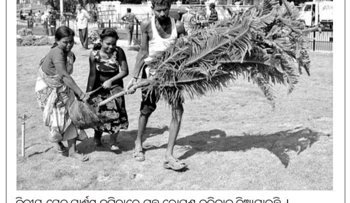
ବୃତ୍ତୀୟ ସେତୁ ପାର୍ଶ୍ୱସ୍ଥ ବନିତାରେ ଗଛ ରୋପଣ କରିବାକୁ ନିଆଯାଇଛି ।