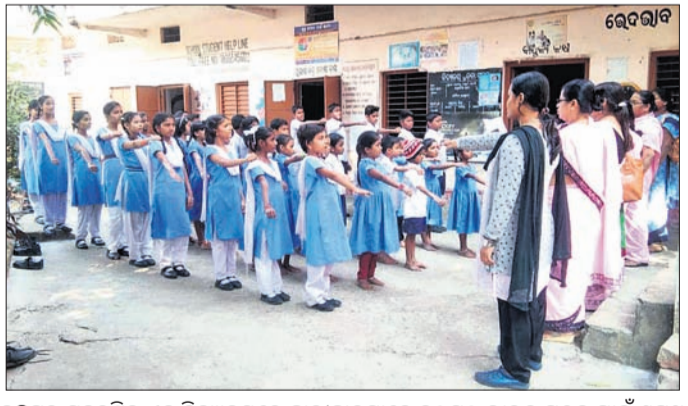
ବ୍ରହ୍ମପୁର ସହରସ୍ଥିତ ଏକ ବିଦ୍ୟାଳୟରେ ଛାତ୍ରାଛାତ୍ରୀମାନେ କୁଷ୍ଠପୂଜା ଭାରତ ଗଠନ ପାଇଁ ଶପଥ ନେଉଛନ୍ତି ।

ଆଶାବାଦ ରାଉତ ବ୍ରହ୍ମପୁର ଅଧିକ, ୩୧।୧ ସରକାରୀ ଏବଂ ବେସରକାରୀ ପ୍ରଭେଦେ ବହୁ ସେଚେନତ କାର୍ଯ୍ୟକ୍ରମ ସେବୁ, କୁଷ୍ଠକୁ ନେଇ ଆଜି ମଧ୍ୟ ସାମାଜିକ ଦୃଷ୍ଟିକୋଣ ବଦଳି ନାହିଁ ।