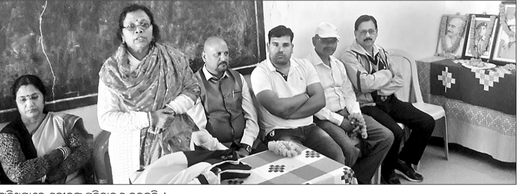
ଅତିଥିମାନେ ଶହୀଦଙ୍କ ସ୍ମୃତିରାଶୀ କରୁଛନ୍ତି ।

ବରଗଡ଼ ପୌର ପରିଷଦ ଅନ୍ତର୍ଗତ ରାଣାପ୍ରତାପ ସ୍କୁଲ ପରିସରରେ ଗୁରୁବାର ଜାତିର ପିତା ମହାତ୍ମାଗାନ୍ଧୀଙ୍କ ମହାପ୍ରୟାଣ ଦିବସ ପାଳିତ ହୋଇଛି ।