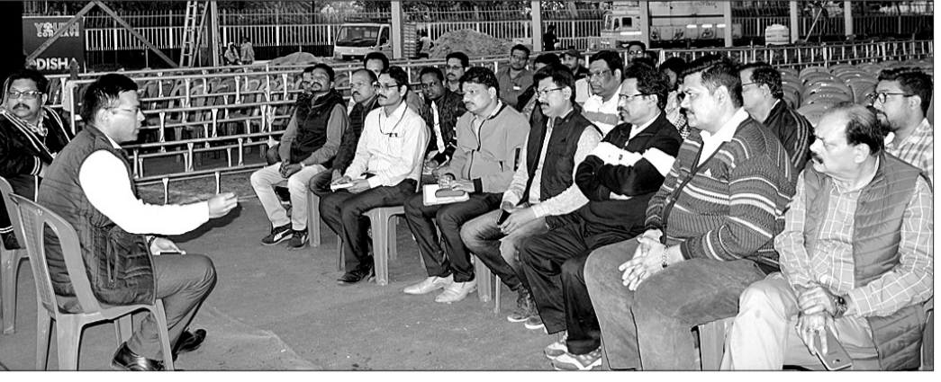
ସମ୍ବଲପୁର ବିଜୁ ଯୁବ ସମାବେଶ କାର୍ଯ୍ୟକ୍ରମକୁ ନେଇ ଜିଲ୍ଲାପାଳ ଅଧିକାରୀଙ୍କ ସହ ଆଲୋଚନା କରୁଛନ୍ତି ।

ସମ୍ବଲପୁର, ୩୧।୧ (ବୁଧବେ)- ସମ୍ବଲପୁର ଜିଲ୍ଲାର ବିଜୁ ଯୁବ ସମାବେଶ ଆୟୋଜନ ନେଇ ପ୍ରସ୍ତୁତି ଚୁଡ଼ାନ୍ତ ହୋଇଛି । ମୁଖ୍ୟମନ୍ତ୍ରୀ ନବୀନ ପଟ୍ଟନାୟକ ଏଥିରେ ଯୋଗ ଦେବା କାର୍ଯ୍ୟକ୍ରମ ରହିଛି ।