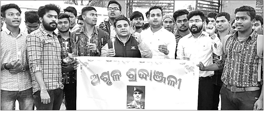
ଗୁରୁବାର ସମ୍ବଲପୁର ଜିଏମ୍‌ସିଏଫ୍‌ସି ପାଠକରେ କ୍ୟାଣ୍ଟେଲ ଶୋଭାଯାତ୍ରା ଅର୍ପଣ କରାଯାଇଛି ।

ସମ୍ବଲପୁର, ୩୧।୧(ବୁଧବେ) ପ୍ରେମପୁସ୍ତକାଳୟ ସମ୍ବଲପୁର ପକ୍ଷରୁ ଜିଏମ୍‌ସିଏଫ୍‌ସି ପାଠକରେ କ୍ୟାଣ୍ଟେଲ ଶୋଭାଯାତ୍ରା ଆରମ୍ଭ ହୋଇଛି ।