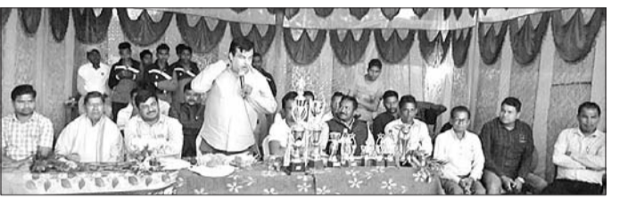
ଟୁର୍ଣ୍ଣାମେଣ୍ଟ ଉଦ୍‌ଘାଟନା ଉତ୍ସବରେ ଉପସ୍ଥିତ ଅତିଥି ।

ସମ୍ବଲପୁର ଜିଲ୍ଲା ରେଭାନ୍ସାଲ କ୍ଲବ୍ କ୍ରିକେଟ ଟୁର୍ଣ୍ଣାମେଣ୍ଟ ଉଦ୍‌ଘାଟିତ ହୋଇଛି ।