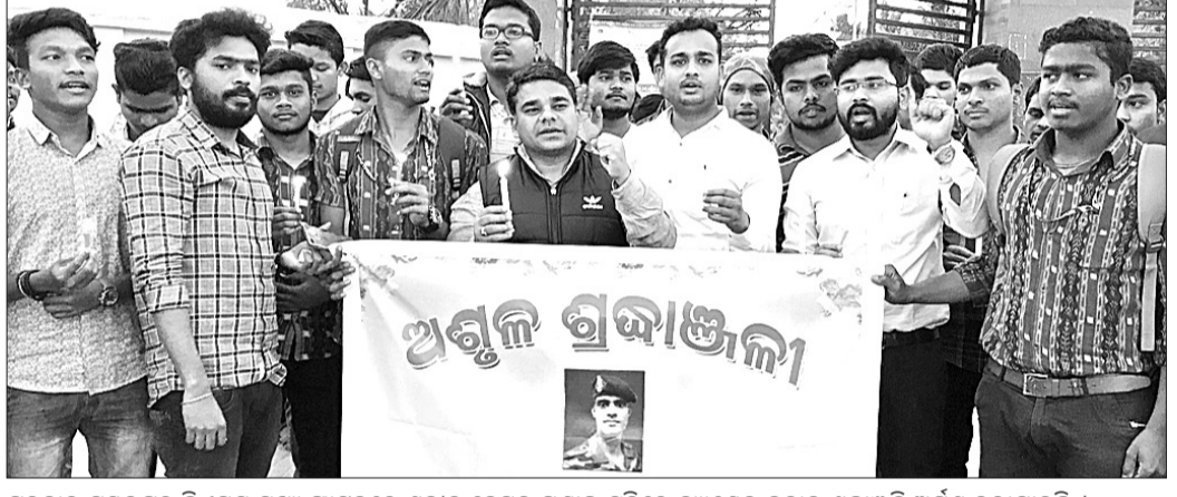
ଗୁରୁବାର ସମ୍ବଲପୁର ଜିଏମ୍.ସୁ ପାଟକରେ ଶହୀଦ ହେମନ୍ତ ପଣ୍ଡାଙ୍କ ସ୍ମୃତି ଉଦ୍ଦେଶ୍ୟରେ କ୍ୟାଣ୍ଟେଲ ଶୋଭାଯାତ୍ରା ଅର୍ପଣ କରାଯାଇଛି ।

ପ୍ରୋଗ୍ରେସିଭ ସମ୍ବଲପୁର ପକ୍ଷରୁ ଗଙ୍ଗାଧର ମେହେର ବିଶ୍ୱବିଦ୍ୟାଳୟ (ଜିଏମ୍.ସୁ) ଠାରେ ଖୋର୍ଦ୍ଧା ବେପୁଆର ଶହୀଦ ହେମନ୍ତ ପଣ୍ଡାଙ୍କ ସ୍ମୃତି ଉଦ୍ଦେଶ୍ୟରେ କ୍ୟାଣ୍ଟେଲ ଶୋଭାଯାତ୍ରା ଗୁରୁବାର ଅନୁଷ୍ଠିତ ହୋଇଯାଇଛି ।