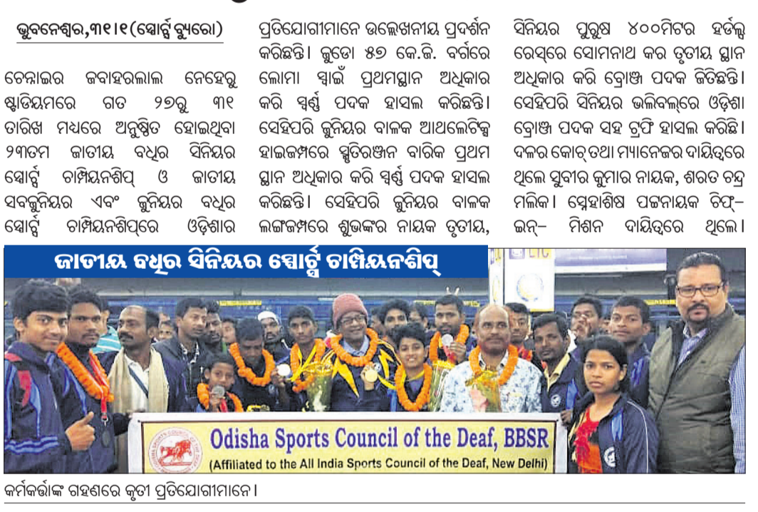
କର୍ମକର୍ମୀଙ୍କ ଗହଣରେ କୃତୀ ପ୍ରତିଯୋଗୀମାନେ।