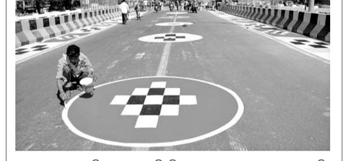
ସମ୍ବଲପୁର ମହାନଦୀ ବୃତ୍ତୀୟ ସେତୁରେ ଚିତ୍ରଶିଳ୍ପମାନେ ସମ୍ବଲପୁର ସପତାପତ୍ର ଆଙ୍କୁଛନ୍ତି ।