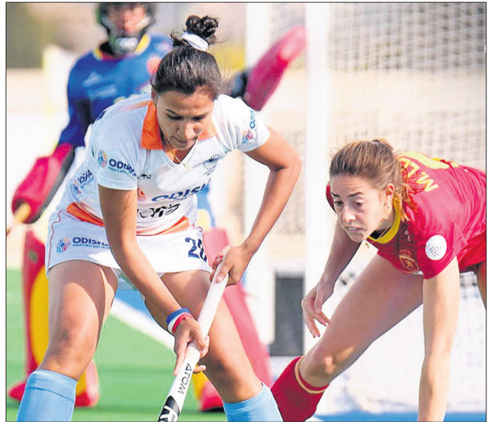
ମହିଳା ହକି: ଭାରତ-ସ୍ୱେନ୍ ମ୍ୟାଚ୍ରେ ଅସ୍ଥିର ମ୍ୟାଚ୍।