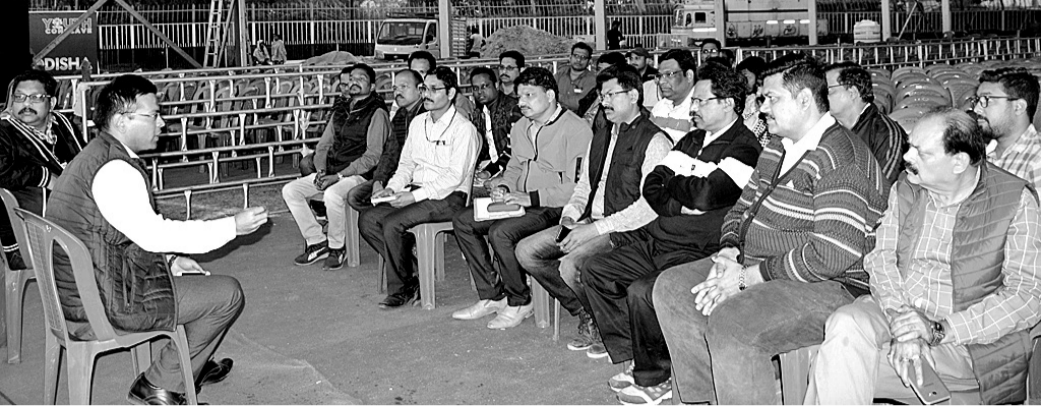
ସମ୍ବଲପୁର ବିଜୁ ମୁବ ସମାବେଶ କାର୍ଯ୍ୟକ୍ରମ ନେଇ ଜିଲ୍ଲାପାଳ ଅଧିକାରୀଙ୍କ ସହ ଆଲୋଚନା କରୁଛନ୍ତି ।

ସମ୍ବଲପୁର ଜିଏମ୍‌ସିଏଫ୍‌ସି ଷ୍ଟାଡ଼ିୟମଠାରେ ଶୁକ୍ରବାର ବିଜୁ ମୁବ ସମାବେଶ ଆୟୋଜନ ନେଇ ପ୍ରସ୍ତୁତି ରୁଡ଼ାନ୍ତ ହୋଇଛି ।