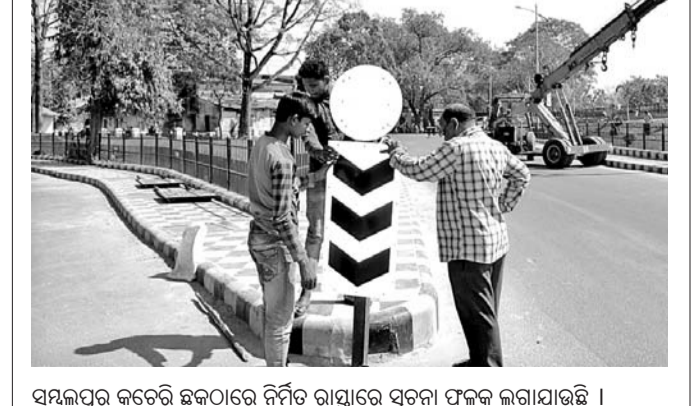
ସମ୍ବଲପୁର କଟେରି ଛକଠାରେ ନିର୍ମିତ ରାସ୍ତାରେ ସୂଚନା ଫଙ୍କ୍ସ ଲଗାଯାଇଛି ।