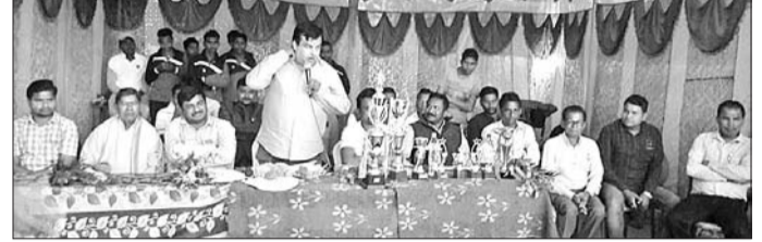
ଟୁର୍ଣ୍ଣାମେଣ୍ଟର ଉଦ୍ଘାଟନା ଉତ୍ସବରେ ଉପସ୍ଥିତ ଅତିଥି ।

କୋରାପୁଟ, ୩୧।୧ (ବି.ଏନ୍.ଏ.) ଆୟୋଜକ କୁଳ ସଭାପତି ତଥା ସରପଞ୍ଚ ସମ୍ବଲପୁର ଜିଲ୍ଲା କୋରାପୁଟ ବ୍ଲକ୍ ଟ୍ରିକେଟର ହାଇସ୍କୁଲ ଶେଳ ପତିଆରେ ଚାଲିଥିବା ୨୬ତମ ସିଦ୍ଧେଶ୍ୱର ବାବା କ୍ରିକେଟ ଟୁର୍ଣ୍ଣାମେଣ୍ଟ ଉଦ୍ଘାଟନ ଉଦ୍ଘାଟିତ ହୋଇଯାଇଛି ।