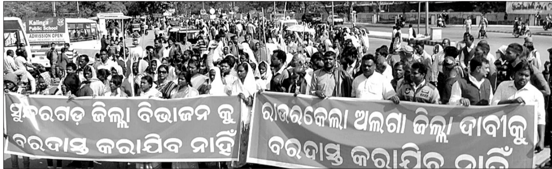
ସୁନ୍ଦରଗଡ଼ ଜିଲ୍ଲା ବିଭାଜନ ଦାବି ବିରୋଧରେ ଆଦିବାସୀ ମୂଳବାସୀ ମଞ୍ଚ ପକ୍ଷରୁ ବିରୋଧୀ ଶୋଭାଯାତ୍ରା।

ସୁନ୍ଦରଗଡ଼ ଜିଲ୍ଲାକୁ ବିଭାଜନ କରି ରାଉରକେଲାକୁ ସ୍ୱତନ୍ତ୍ର ଜିଲ୍ଲା କରିବାକୁ ଦାବି ହୋଇ ଆସୁଛି। ତେବେ ଏ ସମ୍ପର୍କରେ ରାଜ୍ୟ ସରକାର କୌଣସି ନିଷ୍ପତ୍ତି ନେଇ ନ ଥିଲେ ମଧ୍ୟ ଜିଲ୍ଲାର ମୂଳବାସୀ ଆଦିବାସୀଙ୍କ ମଧ୍ୟରେ ତୀବ୍ର ପ୍ରତିକ୍ରମା ପ୍ରକାଶ ପାଇଛି।