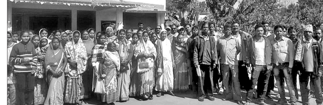
ଜମି ଲିଜ୍ ପ୍ରଦାନ ନେଇ ଜଲଦା ପଞ୍ଚାୟତବାସୀଙ୍କ ପକ୍ଷରୁ ଲାଠିକଟା ଚଉକିଲଦାରଙ୍କୁ ବିରୋଧ କରାଯାଇଛି।

ପର୍ଚ୍ଚଲାଇଜର ଚାରନଶିପ ନିକଟ ପୂର୍ବସଦି କଲୋନା ଜଲଦା ଅଞ୍ଚଳର ବଳକା ଜମିକୁ ଲିଜ୍ ପ୍ରଦାନକୁ ଗ୍ରାମବାସୀ ବାସିନ୍ଦା ବିରୋଧ କରିଛନ୍ତି। ଏନେଇ ଲାଠିକଟା ଚଉକିଲଦାରଙ୍କ ନେତୃତ୍ୱ ନେଇ ୧୨/୧୮/୧୯ ୨୯/୧୮ ଅନୁସାରେ ୨୪ ପରିବାରକୁ ୪୬ ଦିନିକି ଜମି ଜଲଦା ଅଞ୍ଚଳରେ ପ୍ରଦାନ ପାଇଁ ନିଷ୍ପତ୍ତି ଦିଆଯାଇଛି।