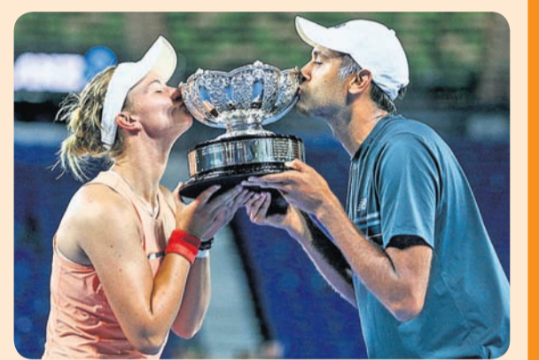
ବାର୍ବରା କ୍ରେଜିକୋଭା-ରାଜାବ ରାମ

୨୦୧୫ରେ ଆରମ୍ଭ ହୋଇଥିଲା ନାଓମି ଓସାକାଙ୍କ ଗ୍ରାଣ୍ଡସ୍ଲାମ କ୍ୟାରିୟର। ଏହି ବର୍ଷ ସେ ଫ୍ରେମ୍ଲଟନ ଓ ମୁଖ୍ୟ ଓପନରେ ଯୋଗ୍ୟତା ପର୍ଯ୍ୟନ୍ତ ଖେଳି ସଫଳ ହୋଇ ନ ଥିଲେ। ୨୦୧୬ରେ ଅଷ୍ଟ୍ରେଲିଆନ ଓପନ, ଫ୍ରେଞ୍ଚ୍ ଓପନ ଏବଂ ମୁଖ୍ୟ ଓପନର ୩ୟ ରାଉଣ୍ଡ ପର୍ଯ୍ୟନ୍ତ ଯାଇପାରିଥିଲେ। ୨୦୧୭ରେ ଅଷ୍ଟ୍ରେଲିଆନ ଓପନର ୨ୟ, ଫ୍ରେଞ୍ଚ୍ ଓପନର ୧ମ, ଫ୍ରେମ୍ଲଟନର ୩ୟ ଓ ମୁଖ୍ୟ ଓପନର ୩ୟ ରାଉଣ୍ଡକୁ ବିଦାୟ ନେଇଥିଲେ। ୨୦୧୮ରେ ସେ ଅଷ୍ଟ୍ରେଲିଆନ ଓପନର ୪ର୍ଥ ରାଉଣ୍ଡରେ ପ୍ରବେଶ କରିଥିବାବେଳେ ଫ୍ରେଞ୍ଚ୍ ଓପନ ଓ ଫ୍ରେମ୍ଲଟନର ୩ୟ ରାଉଣ୍ଡକୁ ବିଦାୟ ନେଇଥିଲେ। ତେବେ ମୁଖ୍ୟ ଓପନ ଚାମ୍ପିୟନ ଜିତି କ୍ୟାରିୟରରେ ବଡ଼ ସଫଳତା ପାଇଥିଲେ। ୨୦୧୯ରେ ଅଷ୍ଟ୍ରେଲିଆନ ଓପନରେ ଚାମ୍ପିୟନ ହୋଇ ଅଭିଯାନ ଆରମ୍ଭ କରିଛନ୍ତି ଏହି ଜାପାନୀ ମହିଳା ଚେନିସ ଚାମ୍ପିୟନ।