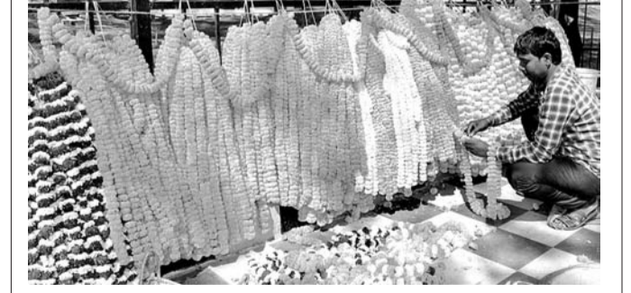
ସମ୍ବଲପୁର କଟେରି ଛକଠାରେ ମୁଖ୍ୟମନ୍ତ୍ରୀଙ୍କ କାର୍ଯ୍ୟକ୍ରମ ଦିନକ ପୂର୍ବରୁ ପୂର୍ଣ୍ଣ ସଜା ଯାଇଛି ।