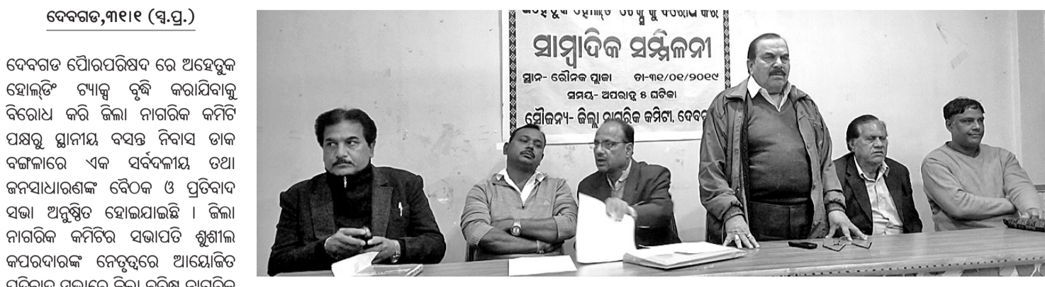
ସ୍ୱାଧୀନତା ପ୍ରତିବାଦ ସଭାରେ ଉପସ୍ଥିତ ଅତିଥିମାନେ।

ଦେବଗଡ଼ ପୌରପରିଷଦ ରେ ଅହେତୁକ ହୋଇଛି ଟ୍ୟାକ୍ସ ବୃଦ୍ଧି କରାଯିବାକୁ ବିରୋଧ କରି ଜିଲ୍ଲା ନାଗରିକ କମିଟି ପକ୍ଷରୁ ଗୁମାସ୍ତା ବ୍ୟତୀତ ନିର୍ବାସିତ ବାକି ସର୍ବଦଳୀୟ ତଥା ଜନସାଧାରଣଙ୍କ ବୈଠକ ଓ ପ୍ରତିବାଦ ସଭା ଅନୁଷ୍ଠିତ ହୋଇଯାଇଛି ।