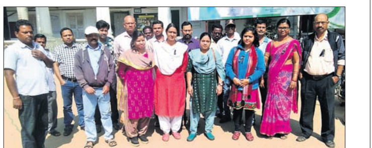
କଳାବ୍ୟାଜ୍ ପରିଧାନ କରିଥିବା ଓପେପା ଠିକା କର୍ମଚାରୀମାନେ।

ଘୁଣ୍ଟା ନିଯୁକ୍ତି ଦାବିରେ ଦେଢ଼ାନାଳ ଜିଲ୍ଲା କାର୍ଯ୍ୟାଳୟରେ କାର୍ଯ୍ୟରତ ଓଡ଼ିଶା ପ୍ରାଥମିକ ଶିକ୍ଷା କାର୍ଯ୍ୟକ୍ରମ ପ୍ରାଧିକରଣ (ଓପେପା) ଠିକା କର୍ମଚାରୀମାନେ ଶୁକ୍ରବାରଠାକୁ କଳାବ୍ୟାଜ୍ ପରିଧାନ କରିଛନ୍ତି। ସମ୍ପୂର୍ଣ୍ଣ କର୍ମଚାରୀମାନେ ଦୀର୍ଘ ୨୦ ବର୍ଷ ହେଲା କାର୍ଯ୍ୟ କରି ଆସୁଛନ୍ତି। ବାରମ୍ବାର ଦାବି ସତ୍ତ୍ୱେ ସେମାନଙ୍କୁ ଘୁଣ୍ଟା ନିଯୁକ୍ତି ମିଳୁନାହିଁ। ଏହାକୁ ନେଇ ସଂଘ ପସରୁ ତୀବ୍ର ପ୍ରତିକ୍ରିୟା ପ୍ରକାଶ ପାଇଛି। ଏହାର ପ୍ରତିବାଦରେ କର୍ମଚାରୀମାନେ ଶୁକ୍ରବାରଠାକୁ ଦୁଇଦିନିଆ ପ୍ରତୀକାତ୍ମକ ଆନ୍ଦୋଳନ ଆରମ୍ଭ କରିଛନ୍ତି। ଏ ନେଇ ଜିଲ୍ଲାପାଳ, ଜିଲ୍ଲା ଶିକ୍ଷାଧିକାରୀ,