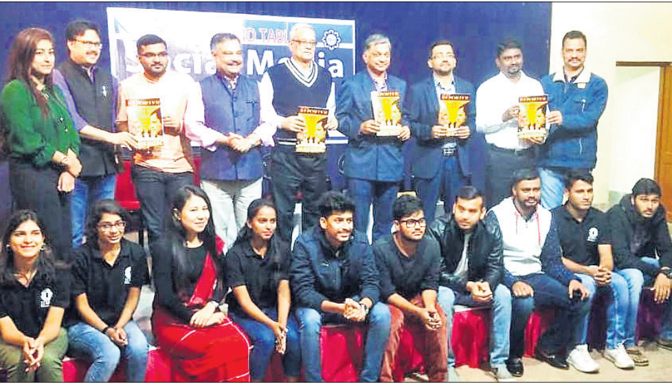
କାର୍ଯ୍ୟକ୍ରମରେ ଅତିଥି ଏବଂ ଛାତ୍ରାଛାତ୍ରୀମାନେ।