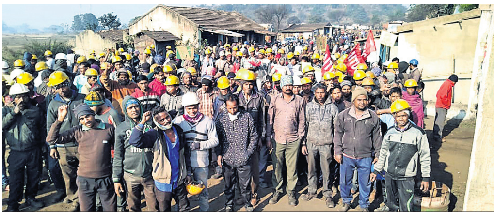
ଶ୍ରମିକମାନେ ଆନ୍ଦୋଳନ କରୁଛନ୍ତି।

ସଦର ଆନା ହଳଦୀଗୁଣାସ୍ଥିତ ଏମ୍.ଏସ୍.ସି. ଲୁହା ଓ ଲୁହାତ କାରଖାନାରେ ଶ୍ରମିକମାନେ କେତେକ ଶ୍ରମିକ କାର୍ଯ୍ୟବଦ୍ଧ ଆନ୍ଦୋଳନ କରିଛନ୍ତି।