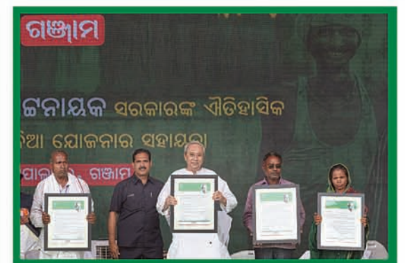
କାଳିଆ ଚାଷୀ ମହାସମାବେଶ, ଗୋପାଳପୁର, ଗଞ୍ଜାମ ୨୭ ଜାନୁଆରୀ