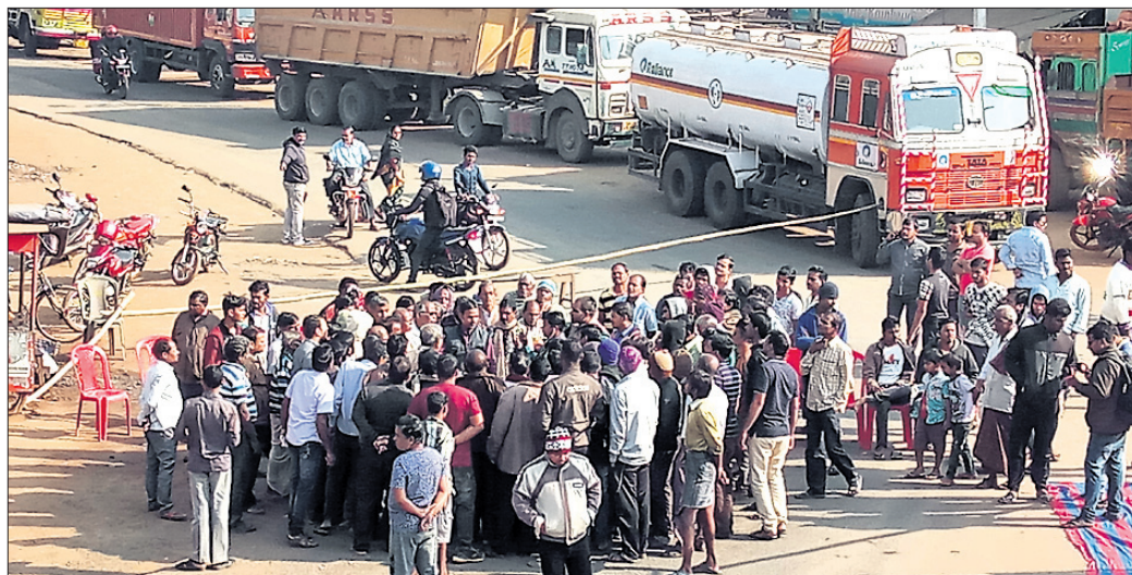
ରାସ୍ତାରୋକୋ ଯୋଗୁ ଭାରିଯାନ ଅଟକି ରହିଛି।

ବିପର୍ଯ୍ୟୟ ସ୍ୱାସ୍ଥ୍ୟସେବା ପ୍ରତିବାଦରେ ୧୨ ଯୁକ୍ତାୟୁ ଭୁବନ ବନ୍ଦ ଡାକରାକୁ ଦଳଗତ ନିର୍ବିଶେଷରେ ସବୁଆଡୁ ମିଳିତ ବିପୁଳ ସମର୍ଥନ। ବନ୍ଦ ପ୍ରଭାବରେ ସକାଳ