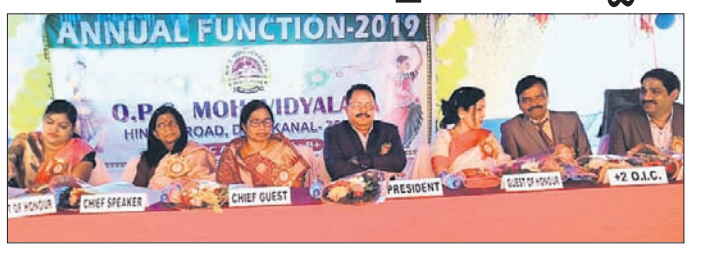
ବାର୍ଷିକ ଉତ୍ସବ ସମାବେଶରେ ଅତିଥିମାନେ।