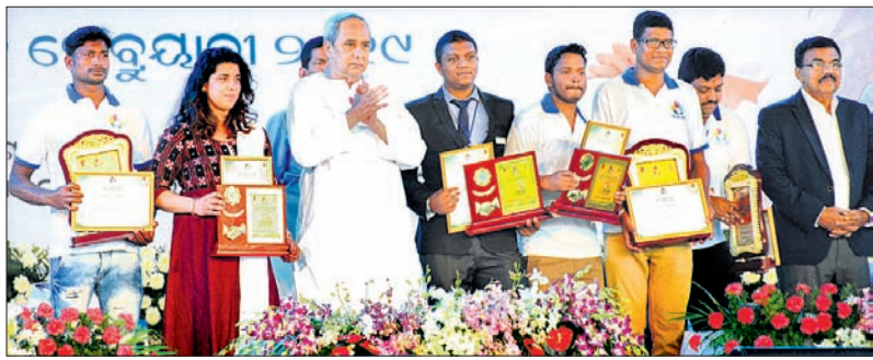
ସମ୍ବଲପୁର ବୀର ସୁଭେନ୍ଦ୍ର ସାଏ ଷ୍ଟାଡ଼ିୟମରେ ବିଜୁ ମୁଦ ସମାବେଶରେ ମୁଖ୍ୟମନ୍ତ୍ରୀ 'ପୁଂହିରୋ'କୁ ପୁରସ୍କୃତ କରୁଛନ୍ତି ।

ମନ୍ଦିର ଆଡ଼ିଆରେ ପହଞ୍ଚି କାର ଯୋଗେ ଯାଇ ସମଲେଇ ମନ୍ଦିର ନିକଟ ରିଭର ପାଖ ଛୁପର ଉଦ୍‌ଯାତନ କରିଥିଲେ । ଏହାପରେ ନେଲସନ ମଣ୍ଡେଲା ଛକ ନିକଟରେ ମହାନଦୀ ଉପରେ ୧୧୭.୨୨ କୋଟି ଟଙ୍କା ବ୍ୟୟରେ ନିର୍ମିତ (ଦେଉଳି.ମି.ମୁକ୍ତ ଲକ୍ଷ୍ମ) ଦ୍ୱିତୀୟ ସେତୁ ଉଦ୍‌ଯାତନ କରିଥିଲେ । ଶେଷରେ ବୀର ସୁଭେନ୍ଦ୍ର ସାଏ ଷ୍ଟାଡ଼ିୟମରେ ହାରାକୁଦରେ ରୋପଣେ ସମେତ ୧୯ଟି ପ୍ରକଳ୍ପର ଉଦ୍‌ଯାତନ କରିବା ସହ ୧୪ଟି ପ୍ରକଳ୍ପର ଶିଳାନିଧାୟ କରିଥିଲେ । ସେଠାରେ ମୁଦ ସମାବେଶ ପାଇଁ ବିଭିନ୍ନ ଅଞ୍ଚଳରୁ ମୁଦଗୋଷ୍ଠୀ