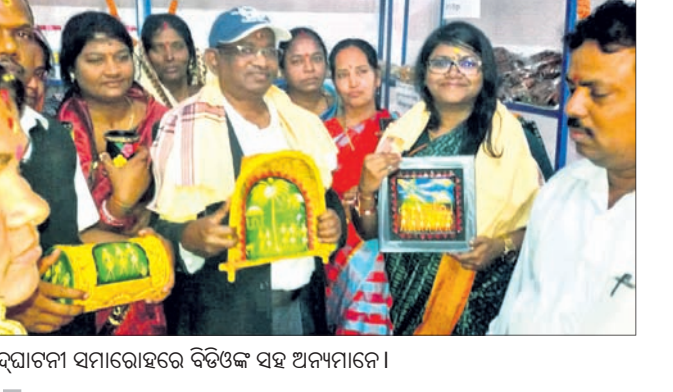
ଉଦ୍ଘାଟନା ସମାରୋହରେ ବିଡ଼ିଓଙ୍କ ସହ ଅନ୍ୟମାନେ।

ପୁଣ୍ୟାଳୟ କାର୍ଯ୍ୟକ୍ରମରେ ଅନ୍ଧାରରେ ଚଳୁଥିବା ଛାତ୍ରୀଙ୍କ ଭବିଷ୍ୟତ ପ୍ରତି ଧ୍ୟାନ ଦେବାକୁ ଆମକୁ ଆବେଶ ହେଉଛି।