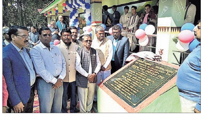
ସୁବିଧା କେନ୍ଦ୍ରର ଉଦ୍ଘାଟନ କରାଯାଇଛି।

ବହୁ ପ୍ରତିଷ୍ଠିତ ରାଜ୍ୟ ପ୍ରସିଦ୍ଧ ସାମଗ୍ରୀଗୁଣା ଜଳପ୍ରପାତ ପରିସରରେ ନିର୍ମାଣ ହୋଇଥିବା ବୋଟିଂ ପାଇଁହୁଏ, ଆଦିବାସୀ ସଂଗ୍ରହାଳୟ, ଯୌତକକ କେନ୍ଦ୍ର ସୁବିଧା କେନ୍ଦ୍ର ଓ ରେମ ଘାଟିନକୁ ବିଦ୍ୟାଳୟ ଓ ରଣଶିଖା ମନ୍ଦିର ବନ୍ଦିନାମାୟା ପାତ୍ର ଶ୍ରଦ୍ଧାଧାରଣ କରାଯାଇଛି।