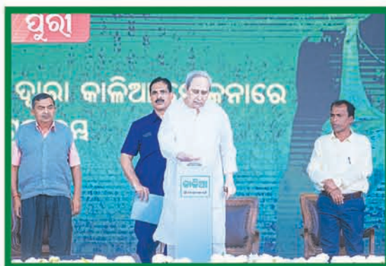
କାଳିଆ ଚାଷୀ ମହାସମାବେଶ, ମାଳତୀପାଟଣାପୁର ପୁରୀ ୨୫ ଜାନୁଆରୀ