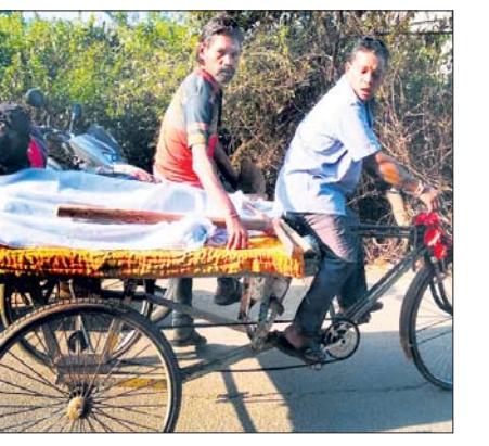
ଫିଲ୍ମରେ ବୁଝାହେଲା ମୃତଦେହ

ପୁଲିସ୍‌ମାନଙ୍କୁ ଏକ ମୃତଦେହ ପାଇଁ ଦିଆଯାଇଛି। ଫିଲ୍ମରେ ବୁଝାହେଲା ମୃତଦେହ ପାଇଁ ଦିଆଯାଇଛି। ଫିଲ୍ମରେ ବୁଝାହେଲା ମୃତଦେହ ପାଇଁ ଦିଆଯାଇଛି।