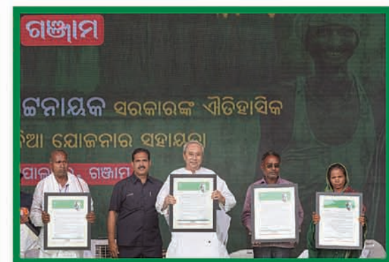
କାଳିଆ ଚାଷୀ ମହାସମାବେଶ, ଗୋପାଳପୁର, ଗଞ୍ଜାମ ୨୭ ଜାନୁଆରୀ