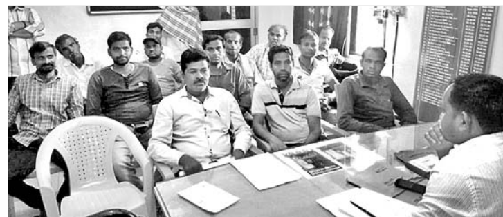
ବିତ୍ତ ଓ ଡିପାର୍ଟମେଣ୍ଟରେ ଗାଷ୍ଟାମାନେ ଅଭିଯୋଗ କରୁଛନ୍ତି।

ବୁରୁଡ଼ା, ୫.୧୨ (ଡି.ଏନ.ଏ.): ବୃତ୍ତୁଡ଼ା ବ୍ଲକ୍ ଖୋଳଖାଳି ଓ ବିରଞ୍ଚୁରର ଧାନକ୍ରୟରେ ଅବହେଳା ପାଇଁ ମଙ୍ଗଳବାର ଗାଷ୍ଟାମାନେ ସ୍ଥାନୀୟ ବିତ୍ତ ଓ ଡିପାର୍ଟମେଣ୍ଟର ନିକଟରେ ଅଭିଯୋଗ କରିଛନ୍ତି।