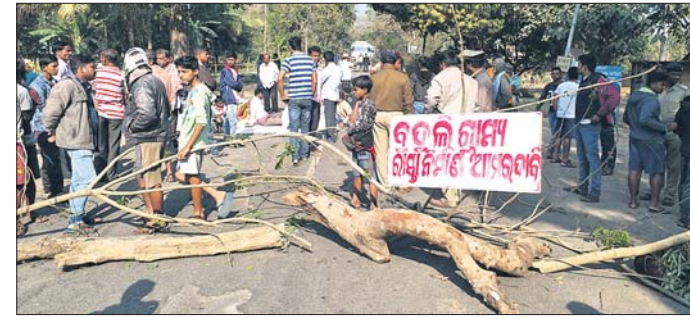
ଗ୍ରାମବାସୀ ରାସ୍ତାରୋକୋ କରିଛନ୍ତି।