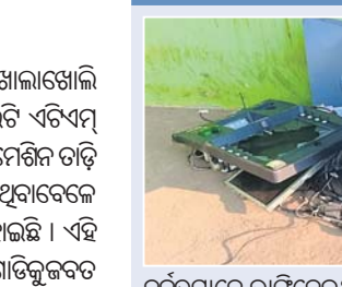
ଦୁର୍ବୃତ୍ତମାନେ ଭାଙ୍ଗିଦେଇଥିବା ଏଟିଏମ୍ ।

କଳାହାଣ୍ଡି ଜିଲ୍ଲା ଧର୍ମଗଡ଼ ସହରରେ ଖୋଲାଖୋଲି ପୋଲିସକୁ ଚ୍ୟାଲେଞ୍ଜ ଦେଇ ଏକକାଳୀନ ଦୁଇଟି ଏଟିଏମ୍ ଲୁଟ ଉଦ୍ୟମ ଘଟଣା ଘଟିଛି । ଆଇଓବି ଏଟିଏମ୍ ମେଶିନ ଚାଡ଼ି ଟଙ୍କା ନେବାରେ ଦୁର୍ବୃତ୍ତମାନେ ସଫଳ ହୋଇଥିବାବେଳେ ଏଫ୍‌ସିଆଇ ଏଟିଏମ୍ ଲୁଟ ଯୋଜନା ବିଫଳ ହୋଇଛି । ଏହି ଘଟଣାରେ ପୋଲିସ ଲୁଟରେ ବ୍ୟବହୃତ ପିକଅପ୍‌ଗାଡ଼ିକୁ ଜବତ କରିବା ସହ ୨ ଜଣଙ୍କୁ ଅଟକ ରଖି ପଚରାଉଚରା କରୁଛି । ସୂଚନା ଅନୁସାରେ ସୋମବାର ବିଳମ୍ବିତ ରାତିରେ ଦୁର୍ବୃତ୍ତମାନେ ପ୍ରଥମେ ଧର୍ମଗଡ଼ ସହର ନିକଟସ୍ଥ ଗୋଡ଼ାଞ୍ଜା ଗାରି ଫେଡ଼ିକେଶନ ବୋକାଳକୁ ଯାଇ ଏକ ଗ୍ୟାସ କଟର ଚୋରି କରିଥିଲେ । ପରେ ତାକୁ ପିକଅପ୍ ଗାଡ଼ିରେ ଆଣି