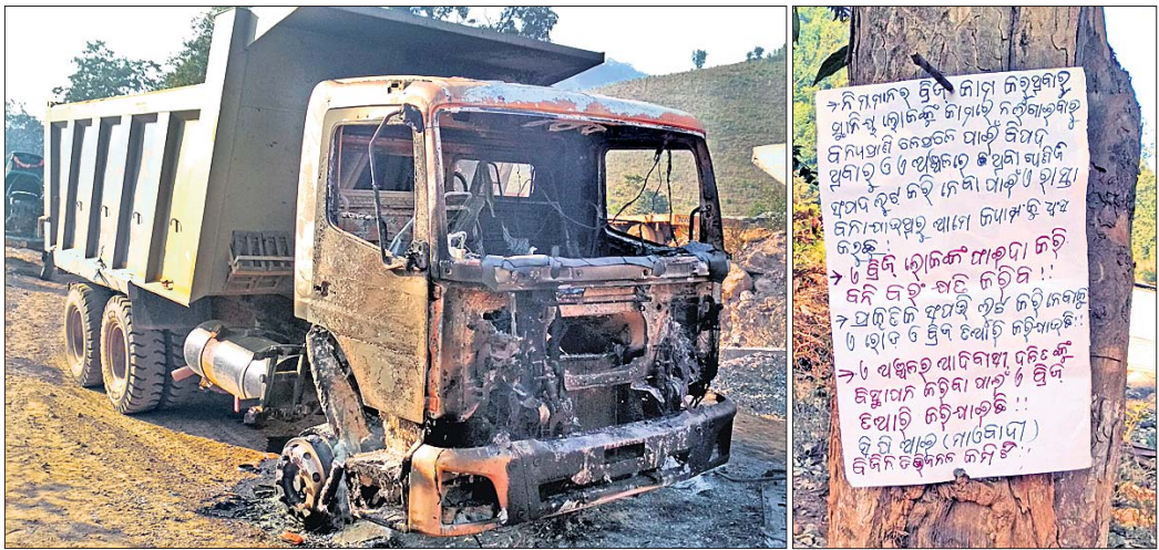
ମାଓବାଦୀମାନେ ଘୋଡ଼ିଦେଇଥିବା ଗାଡ଼ି।

କନ୍ଧମାଳ ଜିଲ୍ଲାରେ ମାଓବାଦୀମାନେ କିଛିଦିନ ହେଲା ଅଧିକ ସକ୍ରିୟ ହୋଇଛନ୍ତି। ଜିଲ୍ଲାର ବିଭିନ୍ନ ସ୍ଥାନରେ ଗୋଟିଏ ପରେ ଗୋଟିଏ କାଣ୍ଡ ଘଟାଇ ସେମାନଙ୍କ ଉପସ୍ଥିତି ଜାହିର କରୁଛନ୍ତି। ସୋମବାର ରାତିରେ ବୁଢ଼ିବନ୍ଧୁ ନିକଟରେ ଘଟଣା ଘଟିଥିଲା। ଘଟଣା ସମ୍ବନ୍ଧରେ କେହି, ମିଶ୍ର ମେଣ୍ଡିଆ ଓ ୪ ଗାଡ଼ିକୁ ସେମାନେ ଘୋଡ଼ିଦେଇଛନ୍ତି। ଏଥିସହ ସେଠାରେ ହାତଲେଖା ପୋଷ୍ଟର ମଧ୍ୟ ଛାଡ଼ିଯାଇଛନ୍ତି। ଉକ୍ତ ପୋଷ୍ଟରରେ ନିମ୍ନୋକ୍ତ ବ୍ରାହ୍ମଣ କାମରେ ନିୟୋଜିତ କରାଯାଇ ନ ଥିବା, ରାସ୍ତା ଯୋଗୁ ବନ୍ୟପ୍ରାଣୀ ଚଳପ୍ରଚଳରେ ଅଧିକାରୀ ହେବା, ପ୍ରାକୃତିକ ସମ୍ପଦ ଲୁଟ କରିବାକୁ ବ୍ରାହ୍ମଣ ହେଉଛି ବୋଲି ଦର୍ଶାଯାଇଛି। ଏଥିସହ ଆଦିବାସୀ ଓ ଦଳିତଙ୍କୁ ବିକ୍ଷାପୀନ କରିବାକୁ ବ୍ରାହ୍ମଣ ନିର୍ମାଣ ଚାଲିଛି ବୋଲି ଉଲ୍ଲେଖ ରହିଛି। ଶେଷରେ ବି.ଜି.ନ ଡିଭିଜନ କମିଟି ସି.ପି.ଆଇ(ମାଓବାଦୀ) ଲେଖା ହୋଇଛି। ବେଳଘର ଠାକୁ