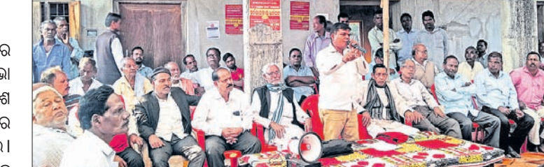
ସମାବେଶରେ ଉପସ୍ଥିତ କୃଷକ ମହାସଭାର କର୍ମକର୍ତ୍ତା ଓ ଗାଷ୍ଟି। କରୁଛନ୍ତି। କିନ୍ତୁ ବେଆଇନ୍ ଭାବେ ବନ ବିଭାଗ ଗାଷ୍ଟିଙ୍କ ଶହ ଶହ ଏକର ଜମିକୁ ନିଜ ଦଖଲକୁ ନେଇଯାଇଛି।

କୁଜଙ୍ଗସ୍ଥିତ ଲୋକନାଥ ଭବନ ପରିସରରେ ମଙ୍ଗଳବାର ମା'ରାମଚଣ୍ଡୀ କୃଷକ ମହାସଭା ପକ୍ଷରୁ ଏକ ବିଶାଳ ଗାଷ୍ଟି ସମାବେଶ ହୋଇଛି।