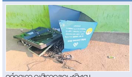
ଦୁର୍ଭୃତମାନେ ଭାଙ୍ଗିଦେଇଥିବା ଏଟିଏମ୍।

କଳାହାଣ୍ଡି ଜିଲ୍ଲା ଧର୍ମଗଡ଼ ସହରରେ ଖୋଲାଖୋଲି ପୋଲିସକୁ ଚ୍ୟାଲେଞ୍ଜ ଦେଇ ଏକକାଳୀନ ଦୁଇଟି ଏଟିଏମ୍ ଲୁଟ ଉଦ୍ୟମ ଘଟଣା ଘଟିଛି। ଆଇଓବି ଏଟିଏମ୍ ମେଶିନ ଚାଡ଼ି ଟଙ୍କା ନେବାରେ ଦୁର୍ଭୃତମାନେ ସଫଳ ହୋଇଥିବାବେଳେ ଏଫ୍‌ସିଆଇ ଏଟିଏମ୍ ଲୁଟ ଯୋଜନା ବିଫଳ ହୋଇଛି। ଏହି ଘଟଣାରେ ପୋଲିସ ଲୁଟରେ ବ୍ୟବହୃତ ପିକଅପ୍‌ଗାଡ଼ିକୁ ଜବତ କରିବା ସହ ୨ ଜଣଙ୍କୁ ଅଟକ ରଖି ପଚରାଉଚରା କରୁଛି। ସୂଚନା ଅନୁସାରେ ସୋମବାର ବିଳମ୍ବିତ ରାତିରେ ଦୁର୍ଭୃତମାନେ ପ୍ରଥମେ ଧର୍ମଗଡ଼ ସହର ନିକଟସ୍ଥ ଗୋଡ଼ାଞ୍ଜା ଗାରି ଫେଡ଼ିକେଶନ ବୋକାଳକୁ ଯାଇ ଏକ ଗ୍ୟାସ କଟର ଚୋରି କରିଥିଲେ। ପରେ ତାକୁ ପିକଅପ୍ ଗାଡ଼ିରେ ଆଣି