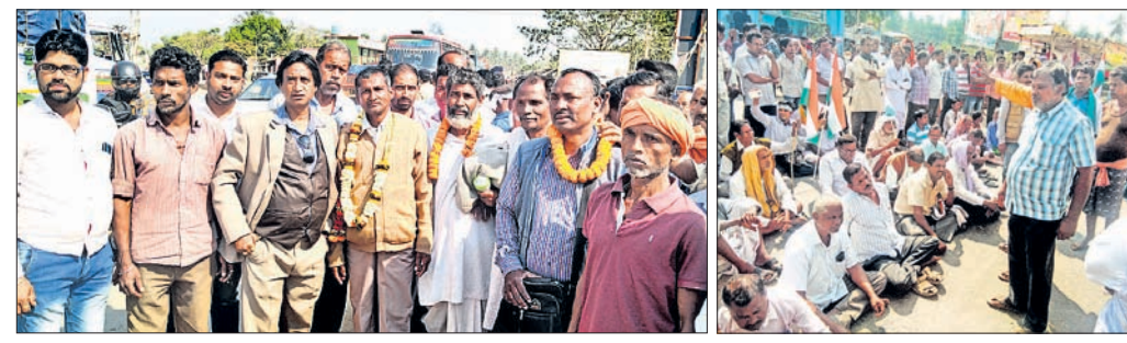
ରଘୁନାଥପୁର ଓ ବାଲିକୁଦାରେ ନବନିର୍ମାଣ କୃଷକ ସଂଗଠନ ପକ୍ଷରୁ ରାସ୍ତାପ୍ରସାରଣ ଆୟୋଜନରେ ସାମିଲ ହୋଇଥିବା ଗାଷ୍ଟି।

ନବ ନିର୍ମାଣ କୃଷକ ସଙ୍ଗଠନ ପକ୍ଷରୁ ରଘୁନାଥପୁର ଭୁବନେଶ୍ୱରରେ ରାସ୍ତାପ୍ରସାରଣ ଗାଷ୍ଟି ସମାବେଶ କରିବାକୁ ଡାକରା ଦିଆଯାଇଥିଲା। ଏଥିପାଇଁ ବିଭିନ୍ନ ବ୍ଲକରେ ଲୋକସଭା ପ୍ରସ୍ତୁତି ଚାଲିଥିଲା।