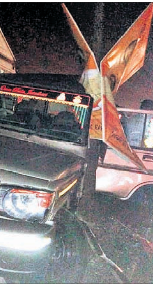
ଦୁର୍ଘଟଗ୍ରସ୍ତ ବୁଲ ଗାଡ଼ି।

ଜଗତ୍ସିଂହପୁର ଜିଲ୍ଲା ଜଳ ରବିନାରାୟଣ ମିଶ୍ର ମଙ୍ଗଳବାର ମହାହରତ ଉତ୍ତୋଳ ଆଦି କେବଳପର୍ଯ୍ୟନ୍ତ କୋର୍ଟ ପ୍ରତିଷ୍ଠା ପାଇଁ ଝଙ୍କଟ ସାରଳା ମହିଳା ମହାବିଦ୍ୟାଳୟର ଗୃହ ମନାମତି କାର୍ଯ୍ୟ ଦୋରାଣ କରିଛନ୍ତି।