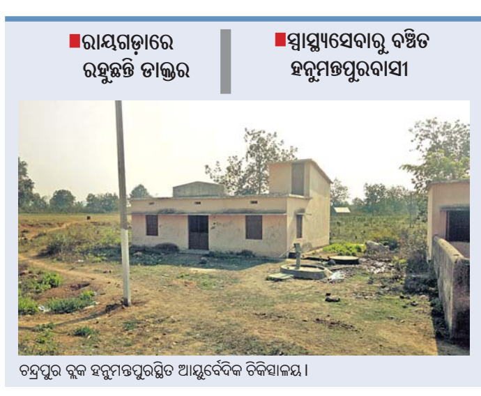
ଚନ୍ଦ୍ରପୁର ବ୍ଲକ୍ ହନୁମନ୍ତପୁରରେ ଆୟୁର୍ବେଦିକ ଚିକିତ୍ସାଳୟ।