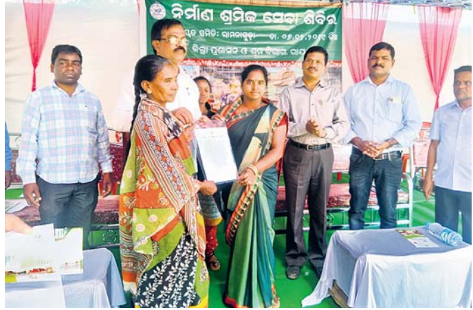
ଜଣେ ହିତାଧିକାରୀଙ୍କୁ ଅତିଥି ସହାୟତା ପ୍ରଦାନ କରୁଛନ୍ତି।

ରାମନାଗୁଡ଼ା, ୬/୨ (ଡି.ଏନ୍.ଏ.) ଉକ୍ତ ନିର୍ମାଣ ଶ୍ରମିକ ଓ ତାଙ୍କ ପରିବାରକୁ ଶିକ୍ଷା ସହାୟତା, ମୃତ୍ୟୁକାଳୀନ ସହାୟତା, ଗୃହ ନିର୍ମାଣ ଏବଂ ଚିକିତ୍ସା ବିଦ୍ୟାଳୟ ପରିସରରୁ ଚଳିତ ମଣ୍ଡପରେ ରୁକ୍ଷପୁର ନିର୍ମାଣ ଶ୍ରମିକ ସେବା ଶିବିର ଅନୁଷ୍ଠିତ ହୋଇଛି। ୧୮ରୁ ଉର୍ଦ୍ଧ୍ୱ ଏବଂ ୬୦ରୁ କମ୍ ବ୍ୟକ୍ତି ଏହି ଯୋଜନାରେ ସାମିଲ ହୋଇପାରିବେ। ଏକ ବର୍ଷ ଛିତରେ ୧୦ ଦିନ କାମ କରିଥିବା ବ୍ୟକ୍ତି ନିଜ ନାମ ପଞ୍ଜୀକରଣ କରିପାରିବେ।