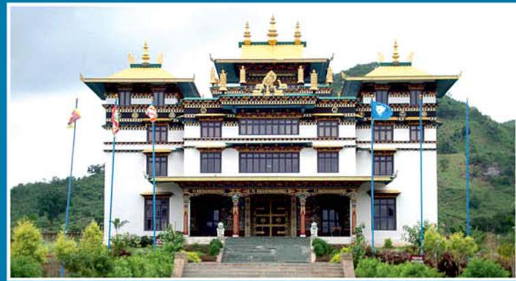
ଗୁରୁ ପଦ୍ମସମ୍ଭବଙ୍କ ପ୍ରତିମୂର୍ତ୍ତି ଅନାବରଣ ଏବଂ ଉଦ୍ଘୋଷନ