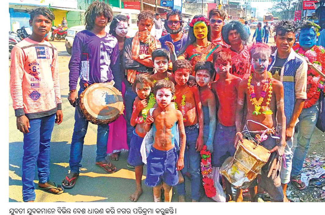
ସୁବତ୍ତା ସୁବତ୍ତାମାନେ ବିଭିନ୍ନ ବେଶ ଧାରଣ କରି ନଗର ପରିକ୍ରମା କରୁଛନ୍ତି।

ରାୟଗଡ଼ା ଜିଲ୍ଲା ପୁନିଗୁଡ଼ା ସଦର ମହକୁମା ଅଧୀନ ରାଜାବଗଡ଼ା ସାହି ବାସିନ୍ଦାଙ୍କ ପକ୍ଷରୁ ରୁଧିରା ଧୂମପାନେ କାନ୍ଥୁଳ ସର୍ବ ପାଳନ କରାଯାଇଛି। ପ୍ରକୃଷ୍ଟରେ ରାଜିନୀତି ଅନୁଯାୟୀ ଦେବାଳ ନିକଟରେ ପୂଜାର୍ଚ୍ଚନା କରାଯାଇଥିଲା। ପରେ ସାହିର ସୁବତ୍ତାପୁରମାନେ ବିଭିନ୍ନ ବେଶ ଧାରଣ କରି ପାରମ୍ପରିକ ବାଦ୍ୟ ବଜାଇ ସହର ପରିକ୍ରମା କରିଥିଲେ। ଏହି ପର୍ବରେ ନୂତନଭାବେ ଅମଳ ହୋଇଥିବା କାନ୍ଥୁଳକୁ ଲକ୍ଷ୍ମୀ ଦେବୀଙ୍କ ପାଖରେ ସମର୍ପଣ କରାଯାଇଥିଲା। ଦିନ ତମାମ୍ ସାହିରେ ପୂଜାର୍ଚ୍ଚନା ହେବା ସହ ବୁଲୁଥିବା ଧର୍ମ ସାଂସ୍କୃତିକ କାର୍ଯ୍ୟକ୍ରମ କରାଯିବ। ଏହି ପୂଜା କଲେ ଭଲ ଫସଲ ଅମଳ ହେବା ସହ ପରିବାରରେ ଶାନ୍ତି ବଜାୟ ରୁହେ ବୋଲି ବିଶ୍ୱାସ ରହିଛି।